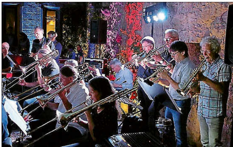
JAO in Aktion.

Natürlich sind auch wieder eine Reihe hervorragender Solisten in der Band,