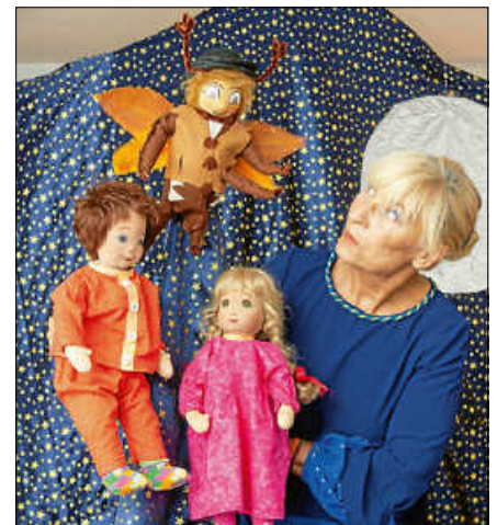
Peterchens Mondfahrt

Aufgrund der derzeitigen Situation gibt es bei allen Veranstaltungen reservierte nummerierte Sitzplätze. Daher ist es leider auch nicht möglich, Kinderreihen anzubieten. Die Karten sind personalisiert, ein Weiterverkauf nicht gestattet. Alle Veranstaltungen finden im großen Saal der Stadthalle Gernsbach statt, dadurch kann die Entfernung zur Bühne größer als gewohnt sein. Bitte bringen