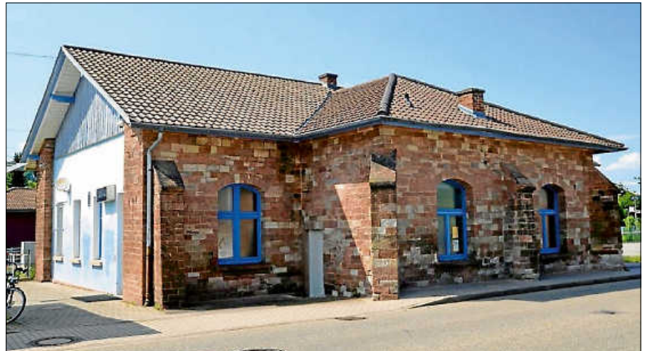
Die städtische Trägerschaft des Kinder- und Jugendhauses endet nach 25 Jahren.