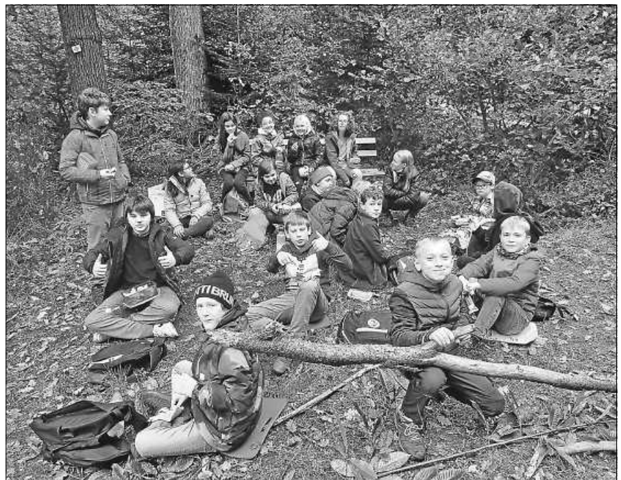
Einen spannenden und abwechslungsreichen Unterrichtstag erlebte die Klasse 6c im Gernsbacher Wald.

Ein abwechslungsreiches und anregendes Programm rund um das Thema Baum und dessen Habitat wurde geboten: Was sind die Stockwerke des Waldes? Welche Bewohner sind dort zu finden? Wie ist ein Baum aufgebaut? Passend dazu konnte jedes Kind selbst tätig werden und aus Waldmaterialien einen eigenen Baum darstellen. Auch das Transportsystem des Organismus Baum, die Aufgabe der Laubbäume im Ökosystem sowie die Unterscheidungsmerkmale zwischen Laub- und Nadelbäumen wurden demonstriert. Zudem