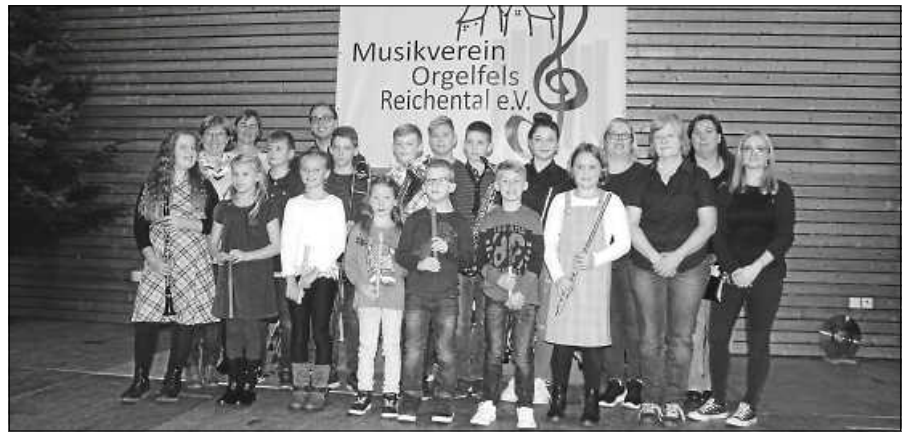
Jugendausbildung im Verein