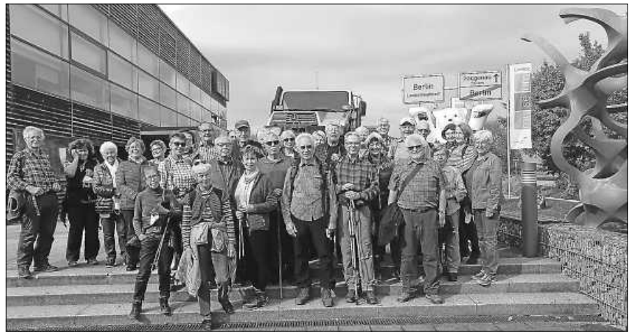
Nicht Berlin war Ziel der Mittwochswanderer, sondern das Gaggenauer Unimog-Museum.

Hierzu sind alle Mitglieder und Ehrenmitglieder herzlich eingeladen.