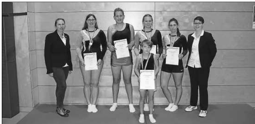
Die Kampfrichterinnen und Aktiven.