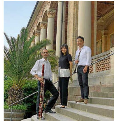
Das Jolivet-Trio in Baden-Baden

Die Kulturgemeinde beabsichtigt, das laut Corona-Verordnung seit 15. Oktober zulässige „2-G-Optionsmodell“ anzuwenden. Danach ist der Zutritt nur immunisierten (also geimpften oder genesenen) Besucherinnen und Besuchern gestattet, die Maskenpflicht entfällt dann (Basisstufe). Die Erhebung der Kontaktdaten (auch über Luca-App möglich) ist gleichwohl erforderlich.