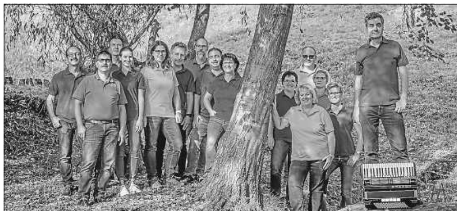
Endlich wieder gemeinsam musizieren.

Am Sonntag, den 17.10., fand der Präsi-Cup in Rastatt statt. Dabei treffen sich