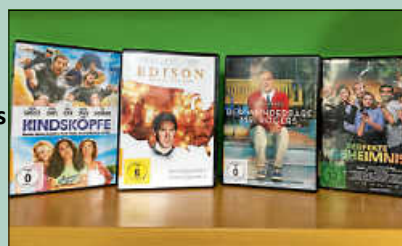
Aktuelle Filme in unserem DVD-Regal.