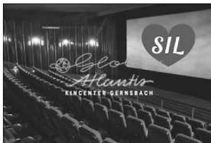
SIL-Generalversammlung im Kinocenter Gernsbach.