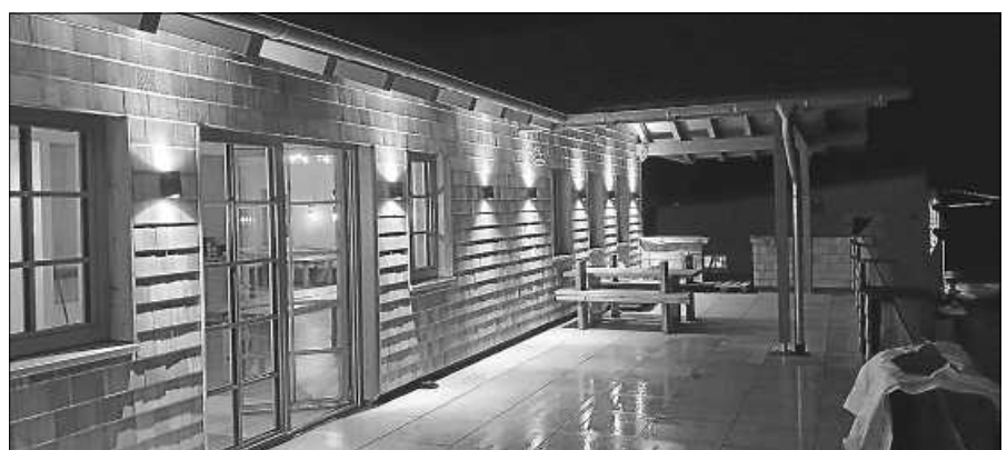
Außensicht Auwiesenhütte Terrasse bei Nacht.