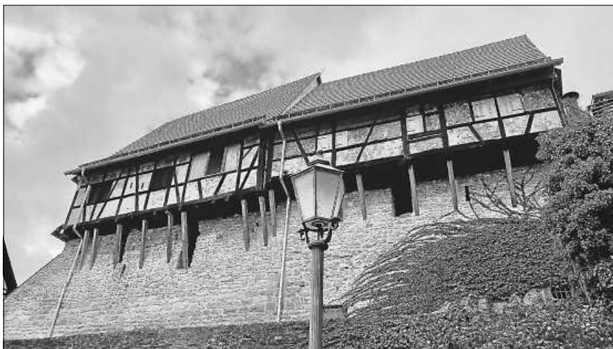
Herbstlich auf der alten Stadtmauer.

Deutschlandweit nehmen am Grundschulaktionstag rund 200.000 Kinder aus über 2.200 Grundschulen teil, in Baden-Württemberg, wo der Aktionstag mittlerweile zum 12. Mal durchgeführt wird, haben sich in diesem Jahr etwa 30.000 Schülerinnen und Schüler aus 550 Schulen angemeldet. Wie seit Jahren schon beteiligte sich auch die Klingebachschule Forbach zusammen mit der HSG Murg am Aktionstag und so tauschten dieses Jahr 31 Kinder der 2. Klassen an diesem Tag Stift und Papier gegen Turnschuhe und Handball. Organisiert und durchgeführt wurde das Ganze durch ehrenamtliche Helfer und Handballer der HSG Murg. Los ging es für die Kinder mit einem kleinen Film, bei dem die grundlegenden Regeln des Handballspiels gezeigt wurden. Anschließend ging es dann in die Sporthalle. Dort konnten sich die kleinen Sportler dann austoben und den tollen Sport „Handball“ selbst kennenlernen. Nach einem gemeinsamen Warmlaufen wurden die Kinder in Kleingruppen aufgeteilt. Neu war, dass die Kinder in diesem Jahr mit dem Hanniball-Pass