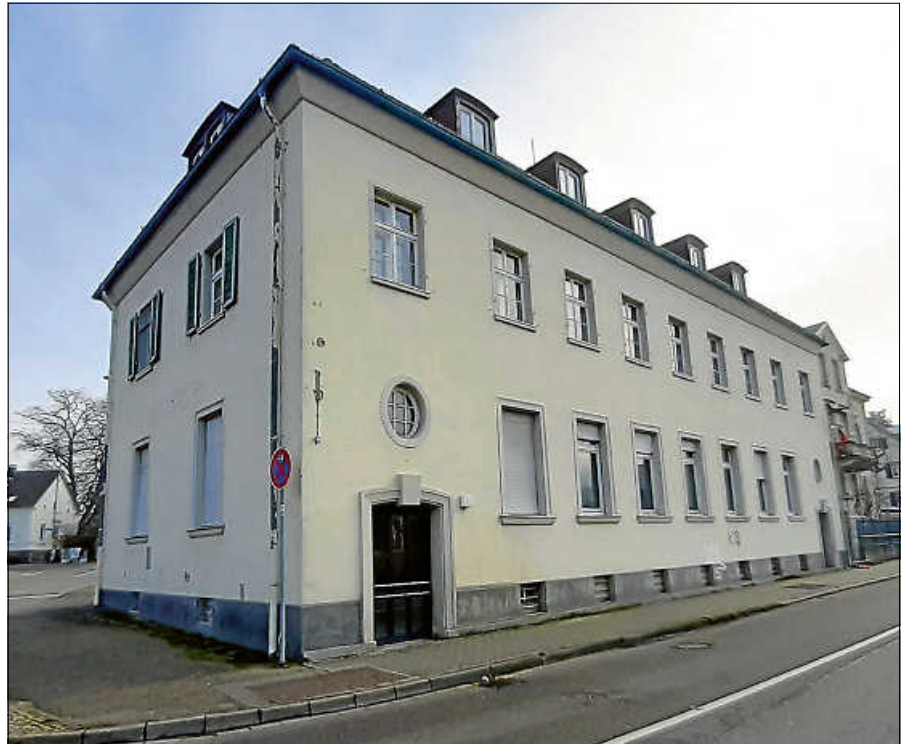
Außenansicht des ehemaligen Postgebäudes an der Bleichstraße.

„Der Umbau der ehemaligen Post hat im Vergleich zu anderen Alternativen mehrere Vorteile und ist deshalb vorrangig umzusetzen. Erstens, kann die Maßnahme umgehend in Angriff genommen werden. Die Immobilie befindet sich in kommunaler Hand, erste planerische Schritte wurden unternommen, Zuschussanträge wurden gestellt, die baurechtliche Umnutzung kann vorbereitet werden. Zweitens ist die Maßnahme vergleichsweise kostengünstig. Der Grunderwerb der Immobilie hat sich bereits durch die Erträge aus Mietzahlungen der vergangenen Jahre bezahlt gemacht. Die Kosten sind vergleichbar mit der einer Containerunterbringung, allerdings mit dem Vorteil der wesentlich höheren Unterbringungsqualität. Zudem liegt das Gebäude zentral für jede Form der Nutzung und kann nach Beendigung der Flüchtlingsunterbrin-