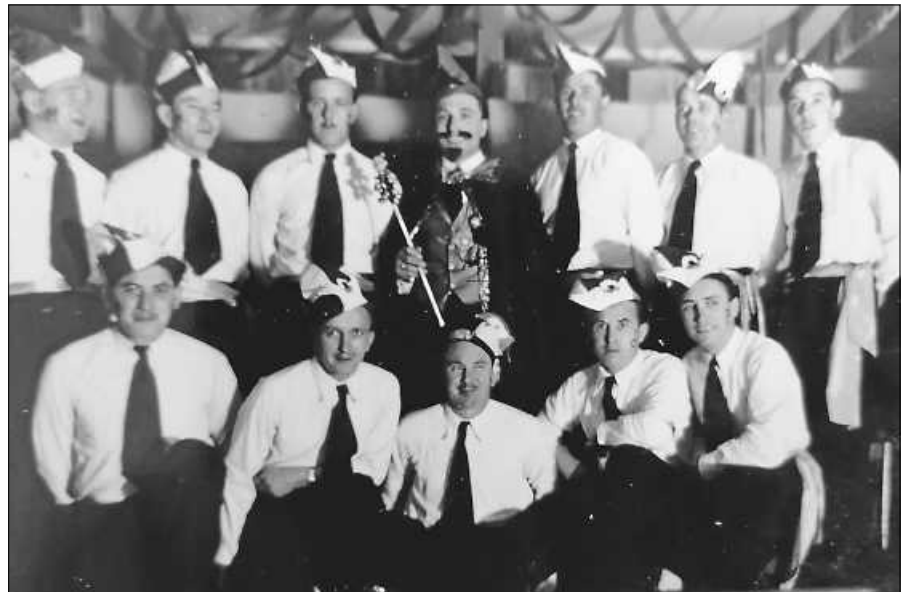
Bild aus dem Schriftführerbuch des damaligen Faschnachtsvereins.