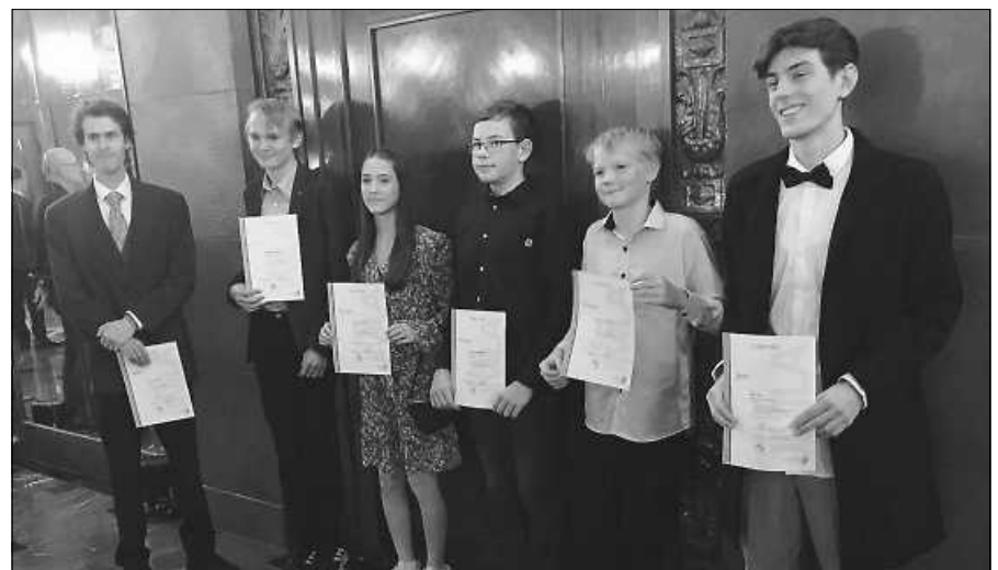
JMLA in Bronze, Silber und Gold für den Musikverein Hilpertsau.

Wir freuen uns auf einen schönen Nachmittag im Kreise der Dorfgemeinschaft.