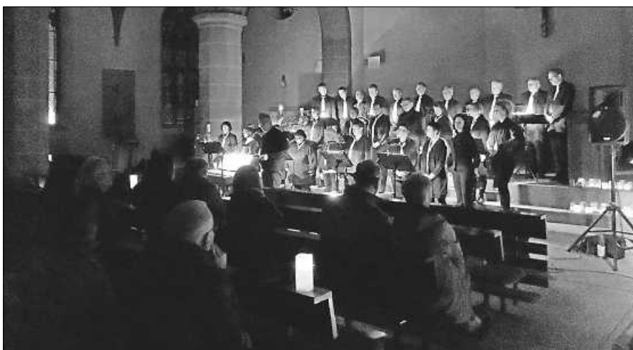
Adventskonzert Natale mit Salt o vocale.

Die bestellten Bäume und Sträucher können am Samstag, 26.11.2022, von 10:00 Uhr bis 13:00 Uhr bei Martin Groß im Sandweg 3 in Gernsbach bezahlt und abgeholt werden.