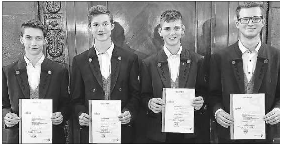
JMLA in Gold und Silber bei Verleihung.

Durch die gute Vorbereitung haben auch in diesem Jahr wieder drei Jugendliche des Musikvereins Orgelfels Reichental mit Erfolg an der Prüfung für das