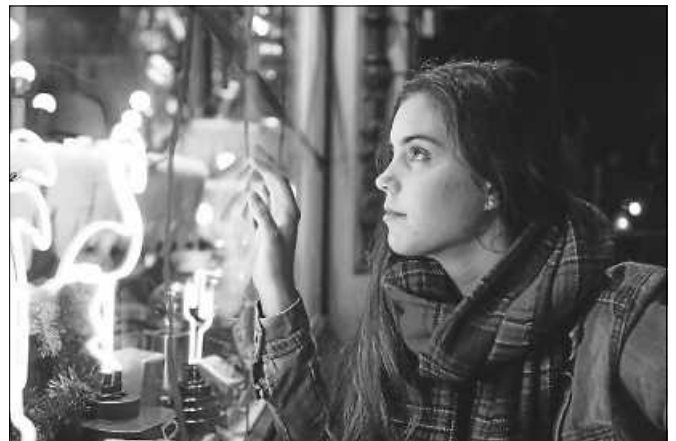
Lokal einkaufen.

Gerade in der aktuellen Zeit ist es wichtig, die lokalen Geschäfte und Gastronomen vor Ort zu unterstützen. Lokal einkaufen lohnt sich für alle: Investitionen in die eigene Region tragen dazu bei, das lebendige und attraktive Stadtbild und das dazugehörige Kulturgut zu erhalten. Der Lieblingsshop vor Ort punktet mit kompetenter und persönlicher Beratung. Zusätzlich fördern Einheimische mit dem Einkauf in Gernsbach aktiv den Klimaschutz, denn lokal einkaufen bedeutet, nachhaltig zu konsumieren und den ökologischen Fußabdruck zu verkleinern - ein schöner Ansatz für die besinnliche Adventszeit. Unterstützt und finanziert wurde die Aktion auch vom Gewerbeverein Gernsbach sowie vom Online-Marktplatz www.gernsbacher-schaufenster.de . ■