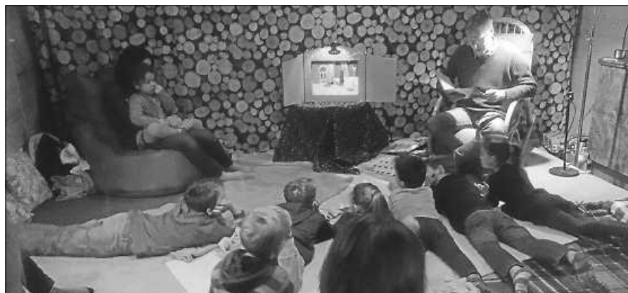
Gespannt lauschen die Kinder den Geschichten.

Die Anmeldungen erfolgen durch Überweisung auf das Konto des SV Staufenberg. IBAN DE56 6655 0070 0060 0112 51 Spk. Ra-Gernsbach. Rückfragen, Info und Kontaktdaten bitte an K. Strobel Handy / WhatsApp 01520 703 5651