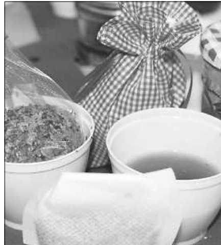
Gemeinsam werden im Kurs kleine Geschenke aus Kräutern hergestellt.

Schmeiser (walter.schmeiser@online.de oder Tel. 07224 50837) wird bis Montag, 28. November, gebeten. Mitzubringen sind: Tasse, Küchenmesser, Schneidebrett, kleines Schraubglas. Kosten: 20 Euro für Nichtmitglieder, 15 Euro für Vereinsmitglieder. Die Teilnahmegebühr beinhaltet bereits alle anfallenden Materialkosten.