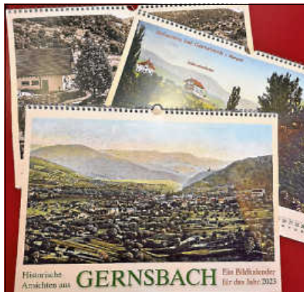
Historischer Kalender 2023.

Der Historische Kalender 2023, erhältlich für 15 Euro, zeigt historische Ansichten aus Gernsbach und den Ortsteilen. Die aus dem Fundus des Stadtarchivs stammenden Aufnahmen nehmen die Betrachter mit auf eine nostalgische Zeitreise.