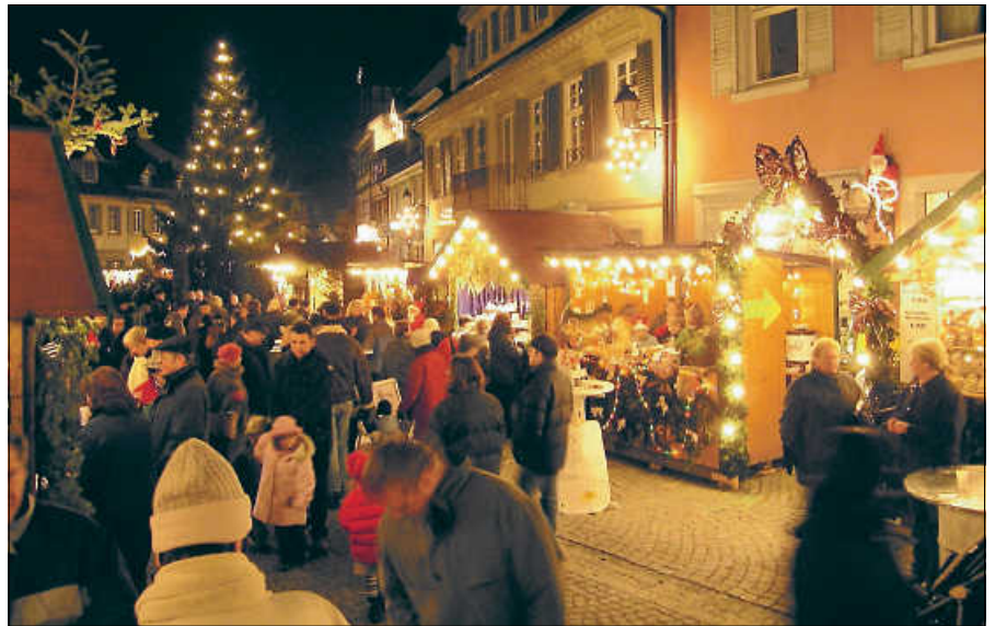
Auf dem Gernsbacher Weihnachtsmarkt.

Am Samstag beginnt der Markt um 14 Uhr. Verschiedene Gruppen und Vereine