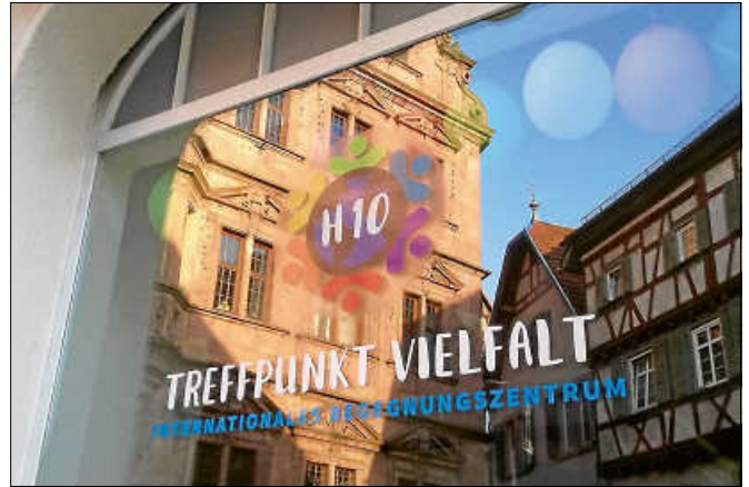
Der neue Kurs findet im H10 am Stadtbuckel statt.

Der Kurs besteht aus 34 Stunden, die sich auf mehrere Wochen verteilen. Teilnehmen kann man an bis zu drei Kursen hintereinander; der Kurs ist kostenlos. Teilnahmeberechtigt sind Männer mit Migrationshintergrund, Geflüchtete mit