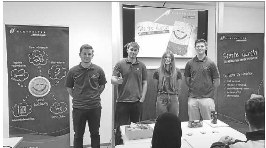
Der Nachwuchs der Firma Glatfelter stellt sich vor.

Von 14.00 bis 15.30 Uhr durften wir die Polizei, die Murgtalwerkstätten, Daimler, Glatfelter, Kronimus, Kohlbecker, die EnBW sowie Elter Orthopädietechnik willkommen heißen. In kurzen 25-minütigen Inputvorträgen stellten sich die Betriebe bzw. Institutionen vor und zeigten unter anderem vor Ort, welche Produkte sie täglich herstellen. Auch wichtige Aspekte zum Thema Bewerbung und die Fragen der Schülerinnen und Schüler wurden besprochen. Der Infonachmittag kam sowohl auf