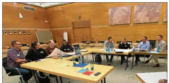
Der gemeinsame Dialog war wichtig.