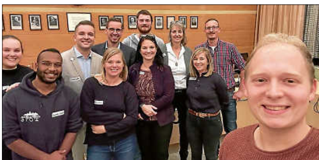
Workshop im Gernsbacher Rathaus.