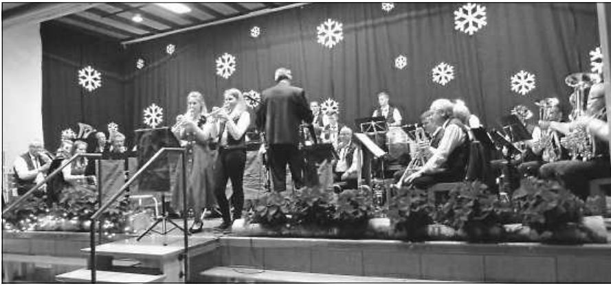
Festliche Stimmung und musikalische Leckerbissen erwarten Sie beim Adventskonzert