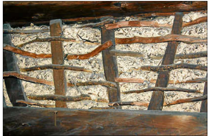
Bei den Führungen durch die Zehntscheuern werden die Techniken des alten Bauhandwerks sichtbar.

Das weitere Veranstaltungsprogramm in den Zehntscheuern für das Jahr 2022 folgt in Kürze. ■