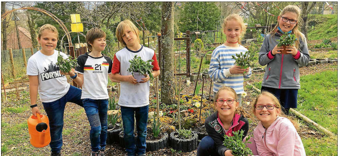
Die Garten AG.