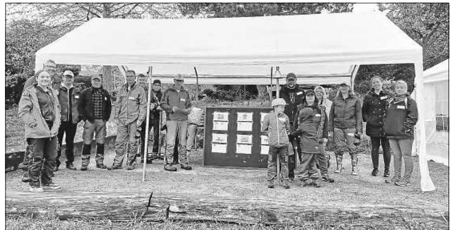
Kurz vor dem Startschuss.

Am Samstag, den 14. Mai 2022, findet in der Turnhalle in Reichental um 19.00 Uhr die diesjährige Jahreshauptversammlung statt. Alle Mitglieder, Ehrenmitglieder und Freunde des Vereins sind