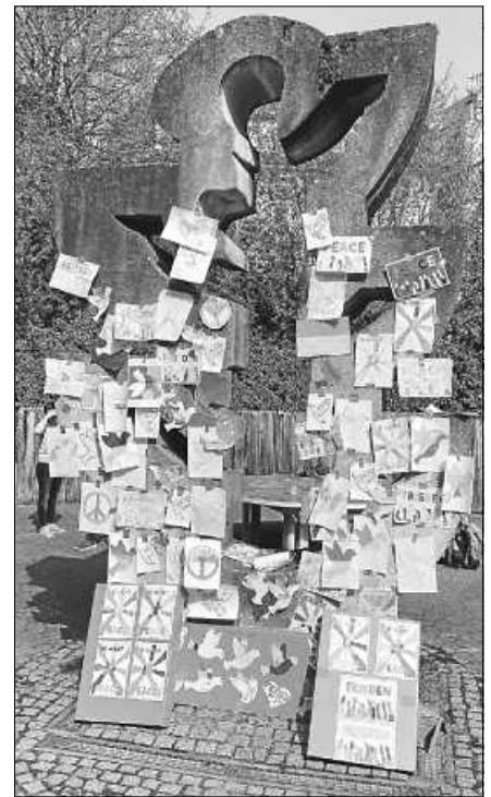
Die Friedensbotschaften der RSG.

Die Friedensgrüße schmücken nun das gesamte Schulhaus und werden bis zum Ende des Schuljahres den Alltag begleiten. Viele Schülerinnen und Schüler spendeten auch einen symbolischen Euro und so kamen insgesamt 250 Euro zusammen, welche nun an eine humanitäre Einrichtung zur Unterstützung in der Ukraine gespendet werden. ■