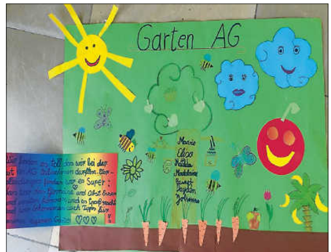
Die Schüler*innen gestalteten ein Plakat.

Die Viertklässler haben den Garten an die Kinder der dritten Klasse übergeben. Da das Interesse groß ist und die Anzahl der Kinder stetig wächst, benötigen wir noch Setzlinge und Gartenwerkzeuge aller Art, wie zum Beispiel Hacken, Gartenscheren, Spaten, Schubkarre, usw. Sehr gerne dürfen Sie sich unter der Telefonnummer 07224 50120 oder direkt bei der Schule unter 07224 2359 melden, wenn Sie mit Materialien unterstützen möchten. ■