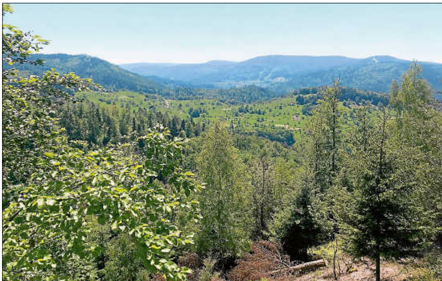
Blick auf die Landschaft rund um Reichental.