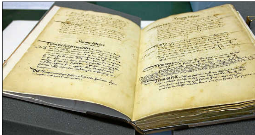
Das Eidbuch der Stadt Gernsbach.

Das Stadtarchiv war Mitte April gezielt angeschrieben worden, denn das wissenschaftliche Team in Halle hatte Kenntnis von zwei wesentlichen Quellen für die Frühgeschichte Gernsbachs erlangt: ein Eidbuch und ein Gerichtsbuch – zwei Bücher, die im 16. Jahrhundert angelegt worden sind und auch für die