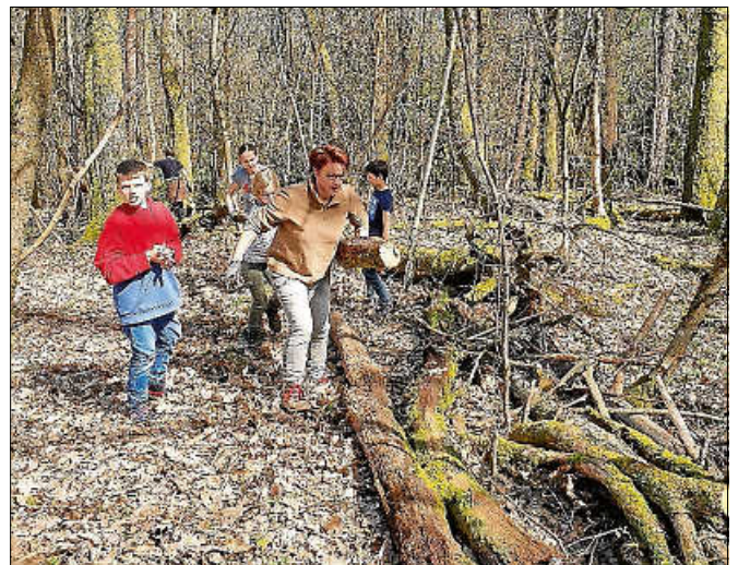
Schülerinnen und Schüler, Lehrkräfte und Eltern engagieren sich gemeinsam für die Einrichtung des Waldklassenzimmers.