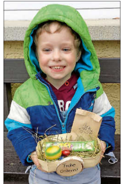
Große Freude hatten die Kinder beim Suchen und Finden der Ostergeschenke.

Neben Schokoladelecken und bunten Eiern hatte der Osterhase in diesem Jahr auch nachhaltige Saatbomben für die Blumenwiese zuhause versteckt. ■