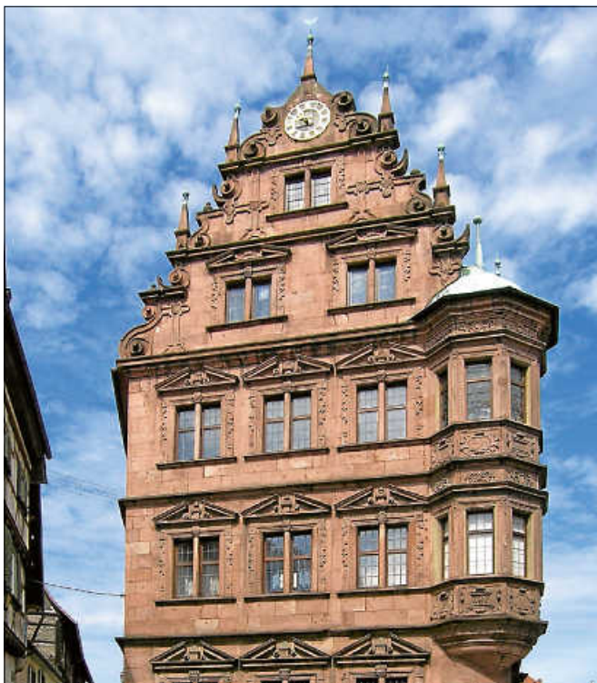
Das Alte Rathaus.