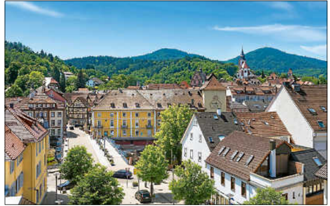
Verkaufsoffener Sonntag in Gernsbach.

Während andernorts immer mehr lokale Geschäfte schließen, wird die Gernsbacher Altstadt ständig reicher an Angeboten. Neue Geschäfte bringen frischen Wind in die alten Gassen. Bei