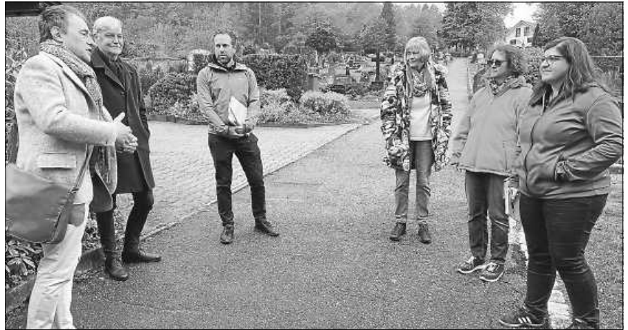
Rundgang über den evangelischen Friedhof mit Vertreterinnen und Vertretern des Stadtbauamts.