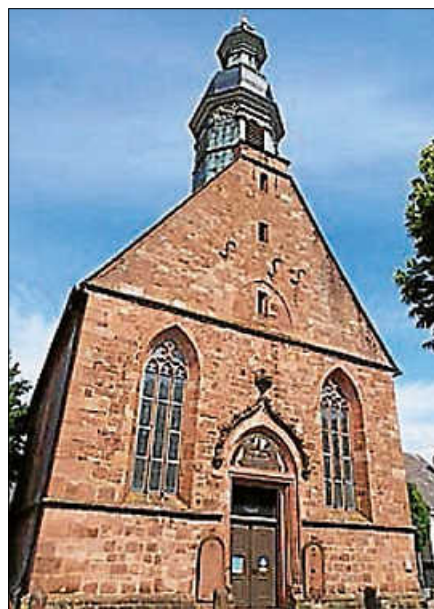
Die St. Jakobskirche.