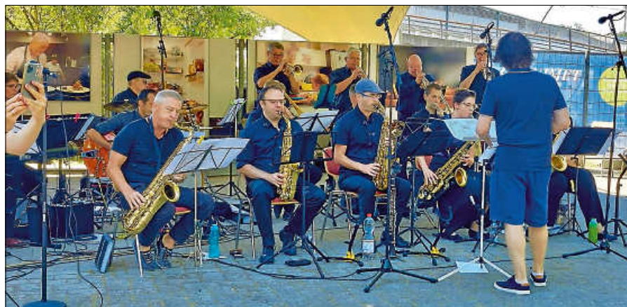
Big Band „All about Jazz“.