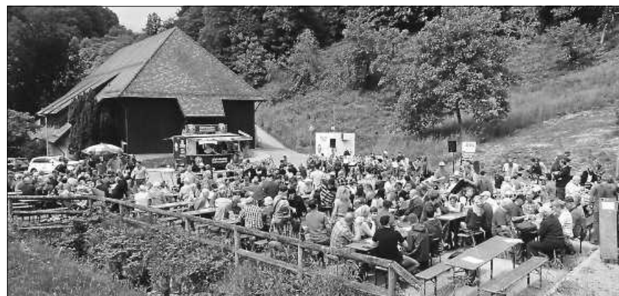
Bei hoffentlich schönem Wetter wie im vergangenen Jahr wieder draußen.

Am Donnerstag, 9. Mai, feiert Lautenbach mit dem MVL das traditionelle Vatertagsfest. Festbeginn ist um 11.30 Uhr auf dem Platz vor dem Lautenbacher Bürgerhaus, bei schlechtem Wetter in der Halle.