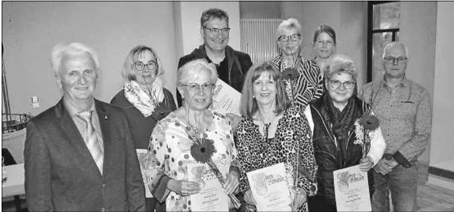
Ehrungen für 25 und 50 Jahre Mitgliedschaft beim TV Reichental.