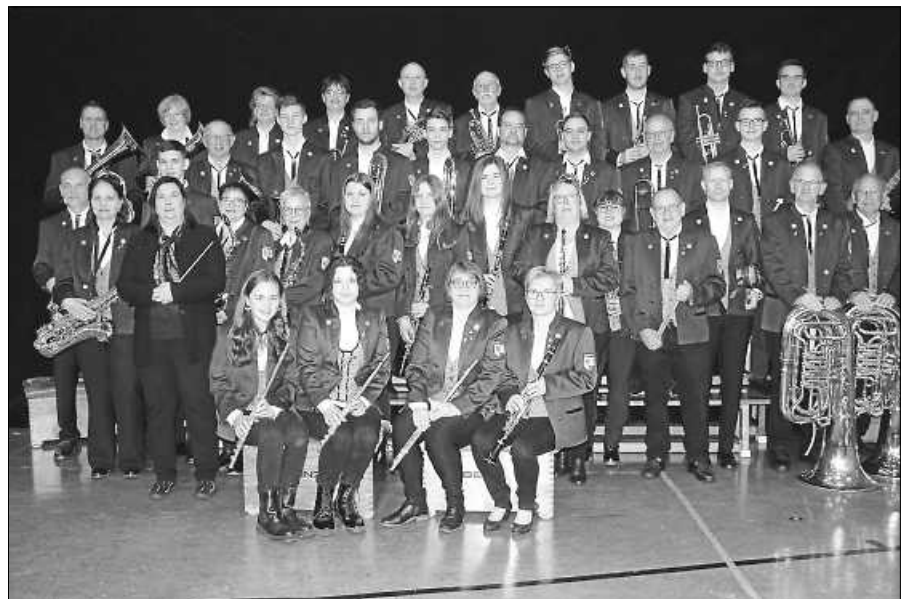
Der Musikverein Orgelfels Reichental.