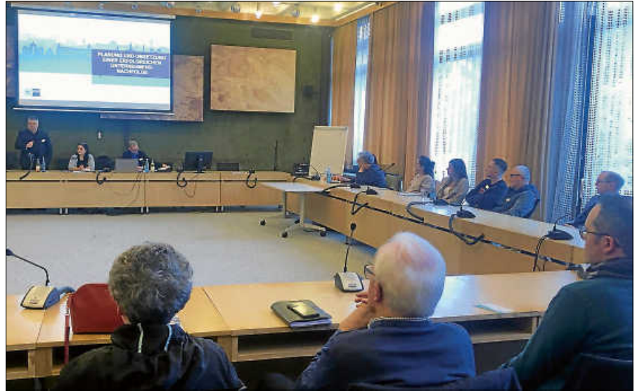
Großes Interesse an der Infoveranstaltung zum Thema Unternehmensnachfolge.

Interessierte nahmen unter anderem mit, welche potenziellen Chancen und Risiken mit einer Nachfolge einhergehen und welche Unterstützungsleistungen die Industrie- und Handelskammer in Karlsruhe bieten kann. Zudem wurden grundlegende Aspekte der Unternehmensbewertung erläutert sowie verschiedene Möglichkeiten und Formen der Unternehmensübergabe aufgezeigt.