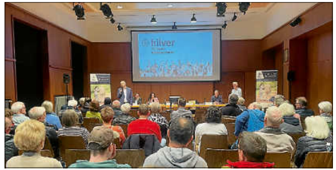
Aufmerksames Interesse beim Info-Abend zur hilver-App.