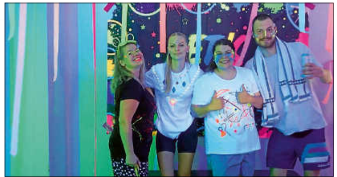
Das Jugendhausteam bei der von der „Landesvereinigung kulturelle Jugendbildung Baden-Württemberg“ geförderten NeonNight-Deluxe im Gleis 3.

Bereits im Juli 2023 fand die Wahl eines Jugendhausrates statt. 39 Beteiligte wählten drei Vorsitzende. Der Rat tagt mindestens viermal im Jahr und beschäftigt sich mit Themen wie Zusammenleben im Jugendhaus, Konfliktbewältigung und Gestaltung. Über den Jugendhausrat können Themen in die Sitzungen des Jugendhausteams und in den Gemeinderat einfließen.