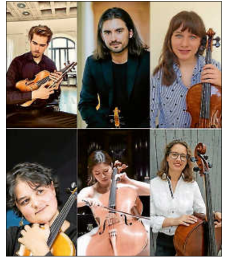
Das Karlsruher Streichsextett.

Das Streichsextett Nr. 2 in G-Dur von Brahms bildet den ersten Teil des Konzerts. Nach der Pause spielt eine Hälfte des Ensembles Schuberts Triosatz D 471 und das Intermezzo für Streichtrio von Zoltán Kodály. Die zweite Gruppe wird die Serenade in C-Dur, das wohl bekannteste Werk des als Spätromantiker geltenden Ernst von Dohnányi, interpretieren.