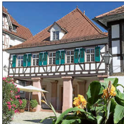
Das Kornhaus.