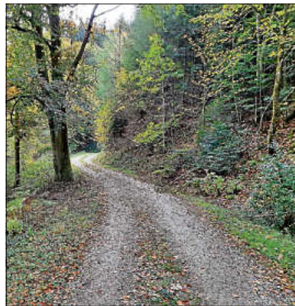
Der Schlangenweg.

Die Wanderung führt über den Felsenweg zum Kurpark und hinauf zur „Alten Weinstraße“. Der Anstieg wird durch Infos über die Geschichte der Weinstraße und des Weinhandels in Gernsbach „verkürzt“. Nach einem Blick zum Schloss Eberstein genießen Teilnehmer:innen die Ruhe auf dem Schlangenweg und die Aussicht auf Loffenau. Durch das Igelbachtal und den Kurpark geht es entspannt und erfrischt zurück zum Ausgangspunkt.