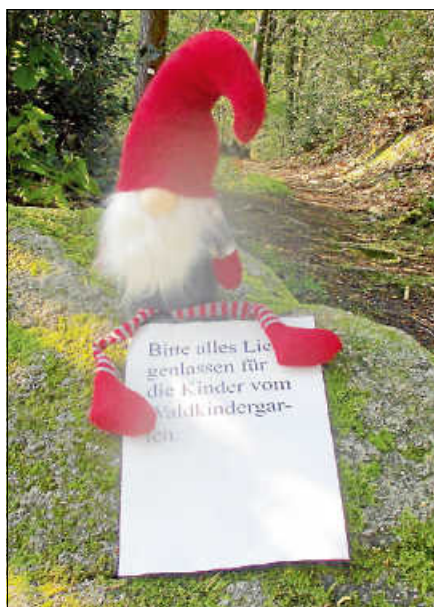
Der Zwerg lüftete das Geheimnis um das „Rumpeln“ am Rumpelstein.