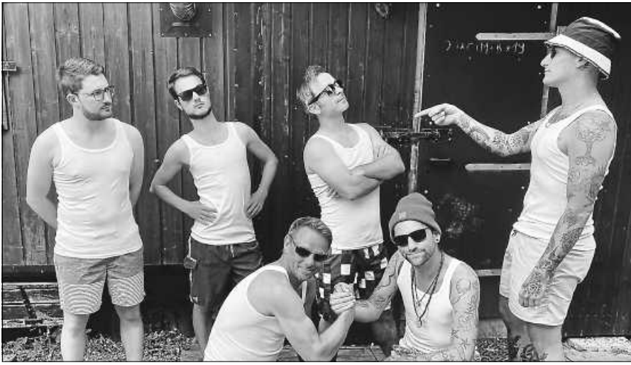
Die „Söhne Weisenbachs“ spielen am Samstagabend.