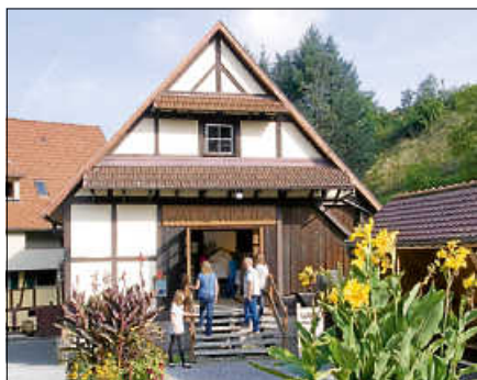
Das Waldmuseum Reichental öffnet ab Sonntag, 5. Mai.

Ein Rundgang durch das Museum zeigt die große Bedeutung des Waldes für die Entwicklung des höchstgelegenen