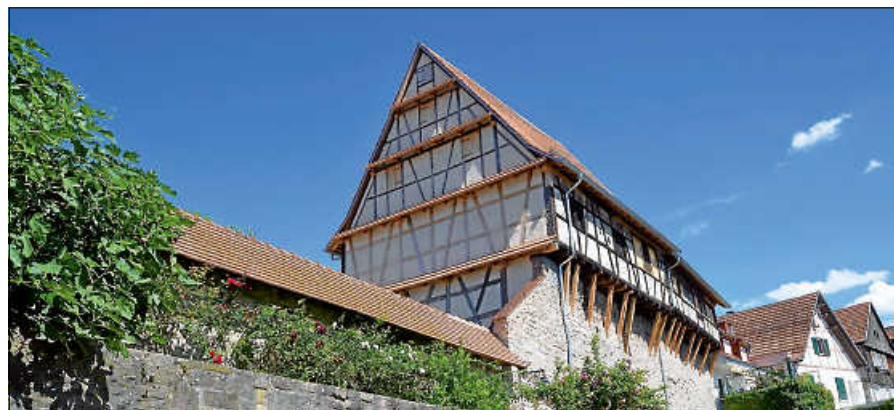
Die Gernsbacher Zehntscheuern.

Treffpunkt für die kostenfreie, ca. zweistündige Tour ist das Alte Rathaus, wo es im Weinkeller des Weingutes Iselin zunächst ein Gläschen Gernsbacher Wein und viele Informationen über