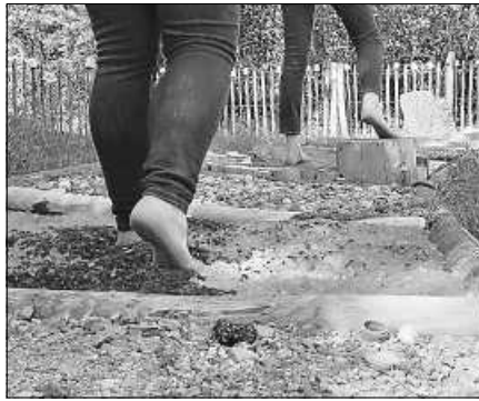
Auf dem Barfußpfad können Kinder verschiedene Stoffarten fühlen.

An diesem Erlebnistag lädt der AWB pädagogische Fachkräfte, Eltern und Kinder dazu ein, unterschiedliche Stationen rund um die Thematik Abfallvermeidung, Abfalltrennung und Ressourcenschonung auf der Umweltstation zu erkunden. Eltern, Lehrkräfte und Erzieher haben die Möglichkeit, sich vor Ort ein Bild von der Umweltbildungsstation zu machen und Informationen rund um die pädagogischen Angebote