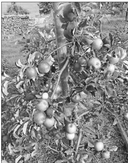
Obstbaum Red Topaz auf M9.

Die Kelterei ist noch in vollem Gange, und trotzdem sollte man sich um den Nachwuchs der Obstbäume kümmern, damit der Generationenvertrag eingehalten wird. Der Obst- und Gartenbauverein Reichental informiert, dass ab sofort Obstbäume und Beerensträucher, bei Udo Janetzki, Südhangstr. 6, Telefon 07224 40501 oder E-Mail: uj40501@aol.com , bestellt werden können. Bestellannahme bis Ende Oktober 2022.