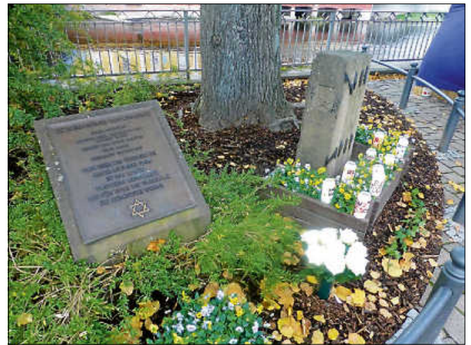
Gedenksteine am Nepomukplatz.