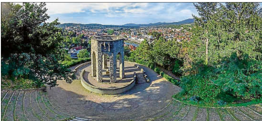
Denkmal am Rumpelstein.