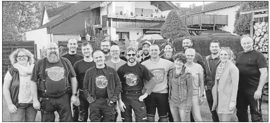
Gemeinsamer Abschluss der Motorradfreunde Reichental im Murgtal.

Der OGV bietet auch in diesem Jahr Mitgliedern und Freunden des Vereins die Möglichkeit, hochwertige Beerensträucher und Obstbäume zu einem günstigen Preis über den Verein zu bestellen. Die Lieferung erfolgt in Obertsrot und Hilpertsau frei Haus durch Vereinsmitglieder. Bestellwünsche können ab sofort bis Freitag, 28.10.2022, bei Walter Schmei-