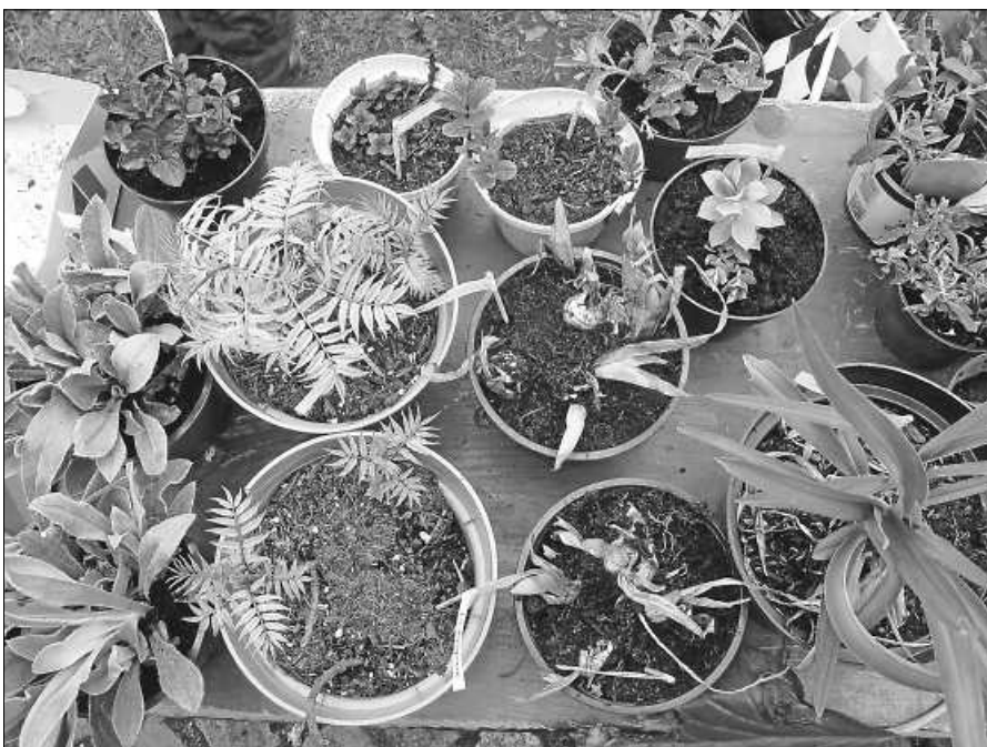
Vielfältige Pflanzen werden in der Regel angeboten.