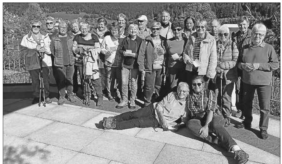
Immer guter Laune: die Dienstagswanderer.

Uhr. Nach der Busfahrt nach Plittersdorf geht es zum Rhein, lassen wir uns mit der Fähre ans elsässische Ufer übersetzen. Für weitere Informationen: 07224 9365950. Am 19. Oktober treffen sich die Mittwochswanderer zu einer Wanderung von Baden-Baden Lichtental über Scherhalde zum Kreuzfelsen und Geroldsauer Wasserfall. Dazu treffen sie sich um 8.45 Uhr am Gernsbacher Bahnhof. Wir fahren mit dem Bus nach Baden-Baden Leopoldsplatz, steigen dort um und fahren bis zum Brahmsplatz. Ab hier führt die stetig aufsteigende Wander-