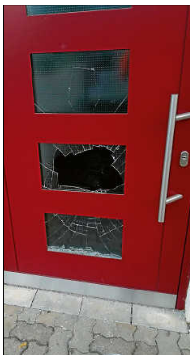
Die mutwillig zerstörte Eingangstür des Jugendhauses.