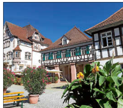
Zum Muttertag findet der Auftakt der Veranstaltungen in der Altstadt statt

Bei Regen fällt die Veranstaltung aus. ■