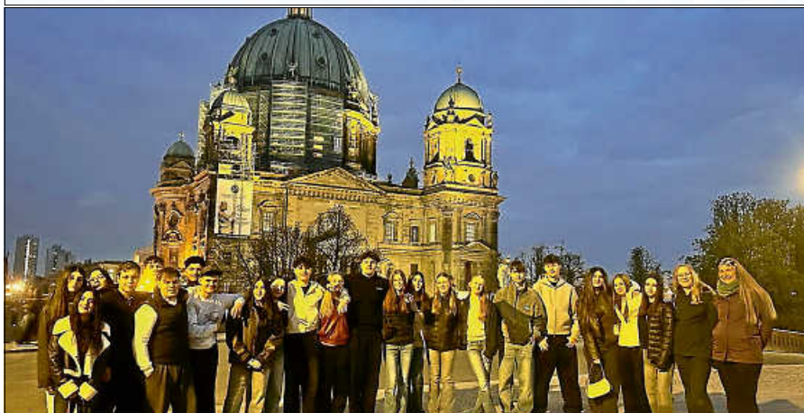
Die Klassen 9a und 9c bei ihren Klassenfahrten nach Berlin und London.