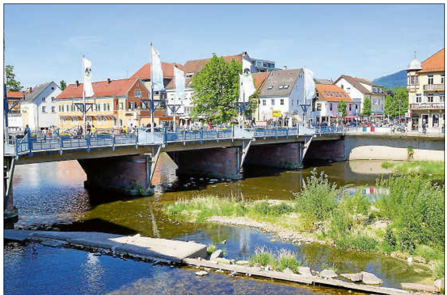
Verkaufsoffener Sonntag am 3. Mai in Gernsbach.

Von 13 bis 18 Uhr können sich Besucherinnen und Besucher auf kleine Angebote rechts und links der Murg freuen. So öffnet beispielsweise das Studio JØLG als Altstadt-Trödel-Café, eine Kombination aus kleinem Flohmarkt mit vintage Schätzen und Pop-up-Café, und im Innenhof von Weinschmecker in der Rathausstraße findet ein Weinausschank statt. In der Zeit von 11 bis 15 Uhr hat das Museum der Harmonie im Alten Rathaus geöffnet. ■