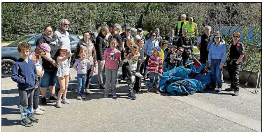
Teilnehmende der Waldputzaktion in und um Scheuern.