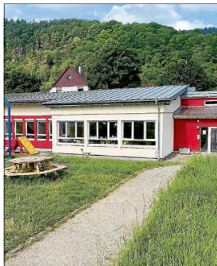
Die KiTa Rockertstrolche stellt sich vor.

Die Veranstaltung findet am 18.5.2026 von 16 bis 17.30 Uhr statt. ■