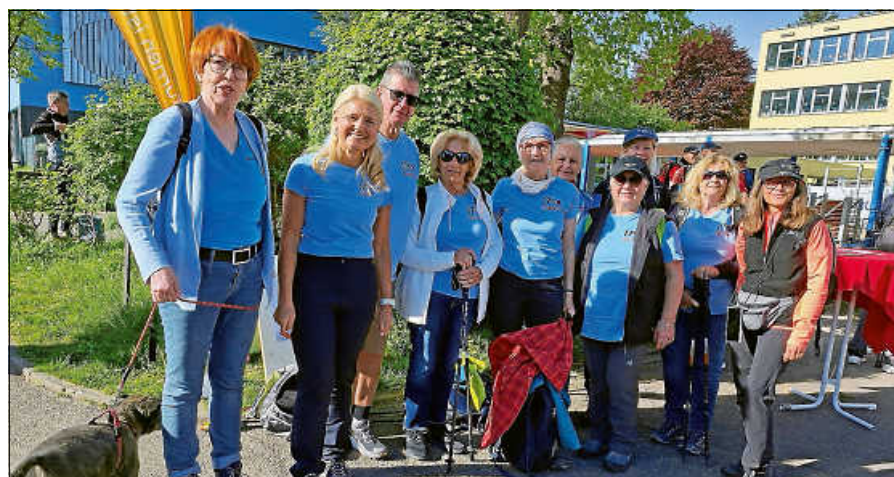
Die Damen und der Trainer der Abteilung Aqua-Fitness beim Landeswandertag in Bühl.

und Umgebung ein abwechslungsreiches Programm: Den Auftakt macht am Samstagabend, den 23. Mai, wie immer SonRise, die mittlerweile fester Bestandteil des Turniers sind und ab 19 Uhr für beste Stimmung sorgen werden. Am Sonntagabend, den 24. Mai, stehen erneut die Black Forest Noise Makers auf der Bühne – ebenfalls ab 19 Uhr. Bereits im vergangenen Jahr hatten sie das Publikum begeistert und kehren nun auf vielfachen Wunsch zurück. Ein besonderes Highlight erwartet die Gäste am Sonntagvormittag ab 11.30 Uhr: Erstmals seit längerer Zeit bietet der Verein wieder ein Frühschoppenprogramm an. Es wird Weißwürste geben und die beliebte Schulhausband aus Hörden wird musikalisch für tolle Stimmung sorgen – der Eintritt hierfür ist frei. Für die Abendveranstaltungen gilt ein Mindestalter von 16 Jahren. Karten gibt es im Vorverkauf: Das Tagesticket kostet 10 € (Abendkasse 13 Euro), das 2-Tagesticket ist für 13 Euro erhältlich (Abendkasse 20 Euro). Tickets können im FAVORS!, im Bistro Journal am Färberthor sowie jeden Mittwochabend im Clubhaus des HCG erworben werden.