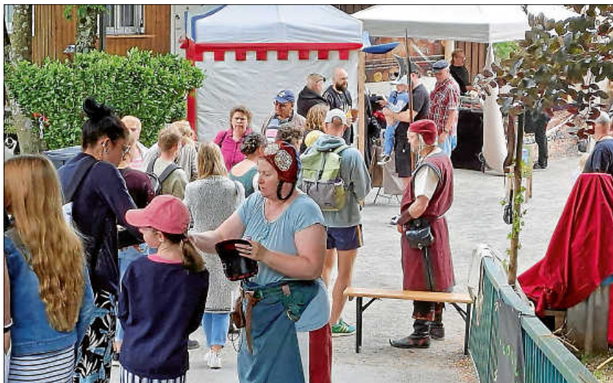
Mittelalterfest auf der Murginsel.

Erwachsene: 7 Euro Schulkinder, historische gewandete Besucher, Ausweisberechtigte: 5 Euro Kinder bis Schulalter: freier Eintritt Freitag, 1. Mai: Familienkarte (2 Erwachsene und 2 Schulkinder): 15 Euro ■