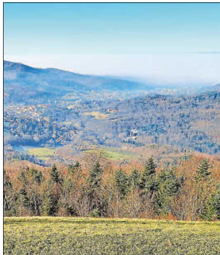
Blick vom Merkur nach Baden-Baden.

Die Tour führt zunächst durch die male- rische historische Altstadt Gernsbachs, die mit ihrem mittelalterlichen Charme und dem Alten Rathaus beeindruckt. Von hier aus beginnt der sportliche Anstieg. Ein Teil der Strecke verläuft auf dem bekannten Premiumwanderweg Murgleiter steil bergauf zum Wanderheim und weiter bis zum Merkur (668 m). Der Merkur ist der Hausberg von Baden-Baden und belohnt mit einer atemberaubenden Rundumsicht über die Rheinebene und die Höhen des Nordschwarzwaldes. Der Rückweg führt über den Ortsteil Neuhaus, den Großenberg und das historische Galgeneck. Am Galgeneck gibt es letzte eindrucksvolle Ausblicke, bevor der Weg durch Wald und Flur zurück ins Murgtal und zum Ausgangspunkt an der Touristinfo Gerns-