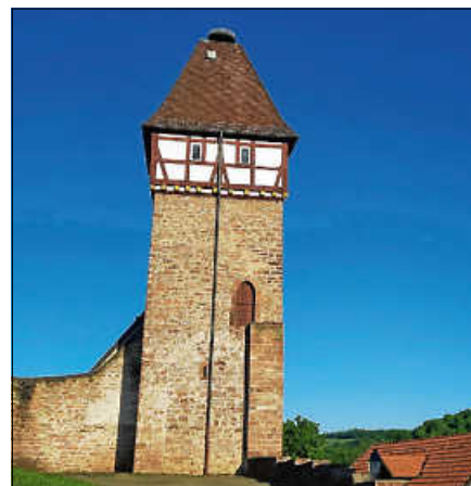
Der Storchenturm ist ab dem 17. Mai immer sonntags geöffnet.

Neben den historischen Einblicken eröffnet sich von hier oben auch ein eindrucksvolles Panorama: Der Blick schweift weit über die umliegenden Höhenzüge des Schwarzwalds und lässt bekannte Erhebungen wie den Merkur und die Teufelsmühle erkennen. Diese Kombination aus Geschichte, Ausblick und Atmosphäre macht den Besuch des Wehrturms zu einem besonders eindrucksvollen Erlebnis, das weit über einen gewöhnlichen Aussichtspunkt hinausgeht. Ein Fernglas steht bereit, die Umgebung zu erkunden. ■