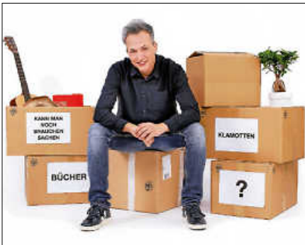
Olaf Bossi.

Wenn Ole zu Hochform aufläuft, gibt es kein Halten - nicht einmal bei den Kollegen, die sich regelmäßig freuen, von ihm anmoderiert zu werden und mit ihm die Bühne zu teilen. Im Gepäck hat er wieder eine Ladung der lustigsten Comedians und Kabarettisten der Republik und der Abend verspricht auch diesmal, ein Feuerwerk der Kleinkunst zu werden! Die auserlesenen Gäste dieser Show sind: