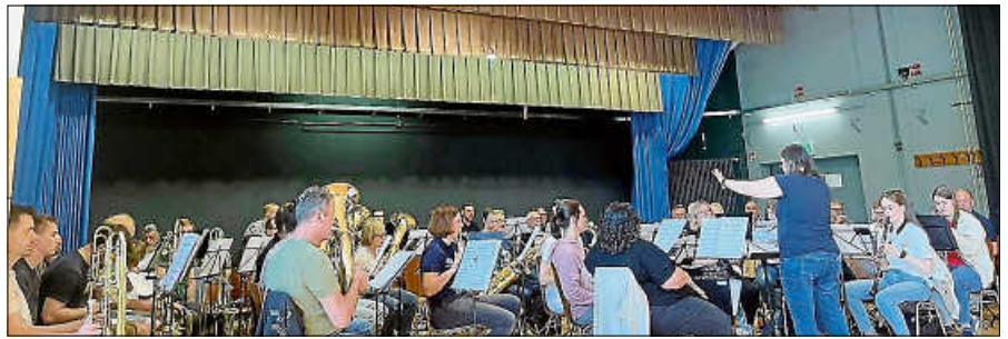
Gemeinsames Probewochenende der Musikvereine Reichental und Michelbach.

Nachdem freitags bereits Schülerinnen und Schüler der Grundschule Scheuern rund um das Schulgebäude fleißig Müll gesammelt hatten, standen am Samstagmorgen über 30 Personen parat, um die Straßen und Waldgebiete in und um Scheuern herum nach Unrat zu durchkämmen. Organisiert wurde die Aktion