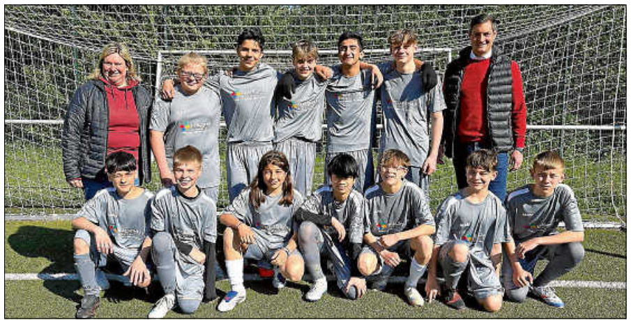
Mannschaftsfoto Team U15 mit neuen Trikots.