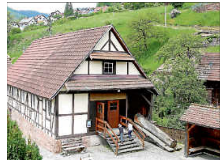
Informativ und einzigartig – das Waldmuseum im Gernsbacher Stadtteil Reichental.