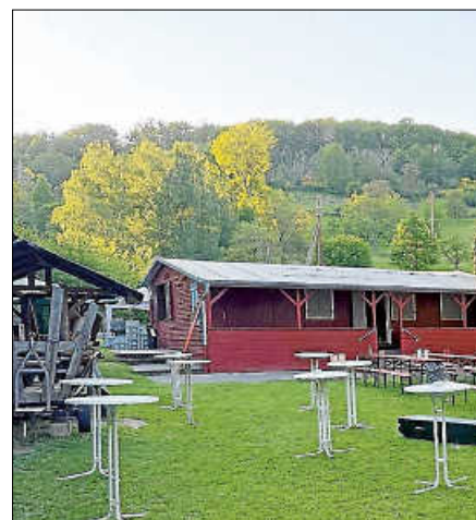
Die Handballer der Murgtal Panthers bewirten am 1. Mai im Sonnengarten.

Am 1. Mai grillen die Handballer ab 11 Uhr im Vereinsheim Sonnengarten. Neben Cevapcici finden rote und weiße Würste auf dem Grill Platz und werden im Weck, mit Pommes oder als Currywurst mit hausgemachter Soße serviert. Wer es etwas ausgefallener mag, hat die Wahl zwischen scharfen Feuerwürsten, knuspriger Falafel mit Rucola-Garnitur und Knoblauchsoße im Fladenbrot oder Pulled Pork. Auch ein großes Kuchenbuffet ist wieder geboten und lädt zum gemütlichen Nachmittagskaffee ein. In familiärer Atmosphäre werden frisch gezapftes Pils, spritziger Aperol sowie verschiedene Grillspezialitäten angeboten. Die Handballer freuen sich über zahlreiche Gäste und einen geselligen Besuch.