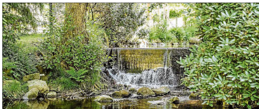
Der Gernsbacher Kurpark.

Info bei unsicherer Wettervorhersage bis 14.30 Uhr unter Telefon 07224 1797. Weitere Termine: Freitag, 5. Juni 2026, um 16 Uhr und Samstag, 17. Oktober 2026, um 15 Uhr. ■