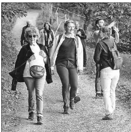
Herbstwanderung der SPD Gernsbach.

Der Herbst naht und somit die alljährliche Herbstwanderung des SPD Ortsvereins. Am 8. Oktober werden wir uns um 14 Uhr an der Bahnhaltestelle Obertsrot treffen, um gemeinsam durch den Obertsroter Wald über die Antionuskapelle zum Schloss Eberstein zu wandern. Vorher besuchen wir die Feuerwehrwache-Süd in der Ebersteinhalle. Der Tag findet um 17 Uhr seinen Abschluss in der Schlosschenke im Schloss Eberstein. Alle Genossinnen und Genossen sowie Parteifreunde sind herzlich dazu eingeladen! Eine Anmeldung kann unter 07224 6494774 (telefonisch oder per WhatsApp) oder per E-Mail (spd.gernsbach@gmail.com) erfolgen. Wir freuen uns sehr auf den gemeinsamen Tag!