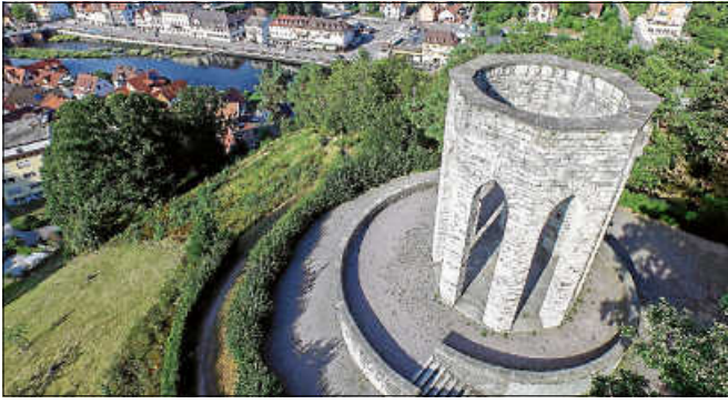
Das Denkmal am Rumpelstein.

K riegerdenkmäler verraten mehr über die jeweiligen Erbauer als über diejenigen, denen die Monumente gewidmet sind.