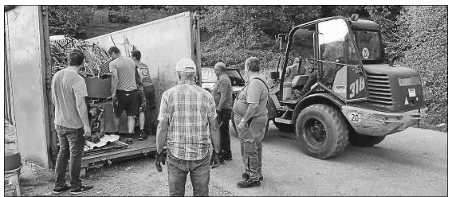
Ehrenamtlicher Arbeitseinsatz zum Erhalt der Blasmusik.