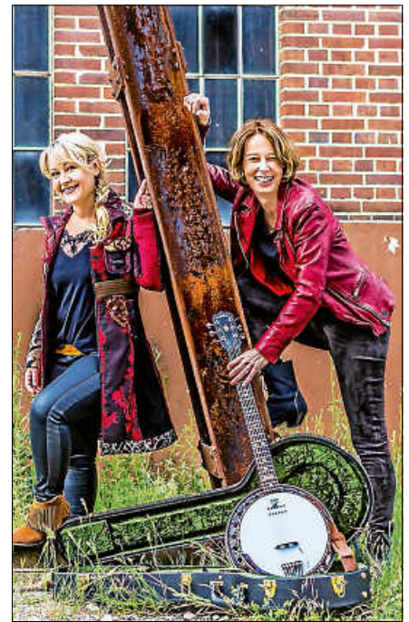
Die Frauenpowerband „Hearts and Bones“

Tickets Reservierung auch gerne über die Homepage www.kultur-im-kirchl.de ■