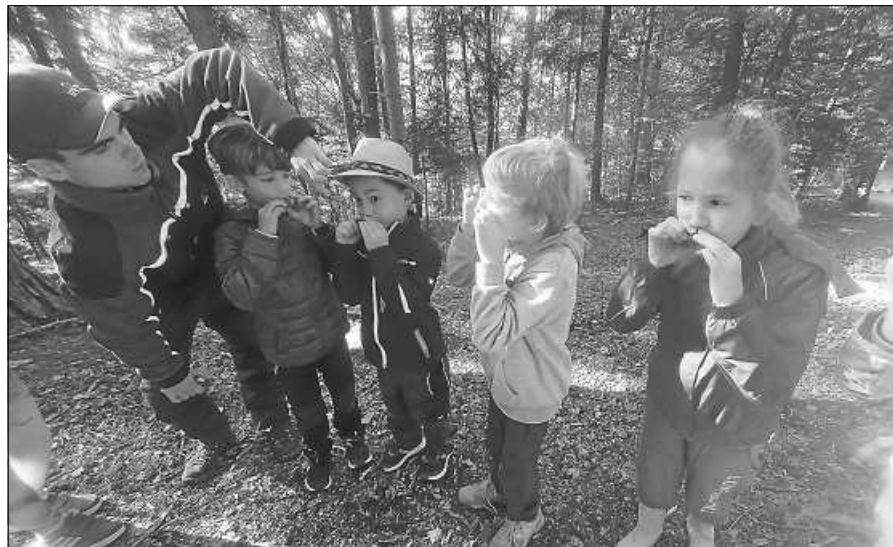
Die Kinder testen die Kapillarwirkung der Wasserleitbahnen im Baumstamm.

Besonders gerne wurde, wie letztes Jahr, das Eichhörnchen-Spiel gespielt. Dabei bekam jedes Kind drei Haselnüsse, die