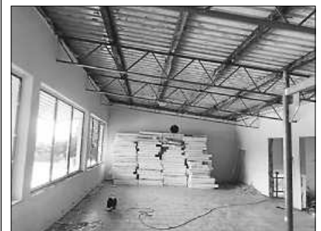
Das alte Clubhaus aus dem Jahr 1972 steht vor dem Abriss.

Im Rahmen des Neubaus der Auwiesenhütte mit neuem Sportbereich wird das alte Clubhaus bald Geschichte sein. In Eigenarbeit wurden dieser Tage die Inneneinrichtung, Technik, Heizung, Türen, Fenster, Metall, Isolierungen etc. fachgerecht ausgebaut und entsorgt. Als letzter Schritt im aufwendigen Gesamtbauwerk steht nun der Abriss durch eine Fachfirma auf der Agenda. Danach ist der Weg frei für die Infrastrukturmaßnahmen rund um die Auwiese mit Geh- und Zuwegen, Begrünung sowie allgemeinen Arbeiten rund um die Auwiesenhütte mit neuer Terrasse. Ziel ist es, im 100-jährigen Jubiläumsjahr die insgesamt dreijährige Baumaßnahme abzuschließen.