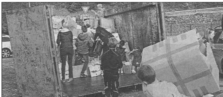
Das Altpapier wird beim Bolzplatz in Scheuern gesammelt.

Ihre Papiere bitte! Der Förderverein Grundschule Scheuern veranstaltet am Samstag, 14. Oktober, eine Altpapiersammlung an der Grundschule in Scheuern von 8.00 bis 11.30 Uhr vor dem Bolzplatz. Bitte helfen Sie mit und bringen uns daher Ihre alten Zeitungen, Zeitschriften, Bücher, Papiere, Pappe und Kartons; gerne auch von anderen