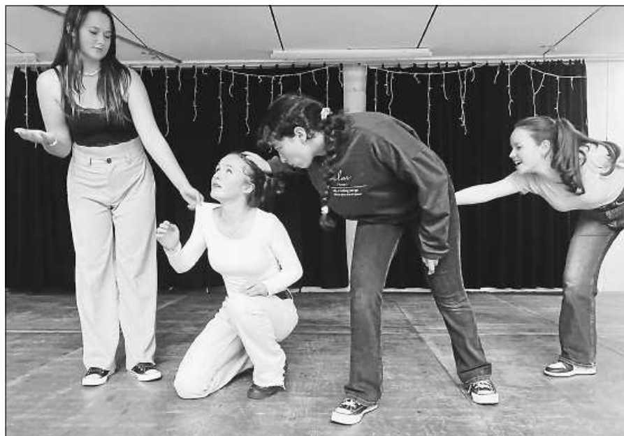
Vier Schülerinnen der Theater-AG spielen im Rahmen des Workshops eine improvisierte Mobbing-Szene.