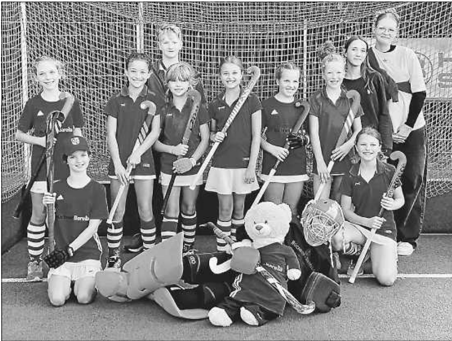
WU10 des Hockey-Clubs Gernsbach.