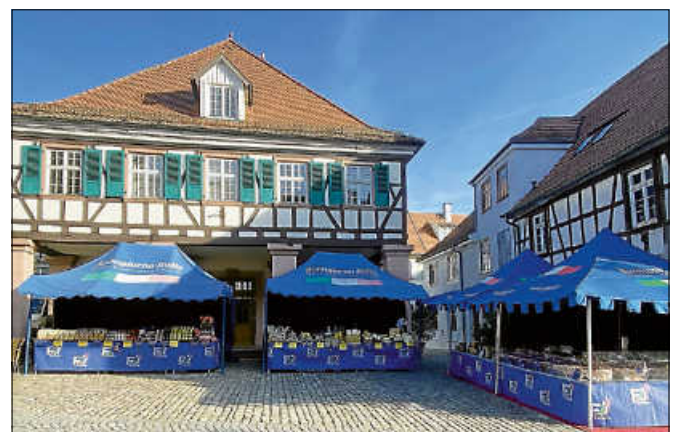
Italienisches Flair in der historischen Altstadt.

Die Besucherinnen und Besucher dürfen sich auf eine große Auswahl an authentischen italienischen Produkten freuen. Ob köstlicher Käse, verschiedene Oliven, eine breite Palette von Wurstwaren und Saucen, handgefertigte Pasta sowie knusprige Backwaren: Die Händlerinnen und Händler haben mit Liebe zum Detail die besten Produkte aus ganz Italien für ihre sechs großartigen Stände ausgewählt. ■