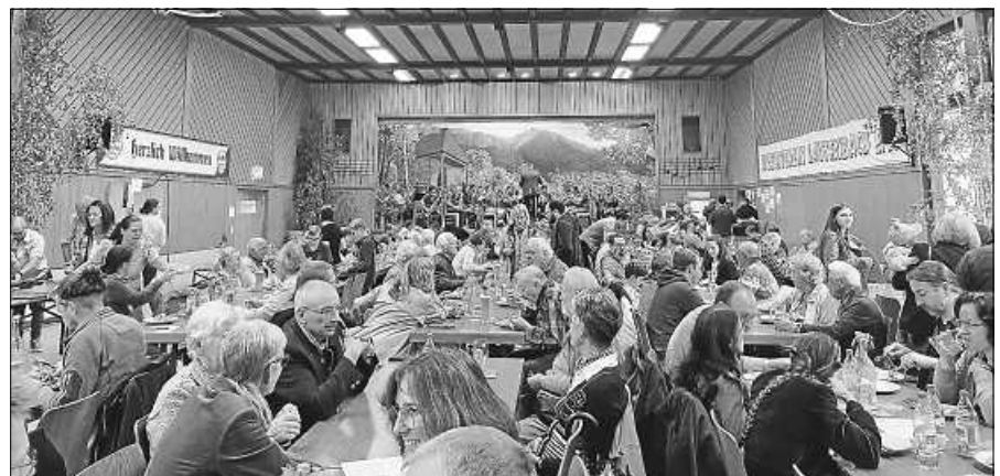
Knödel in allen Variationen werden am traditionellen Lautenbacher „Knödelfest“ geboten, das vom Musikverein Lautenbach veranstaltet wird.