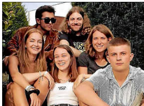
Bulletproof garantiert gute Musik vor dem Kornhaus.