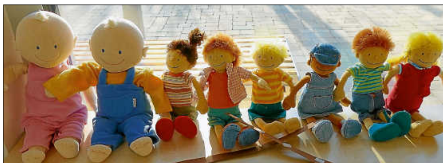
Alle Erlöse kommen den Kindern des Fliegenpilzes zugute.

Der Unkostenbeitrag pro Tisch beträgt 10 Euro oder 5 Euro und einen Kuchen. Der erwirtschaftete Geldbetrag wird im vollen Umfang für die Kita-Kinder eingesetzt. ■