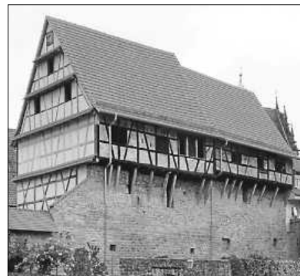
Ansicht der Zehntscheuern von Südwesten.

Am Freitag, den 13. Oktober 2023, findet der letzte Hock des Forums Gernsbacher Zehntscheuern in diesem Jahr statt. Ab 18 Uhr öffnen die Zehntscheuern zur Besichtigung und für Gespräche. Für Bewirtung ist gesorgt.