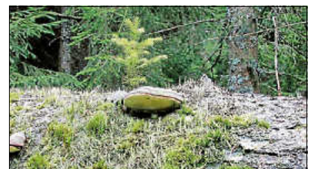
Pilze im Bannwald.

Bitte sehr festes Schuhwerk, ggf. Stöcke und Rucksackvesper mitbringen. Die rund 14 Kilometer lange Tour ist für alle ab etwa zwölf Jahren geeignet und startet um 10 Uhr am Infozentrum Kaltenbronn. Es wird eine Gebühr von 10