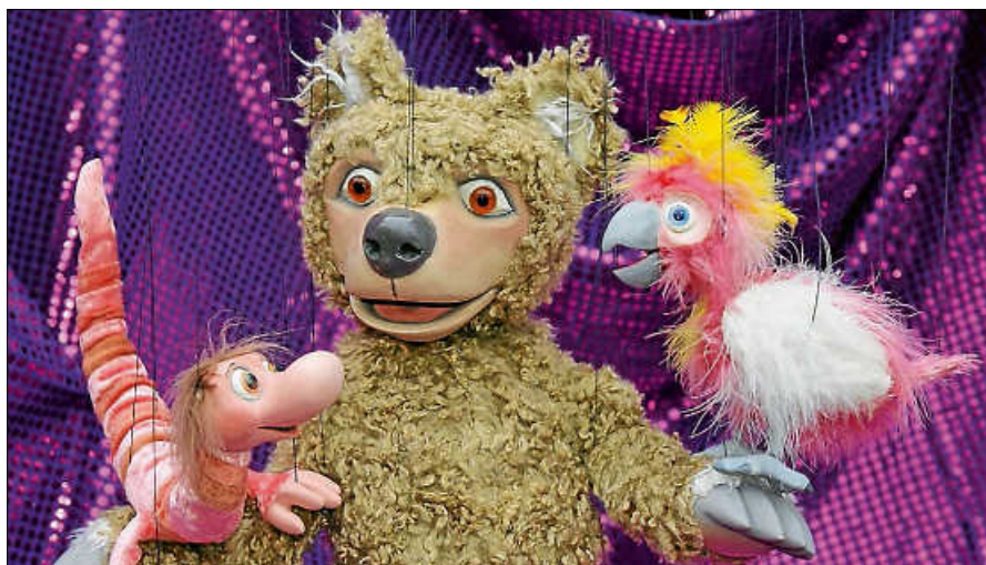
„Hokusdipokus – Zauberei an Fäden“.

Weitere Veranstaltungen der Reihe sind: Sonntag, 26. November 2023, 15 Uhr: