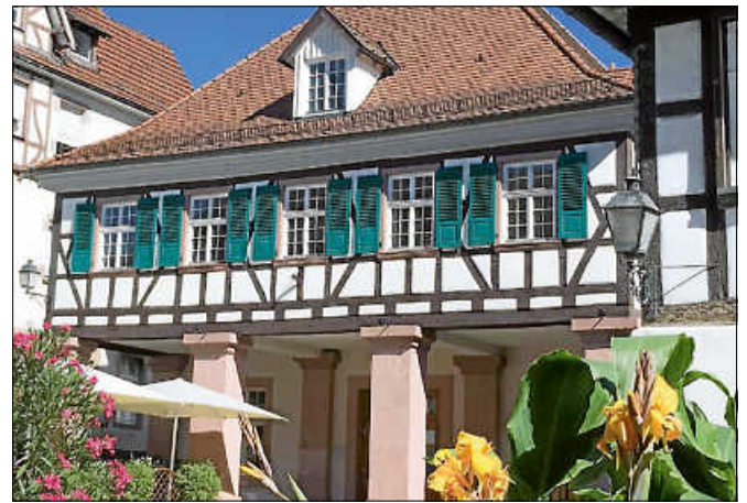
Das Kornhaus wird zur Meisterküche.

Kochbegeisterte sind herzlich eingeladen, gemeinsam im Kornhaus an der Zubereitung einer köstlichen Gemüsesuppe teilzunehmen. Gerne dürfen eigene Schneidebretter, Messer und Gemüse mitgebracht werden. Ab 13 Uhr wird eifrig geschnippelt und gekocht, um dann um 14.30 Uhr gemeinsam ein tolles Essen zu genießen. Das POP-UP Küch' Event ist mehr als nur Kochen – es ist ein gemeinschaftliches kulinarisches Erlebnis, bei dem der Fokus auf dem Miteinander liegt. Ab 15 Uhr wird die Veranstaltung mit OPEN Stage abgerundet, bei dem talentierte Newcomer:innen sowie erfahrene Künstler:innen die Bühne erhalten, um ihr musikalisches Talent in einem perfekten Rahmen zu präsentieren. ■