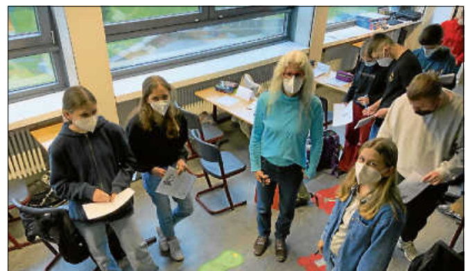
Ökologie-Projekt mit Experten der Energieagentur Mittelbaden.

In einem Selbstexperiment, konnten die Schüler schließlich ihren eigenen CO2-Fußabdruck ermitteln, und das Ergebnis überraschte nur die Wenigsten: Mit unserem aktuellen System des Konsums bräuchten die Deutschen im Durchschnitt 3 Erden, um ihren Energiehunger zu stillen. Wir haben jedoch nur die eine. ■