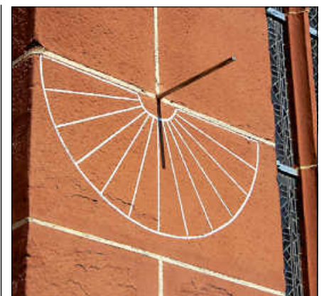
Sonnenuhr an der Liebfrauenkirche.

Eine Anmeldung bei der Touristinfo unter 07224 6444 ist erforderlich. ■