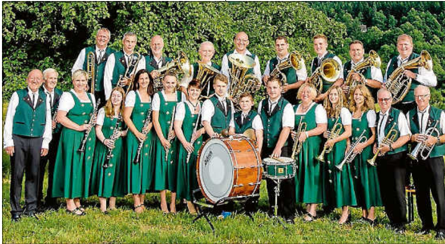
Die Lautenbacher Musikant*innen.