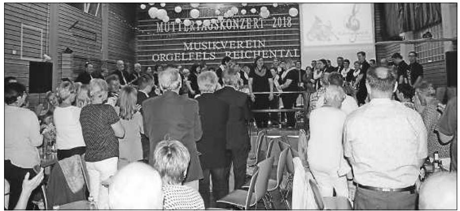
Das Publikum war begeistert und dankte mit stehendem Applaus.

Der Gesangverein Liederkrantz Reichental lädt am Sonntag, 1. Mai, zu seinem traditionellen Maihock auf den Schulhof in Reichental ein. Ab 11:00 Uhr werden Grillwürste, hausgemachte Gulaschsuppe, Pommes und Backcamembert angeboten. Und natürlich gibt es wieder ein reichhaltiges Buffet mit den bekannten selbstgebackenen Torten und Kuchen. Bei schlechtem Wetter findet die Veranstaltung in der Turnhalle statt. Die Sängerinnen und Sänger freuen sich sehr, nach zwei Jahren Zwangspause endlich wieder viele Besucher in Reichental begrüßen zu dürfen.