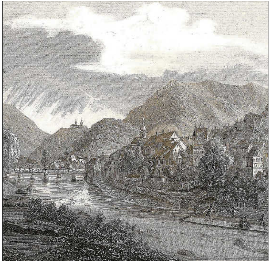
Typisch für Gernsbach. Verschachtelte Lage, strittige Besitzverhältnisse.

Datum: Mittwoch, 04. Mai 2022, 17 Uhr Dauer: ca. 1,5 Stunden Treffpunkt: Brunnen am Salmenplatz, Gernsbach. Eine Anmeldung bei der Touristinfo Gernsbach unter 07224 64444 ist erforderlich. ■