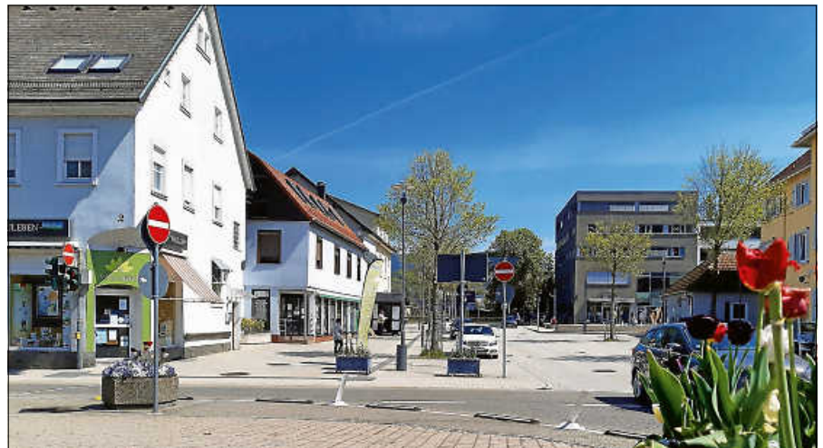
Die Einzelhändler:innen laden zum entspannten Bummeln in Gernsbach ein.

Erkennen kann man die Geschäfte ganz leicht an der gemeinschaftlich organisierten Dekoration der Ladentüren. Diese Aktion soll nicht die letzte