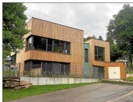
In der ev. Kita Regenbogen sind freie Ganztagesplätze ab Sept. 2026 zu vergeben.

Das Kitateam freut sich über Anfragen und ist telefonisch erreichbar unter 07224-9983030. ■