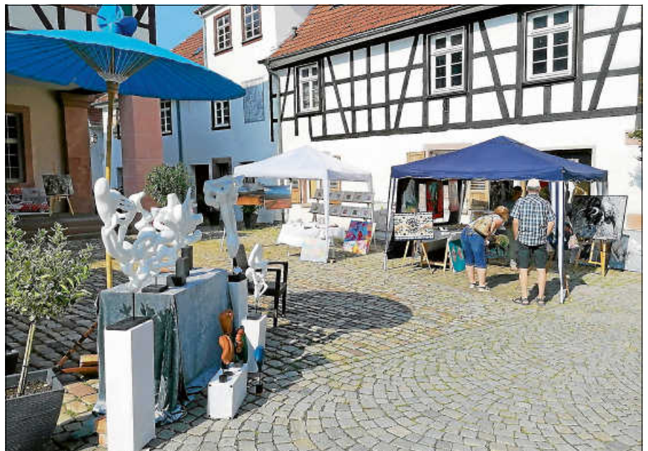
Montmartre in Gernsbach.

In Anlehnung an den Pariser Montmartre können Besucherinnen und Besucher live miterleben, wie gemalt, gezeichnet, geschnitzt und gestaltet wird. Der persönliche Austausch mit den Kunstschaffenden ist ausdrücklich erwünscht – viele der einzigartigen Arbeiten können auch direkt vor Ort käuflich erworben werden. ■