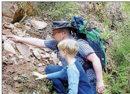
Einladung zur Geotour am Kaltenbronn.