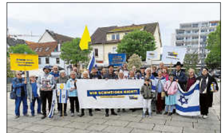
Teilnehmer am Marsch des Lebens in Gernsbach im Jahr 2025.