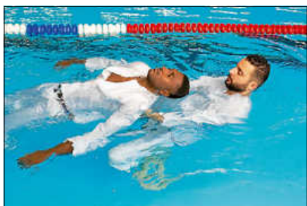
Ein Rettungsschwimmkurs ist im Igelbachbad möglich.

Auch in diesem Jahr wird wieder die Möglichkeit angeboten, ein Rettungsschwimmabzeichen zu erwerben. Der Kurs zum Erwerb bzw. zur Wiederholung des Rettungsschwimmabzeichens in Bronze oder Silber findet immer am Montagnachmittag von 15.15 - 19 Uhr an folgenden Terminen im Igelbachbad statt: 6.7., 13.7., 20.7. und 27.7. Die Anmeldung sowie alle notwendigen Informationen sind auf der Homepage unter https://gernsbach.dlrg.de/kurse-und-sicherheit/rettungsschwimmausbildung/ zu finden. Für Rückfragen steht der Leiter Ausbildung unter der E-Mail-Adresse: ausbildung@gernsbach.dlrg.de gerne zur Verfügung.