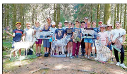
Die Klasse 4 mitten im Wald.

Zum Abschluss wurde die Wartezeit bis zur Ankunft der Busse mit Filmen über den Luchs überbrückt. Nach fünf