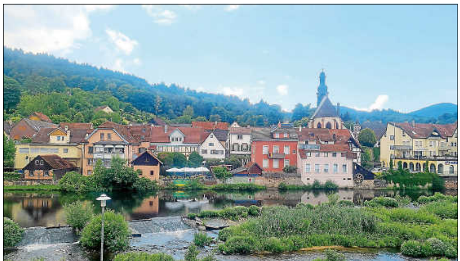
Blick auf die Schlossstraße am Murgufer.

Für die Schlossstraße sind unter anderem ein neues Absperrschütz an der Schlosstmühle, die Erhöhung beziehungsweise der Neubau von Ufermauern sowie ergänzende Objektschutzmaßnahmen vorgesehen. Die erste Planungsphase mit Vorplanung, Fachgutachten und Gesprächen mit Grundstückseigen-