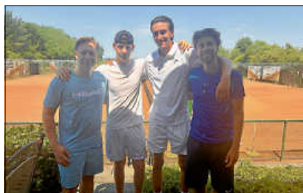
Die Mannschaft Herren 2 des TCG.

Das vergangene Medenspiel-Wochenende stand beim TC Gernsbach und den Spielgemeinschaften ganz im Zeichen der extrem hochsommerlichen Temperaturen. Das absolute Highlight lieferten die Herren 2, die sich von den tropischen Bedingungen unbeeindruckt zeigten. Sie sicherten sich einen überragenden 6:0-Kantersieg gegen Hügelsheim. Spannend machten es die Damen-Teams, die in der Hitze viel Moral bewiesen und jeweils unentschieden spielten. Die Damen 30 I erkämpften sich ein verdientes 3:3-Remis gegen den TC Neulingen und auch die Damen 50 II trennten sich mit einem starken 3:3-Unentschieden von BW Baden-Baden. Weniger Spielglück hatten die Herren 30, die sich beim TC BW Forbach mit 0:6 geschlagen geben mussten. Auch die TSG U18-Juniorinnen zogen auswärts beim TC BG Rastatt mit 1:5 den Kürzeren.