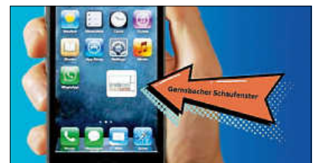
Das Gernsbacher Schaufenster kann jetzt auch als WebApp installiert werden.