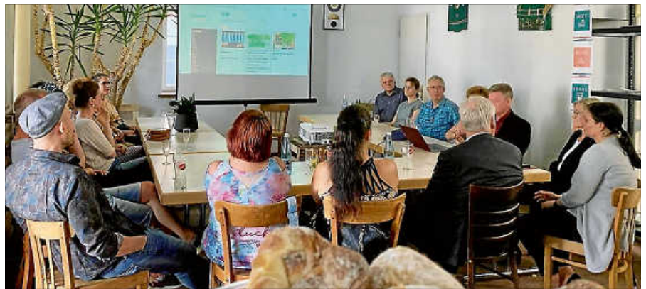
Archivbild: Ein Blick auf die beeindruckenden Zahlen und Fakten der ersten zwei Jahre im offiziellen Teil der Feier zum 2-jährigen Bestehen.

Dieses erfolgreiche Miteinander möchte die Wirtschaftsförderung Gernsbach gemeinsam mit allen teilnehmenden Anbieterinnen und Anbietern feiern. Die Jubiläumsveranstaltung bietet Gelegenheit, auf die vergangenen fünf Jahre zurückzublicken, Erfahrungen auszutau-