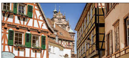
Die sehenswerte Gernsbacher Altstadt.

Weitere Termine im Juli: 11./18./25. Juli, jeweils 10.30 Uhr. ■