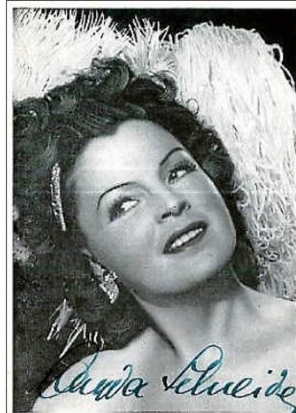
Autogrammkarte der Schauspielerin Magda Schneider