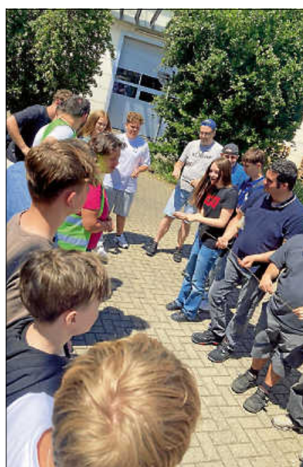
Am Ende dieses Spiels gab es nur Gewinner.

Nach dem Besuch bei der Lebenshilfe bleiben diese wichtigen Werte für die Klasse 8b weiterhin von großer Bedeutung. Die Schülerinnen und Schüler sind durch diese Erfahrung sichtbar über sich hinausgewachsen. Die Realschule und ihre Schülerinnen und Schüler freuen sich bereits auf die nächste gemeinsame Sammelaktion mit der Lebenshilfe im Herbst. ■