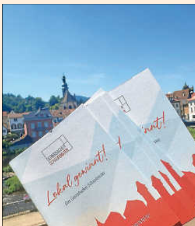
Das Bonusheft bietet viele Vorteile.

Alle Informationen finden sich unter www.gernsbach.de/bonusheft .