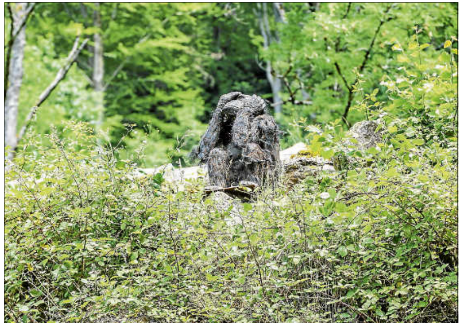
Skulptur HENRY, 2018, Ton, Maschendraht, Stahlgerüst, Stahlplatte, 85 x 50 x 30 cm.

Seit 2018 wacht HENRI , eine Skulptur der Karlsruher Künstlerin Irmela Maier, über den Kunstweg am Reichenbach. Ihre überwiegend plastischen Arbeiten überzeugen in ihrer souveränen Materialkomposition von einer großen handwerklichen Virtuosität. Hände, Füße und Kopf formte die Künstlerin aus Ton, die nach einer längeren Trockenphase in der Karlsruher Majolika gebrannt wurden. Im Anschluss wurde der Körper, stabilisiert mit einem Stahlgerüst, aus Maschendraht gefertigt. Als Vorlage ihrer Skulpturen dienen Beobachtungen, Zeichnungen und Fotos von Tieren in Zoos. Ein besonderer Tipp für Besucherinnen und Besucher: Ein Besuch bei HENRI am Nachmittag lohnt sich besonders, da sein Fell im Sonnen-