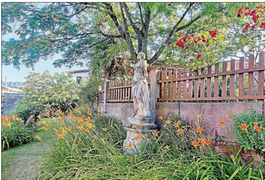
Am Murgufer im Katz'schen Garten.

Die kostenlose Führung mit Stadtführerin Veronika Gareus-Kugel dauert ca. 1 Stunde und beginnt um 10.30 Uhr. Treffpunkt ist am Pavillon im Katz'schen Garten, Bleichstraße 9. Um Anmeldung bei der Touristinfo Gernsbach unter 07224 644 446 oder touristinfo@gernsbach.de wird gebeten. ■