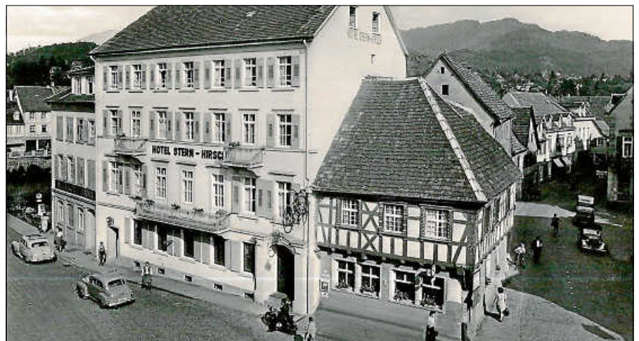
Das Restaurant Stern-Hirsch Anfang der 1950er Jahre

da Schneider. Sie ließ dem Eigentümer Carl Brude nach ihrem Aufenthalt wegen einer nicht bezahlten Zigarettenpackung eine handgeschriebene Karte zukommen.