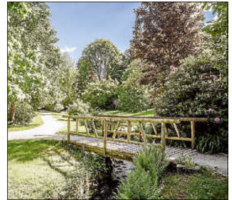
Die Tour führt auch durch den Kurpark.

Weiterer Termin: Freitag, 28. August 2026 ■