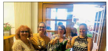
Archivbild: Die Anbieterinnen des Gernsbacher Schaufensters feierten das 2-jährige Jubiläum.

Eine persönliche Einladung mit dem Programm erhalten alle teilnehmenden Anbieterinnen und Anbieter rechtzeitig. ■