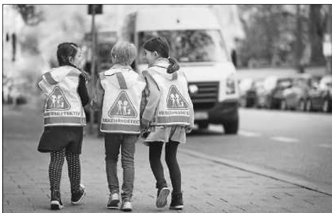
Eigenständig und sicher zur Schule laufen.

Alle Informationen gibt es zum Nachlesen im ADAC Schulwegratgeber, der kostenlos in allen nordbadischen ADAC Geschäftsstellen und Reisebüros abgeholt werden kann. Neben zahlreicher Multimedia-Inhalte, wie lehrreiche Online-Games und Videos für Kinder oder Informationen zum Thema Elterntaxi, finden Lehrer und Eltern auf www.verkehrshelden.com der ADAC Stiftung nützliche Checklisten und Begleitmaterial zum sicheren Schulweg. Die Verkehrs-Experten des ADAC Nordbaden stehen telefonisch unter 0721 810 49 11 für Fragen zur Verfügung. ■