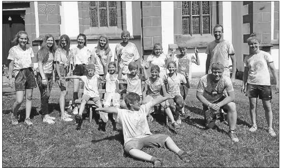
Farbschlacht auf der Liebfrauenwiese beim Ferienlagerersatz 2021.