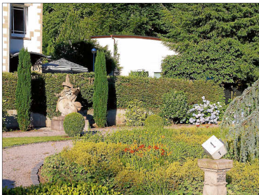
Sonnenuhr im Clemmschen Garten.

Sechs Sonnenuhren an vier Standorten werden „unter die Lupe“ genommen: Aussegnungshalle auf dem evangelischen Friedhof,