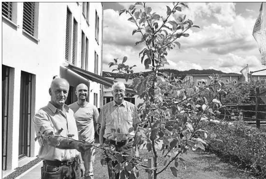
Vertreter des OGV und der Tagespflege bei der Übergabe des Apfelbäumchens.