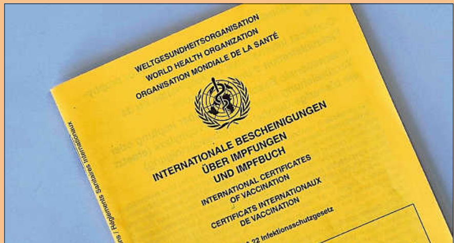
Ein Impfnachweis ist auch digital möglich.

Ebenso ist es möglich, die Eintragung des Genesenen-Nachweises vornehmen zu lassen. Bei Rückfragen vorab wenden Sie sich gerne an die Wendelinus-Apotheke Weisenbach unter Telefon 07224 991780.