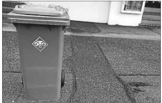
Zu den Leerungsterminen sollten Mülltonnen mit geschlossenem Deckel am Gehwegrand bereit stehen.

Nach der Entleerung sind die Abfallbehälter unverzüglich wieder zu entfernen. ■