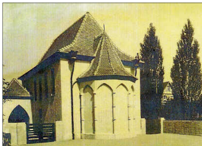
Die ehemalige Synagoge.

Die Teilnehmerzahl ist begrenzt auf 15 Personen. Während der Führung wird darum gebeten, Abstände einzuhalten und wenn Abstände nicht eingehalten werden können, eine Mas-