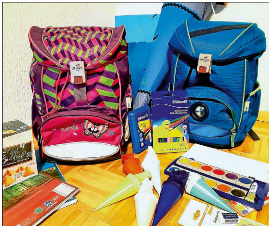
Einschulung für das Schuljahr 2021/2022.