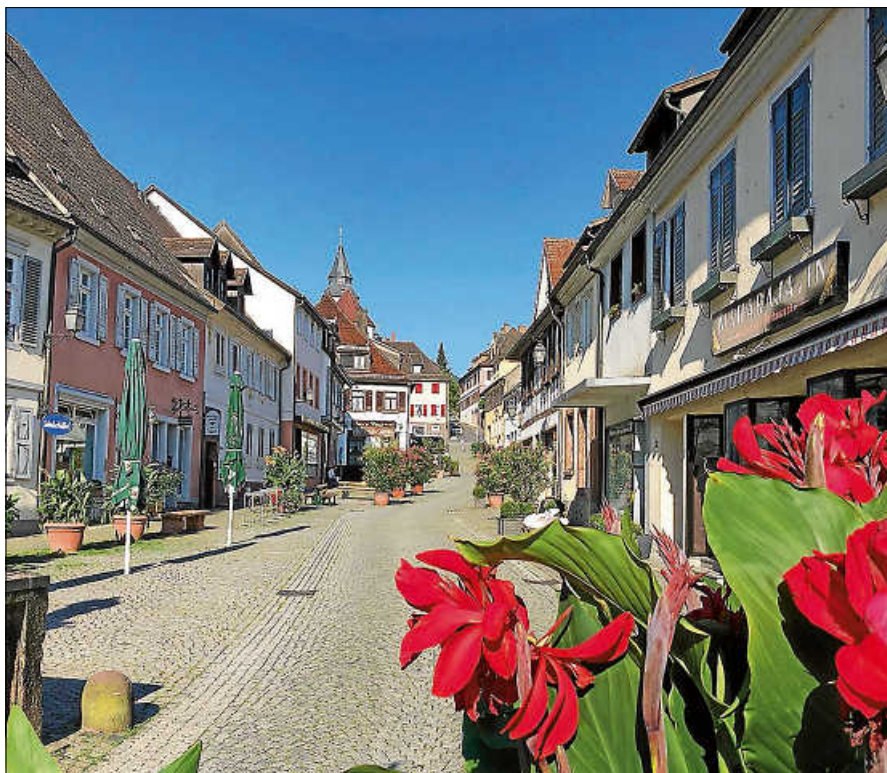
Die Stadt als Wohnzimmer.

Eine Übersicht aller Veranstaltungen sowie wichtige Infos finden Sie in dem dazugehörigen Flyer, der in der Tourist-Info Gernsbach zur Mitnahme bereitliegt