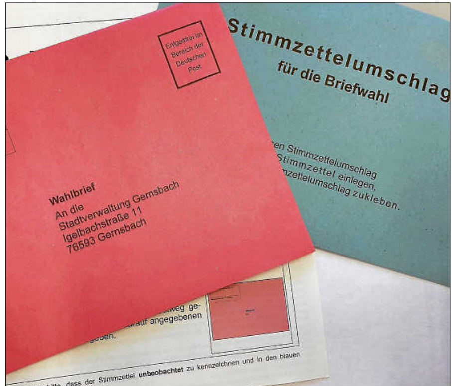
Die Wahlunterlagen wurden bereits versandt.

Der Wahlschein kann beim Bürgerbüro der Stadt Gernsbach, im Rathaus, Igelbachstr. 11, 76593 Gernsbach, Mail: buergerbuero@gernsbach.de , bis Freitag, 24. September 2021, 18:00 Uhr beantragt werden. Sie können die Erteilung des Wahlscheines schriftlich oder persönlich bei der Gemeindebehörde beantragen. Die Schriftform gilt auch durch Telegramm, Fernschreiben, Telefax, E-Mail oder durch sonstige dokumentierbare elektronische Übermittlung als gewahrt. Eine telefonische Antragstellung ist unzulässig. Wer für einen Dritten, auch für einen nahen Angehörigen oder den Ehegatten, Briefwahl beantragt, muss eine Vollmacht