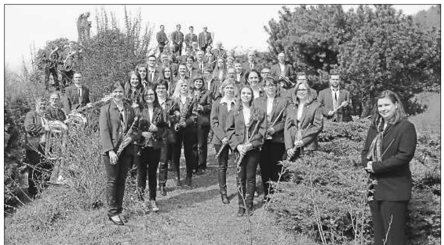
Der Musikverein Orgelfels Reichental freut sich auf sein Publikum.

Nach langer, coronabedingter Pause, möchte der Turnverein Reichental nach den Sommerferien (ab 13.09.2021), unter Einhaltung des aktuellen Hygienekonzeptes, wieder mit dem Übungsbetrieb starten. Unser breitgefächertes Angebot mit den verschiedenen Abteilungen findet ihr auf unserer Homepage www.tv-reichental.de . Alle Übungsleiter/innen stehen in den Startlöchern und freuen sich auf viele bekannte Gesichter. Auch Neueinsteiger sind herzlich willkommen.