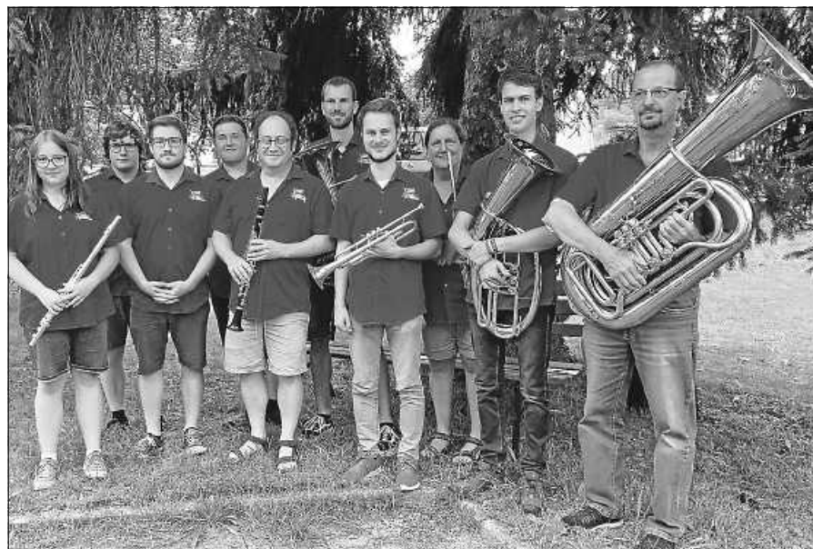
Ensemble des Vereins für die Konzertreise nach Italien.

Auch wenn es nicht ganz einfach ist in der Ferienzeit ein Ensemble für eine solch weite Konzertreise zusammenzustellen ließ es sich der Musikverein nicht nehmen, sein Versprechen aus dem Jahr 2010