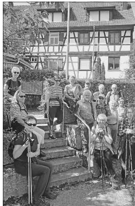
Kurze Rast der Mittwochswanderer.