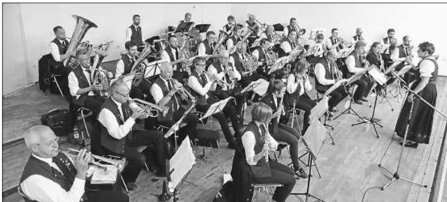
Kurkonzert der Stadtkapelle Gernsbach.