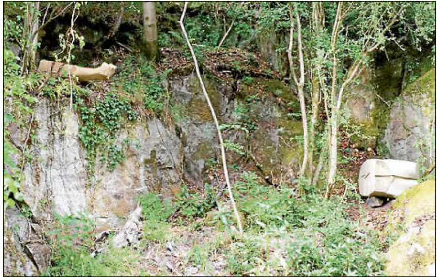
Voré Steinschlag 2011 Weilerer Sandstein

Bei den Führungen gilt eine besondere Aufmerksamkeit gerade den Kunstwerken, die verborgen von der Natur sind und somit von den Besucher*innen entdeckt werden müssen, wie z.B. Steinschlag des Künstlers Voré. Diese Arbeit, bereits 2011 im hinteren Teil des Kunstweges auf einem Felsen installiert, ist von den natürlichen Veränderungen seiner Umgebung teilweise verdeckt. Zentrale Themen in den Skulpturen von Voré sind anthropomorphe Fragmente, Torsi und Gliedmaßen, als verletzte, gebrochene, figurative Objekte zu