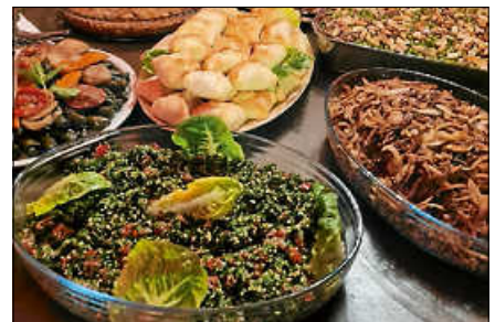
Das H10 freut sich auf viele Interessierte zum kulinarischen Abend.

Die Teilnehmerzahl ist begrenzt, daher bitte eine Anmeldung vorab an Lisa.knupfer@gernsbach.de ; es wird ein Unkostenbeitrag von 10€ erhoben. ■