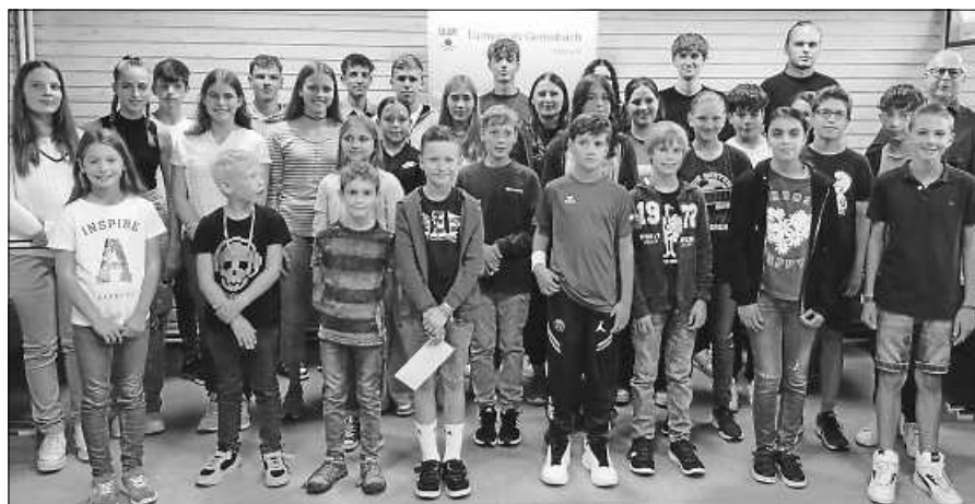
Der TV Gernsbach zeichnete erfolgreiche Sportler/innen aus.