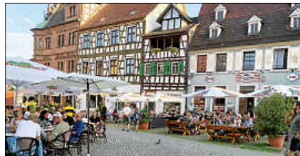
Gut besuchte Gastronomie an den vergangenen Samstagen mit Livemusik.