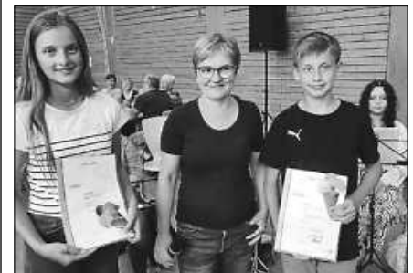
Herzlichen Glückwunsch an die Absolventen des JMLA Junior.

Gemeinsam mit Jugendlichen des Musikvereins Hilpertsau haben in diesem Jahr zwei Musikschüler des Musikvereins Orgelfels Reichental das Jungmusikerleistungsabzeichen Junior absolviert. Nach ca. sechswöchiger Vorbereitung in Theorie, Rhythmik und Gehörbildung haben sie im April die Prüfung abgelegt.