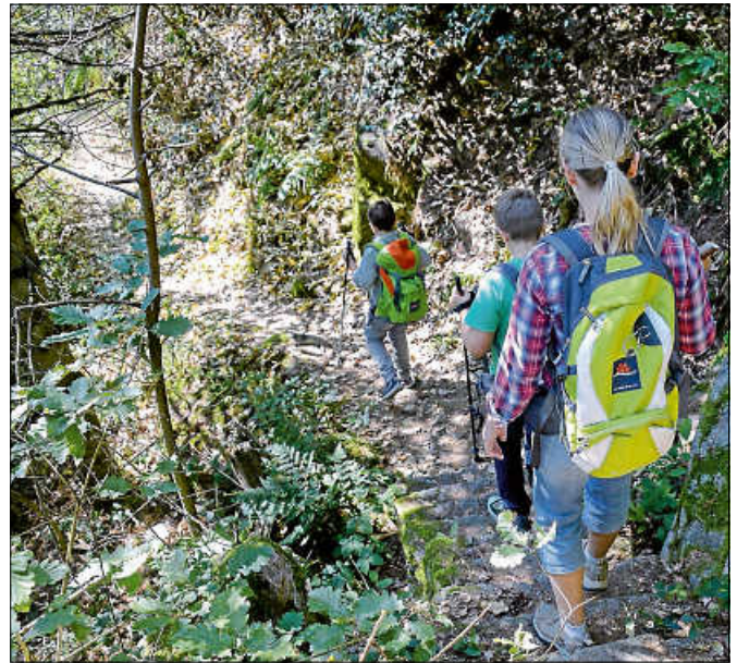
Unterwegs auf dem Sagenweg.

Die kostenfreie Tour ist ca. 4 km lang und dauert etwa 2,5 Stunden. Eine Anmeldung bei der Touristinfo Gernsbach unter 07224 644446 oder touristinfo@gernsbach.de ist erforderlich. ■