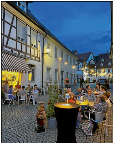
'Savoir-Vivre!' am Pop-Up-Bistros JØLG.