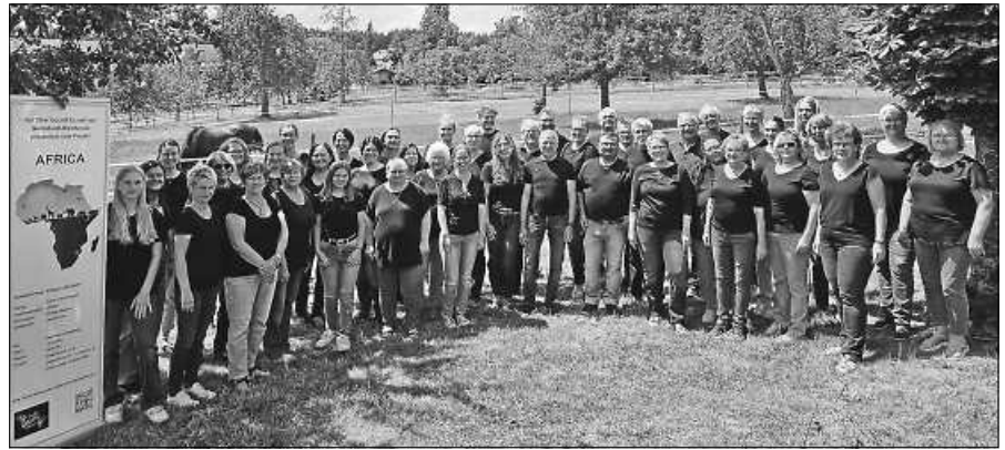
Der Projektchor des Uccelli Canori beim Probenwochenende in Göttelfingen

Informationen zu den Veranstaltungen finden Sie unter der Instagram- und