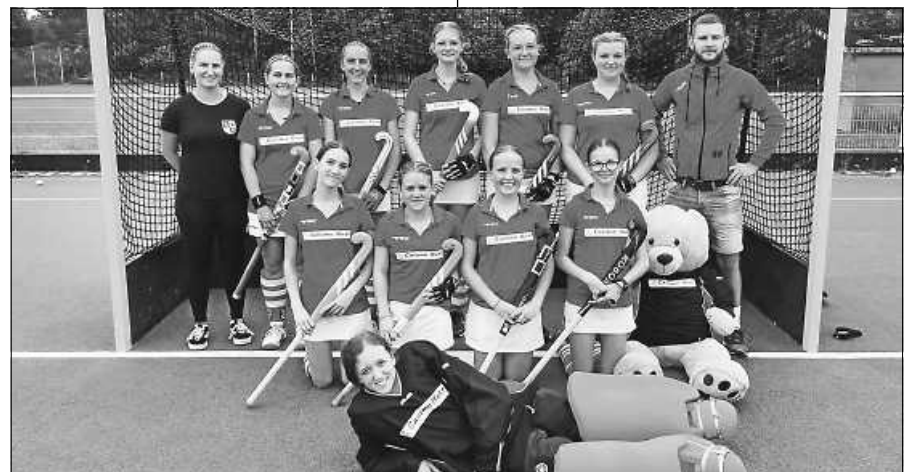
U16 mit den neuen Trikots von Casimir Kast.

Am Samstag, 12.08.2023 hat der KDFB Gernsbach für alle interessierten Mitglieder einen gemeinsamen Museums-