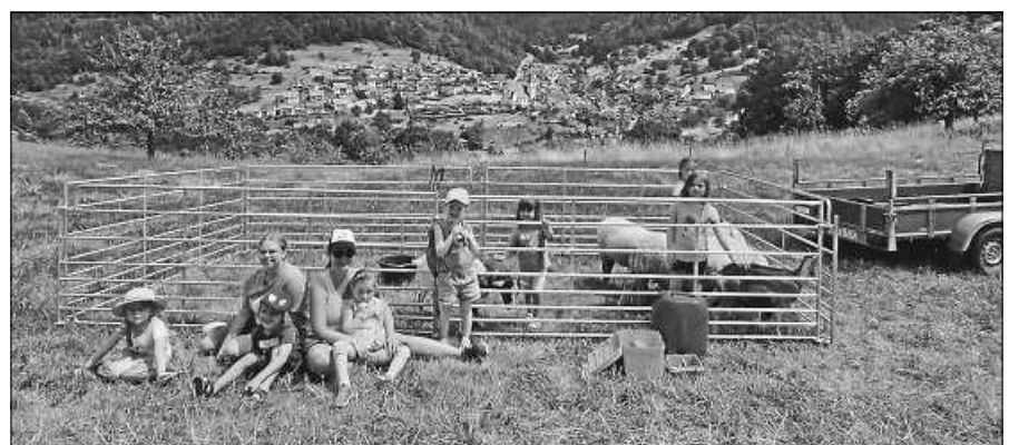
Tierwanderung in Reichental