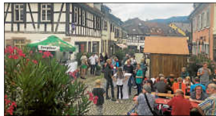
Lounge-Musik sorgt am Donnerstagabend für Unterhaltung.