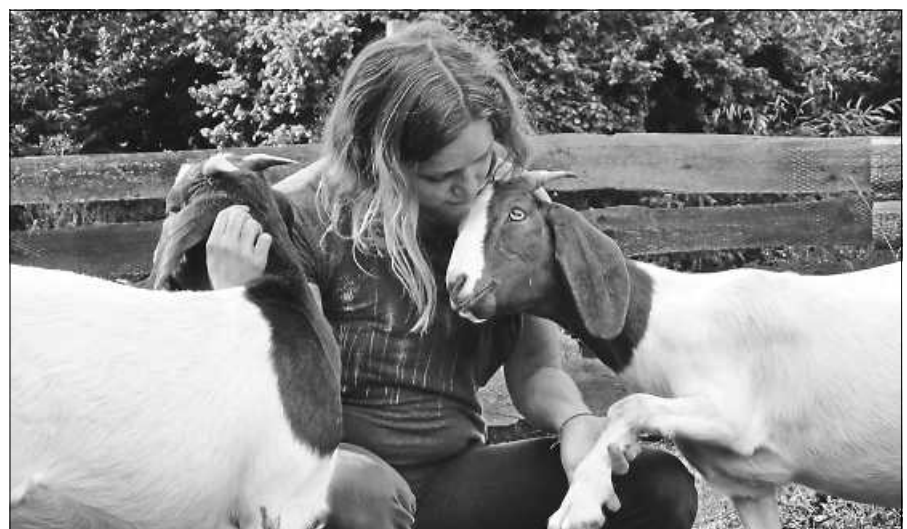
Mit den Ziegen vom Weidenhof kuscheln.