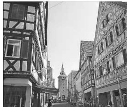
Die Schillerstadt Marbach gehört zum Ausflugsprogramm des Handwerkervereins am 3.10.23.

Eine telefonische Anmeldung bei unserem Vorstand Dieter Hutt, 0176 97909396, ist hierzu zwingend erforderlich. Nach erfolgter Anmeldung bitten wir euch oben genannte Beträge auf das Konto des Handwerkervereins Staufenberg, IBAN DE 16 6655 0070 0060 4556 49, im Voraus zu überweisen.