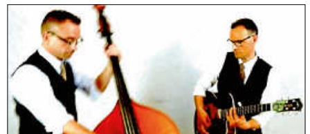
Duo Lagerfeld verwöhnt am Samstagabend auf dem Altstadtbuggel mit Jazzmusik.