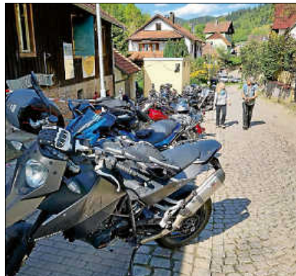
Archivbild: Fuhrpark beim Sägmühlfest

Fahrt durch den Schwarzwald. Hierzu sind alle Motorradfahrer und Motorradfahrerinnen herzlichst eingeladen. Am Samstagabend rockt ab 20.30 Uhr die Murgtäl Band Bulletproof die Sägmühle. Die junge Cover-Band mit sechs Musikerinnen und Musikern aus dem Murgtal sorgt mit fetzigen Songs von Rock über Punk-Rock für gute Laune. Im Clubhaus wird ein Barbetrieb eingerichtet. Am Sonntag lädt der MCO ab 10 Uhr zum Frühschoppen ein, und nachmittags bietet die Kaffeebar eine große Kuchen- auswahl. Leckeres vom Grill und weitere Speiseangebote werden während der gesamten Festdauer angeboten. Zum Festausklang am Sonntagabend gibt es ab 18 Uhr noch einmal Live- Musik mit den „Obertsroter Gammlern“, drei Jungs aus den Reihen des MCO- Nachwuchs, die mit Coversongs für beste Unterhaltung sorgen. Aufbauzeiten für MCO-Mitglieder: Frei- tag, 24.4., ab 14 Uhr sowie am Samstag- vormittag ab 9 Uhr.