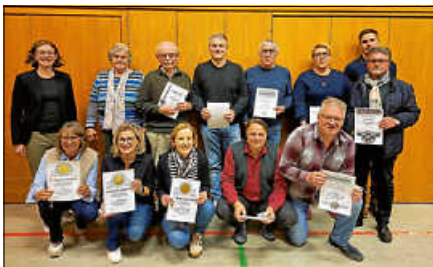
Die Geehrten des Turnvereins Lautenbach.