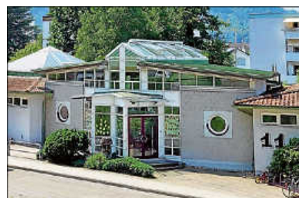
Die Kita Fliegenpilz lädt zu einem Nachmittag der offenen Tür ein.

und Kindergarten zu vermitteln. Das Kita-Team steht für weitere Fragen gerne zur Verfügung. ■