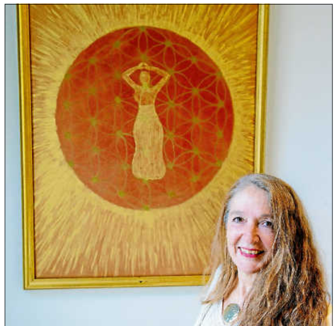
Erlebnisabend im MEDICLIN Reha-Zentrum.

tere Auskünfte unter: Telefon 07224 992 630, E-Mail: www.reha-zentrum-gernsbach.de . ■