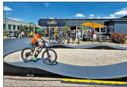
Neuer Pump-Track-Testparcours im SOMO-Fahrradgeschäft.