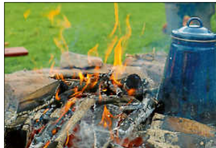
Kochen am Lagerfeuer.

Um Anmeldung wird gebeten unter www.infozentrum-kaltenbronn.de/kalender (Telefon 07224 – 655197, E-Mail: info@infozentrum-kaltenbronn.de ). ■