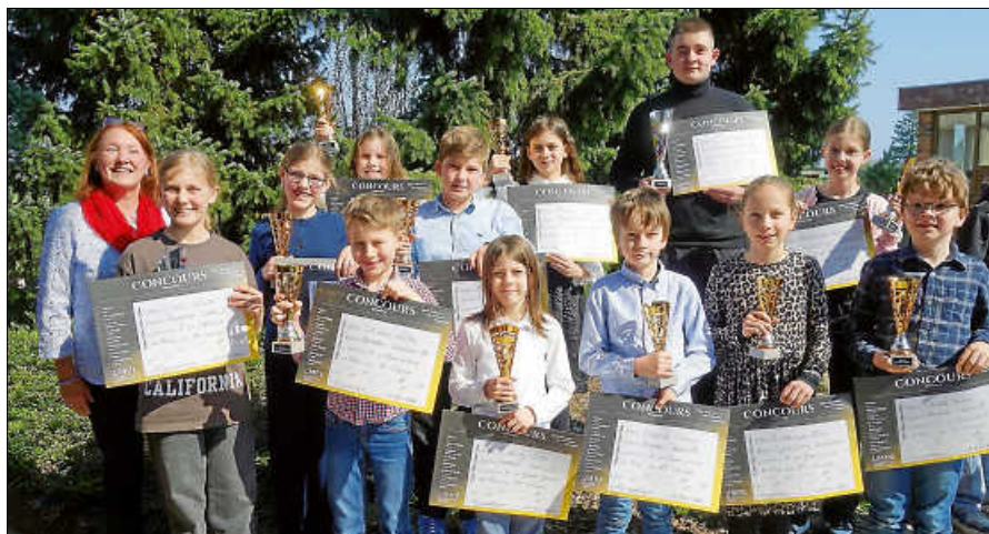
Preisträgerinnen und Preisträger in der Kategorie Keyboard und Akkordeon Solo.