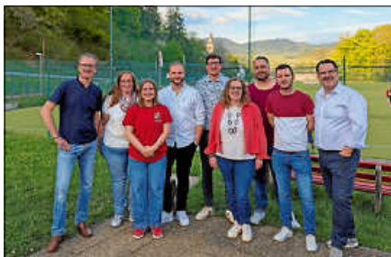
Das bisherige & neue Vorstandsteam des HCG.

Inhaltlich prägte vor allem ein Zukunftsthema den Abend: der geplante Platzneubau. Dabei sollen sowohl das Clubgelände als auch die Kunstrasenanlage umfassend erneuert werden. Der Start des Projekts ist für 2027 geplant. Um dieses Vorhaben frühzeitig zu unterstützen, hat der Verein eine Spendenaktion gestartet: Ab sofort können Unterstützerinnen und Unterstützer unter www.hcg-spenden.de symbolisch ein Stück vom Platz erwerben und damit einen direkten Beitrag zur Weiterentwicklung des Hockeystandorts Gernsbach leisten.