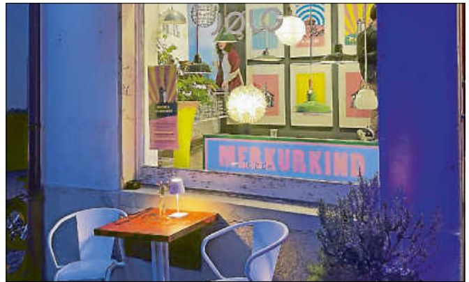
Studio JØLG während der abendlichen Öffnung einer vergangenen Ausstellung.

Im Anschluss ist die Ausstellung regelmäßig mittwochs und freitags jeweils von 10 bis 18 Uhr während der üblichen Öffnungszeiten des Studios zugänglich. ■