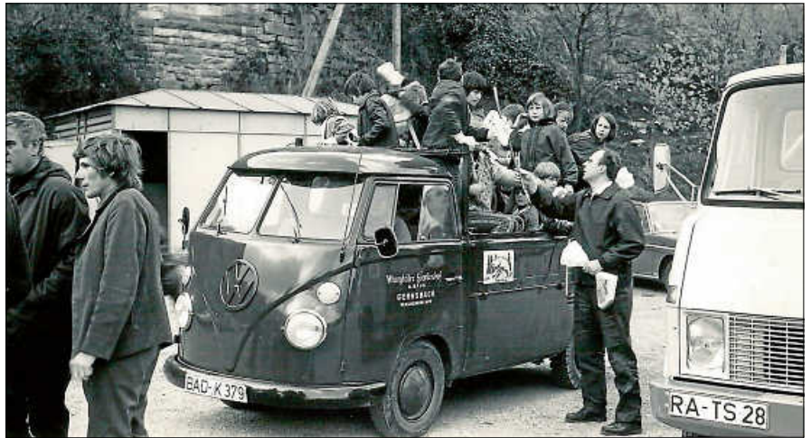
Näheres hierzu s. Rubrik Dorfgemeinschaft Scheuern.

Am Samstag, 25. April, startet die Dorfgemeinschaft in Zusammenarbeit mit dem Scheuerner Faschnachtsclub und dem Grundschulförderverein eine Waldputzaktion auf Scheuerner Gemarkung.