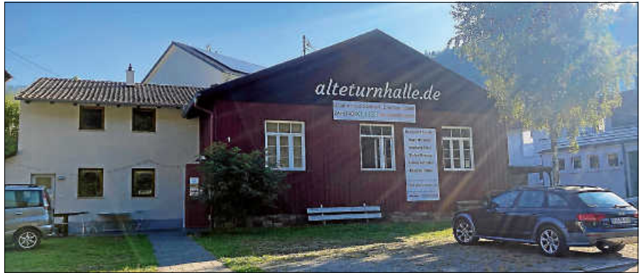
Die alte Turnhalle an den Bahngleisen.