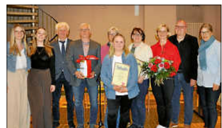
Ehrungen beim TV Reichental

Im Anschluss an die Versammlung wurden Bilder aus dem TV-Archiv von Holger Kern präsentiert.