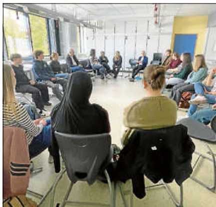
Zeitzeugen der Demokratie im Goethe Gymnasium.