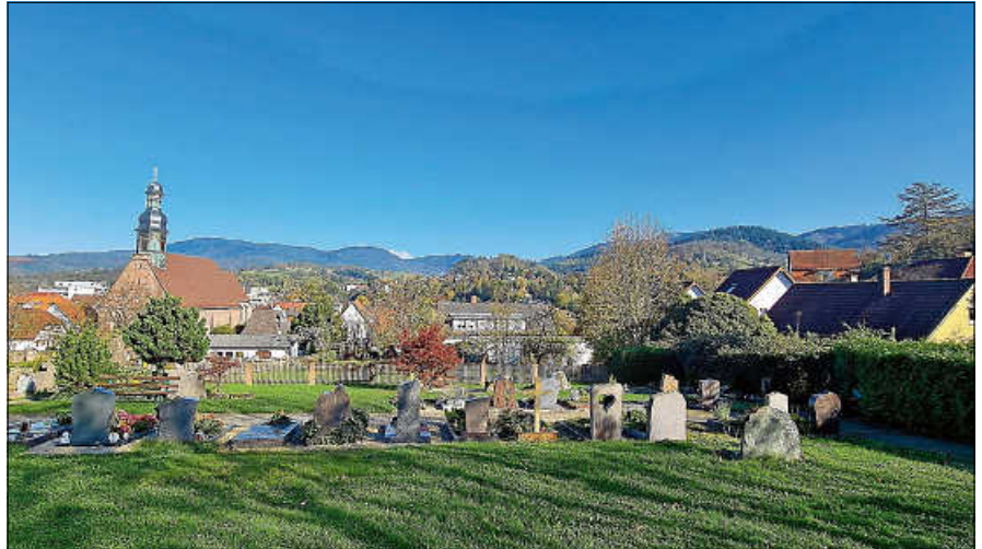
Blick auf den Evangelischen Friedhof in der Kernstadt.

Ein weiterer zentraler Baustein ist die Prüfung einer möglichen Übertragung der Friedhöfe in der Kernstadt an die jeweiligen Kirchengemeinden. Ziel ist es, Zuständigkeiten klarer zu bündeln und die Organisation effizienter zu gestalten.