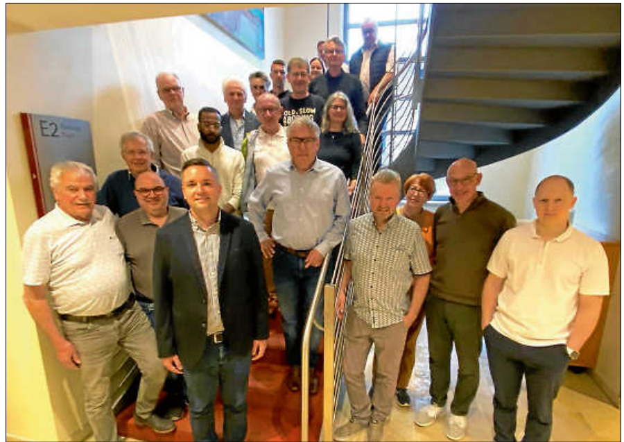
Der Gemeinderat berät sich in seiner Klausurtagung intensiv über den städtischen Haushalt.