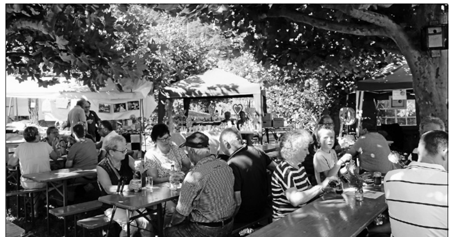
Im Schatten der Platanen ließ es sich gut aushalten!

Nicht nur kulinarisch wurde etwas geboten. Ein ansprechendes Rahmenprogramm rundete das Fest ab. Der Musikverein Hilpertsau unterhielt zur Mittagszeit mit vielen bekannten Wei-