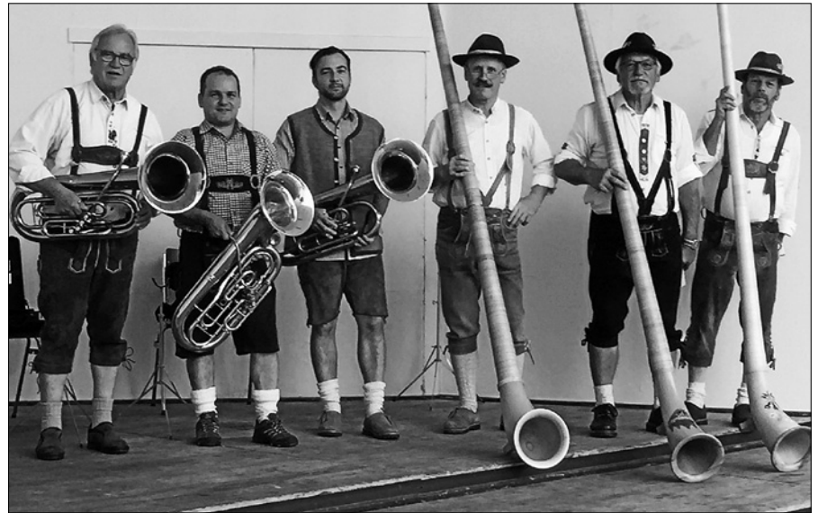
Die Alphornbläser und das Eichbaum-Trio freuen sich auf Ihren Besuch.