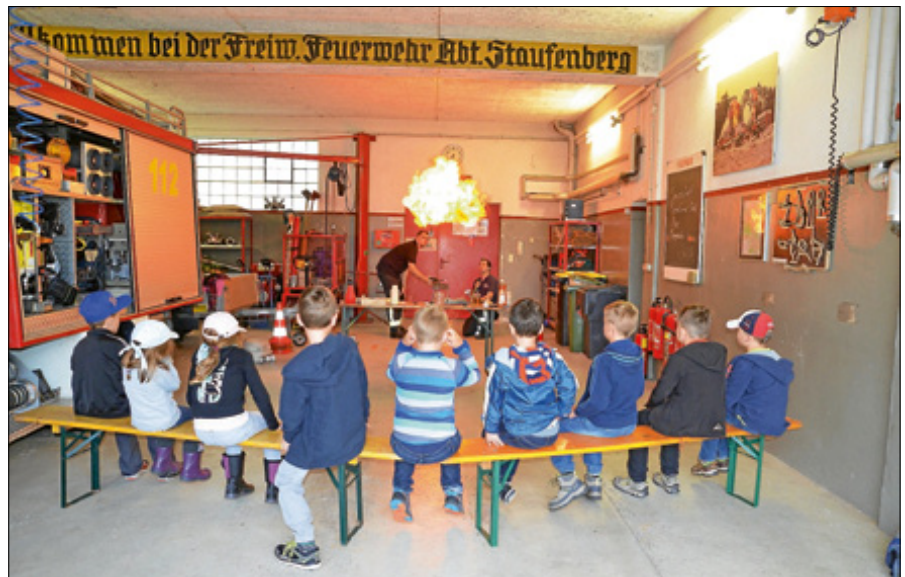
Faszinierte Kinder bei der Feuerwehr.

- nur noch sehr wenige Karten übrig - Hast Du Lust auf dem Zauberteppich zu fliegen? Dann lasst uns an diesem Nachmittag gemeinsam entspannen. Eine spannende Phantasiereise, Entspannungsübungen und Massagen warten auf Dich. Kinder 6 - 10 Jahre von 15.30 - 17 Uhr im MediClin Reha-Zentrum, Langer Weg 3, Entspannungsraum