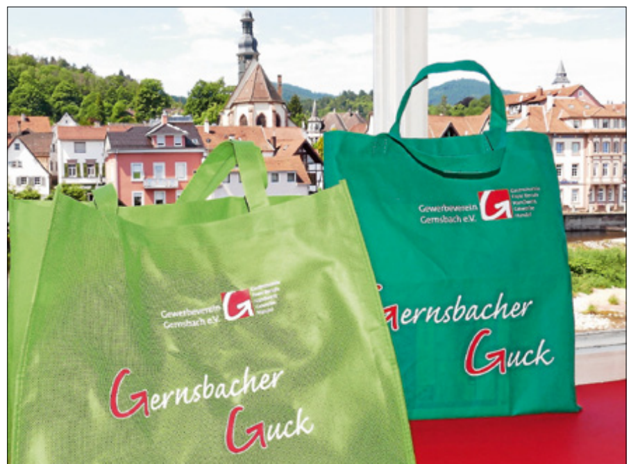
Einkaufen mit der Gernsbacher Guck - auch am Sonntag, 1. September, möglich.

Viel Spaß beim Shoppen und vergessen Sie nicht Ihre Gernsbacher Guck! ■