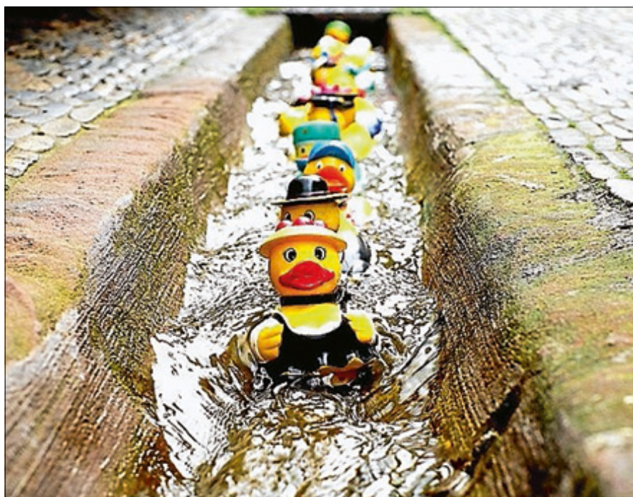
Das schönste Sommerfoto gewinnt.

Doch nicht nur dem ersten Platz winkt ein Preis, auch die Fotografinnen und Fotografen, deren Bilder es in die engere Auswahl geschafft haben, werden mit einem kleinen Preis und der Veröffentlichung im Stadtanzeiger und auf der Homepage der Stadt Gernsbach belohnt. ■