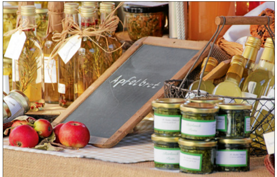
Einheimische Produkte und Köstlichkeiten zum Probieren und Erwerben.

Der Ostpreußenweg wird komplett erneuert und wegen der umfangreichen Sanierungen gesperrt. Wir bitten um Verständnis.