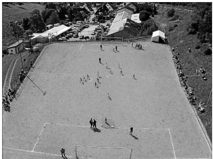
Sportfest FC Auerhahn Reichental, 30.08. bis 01.09.

Beim Mittagessen am Sonntag wird ab 12.00 Uhr der Musikverein Orgelfels in bekannt kurzweiliger und stimmungsvoller Art und Weise die musikalische Unterhaltung übernehmen.