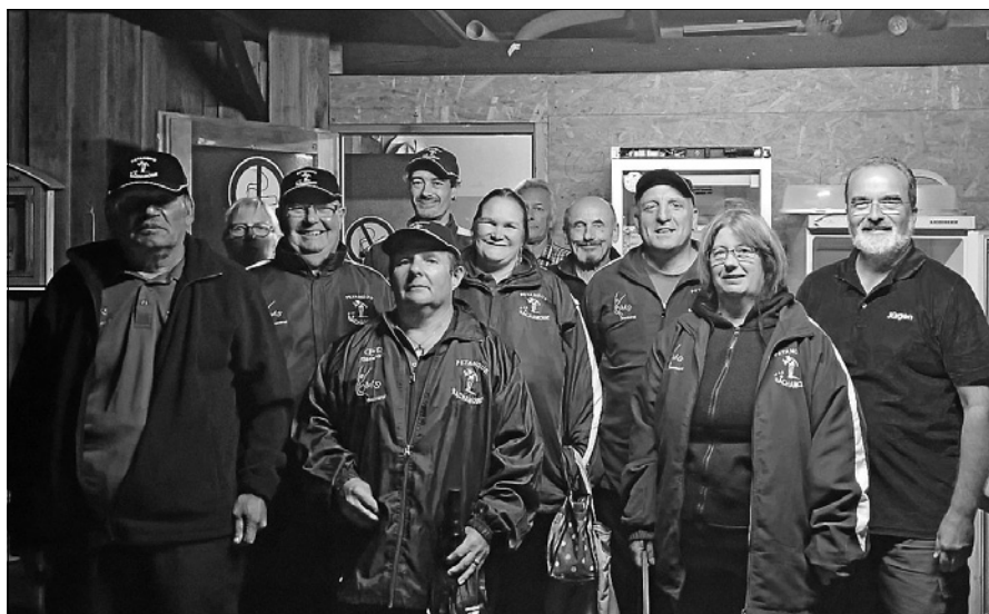
Gäste aus Baccarat.