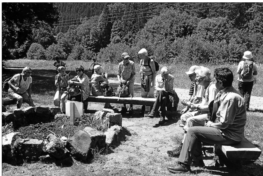
Auch Pausen müssen sein.