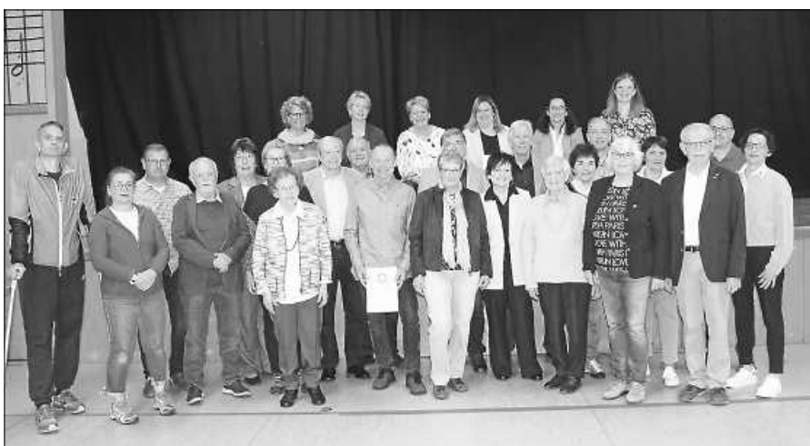
Ehrungen beim Turnverein Lautenbach.