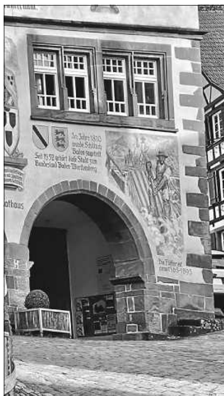
Ausflug der Murgflößer.