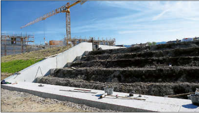
Die Murgstufen sind aktuell im Bau.