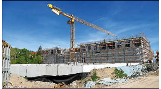
Hier entstehen ein Edeka-Markt und Wohnraum.