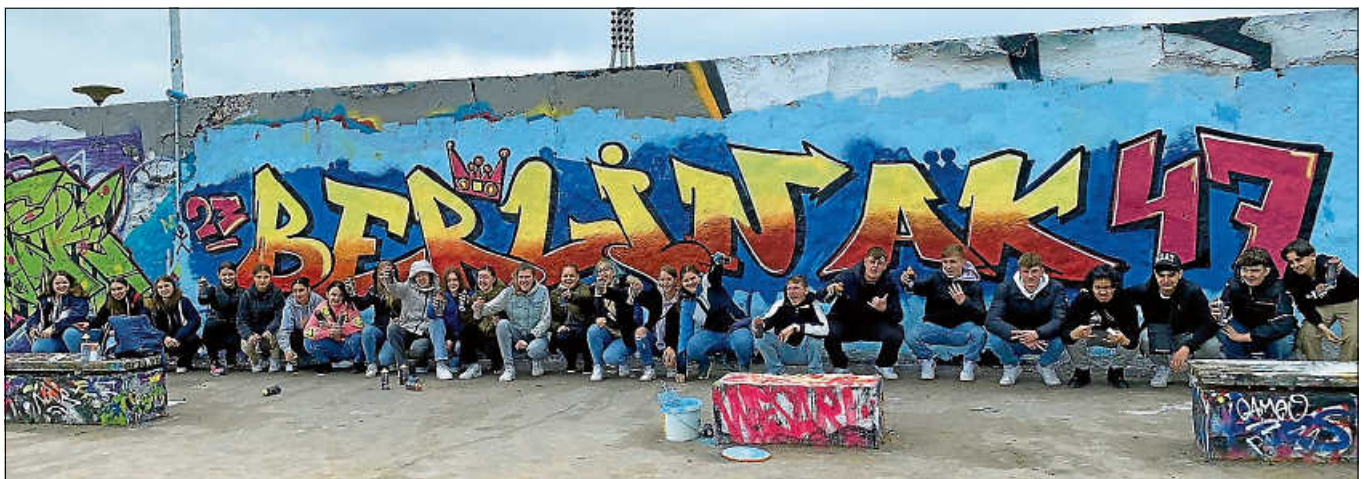
Klassenfahrt der Realschüler.

Auch an kulturellen Highlights mangelte es nicht. Ein unvergessliches Erlebnis war sicher die Streetart-Tour mit einem Berliner Künstler, der anhand von Beispielen im Kiez Friedrichshain die Stile und Geschichte von Streetart veranschaulichte. Das Gemeinschaftsprojekt der 9b kann auf dem Bild bestaunt werden. Mit dem selbst produzierten Video über einen selbst gewählten Kiez bleibt außerdem eine Erinnerung an eine unvergessliche gemeinsame Woche in Berlin. ■