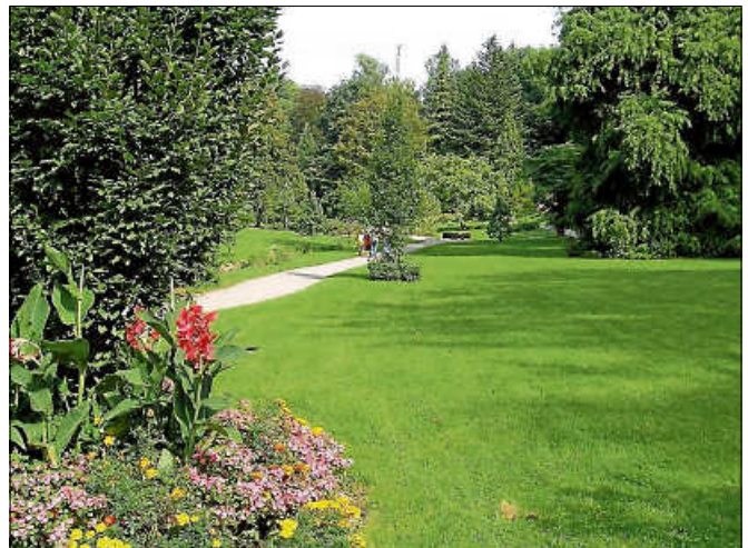
Der Gernsbacher Kurpark.

Beginn: 9.05 Uhr nach Ankunft der Stadtbahn. Treffpunkt: Tourist-Info Gernsbach / S-Bahnhaltestelle Gernsbach-Mitte.