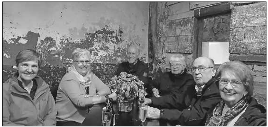
Gemütliche Runde beim 1. Hock in der Zehntscheuer.

Vom 2. - 4. Juni bieten wir im Igelbad Gernsbach einen Crash Kurs zum Erwerb des Rettungsschwimmabzeichens in 3 Tagen an. Weitere Informationen zum Kurs sowie die Möglichkeit zur Anmeldung sind auf unserer Homepage gernsbach.dlrg.de zu finden. Neben dem Crash Kurs bieten wir auch die Möglichkeit, das Rettungsschwimmabzeichen in 4 Wochen zu erwerben. Alle Informationen und Termine sind ebenfalls auf unserer Homepage zu finden.