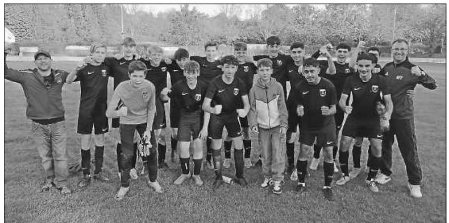
Die C-Jugend feiert den Einzug ins Bezirkspokal-Finale.

Ausgebremst durch Corona und deshalb mit etwas Verspätung, konnte nun der Jubiläumsausflug des Vereins „Gernsbacher Murgflößer.“ stattfinden. Bei schönstem Wetter machten sich die Hobby-Flößer auf den Weg zur Flößerstadt Schiltach. Erste Station war ein