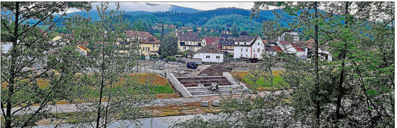
Blick von der gegenüberliegenden Straßenseite.