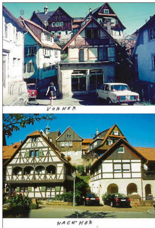
Waldbachstraße früher und heute.

Die Stadt Gernsbach „30 Jahre Sanierung Waldbachstraße“, die Stadtkapelle Gernsbach 160-jähriges Bestehen und der MV Forbach 180-jähriges Bestehen. ■