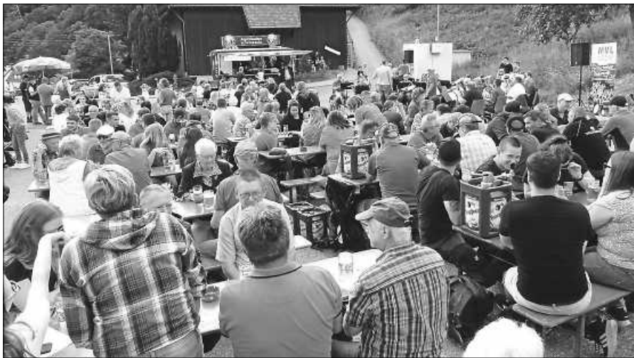
Vatertag 2022: Schönes Wetter, guter Besuch, tolle Stimmung.