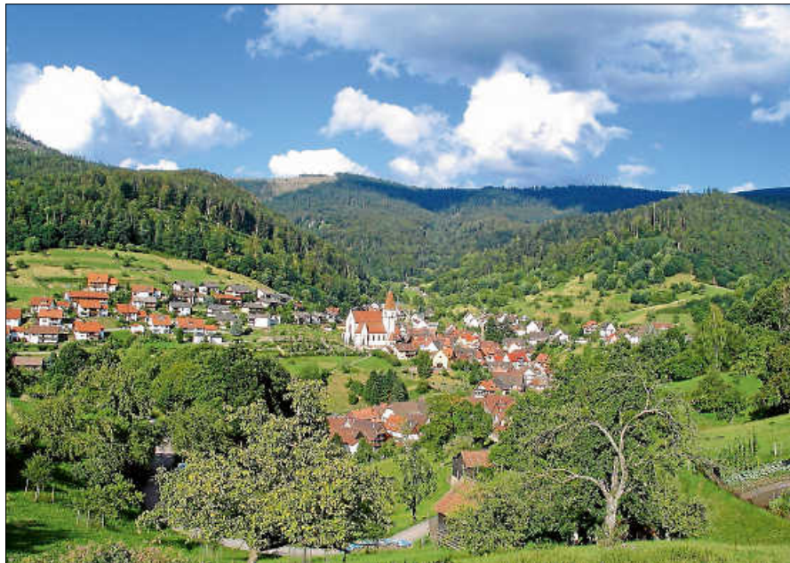
Blick auf Reichental.

Kernstadt: 26. September, 18 Uhr, im Restaurant Michelangelo ■