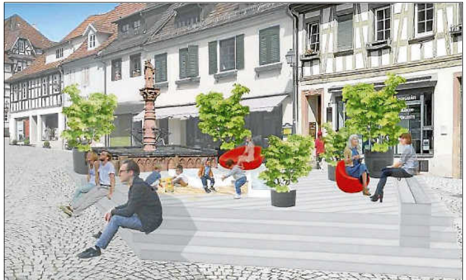
Visualisierung Holzdeck um den Marktbrunnen.

Beauftragt für die Konzeption und Moderation wurde jetzt das Planungsbüro ‚citiplan‘, das sich bereits durch die drei vorangegangenen Beteiligungsformate zur Gestaltung der historischen Altstadt in Gernsbach bewährt hat. Im Ergebnis zu den Haushaltsplanberatungen für den Haushalt 2023 wurde durch den Gemeinderat im Januar beschlossen, die Verkehrsführung der Altstadt in einem öffentlichen Prozess erneut zu begleiten. Hierzu sollten alle Betroffenen und Interessierten (Wohneigentümer, Handel und Gewerbe) eingeladen werden, um die Akzeptanz der Fußgängerzone sowie des Rahmenplans insgesamt zu erhöhen. In einer nachfolgenden Diskussion im Februar 2023 hat sich der Gemeinderat in seiner nichtöffentlichen Sitzung dafür ausgesprochen, statt einer Evaluation eine weitere Stufe der Bürgerbeteiligung zum Rahmenplan Altstadt und zur Verkehrsführung durchzuführen. Die Fraktion der Freien Bürger hat hierfür einen Vorschlag erarbeitet, welcher u. a. vorsieht, dass das bereits beim Rahmenplan Altstadt federführende Büro ‚citiplan‘ den Prozess moderiert. Auf Basis dieses Vorschlags hat das Büro ‚citiplan‘ beiliegendes Angebot übermittelt. Das Angebot beinhaltet zwei Bürgerwerkstätten, in denen zunächst der jeweilige