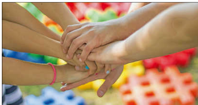
Geben und Nehmen: Ehrenamt bereichert unsere Gesellschaft.