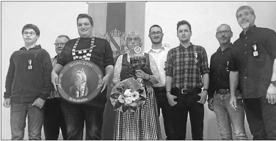
Die erfolgreichen Schützen.