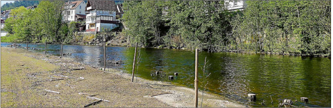
Für die ökologische Balance sorgen Fischunterstände in der Murg und angepflanzte Schwarzerlen, die auch als Leitlinie für Fledermäuse gelten.