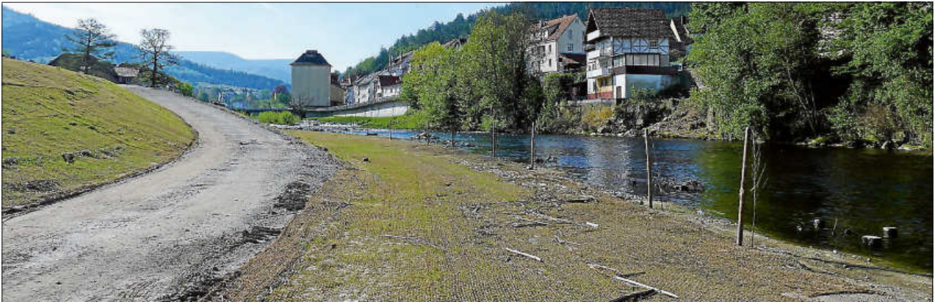
Spazierweg entlang der Murg.