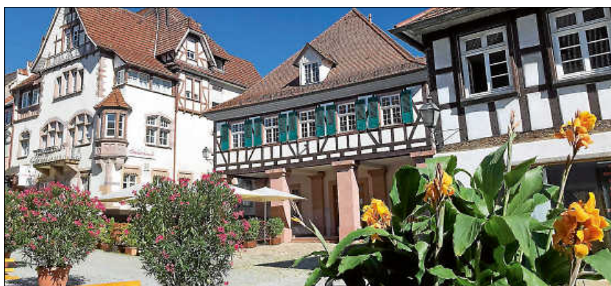
Besucherinnen und Besucher können bei verschiedenen Veranstaltungen im Rahmen des 'AltstadtLeben' die besondere Atmosphäre in Gernsbach genießen. Alle Veranstaltungstermine finden sich unter: www.gernsbacher-schaufenster.de/veranstaltungen .