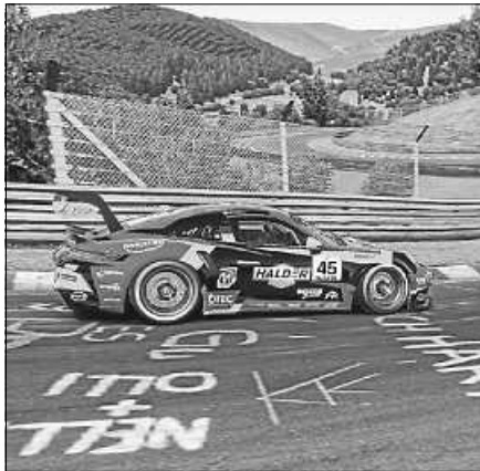
992 GT3 Cup Porsche auf der Nordschleife.