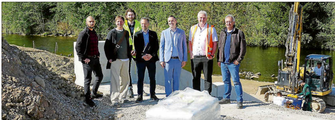
Vertreter der beteiligten Behörden und Fachfirmen beim Pressetermin zum Baustart der Murgterrasse.