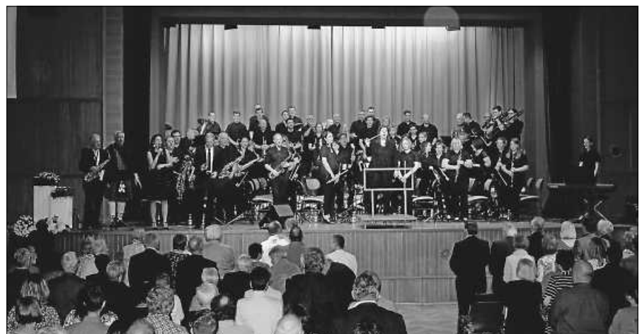
2019 konnten wir das 20-jährige Dirigentenjubiläum mit einem Konzert feiern.