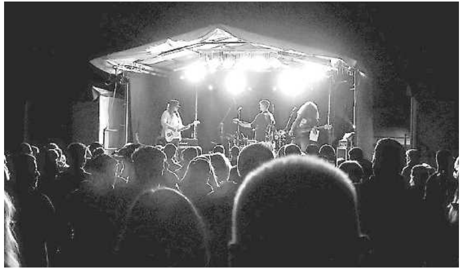
Vier Bands sorgen am 17.05.2023, ab 20 Uhr für Stimmung.

Am 17.05.2023 ist es wieder so weit und das Open-Air-Festival „MAY, I ROCK“