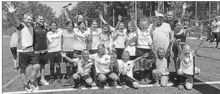
C-Juniorinnen gewinnen ihr eigenes Turnier.

C-Juniorinnen gewinnen Heimturnier Am 24. Juli traten die Juniorinnen des SV Staufenberg erstmals als Gastgeber eines Turniers an. Es nahmen folgende