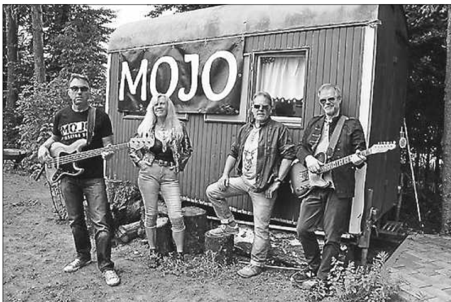
Die Gruppe „Mojo“ beim Schwimmbadfest in Reichental.

Der Sonntagvormittag beginnt ab 11.30 Uhr mit Mittagessen, dieses Jahr zum ersten Mal mit Schnitzel und Pommes. Und natürlich erwartet Sie am Sonntag wieder die Kaffee- und Kuchenbar. Die DLRG Ortsgruppe Reichental freut sich auf Ihren Besuch.