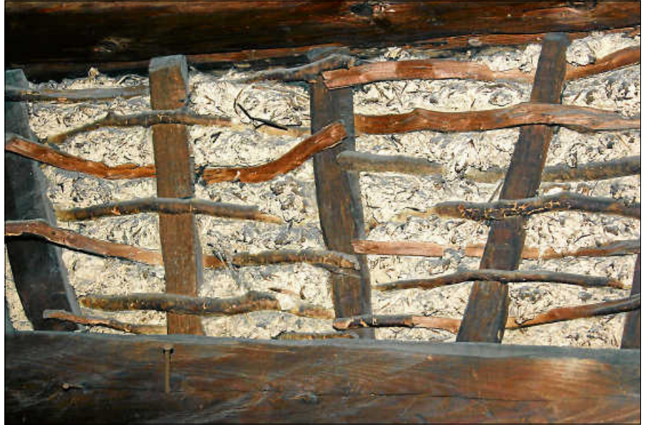
Bei den Führungen durch die Zehntscheuern werden die Techniken des alten Bauhandwerks sichtbar.

Ausführliche Zehntscheuer-Rundgänge werden nun im Rahmen der Sommerveranstaltungen des Projekts FreiRäume angeboten. Mitglieder des Arbeitskreises Stadtgeschichte Gernsbach führen in einem 1,5 Stunden langen Rundgang durch die verschiedenen Räume. Auf sicheren Holztreppen erhält man einen Eindruck der ausgedehnten Räume und kann dort Beispiele alten Bauhandwerks finden. Nach wie vor sind die Ausfachungen des Fachwerks mit Flechtwerk, Stroh und Lehm gut sichtbar. Auch Wieden, Haken und Holznägel sowie ein kompletter Aufzug für den Transport der