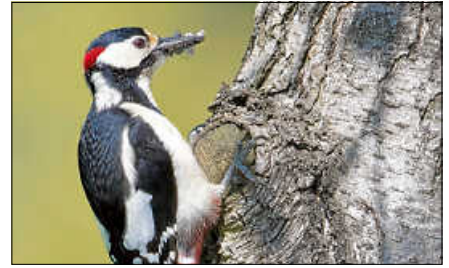
Buntspecht am Baum.

Weitere Informationen und Anmeldung unter www.infozentrum-kaltenbronn.de/kalender , Telefon 07224 – 655197. ■