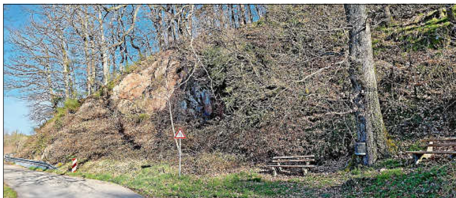
Die Lautenbacher Vereine sammeln gemeinsam Müll in Lautenbach.

Treffpunkt ist um 9 Uhr am Feuerwehrgerätehaus in Lautenbach (Steintalstr. 2). Mit mehreren Gruppen werden verschiedene Routen abgelaufen, Müll eingesammelt und entsorgt. Im Anschluss kann der Erfolg bei einem Getränk und Snack genossen werden. Helfen können alle die wollen. Jedoch kann die Aufsichtspflicht für Kinder nicht gewährt werden, diese können aber gerne zu-