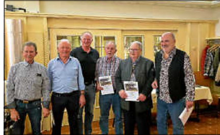
Ehrungen für 40 Jahre Mitgliedschaft im OGV Staufenberg.