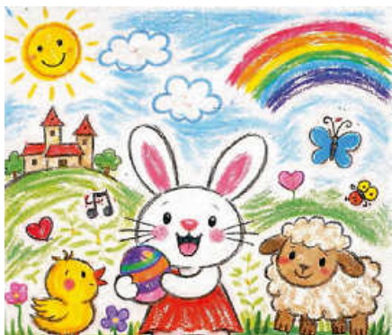
Malwettbewerb für Kinder.

M it der neuen Osteraktion ‚Gernsbach sucht den Osterstar‘ lädt