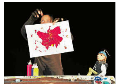
Werkstatt der Schmetterlinge.

Das Kulturamt empfiehlt, Veranstaltungstickets bequem und kontaktlos online unter www.reservix.de zu erwerben. Alternativ können die Tickets auch vor Ort bei der Touristinfo Gernsbach, Igelbachstraße 11, oder an der Tageskasse erworben werden. ■