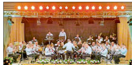
Frühjahrskonzert der Musikkapelle Hilpertsau Obertsrot.

Im Anschluss an das Konzert unterhält die Combo No. 5 alle Konzertbesucherinnen und Konzertbesucher und sorgt für einen stimmungsvollen Ausklang des Abends.