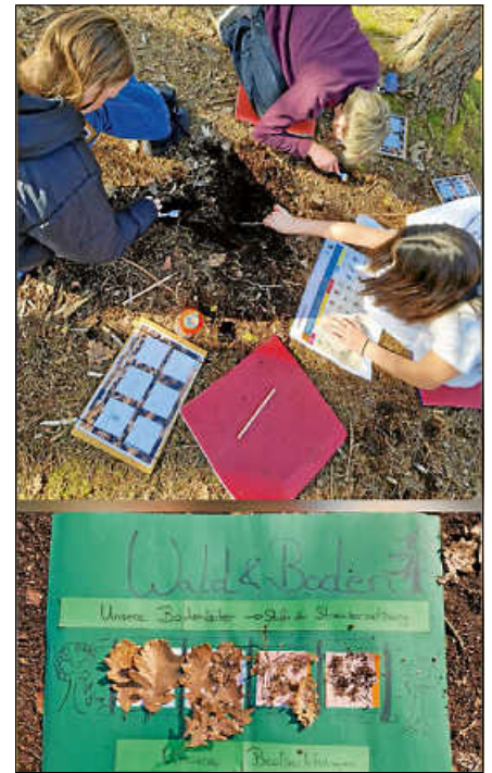
Eine etwas andere Lernkulisse: Die Schüler der 6b im Waldklassenzimmer.

Bevor es zurück in das Schulgebäude ging, bot das Spiel „Das große Krabbeln“ die Gelegenheit, die restliche Energie im Wald zu lassen. ■