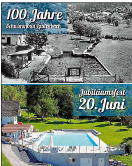
100 Jahre Schwimmbad Lautenbach.

SIL-Faschingstanz: Die Schwimmbadinitiative startete mit einem fulminanten SIL-Faschingstanz erfolgreich in das Jahr 2026. Ein besonderer Dank gilt dem Einsatz aller Tanzgruppen – aus Loffenau, Hörden und natürlich den eigenen Tanzgruppen aus Lautenbach vom Turnverein und der SIL.