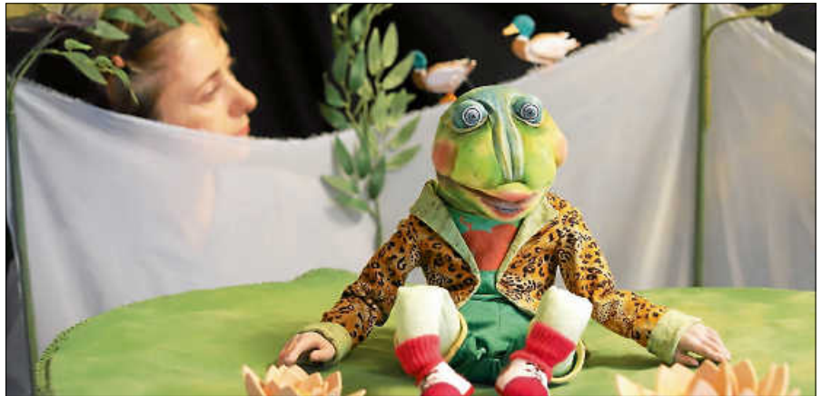
Der Wind in den Weiden.