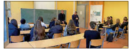
Thomas Hentschel (MdL) und Kai Whittaker (MdB) zu Besuch im Goethe-Gymnasium.

konzert des Soroptimist Clubs Bad-Herrenalb/Gernsbach für das Frauen- und Kinderschutzhaus statt. Tickets sind in der Bücherstube erhältlich.