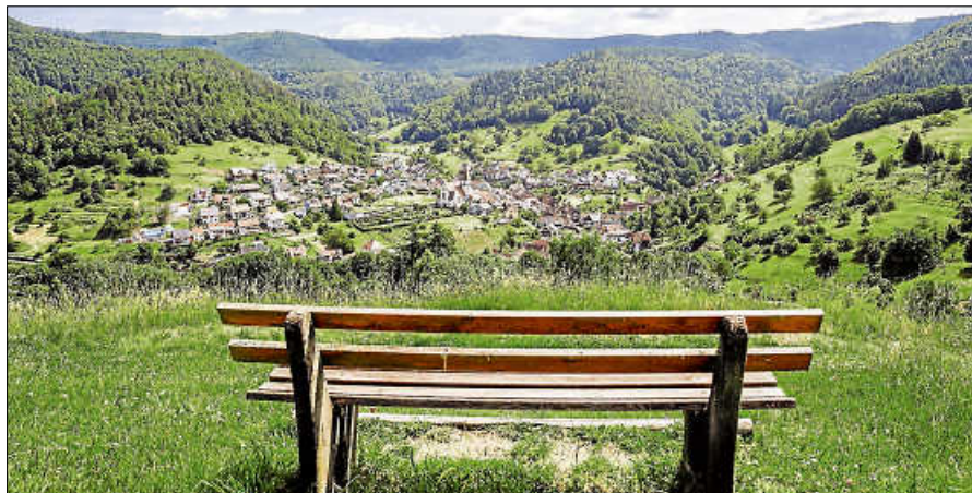
Blick auf Reichental und Umgebung.

Weitere Freiwillige sind herzlich willkommen. ■