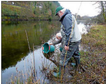
Aalbesatz in der Murg.

Exemplare, aus Fängen in den großen Flussmündungen an der Atlantikküste. Der Verein hofft, dass zumindest ein nennenswerter Teil des Besatzes nicht gleich von den räuberischen Bestandsfischen (zu denen auch ausgewachsene Bachforellen und Döbel zählen) oder von den Kormoranen gefressen wird, sondern sich wieder eine ordentliche Aalpopulation in der Murg entwickelt.