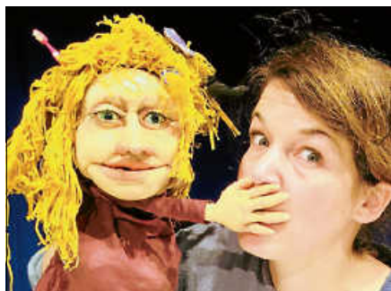
Bei Vollmond spricht man nicht.

„Die Sachenfinderin“ erzählt die Geschichte von Kari, einem kleinen Mädchen, welches in die Welt hinauszieht und nach unentdeckten Sachen, Kostbarkeiten und Schätzen stöbert – was für ein Abenteuer. Gespielt wird das Kinderstück am Mittwoch, 25. März, um 16 Uhr vom Figurentheater Jedelhauser aus Bad Waldsee.