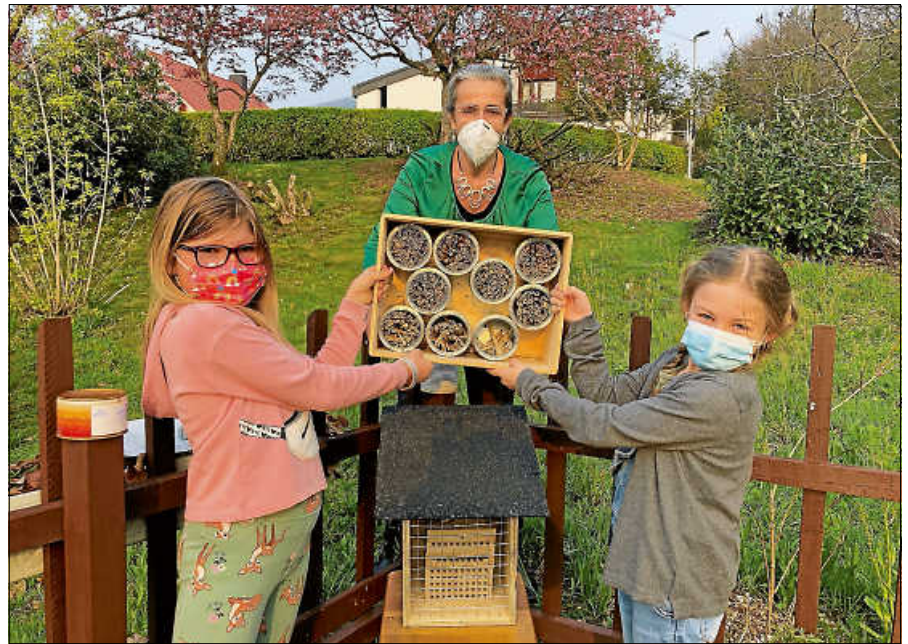
Der Schulgarten der Grundschule Staufenberg erwacht aus dem Winterschlaf.

Dort findet man in einer kleinen Ecke ein Insektenhotel, welches an dieser Stelle speziell für diese kleine Wildbienenart angebracht wurde. Täglich schlüpfen neugeborene Exemplare dieser Art aus der Brutkammer des Nistblocks und suchen dann meist gleich im Anschluss nach einer passenden Niströhre in dem Block. Direkt vor dem Wildbienenhotel findet man eine kleine Lehmpfütze. Diese wurde dort ganz gezielt angelegt, da die Rote Mauerbiene ihre Niströhren in der Regel mit Lehm verschließt, um so ihre Brut vor Feinden zu schützen. Leider können im Moment nur die Schüler