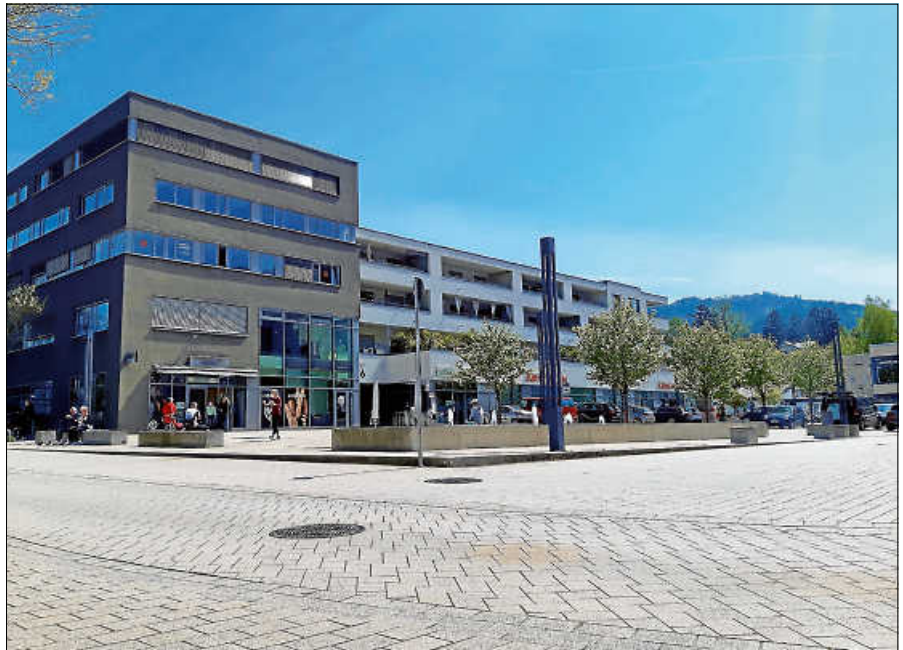
"Bummeln gehen" ist in Gernsbach bald auch online möglich.

Für Händler und Unternehmen sind die Ressourcen für die Pflege einer Homepage oft begrenzt. Die Plattform bietet - nicht nur zu Pandemiezeiten - eine Möglichkeit, Stammkundinnen und -kunden zu erreichen und neue Kundenschaft zu akquirieren. Auf der eigens für Gernsbacher Unternehmen geschaffenen Website kann sich jede/r Teilnehmer/in mit seinen bzw. ihren Produkten sowie Dienstleistungen vorstellen, diese bebildern und spezielle Hinweise beispielsweise zu Konditionen für