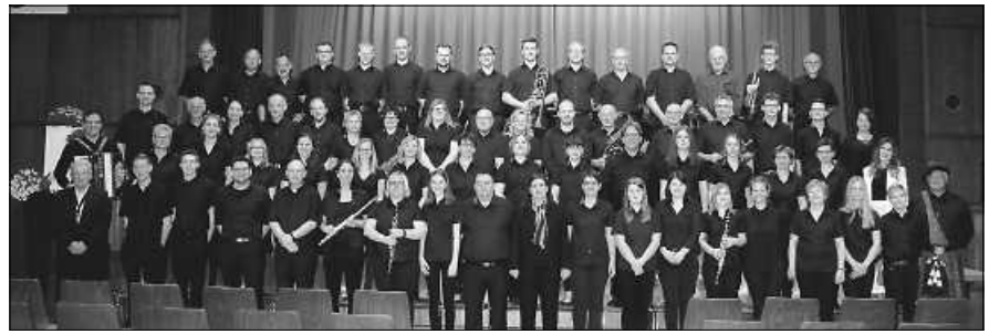
Musikverein beim Konzert INTakt 2019.