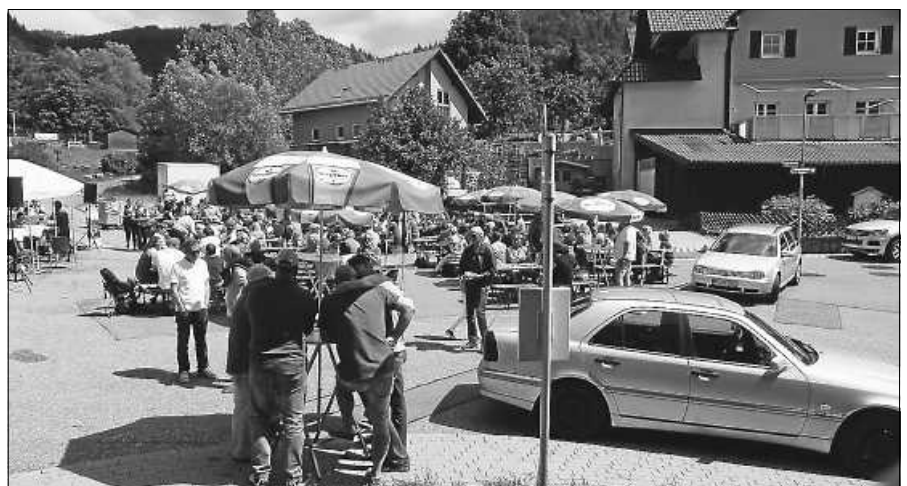
Leider auch 2021 nicht wie gewohnt ...

Der Turnverein Gernsbach erweitert sein Online-Angebot. Es wird inzwischen für fast alle Altersgruppen eine Online-Sporteinheit angeboten. Unseren Stundenplan sowie alle Ansprechpartner können Sie auf der Homepage www.turnverein-gernsbach.de oder über die App einsehen. Bei Fragen können Sie sich direkt an den Ansprechpartner des jeweiligen Angebotes wenden.