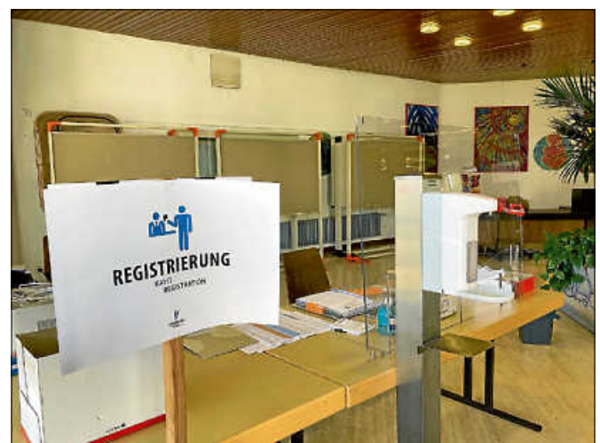
Die Impfstation in der Stadthalle Gernsbach.