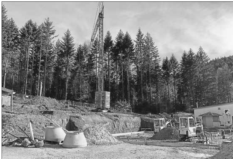
Vorbereitungen für den Rohbau der Auwiesenhütte.

Dennoch ist man im Sportverein nicht tatenlos, ganz im Gegenteil! Seit Anfang des Jahres ist man mit dem Jahrhundertprojekt "Auwiesenhütte" beschäftigt und kann bereits auf erfolgreiche und abgeschlossene Vorarbeiten und Tätigkeiten zurückblicken. Vor und nach dem Spatenstich im März hat sich rund um das Clubhaus einiges sichtbar verändert. Wer bereits die Gelegenheit hatte, um das Sportgelände zu wandern, werden die