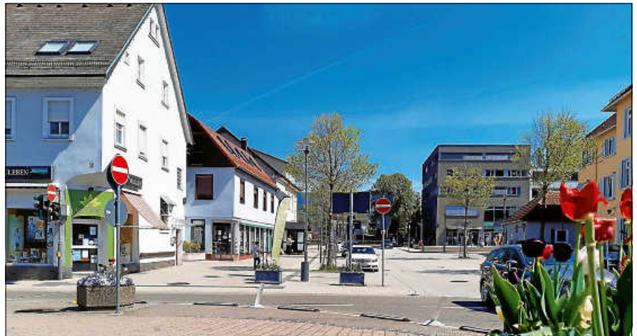
„Bummeln“ gehen ist auch in Gernsbach schon bald online möglich.

„Ich möchte viele Gewerbetreibende und Gastronomen dazu ermutigen, ihr Angebot auf dem virtuellen Marktplatz