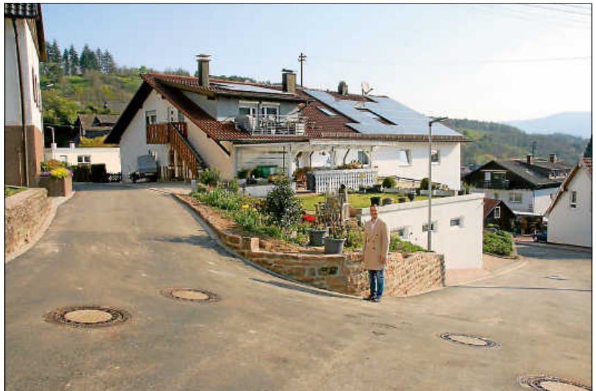
Bürgermeister Julian Christ freut sich über den planmäßig fertiggestellten Ausbau.

Um die Durchfahrt für die Anwohnerschaft auch in der Bauphase bestmöglich zu gewährleisten, erfolgte die Sanierung in zwei Teilabschnitten, beginnend im östlichen Teilabschnitt von der Alten Dorfstraße bis in den Rebweg. Nach Freigabe des ersten Bauabschnittes wurden die Bauarbeiten im west-