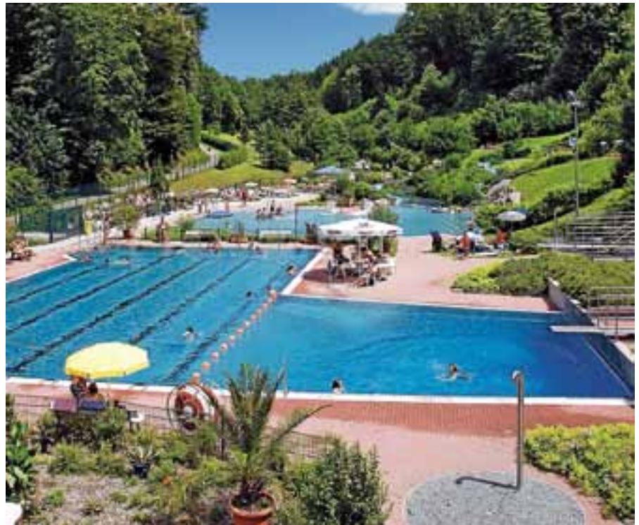
Die Freibadsaison beginnt mit der Eröffnung des Igelbachbads.

Wie in den vergangenen Jahren gibt es wieder eine Schlechtwetterregelung. Danach ist das Igelbachbad auch bei schlechtem Wetter täglich von 15 bis 19 Uhr geöffnet, allerdings kann der Betriebsleiter das Bad etwa bei Dauerregen oder großer Kühle auch früher schließen.