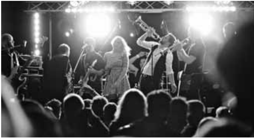
"Skandalous" live beim "May, I Rock"-Openair-Festival des MV Hilpertsau.

die Musiker jedoch nicht untergeordnet. Zu hören gibt es ausschließlich eigene Songs. Unverkennbarer Sound, packende Stimme und ein präziser Bläsesatz. Das ist „Skandalous“. Der diesjährige Co-Headliner ist der Lokalmatador des Line-Ups, kommen die Musiker und die Musikerin doch überwiegend aus Hilpertsau und Weisenbach. Die Musikrichtung bewegt sich zwischen Ska, Funk und Partymusik. Der diesjährige Headliner ist ein absolutes Highlight. Bereits vor einigen Jahren wurde das Publikum von einer jungen Band aus Rostock beim „May, I Rock“-Festival förmlich aus den Socken gerissen. In der Zwischenzeit hat sich viel getan. Die Band hat sich inzwischen deutschlandweit einen Ruf machen können, so spielte sie unter anderem Konzerte mit Tim Bendzko oder den Donots. Dieses Jahr verschlägt es die fünf Musiker nach China, wo sie unter anderem auf einem großen Festival vor 20.000 Besuchern spielen werden. Die Rede ist natürlich von „Sonuvab!tch“ oder wie sie sich inzwischen nennen: „SOAB“. Ihre Songs sind geprägt von Hip-Hop-Elementen mit prägnanten Gitarrenparts sowie Screams aus dem Metall-Genre wie auch konventionellen Pop-Elementen. Das diesjährige „MAY, I ROCK“-Open-Air-Festival findet am 9. Mai wie immer auf dem Festplatz in Hilpertsau statt.