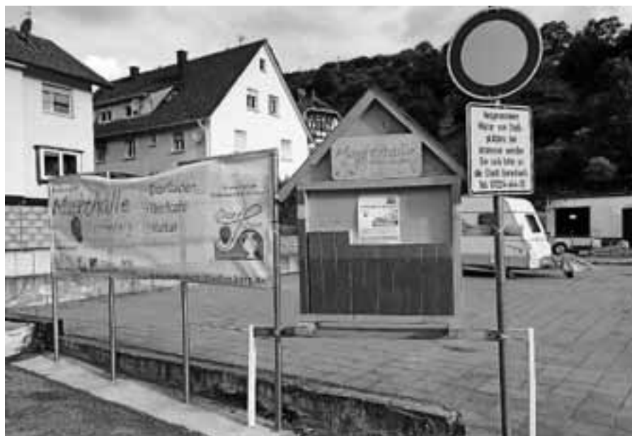
Hier soll der Dorfladen entstehen: ehemaliger Markthallenplatz.

Wir, das Team Dorfleben, haben in den vergangenen drei Jahren viel Freizeit ehrenamtlich in das Projekt investiert. Nicht nur wir vom Projektteam, sondern alle Staufenberger Bürgerinnen und Bürger werden früher oder später in ein Alter kommen, in dem wir alle zusammen eine ortsnahe Rundumversorgung und einen gemeinsamen Treffpunkt schätzen lernen werden. Lasst es uns