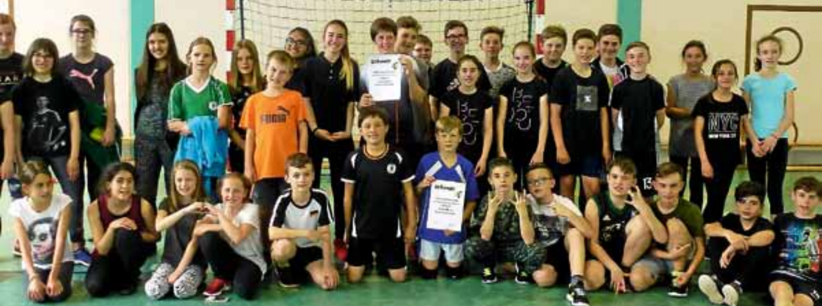
Die Klassen 5b und 6a sind Klassenstufensieger des Völkerballturniers.