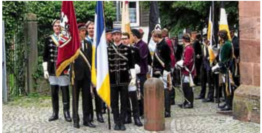
Die Wingolfiten freuen sich wie immer auf schöne Tage des Wiedersehens und der Begegnung untereinander sowie mit den Bürgerinnen und Bürgern der Stadt.

Der Sonntag beginnt mit dem Besuch der Gottesdienste in beiden Kirchen. Zum anschließenden Ausklang der Konvention lädt der Wingolf gerne zu einem Jazz-Frühstücken ab 11.30 Uhr in den Kurpark ein. ■