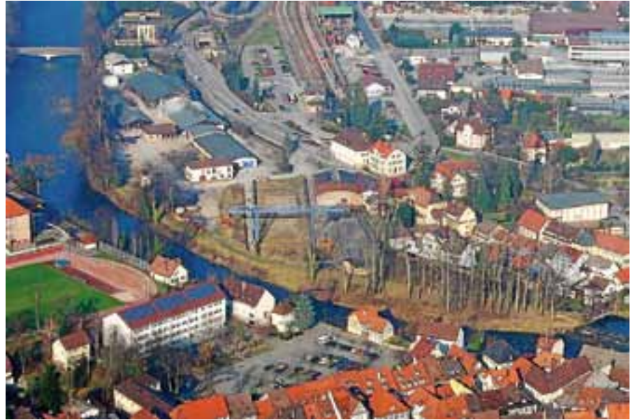
Bei der Informationsveranstaltung am 17. Mai werden insbesondere die ökologischen Auswirkungen der Altlasten auf dem Pfeleiderer-Areal beleuchtet.

Ende Februar wurde bereits in einer ersten Veranstaltung über den Sachstand zum Pfeleiderer-Areal berichtet. Hierbei wurde ein Rechtsgutachten vorgestellt, welches feststellt, dass es keine rechtlichen Möglichkeiten gibt, frühere oder den derzeitigen Besitzer des Geländes für eine Sanierung haftbar