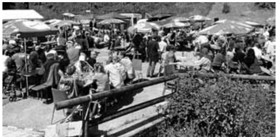
Bei hoffentlich schönem Wetter findet das Konzert des MVL im Freien statt.

Bad Herrenalb-Gaistal. Einen Einblick in den aktuellen Leistungsstand geben um zirka 14.30 Uhr die Jungmusiker des MVL zusammen mit der seit September 2017 bestehenden Bläserklasse der Grundschule Scheuern. Die Lautenbacher Musikanten unter der Leitung von Patrick Pirih haben ebenfalls wieder ein abwechslungsreiches Musikprogramm vorbereitet und werden die Vatertags-Ausflügler ab zirka 16 Uhr bis zum Ausklang unterhalten. Für das leibliche Wohl ist natürlich bestens gesorgt. Maultaschen mit Kartoffelsalat, Weißwürste mit Brezeln, Bratwürste, Steaks und „Heiße“ finden sich im Angebot. Wer es lieber süß mag: Die Kuchentheke bietet reichlich Auswahl. Maibock, Pils und vielerlei Getränke mit und ohne Alkohol stehen für die durstigen Kehlen bereit. Gern begrüßen wir wieder alle Lautenbacher Musikfreunde. Für die neu in Lautenbach zugezogenen Familien ist die Veranstaltung eine ideale Gelegenheit, in gemütlicher Atmosphäre moderne und traditionelle Blasmusik live zu genießen und Kontakte in ihrem neuen sozialen Umfeld zu knüpfen. Ebenso freuen wir uns auf unsere Stammgäste aus nah und fern.