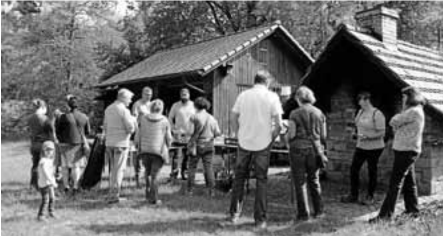
Der Pflanzentauschtag des OGV Obertsrot-Hilpertsau war ein Erfolg.

ten sowie Ochsenherzen - eine bunte Palette, die in einigen Monaten Farbe in den Garten und auf die Teller zaubern wird. Das Tauschangebot wurde durch einige Gartengeräte, Blumenkästen, Pflanzschalen und Vasen ergänzt. Die Anwesenden kamen schnell miteinander ins Gespräch und tauschten untereinander ihr Wissen über die angebotenen Pflanzen und darüber hinaus aus. So konnte man nicht nur mit schönen neuen Pflanzen nach Hause gehen, sondern manchen guten Tipp mitnehmen. Aufgrund des Erfolges will der Obst- und Gartenbauverein Obertsrot-Hilpertsau auch in Zukunft weitere Pflanzentauschtag anbieten.