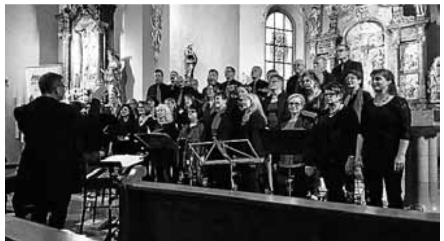
Salt o vocale am vergangenen Wochenende beim Benefizkonzert in St. Laurentius Bad Rotenfels.

Bei Regenwetter müssen die Konzerte leider ausfallen. Aktuelle Infos gibt es am Veranstaltungstag ab 14 Uhr auf der Internetseite des Chores www.salt-o-vocale.de