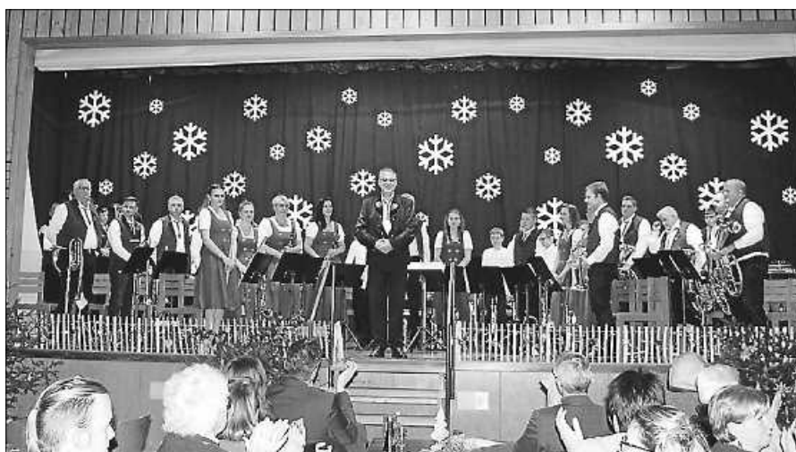
Die Lautenbacher Musikanten beim letztjährigen Adventskonzert.

Nach dem Husaren-Stück in der Landesliga, als der FCO am vergangenen Sonntag mit 4:2 beim Tabellenführer in Niederschopfheim gewann, geht es im nächsten Heimspiel darum, weitere Punkte für den Klassenerhalt zu holen. Beim vorletzten Heimspiel des Fußballjahres ist der SV Sinzheim zu Gast.