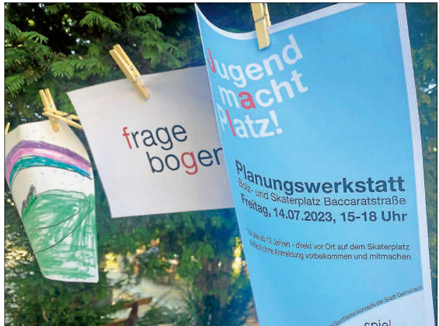
Große Beteiligung am Spielflächenkonzept.

Auf Basis der im Konzept benannten Handlungsempfehlungen werden dem Gemeinderat und den Ortschaftsräten nun folgende Beschlussvorschläge zur Entscheidung vorgelegt: 1. Der Gemeinderat der Stadt Gernsbach billigt das Spiel- und Sportflächenkonzept mit den darin vorgeschlagenen Maßnahmen und Priorisierungen. 2. Die Verwaltung wird beauftragt und ermächtigt: a. Die Umsetzung der Leuchtturmaßnahmen sowie die Maßnahmen der Priorität 1 in die Wege zu leiten und entsprechende Finanzmittel in den Haushalt der Haushaltsjahre 2024 und 2025 einzustellen. b. Die Spielplätze an der August-Müller-Straße in Gernsbach sowie an der Lärchenstraße in Lautenbach aus der Nutzung zu nehmen und die Grundstü-