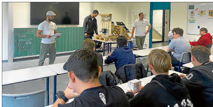
Die Firma W-Quadrat demonstriert die Funktionsweise einer PV-Anlage.

In kurzen Inputvorträgen stellten sich dabei folgende Betriebe bzw. Institutionen vor und visualisierten, welche Produkte sie täglich herstellen oder welche Dienstleistungen sie anbieten: die ENBW, das Forstamt Gaggenau, die Volksbank, das Bestattungsinstitut Schenkel, W-Quadrat, Glatfelter Gernsbach, Daimler Truck Gaggenau, die Murgtal Werkstätten und Kohlbecker. Auch wichtige Aspekte zum Thema Bewerbung und die Fragen der Schüle-