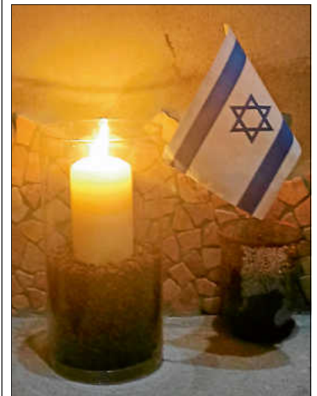
Das Licht soll Hoffnung symbolisieren.

Der Arbeitskreis Stadtgeschichte veranstaltet am Sonntag, den 19. November, 16 Uhr auf dem Salmenplatz eine Mahnwache zum Gedenken an die Opfer des Terrors vom 7. Oktober in Israel und Gaza, um Israel und den jüdischen Gemeinden in unserem Land unsere Anteilnahme und Solidarität auszudrücken. Alle, die Anteilnahme und Solidarität zeigen wollen, sind mit Familie, Freunden, Bekannten herzlich eingeladen, teilzunehmen und ein kleines Teelicht im Glas mitzubringen. ■