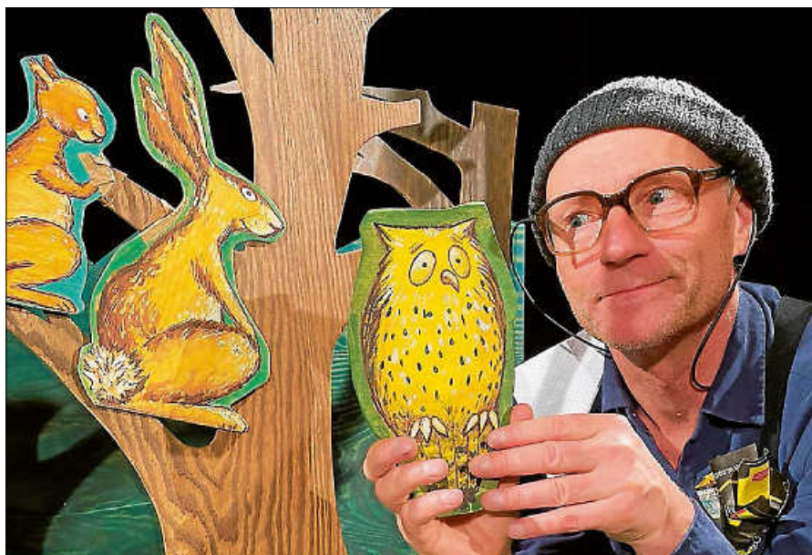
„Wie weihnachtet man“

Alle Veranstaltungen finden in der Stadthalle Gernsbach statt. Bitte die jeweiligen Altersbeschränkungen beachten. Den Flyer und die Karten gibt es über