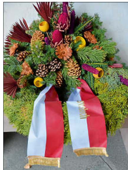
An den Gedenkstätten werden Kränze der Stadt Gernsbach niedergelegt.

In stillem Gedenken werden Kränze zu Ehren der Verstorbenen an den Denkmälern niedergelegt. ■