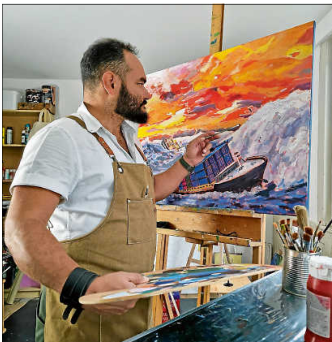
Der Künstler gibt Einblicke in seine Arbeit.