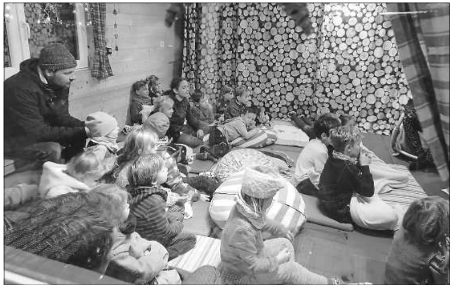
Gespannt lauschen die Kinder den Geschichten.

Die diesjährige Weihnachtsfeier des FC Auerhahn Reichental findet am Samstag, 09.12.2023, im Restaurant „Sängerheim“ in Weisenbach / Au statt. Ab 17.30 Uhr wird dort mit einem Glühweinpfeif der gesellige Jahresausklang stimmungsvoll eingeläutet. Selbstverständlich besteht die Möglichkeit einer kleinen, gemeinsamen Wanderung zum Lokal. Hier ist der Treffpunkt um 15.30 Uhr am Waldmuseum Reichental. Für die vorweihnachtliche Besinnlichkeit werden natürlich auch der legendäre FCA-Nikolaus und sein Belzemärtel sorgen. Die beiden übernehmen traditionell die Übergabe der Krabbelsackgeschenke. Wer hier beschert werden möchte, sollte ein möglichst originelles Präsent im Gegenwert von rund fünf Euro mitbringen. Wo eher negative Einträge im goldenen Buch des Nikolaus zu erwarten sind, wird empfohlen, insbesondere den Belzemärtel mit einstudierten Liedern und Gedichten milde zu stimmen. Der FC Auerhahn freut sich, zahlreiche Mitglieder und Freunde des Vereins bei seiner Weihnachtsfeier begrüßen zu dürfen. Anmeldungen nimmt Laila Höfler, hoeflermontagen@web.de oder unter 0179 / 5479815 bis 01.12.2023 entgegen.