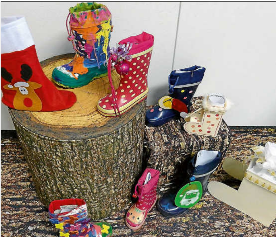
Archivbild 2021: Von Kindern gestaltete Nikolausstiefel.

ben. Es darf ein eigener Schuh, aber auch gerne ein gebastelter sein. Die abgegebenen Stiefel werden von den teilnehmenden Unternehmen wieder mit kleinen Überraschungen gefüllt und in deren Schaufenstern oder Auslagen dekoriert. Die Kinder dürfen sich dann ab dem ersten Advent mit ihrer Familie auf die Suche nach ihrem Schuhwerk machen und nach dem Nikolaustag, ab dem 7. Dezember, zu den angegebenen Öffnungszeiten im jeweiligen Geschäft wieder abholen. ■