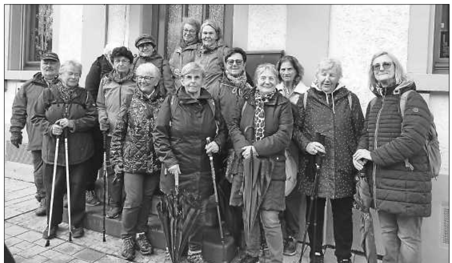
Der Abschluss ist im Restaurant.

Die Stadtkapelle Gernsbach feiert ihr 160-jähriges Jubiläum. Grund und Anlass für ein ganz besonderes Konzert am Samstag, 25.11.2023, um 18.30 Uhr in der kath. Kirche in Gernsbach.