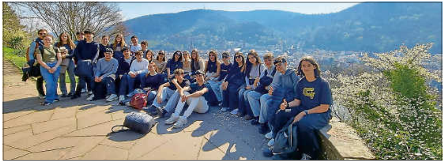
Auf Heidelberg war Verlass, der romantische Panoramaweg bei strahlendem Sonnenschein.