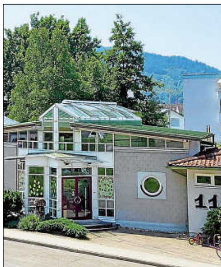
Die Kita Fliegenpilz lädt zu einem Nachmittag der offenen Tür ein.

Am Mittwoch, den 29.4.2026, lädt die Kita Fliegenpilz in der Baccaratstraße 11 in Gernsbach dazu ein. Zwischen 16.15 Uhr und 18 Uhr haben Eltern die Gelegenheit, die Einrichtung sowie die pädagogische Arbeit kennenzulernen und die Räumlichkeiten zu besichtigen. An Bildwänden werden Einblicke in den Tages- und Wochenplan, die pädagogischen Angebote sowie die organisatorischen Rahmenbedingungen gegeben, um einen Eindruck vom Alltag in Krippe und Kindergarten zu vermitteln. Das