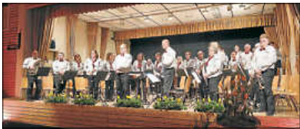
Die Musikkapelle Hilpertsau Obertsrot beim Frühjahreskonzert.

fantasievoll wurde das Publikum in die Welt von Hogwarts entführt. Mit „Atlantis“ folgte ein atmosphärisches Werk, das die Legende der versunkenen Insel musikalisch lebendig werden ließ. Nach der Pause setzte „Dramatic Tales“ kraftvolle Akzente, bevor mit der Polka „Casanova“ und Auszügen aus „Mary Poppins“ bewusst leichtere Töne angeschlagen wurden. Auch „Ghostbusters“ sorgte für einen unterhaltsamen und schwungvollen Moment im Programm. Den Abschluss bildete ein eindrucksvolles Arrangement aus dem Musical „Tanz der Vampire“, das mit dramatischer Intensität überzeugte. Ruhig und besinnlich klang der Abend mit der Zugabe „Der Mond ist aufgegangen“ aus. Unter anderem vorbereitet wurde das Konzert im Rahmen eines Probenwochenendes vom 6. bis 8. März. Die intensive Probearbeit der letzten Wochen zahlte sich aus: Die Musikkapelle überzeugte mit Spielfreude, Präzision und einem stimmigen Gesamtbild.