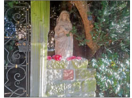
Neu im linken Gartenteil: Die Sandsteinskulptur einer Ordensschwester.

30 Jahre Arbeitskreis Katz'scher Garten Der Arbeitskreis feiert dieses Jahr sein 30-jähriges Bestehen. Das Jubiläum wird am Sonntag, 28.6.2026, im Katz'schen Garten gefeiert. Hierzu ist die Bevölkerung herzlich eingeladen. Gleich-