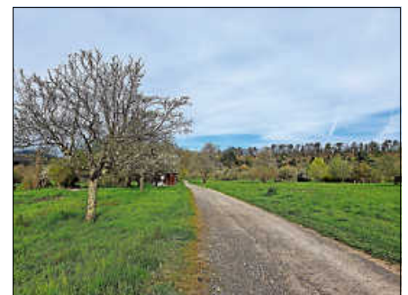
Mit Gesundheitswanderführer Klaus Fiedler auf der Weinau unterwegs.

Die ca. 3 Stunden lange, kostenfreie Tour beginnt um 10.10 Uhr und ist ca. 4,5 km lang. Treffpunkt ist am Bahnhof Gernsbach. Um Anmeldung über die Touristinfo Gernsbach unter 07224 644-446 oder touristinfo@gernsbach.de wird gebeten. ■