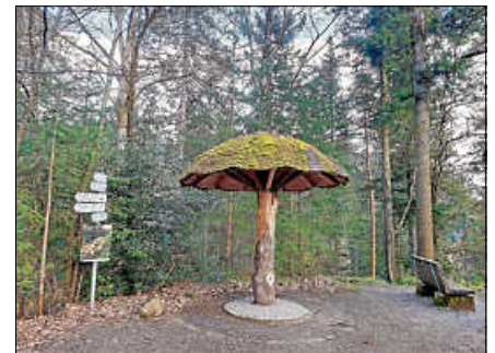
Schriftsteller Gerd Groß erläutert Sagen und Mythen auf dem Sagenweg.

Die kostenfreie Tour beginnt um 10 Uhr und dauert ca. 4,5 Stunden. Der Treffpunkt für die ca. 6 km lange Tour ist das Denkmal am Rumpelstein. Um Anmeldung über die Touristinfo Gernsbach unter 07224 644-446 oder touristinfo@gernsbach.de wird gebeten. ■