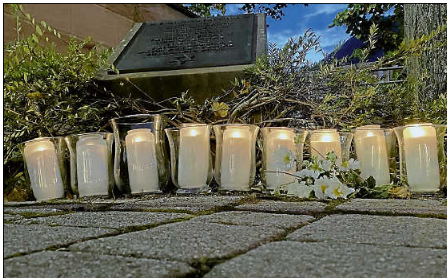
Kerzen zur Gedenkfeier an der Stadtbrücke.