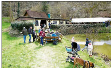
Karfreitag-Fischessen am Trüffelbachsee.

Vereinsvorstand auch bei den vielen mitarbeitenden Mitgliedern bedankt. Das Ergebnis ermöglicht es dem Verein, die Investitionen am und um den Trüffelbachsee zu stemmen, um ihn und die Fischerhütte in dem guten Zustand zu erhalten, wie sie sich auch gerade an diesem besonderen Tag den Besuchern gezeigt hatten.