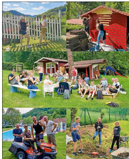
Arbeitseinsätze im Schwimmbad Lautenbach.