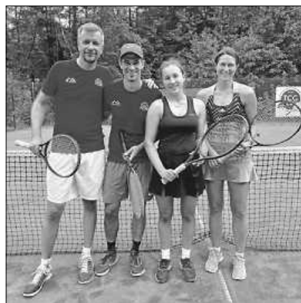
Finalisten der Clubmeisterschaften des TCG