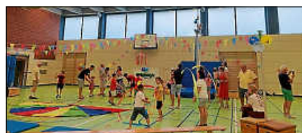
Zirkus Papperlapapp 2022