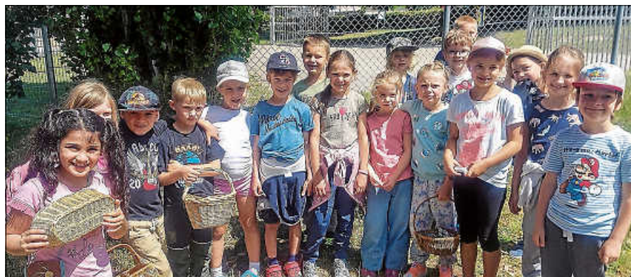
Die Kinder der 1. Klasse am Ende ihres Outdoor Schultages.

Kinder bekamen dadurch einen Begriff wieviel Mühe und Arbeit in solch einem Lebensmittel steckt. Das Butterbrot schmeckte dann noch mal so gut. Nach einem ganzen Schultag an der frischen Luft ging dieser schöne Tag zu Ende. ■