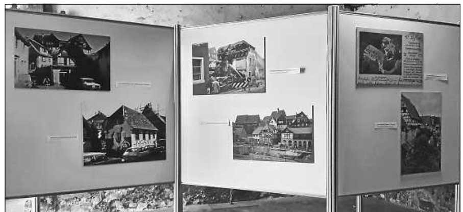
Fotoausstellung „Waldbachstraße im Wandel der Zeit“

Am Freitag, 11.8.23. öffnen sich die Türen der Zehntscheuern erneut. Ab 17.00 Uhr sind alle Mitglieder, Gernsbacher und Gäste zum traditionellen Hock eingeladen. Neben kühlen Getränken sorgt das Vorstandsteam dann auch wieder fürs leibliche Wohl.