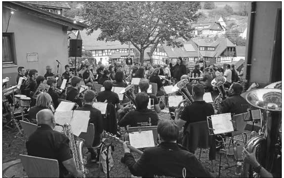
Mit Musik ins Wochenende beim Musikverein in Reichental.

Mit Musik ins Wochenende heißt es ab 18 Uhr. Die Gemeinschafts-Jugendkapelle und der Musikverein aus Michelbach