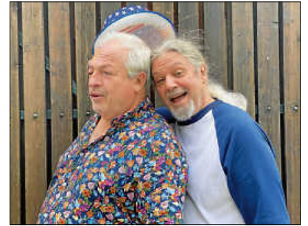
Red New Gypsies