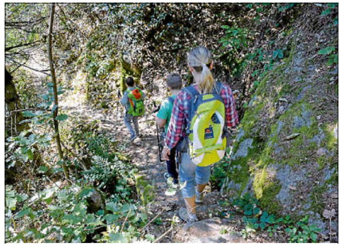
Unterwegs auf dem Sagenweg.

Eine Anmeldung bei der Touristinfo Gernsbach unter 07224 644446 oder touristinfo@gernsbach.de ist erforderlich. ■