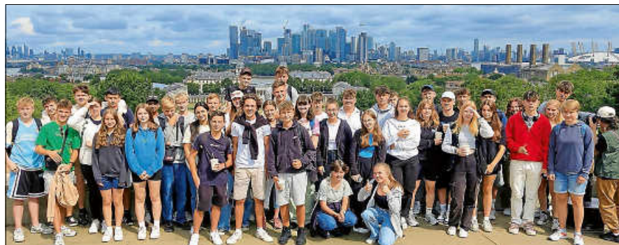
Die Jahrgangsstufe 9 des Gymnasiums posiert vor Greenwich.