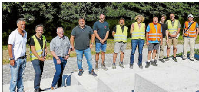
Vertreter:innen der beteiligten Firmen und Behörden trafen sich zur Bauabnahme auf dem Wörthgarten-Gelände.