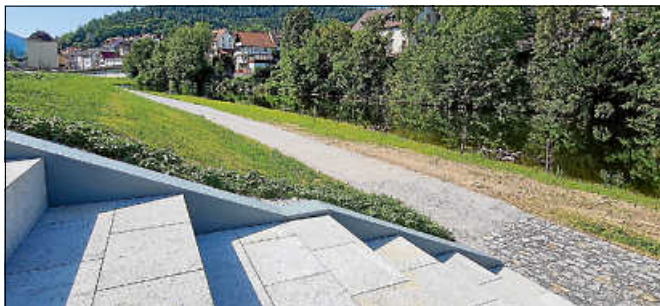
Die Murgaufweitung und die Murgstufen ergeben ein augenfälliges Gesamtbild.

Mit der Gewässeraufweitung ist die Hochwasserschutzmaßnahme GE6 fertiggestellt. Die verbreiterte Murg und die großzügig gestalteten Murgstufen ergeben ein augenfälliges Gesamtbild. Zur Bauabnahme trafen sich nun Vertreter:innen der Investorengruppe Krause, der Baufirma Oettinger, des Büros Arcadis, des Planungsbüros Wald + Corbe sowie der eingebundenen Behörden auf dem Gelände. Mit Ausnahme kleinerer Maßnahmen wurden keine Baumängel festgestellt. Alexander Neumann vom Büro Wald und Corbe berichtete, dass ihm auch keine Beanstandungen des geotechnischen Sachverständigen vorliegen, der die Arbeiten bereits im Vorfeld begutachtet hatte. Auch die Vollständigkeit der Entsorgungsdokumentation war seitens Arcadis bestätigt worden. Damit konnten die erbrachten Leistungen abgenommen werden.