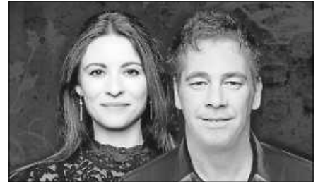
JEMI finest acoustic

Freuen Sie sich auf einen schönen Abend, treffen Sie Freunde und Bekannte, genießen Sie die musikalischen und kulinarischen Leckerbissen und haben Sie Spaß auf unserem schönen Dorfplatz im Herzen von Staufenberg. Bei Regen fällt die Veranstaltung aus.