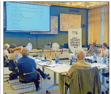
Die Steuerungsgruppe legt Ablauf der dritten und vierten Bürgerwerkstätten fest.

Des Weiteren legte die Steuerungsgruppe den Termin für die nächste Bürgerwerkstatt fest. Demnach wird nach den Sommerferien die Stadthalle für einen Austausch am 27. September, 19 Uhr