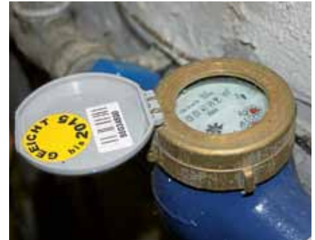
Mit Änderung der Wasserversorgungssatzung müssen geeichte Wasserzähler eingebaut werden.

Gernsbach in seiner Sitzung am 24. Juli 2017 die Satzung über den Anschluss an die öffentliche Wasserversorgungsanlage und die Versorgung der Grundstücke mit Wasser (Wasserversorgungssatzung-WVS) der Stadt Gernsbach geändert. ■