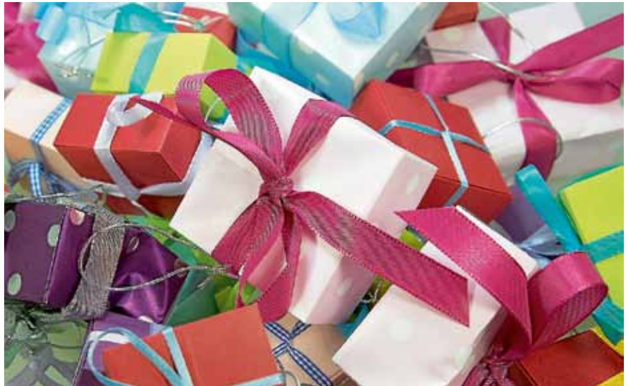
Gerade in der Weihnachtszeit steigt der Verpackungsmüll rasant an.

Damit gehen - gerade jetzt zur Weihnachtszeit - wieder Unmengen an Verpackungsmüll mit zum Teil riesigen Kartonagen einher. Die optimale Variante sperrige Kartons loszuwerden, ist natürlich die Pappe so zu zerkleinern, dass sie in die grüne Tonne passt. Sperrige Kartons und Altpapier können kostenlos auf der Entsorgungsanlage „Hintere Doler“ in Oberweier und beim Wertstoffhof in Bühl-Vimbuch abgegeben werden. Dazu ist es hilfreich, wenn sperrige Kartons bereits komprimiert und falls nötig zerkleinert angeliefert werden, sodass vor Ort mehr in die Container passt. Durch deren bessere Befüllung können diese wirtschaftlicher genutzt und dadurch im weiteren Verwertungsprozess Transportwege eingespart werden. Für das Sammeln von Altpapier spricht die Tatsache, dass bei der Herstellung von