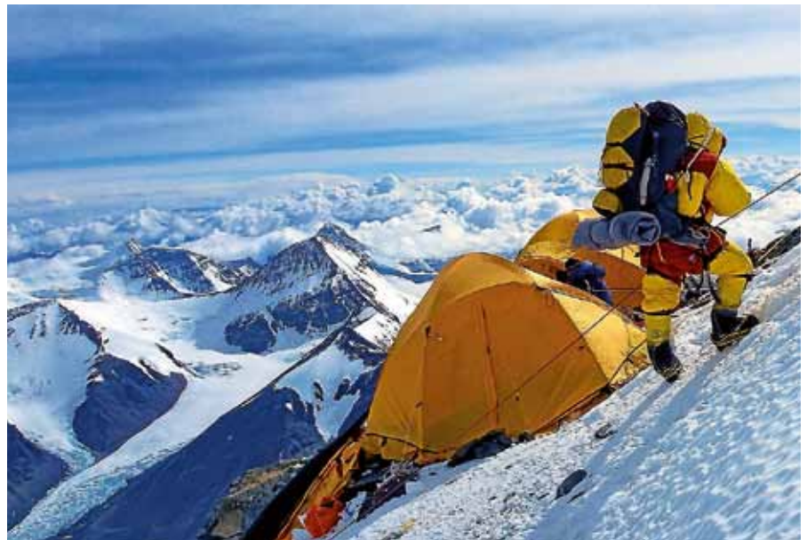
Beeindruckende Impressionen vom Mount Everest.

Weiter geht es dann im Februar mit der Diashow „Mount Everest - eine Expedition zum höchsten Punkt der Erde“. Der in Bad Wildbad lebende Grundschullehrer Holger Birnbräuer erreichte 2017 im zweiten Anlauf den Gipfel des weltweit höchsten 8.000er. Mit eindrucksvollen Fotos und Filmaufnahmen nimmt Holger Birnbräuer seine Zuhörer am Sonntag, 3. Februar, mit auf die rund zweimo-