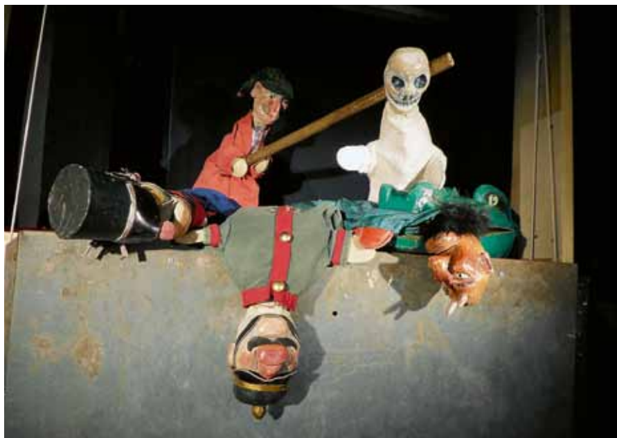
„Kasperblues“ - ein Stück für Erwachsene.

Eintrittskarten gibt es im Vorverkauf für 11 Euro beim Kulturamt. Die Tickets können außerdem bei über 1.800 Partnern im Vorverkaufsstellennetz von Reservix oder online unter www.reservix.de oder www.gernsbach.de gekauft werden. An der Abendkasse kosten die Tickets 13 Euro. ■