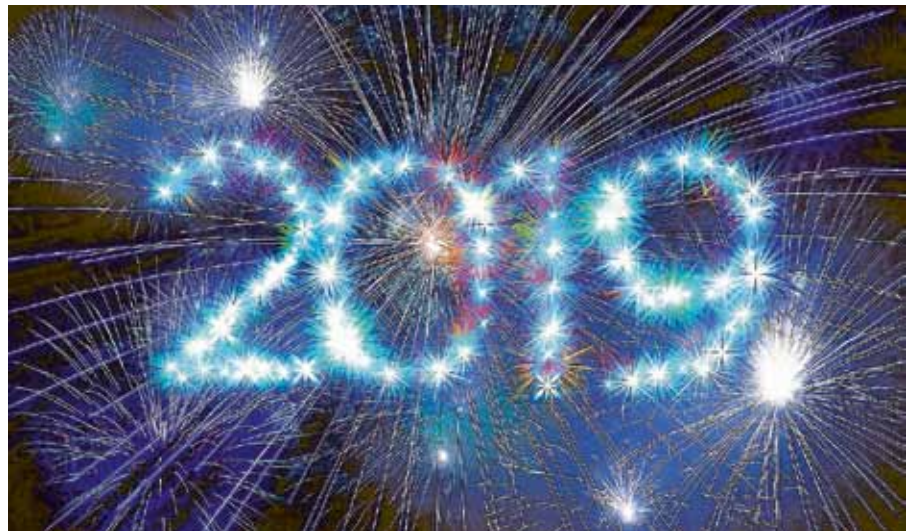
Einladung zum Neujahrsempfang am 11. Januar 2019.

Die Stadt Gernsbach wird den Neujahrsempfang 2019 durch eine Gebärdendolmetscherin begleiten bzw. übersetzen lassen. Um eine optimale Übersetzung gewährleisten zu können, werden Personen - die dieses Angebot wahrnehmen möchten - gebeten, sich vorab mit dem Büro des Bürgermeisters in Verbindung zu setzen: Telefon 644-11, E-Mail: stadt@gernsbach.de