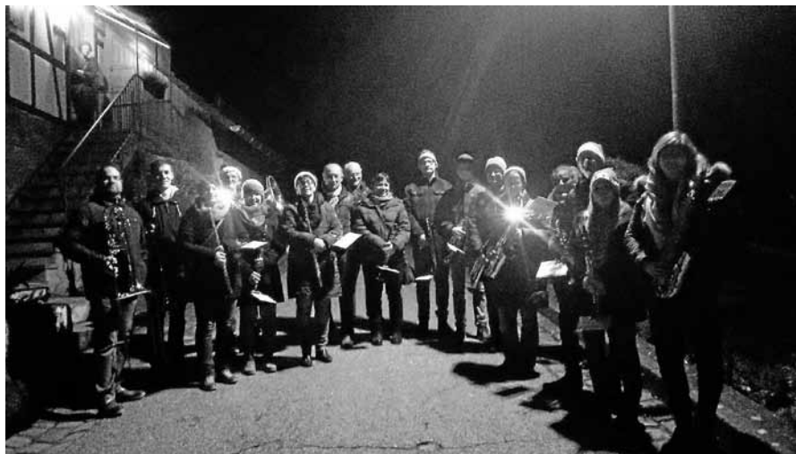
Die Musikerinnen und Musiker spielen weihnachtliche Weisen.

Tatkräftige Unterstützung bekamen wir am Verkaufsstand auch durch die Kinder der 2. und 3. Klasse der Grundschule Scheuern, die mit ihren Lehrerinnen auf den Wochenmarkt gekommen waren. Nach einer kurzen Stärkung mit frischen Brezeln verkauften die Kinder ihre selbst gebastelten Tannenbaumanhänger, Tannenzapfenmännchen und Lavendelsäckchen an die Wochenmarktbesucher. Dieser Verkaufseinsatz war ein voller Erfolg, so dass das Spendenschweinchen mittags prall gefüllt war. Der Verkaufser-