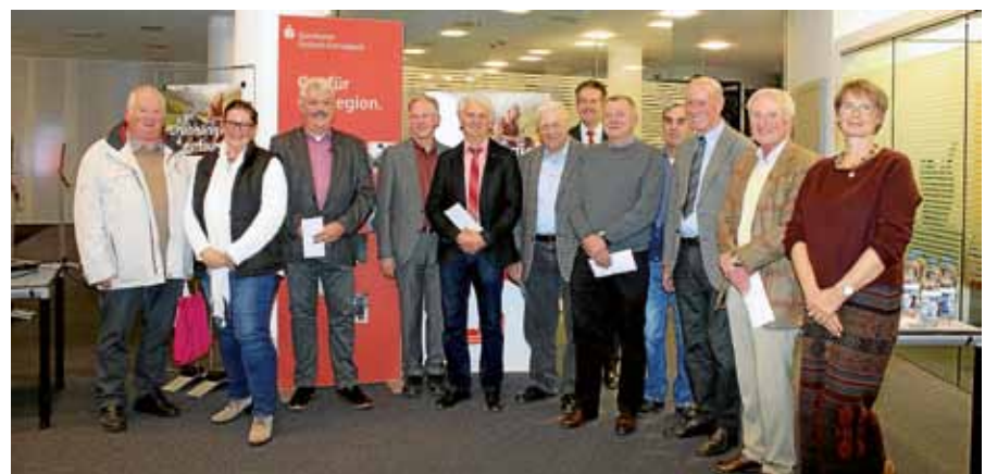
Spendenübergabe auch an Gernsbacher Projekte.

diesem Jahr konnte die Sparkasse insgesamt über 60.000 Euro als Spenden aus dem PS-Reinertrag übergeben. ■