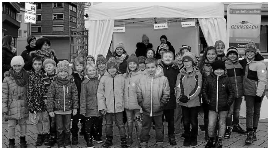
Tatkräftige Unterstützung am Wochenmarktstand.

Silberschmieden für Erwachsene am Samstag, 5. und Sonntag, 6. Januar, von 10 bis 16 Uhr, findet der Workshop Schmuckgestaltung in Silber statt. Auskunft und Anmeldung bei: Gerd Pliester, Telefon 4473.