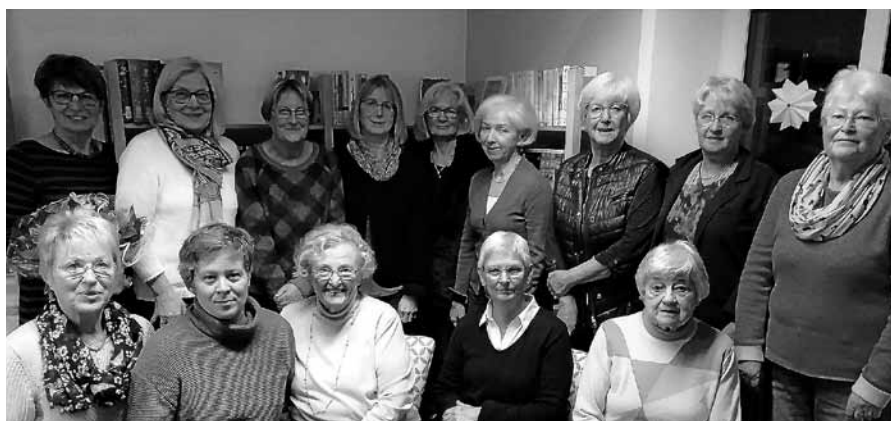
Das ehrenamtlich tätige Team der Bücherei Gernsbach.

Beide Kolleginnen erhielten neben einem Blumengruß des Teams auch eine Urkunde der Fachstelle für Kirchliches Büchereiwesen des Erzbistums Freiburg mit einem Präsent und einem persönlichen Anschreiben, in dem ihre Leistungen gewürdigt wurden. Das Team feierte seine langjährigen Mitstreiterinnen und hofft, sich noch viele Jahre auf deren motivierten Einsatz verlassen zu können. ■