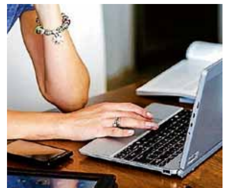
Fördermittelprojekt sucht Gründerinnen mit innovativen Ideen.