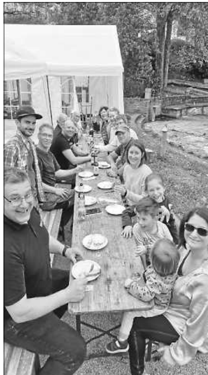
Fleißige Bauhelfer bei der Mittagspause.

Mithelfen kann jeder, spezielle Vorkenntnisse sind nicht erforderlich. Bitte beachten: Kinder nur in Begleitung einer Aufsichtsperson.