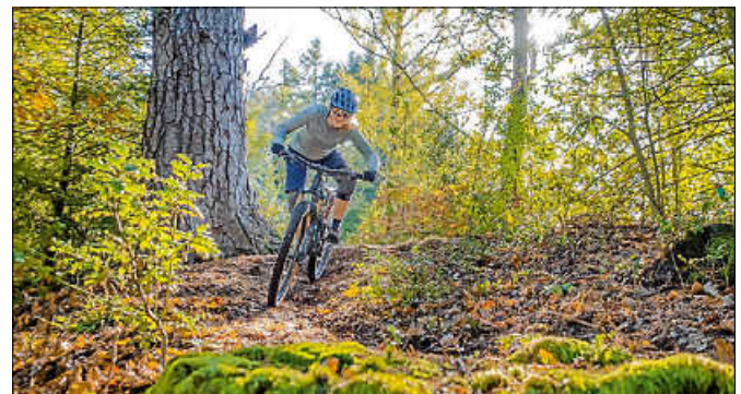
Unterwegs auf dem „Steinedeck-Trail“.

Mehr Infos zum Trail finden sich unter www.outdooractive.de ■