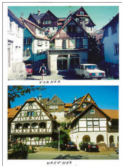
Waldbachstraße früher und heute.

Das Fest endet gegen 19 Uhr. Der Besuch der Ausstellung und die Teilnahme an den Führungen sind kostenfrei. ■