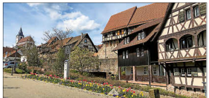
Der erste bürgernahe Austausch findet in der Kernstadt statt.