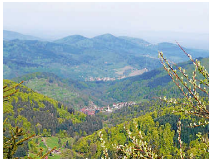
Blick nach Reichental.

Bei den Lieblingstouren zu jeder Jahreszeit führt ein(e) Mitarbeiter*in auf persönlichen Lieblingspfaden eine längere Wanderung rund um den Kaltenbronn. ■