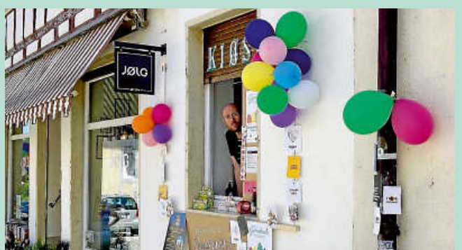
Der farbenfrohe Kiosk in der Färbertorstraße lockt auch beim kommenden verkaufsoffenen Sonntag mit Rubbellosen und Süßem.