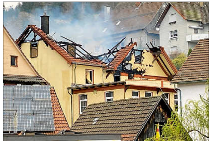
Großbrand in Gernsbach Reichental.