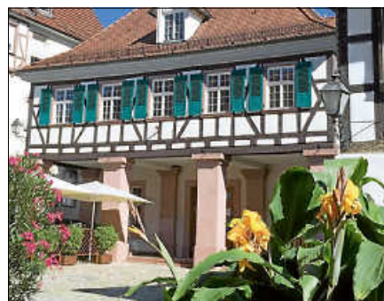
Inmitten unserer malerischen Altstadt wird am Samstag, 29. April, der erste Fahrradbasar 'Zwei+Radbasar' stattfinden.