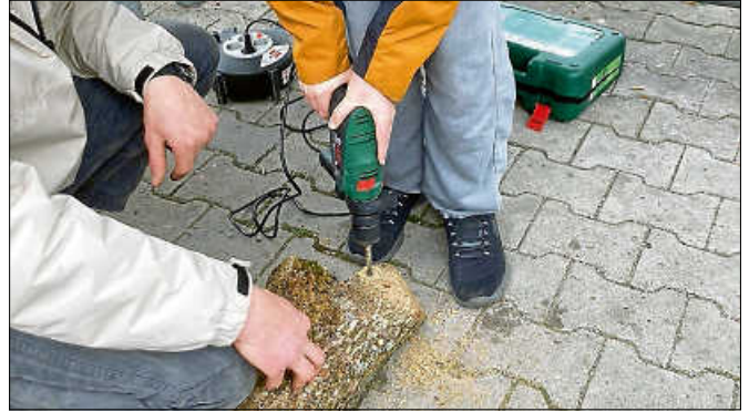
Insektenhotels bauen mit dem NABU.