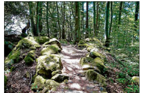
Beim Fitnesswandern geht es auch mal über Stock und Stein.

Eine Anmeldung bei der Touristinfo Gernsbach unter 07224 644446 ist erforderlich. ■