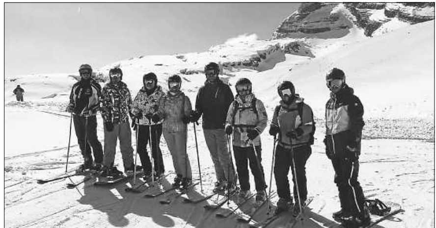
Teilnehmer der Saisonabschlussfahrt.