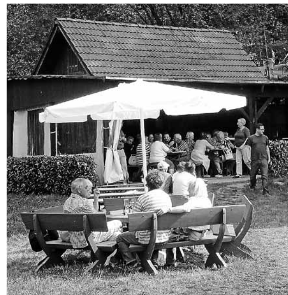
Zum Karfreitagsfischessen wird wieder herzlich eingeladen.

Der Gernsbacher Sportfischerverein Petri Heil lädt am Karfreitag, 19. April, ab 10 Uhr zum Fischessen in seine Fischerhütte am Träufelbachsee. Neben gebackenen Forellen und Forellenfilets werden in diesem Jahr auch wieder Forellen geräuchert. Maultaschen mit Lachs- und Gemüsefüllung sowie Kaffee und Kuchen runden unser Angebot ab. Die Speisen können auch mit nach Hause genommen werden. Wir würden uns über regen Besuch sehr freuen.