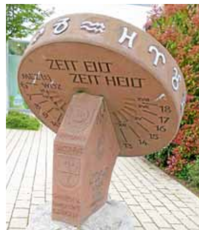
Die Sonnenuhr im Rathauhof wurde 1978 von E. Jüngert hergestellt und gestiftet.

Lernen Sie an diesem Vormittag acht der derzeit 25 Gernsbacher Sonnenuhren und die Vielfalt dieses Zeitmesser-Typs kennen. Die Tour endet etwa um 11.15 Uhr im Rathauhof. Die Teilnahme ist kostenlos, eine Anmeldung nicht erforderlich. ■