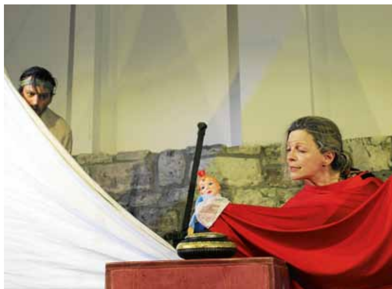
Spaß, Slapstick und schräge Komik stehen bei dieser Inszenierung im Vordergrund. ■ Foto: Theater in der alten Turnhalle