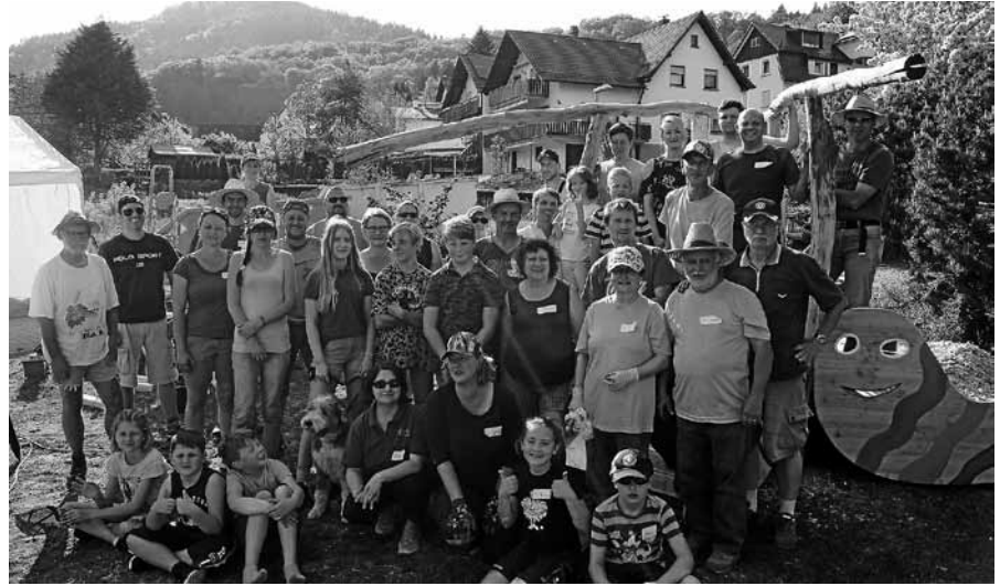
Gemeinsam bewegen wir viel.

Auch in diesem Jahr wird auf dem Staufenberg Dorfplatz wieder das, mittlerweile über die Dorfgrenzen hinaus, beliebte „Feierabendgrillen“ stattfinden. Geplant sind folgende Termine: Jeweils Freitags ab 18 Uhr am 24. Mai, 28. Juni, 26. Juli und 23. August. ■