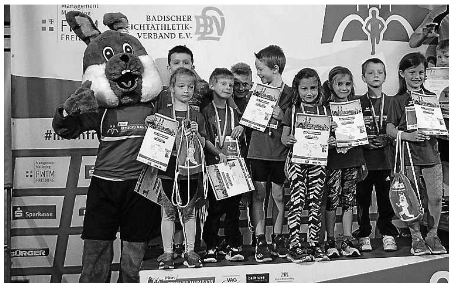
BLV KiLa-Cup Finale: TVG U8 Team auf Platz 2.