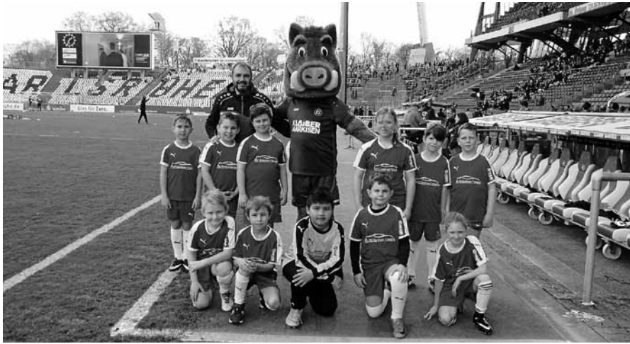
Die F-Jugend des FC Gernsbach posiert gemeinsam mit dem KSC-Maskottchen Willi Wildpark.