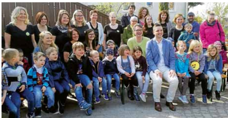
Das Team der Kindertagesstätte Rockertstrolche begrüßte bei tollstem Sonnenschein zum Tag der offenen Tür viele kleine und große Gäste in Hilpertsau.