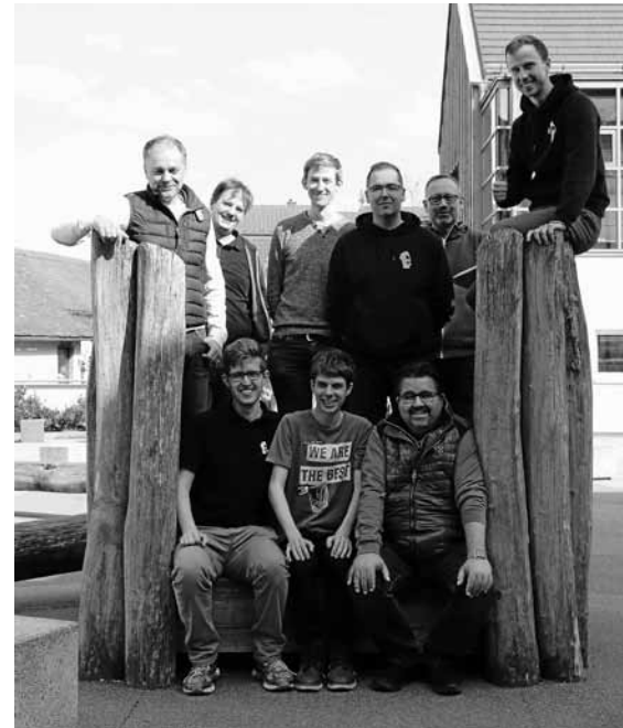
Der Wiederaufstieg in die Landesliga ist geschafft.

Für die Mittwochswanderer ist am 10. April um 8.45 Uhr Treffpunkt am Gernsbacher Bahnhof. Nach der Fahrt mit Bus und Bahn nach Achern (über Baden-Baden) beginnt die Wanderung mit Renate und Gerhard Gallo auf dem