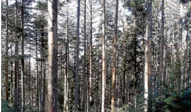
Vom Fichtenborkenkäfer befallene Bestände müssen gefällt und aus dem Wald gebracht werden.

D as massenhafte Auftreten von Borkenkäfern im vergangenen Hitzesommer hat dazu geführt, dass eine große Zahl der Käfer den Winter überstanden hat. Auch in diesem Jahr wird sich der Borkenkäfer wieder massenhaft vermehren.