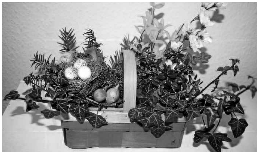
Der OGV Lautenbach lädt zum beliebten Floristikabend für Tisch und Tür ein.