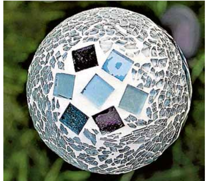
Immer wieder kommt es zu Diebstählen von Gartenschmuck.

Die verärgerte Anwohnerin der Staufenberger Straße 115 wird nun Anzeige gegen Unbekannt stellen. Für sachdienliche Hinweise steht der Polizeiposten Gernsbach, Bahnhofplatz 2, zur Verfügung. Zur Erhöhung der Sicherheit und eventuell zur Vermeidung von Diebstählen und Wohnungseinbrüchen rät das Innenministerium Baden-Württemberg in einer Pressemitteilung, den Kontakt zu Nachbarn zu pflegen und die gegenseitige Aufmerksamkeit zu erhöhen, da Nachbarschaftshilfe vor unbefugten Zugriffen schützt. Wer verdächtige Situationen in seinem Wohngebiet wahrnimmt, sollte sich die Beschreibung verdächtiger Personen und gegebenenfalls das Fahrzeug-Kennzeichen notieren und die Polizei informieren. ■