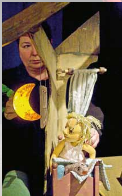
„Lotta zieht um“.

Am Freitag, 12. April, um 15 Uhr laden die zwei sympathischen alten Schachteln Janette und Yvette vom Theater die exen zu einem Märchenvortrag der besonderen Art ein. Im Stück „Nils Holgersson und die Wildgänse“ für Kinder ab 6 Jahren tauchen sie mit ihrem magischen Gerät, genannt Polilux, ein in die große Reise des kleinen Nils in Licht und Schatten. Sie malen nicht mit Farben, sondern mit den Händen.