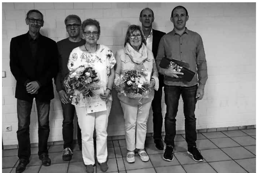
Die Vorstände mit den anwesenden und zu ehrenden Mitgliedern.