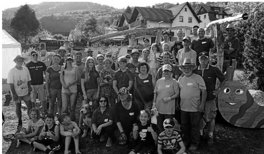
Nach getaner Arbeit: glückliche Bauhelfer.

und 18 Uhr am Freitag und 8.30 und 18 Uhr am Samstag wird gebaggert, gesägt, gehackt, gejädet, gestrichen und geschliffen was das Zeug hält. Auch für dieses Bauwochenende haben wir uns wieder einiges vorgenommen. Wir möchten in diesem Jahr die oft gewünschte und lang ersehnte Toilettenanlage auf dem Dorfplatz bauen. Das Holzteam hat folgende Projekte auf dem Plan: Relax-Liegen errichten und die Boulebahn umrandung erneuern. An der Villa Kunterbunt werden noch kleinere Arbeiten durchgeführt. Ob die zerstörte Mosaikschildkröte entsorgt oder wieder neu hergerichtet wird, hat das Bauteam noch nicht entschieden. Natürlich wollen und werden wir auch die Instandhaltung des Dorfplatzes nicht vernachlässigen. Da gibt es immer was zu tun. Maler- und Gartenarbeiten, Holz- und Instandhaltungsarbeiten und nicht zuletzt der Transport von Rindenmulch, Hackschnitzel, Grünzeug etc., der sich besonders bei den Kindern großer Beliebtheit erfreut. Zum Abschluss am Samstag, ab 18 Uhr gibt es wie immer ein Fest für alle Helfer und Sponsoren.