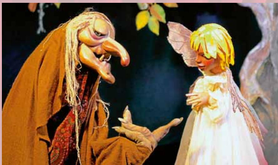
„Von Feen, Hexen, Wichteln und Elfen“.