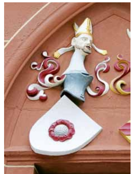
Das Wappen mit der Ebersteiner Rose an der Liebfrauenkirche in Gernsbach.

Eine Anmeldung ist nicht erforderlich, der Treffpunkt ist an der Stadtbrücke (Nepomuk). Die Führung ist kostenfrei. ■