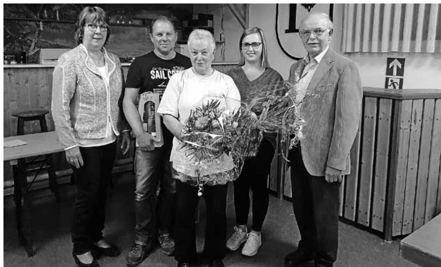
Der TVL würdigte die aktiven Vorstandsmitglieder für ihr Engagement.

Zunächst berichtete die Vorstandschaft über die aktuellen Vereinszahlen. Anschließend gaben die Übungsleiter/-innen in ihren Abteilungsberichten einen