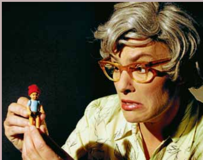
„Nils Holgersson und die Wildgänse“.