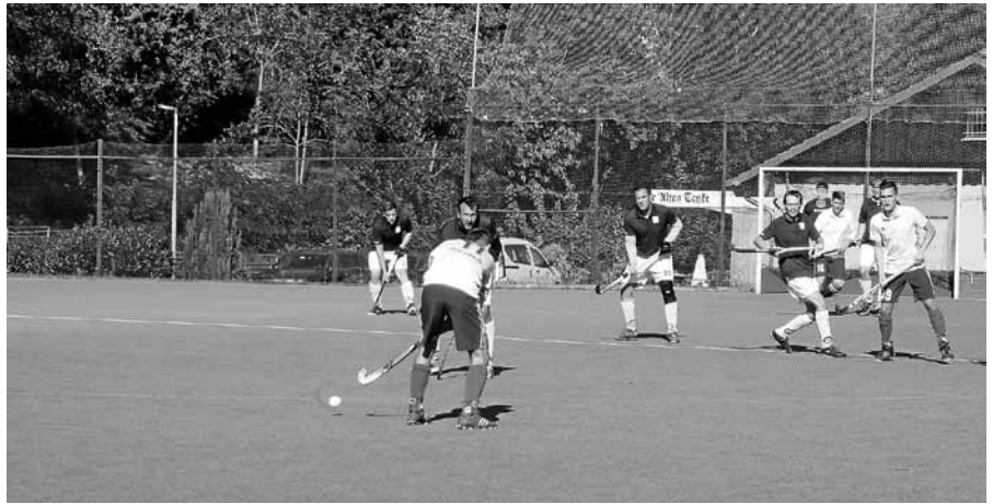
Der Hockey-Club Gernsbach richtet ein Bundesligaturnier aus.

Am Sonntag, 7. April, 17 Uhr kommt mit der Mannschaft SG Kappelwindeck/Steinbach 3 nicht unbedingt ein leichter Gegner in die Ebersteinhalle. Das