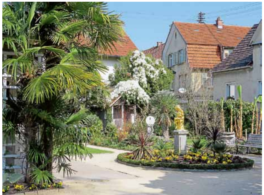
Eine Vielfalt an Frühlingsvorboten gibt es zur Zeit im Katz'schen Garten.

Narzissen, Tulpen und Hyazinthen? Nicht nur die Kamelien-Sträucher, die Rosen des Frühjahrs, zeigen sich in ganzer Pracht, sondern auch viele weitere Sträucher blühen in Hochform. Beim entspannten Wandeln durch das Gartenparadies nimmt der Besucher angenehme verströmende Düfte der Magnolien oder der Bitterzitrone auf und genießt diesen Moment. Treffpunkt ist am Pavillon des Katz'schen Gartens. Die Teilnahme an der Führung ist kostenlos. ■