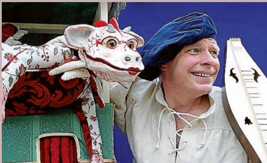
„Ritterhelmpflicht für kleine Drachen“.

Am Sonntag, 7. April , inszeniert das Theater Töfte aus Halle das Kinderstück