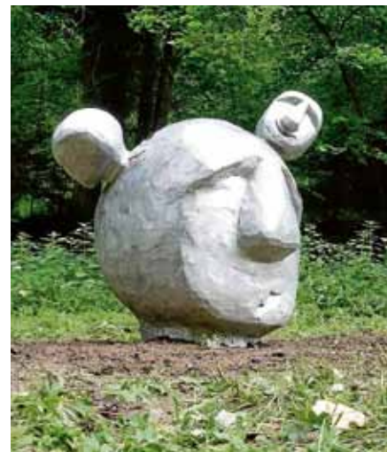
Kopf - eine der in 2018 neu installierten Arbeiten.

Die Tour dauert rund zwei Stunden und findet bei jedem Wetter statt. Der Treffpunkt ist am Beginn des Kunstwegs an der Infotafel auf dem Parkplatz im Reichenbachtal hinter dem Gewerbegebiet. ■