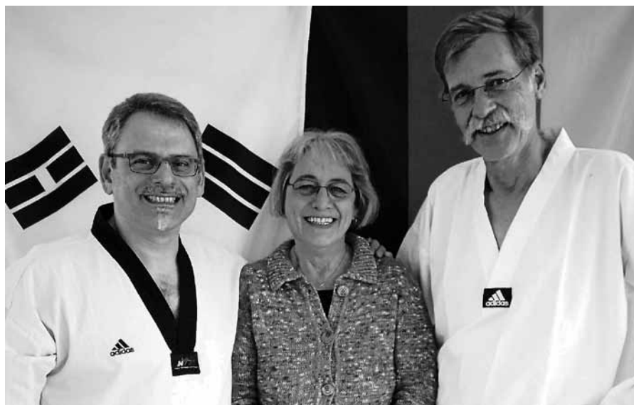
Unser neuer alter Vorstand.

Der Skiclub Gernsbach möchte die Führungsspitze ändern und dazu ist eine Satzungsänderung erforderlich. Anstatt wie bisher einen 1. und 2. Vorstand an der