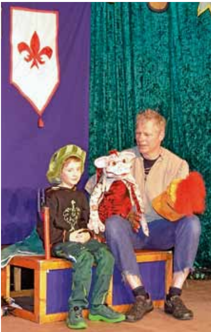
Das Theater Töfte aus Halle (Westfalen) präsentierte mit dem Stück „Ritterhelmpflicht für kleine Drachen“ eine mittelalterliche Mär von einer Drachendame, kühnen Recken, wagemutigen Burgdamen und einem wackeren Spielmann mit viel Musik und Mitspielaktionen.