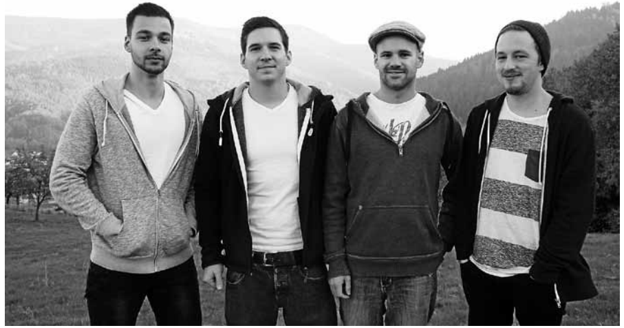
Die Band „Macs“ rockt beim Sägmühlfest des Motorradclubs in Obertsrot.

Zu dieser Veranstaltung ist die Lautenbacher Bevölkerung, sowie alle Freunde der Feuerwehr recht herzlich eingeladen. Die FFW Gernsbach, Abt. Lautenbach freut sich viele Besucher im Bürgerhaus Lautenbach begrüßen zu dürfen. Um Missverständnisse auszuschließen weise ich darauf hin, dass wir aus Gründen von Terminüberschneidungen das am 30. Juni geplante Sommerfest, jetzt