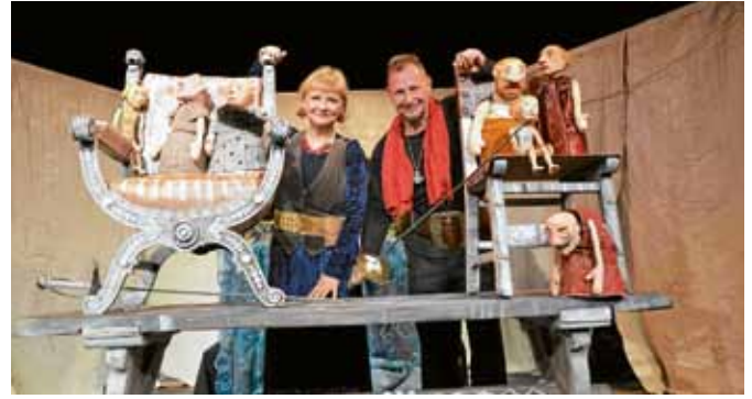
Eine spannende und abenteuerliche Geschichte über Freundschaft, Mut und Treue und darüber, wie man den Sprung über den eigenen Schatten wagt, zeigte das Theater des Lachens aus Frankfurt (Oder) mit dem Stück „Ronja Räubertochter“.