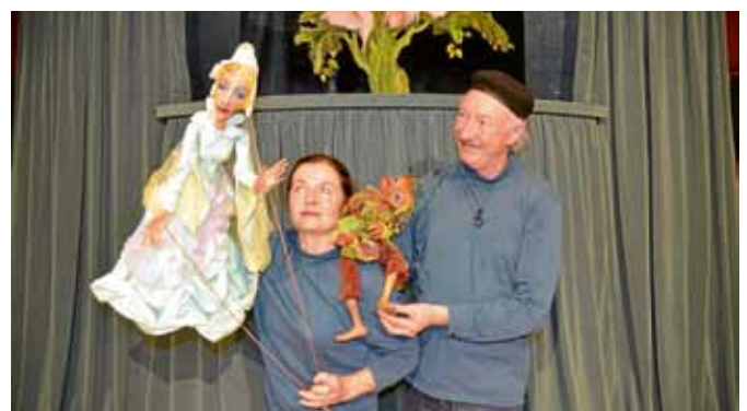
„Von Feen, Hexen, Wichteln und Elfen“, gespielt vom Hohenloher Figurentheater, zeigte die Geschichte der kleinen Elfe Elfie. Das Stück bestach durch eine ruhige Erzählweise, leise Poesie und fantasievolle Bühnenbilder.