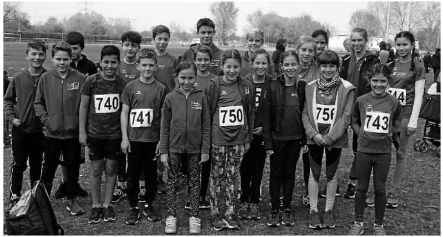
Erfolgreicher Nachwuchs der Leichtathleten bei den Langstrecken-Kreismeisterschaften.

„Die andere Stadtkapelle“ oder Musik für Herz und Seele. Über die Grenzen des Murgtals hinaus kennt man die Stadtkapelle Gernsbach mit ihrem vielfältigen Repertoire an Polka, Marsch, Unterhaltungsmusik und modernen Stücken. Nach dem großen Erfolg mit dem ersten Kirchenkonzert im Jahr 2017 präsentiert sich „die andere Stadtkapelle“ am Samstag, 11. Mai, um 19 Uhr wieder mit einem Konzert in der katholischen Liebfrauenkirche in Gernsbach. In einem interessanten und abwechslungsreichen Programm von „A“ wie „Andante aus der neuen Welt“ bis „Y“ wie „You raise me up“ sollen die Zuhörer für ein paar Stunden dem Stress, der Hektik und den Sorgen des Alltages entfliehen. Von