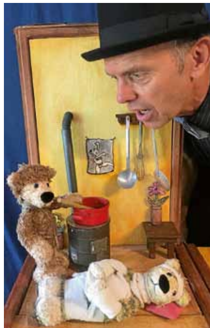
Ein Theaterstück über das Kranksein und das Gesundwerden, das spielerisch die Angst vor Arzt und Krankenhaus nimmt - das Blinklichter Theater aus St. Leon-Rot hatte mit dem Stück „Ich mach dich gesund, sagte der Bär“ eine Janosch-Inszenierung im Gepäck.