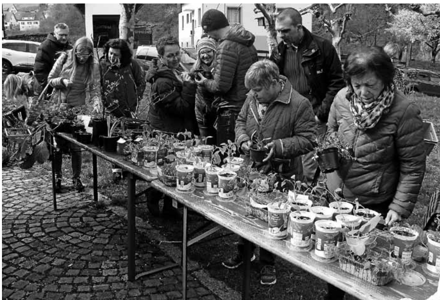
Eine vielfältige Auswahl bot der Pflanzentauschtag.