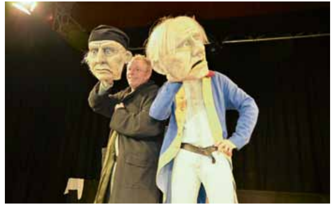
Frei nach Daniel Kehlmanns Forscher-Roman „Die Vermessung der Welt“ erzählte dieses gleichnamige Theaterstück vom TheaterKorona aus Leipzig im raffinierten Spiel mit Fakten und Fiktionen das bewegte Leben der beiden Wissenschaftler Alexander von Humboldt und Carl Friedrich Gauß.