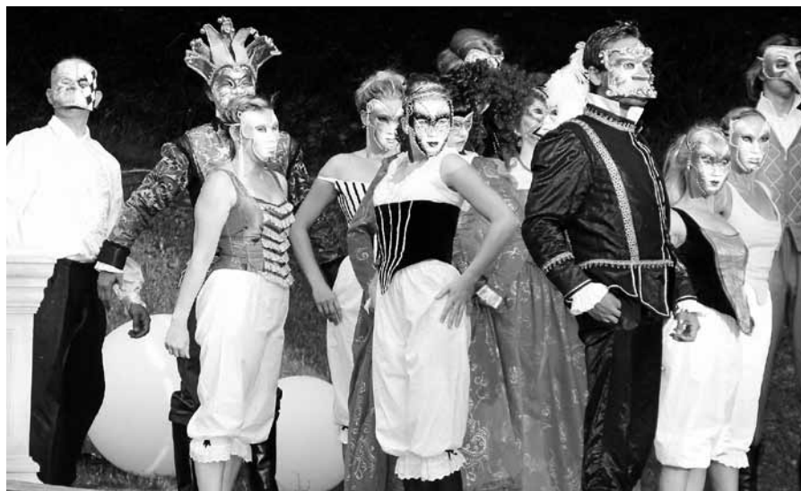
Mit „Der Kaufmann von Venedig“ präsentierte tik bereits 2013 einen Shakespeare-Klassiker im Gernsbacher Kurpark.

Freunde des Freilichttheaters können sich freuen: Das Gernsbacher Schauspielensemble ‚theater im kurpark‘ (tik) präsentiert sich vom 26. bis 29. Juli und vom 1. bis 4. August wieder am