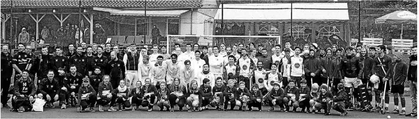
Mannschaften aus Ludwigsburg, Stuttgart, Hamburg und Mannheim.