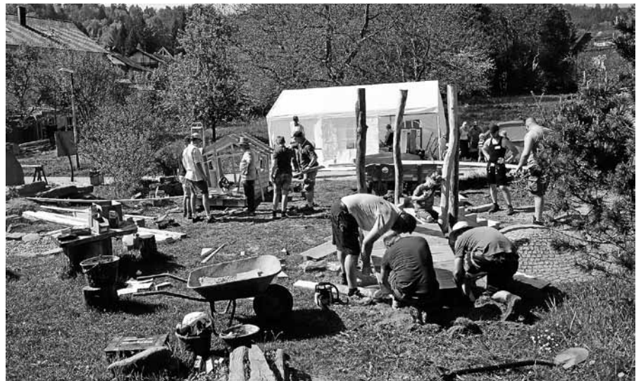
Es gibt viel zu tun - Packen wir es an!

Ihre Anmeldung erleichtert uns die Verpflegungs-Planung aber selbstverständlich sind auch Kurzentschlossene stets willkommen.