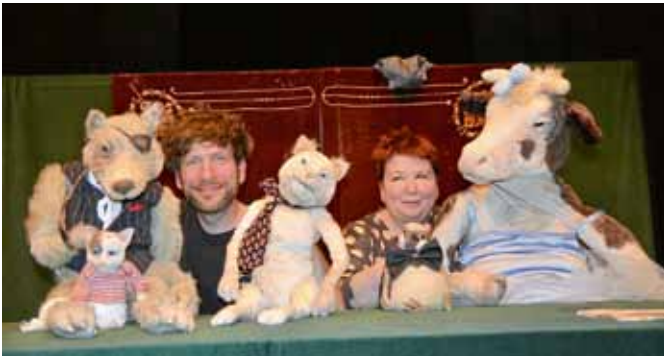
Auch der dritte Teil des Roadmovies „Vier Millionäre - Die Berliner Stadtromantiker III“, gespielt vom Theater Zitadelle aus Berlin, bot kurzweilige Unterhaltung mit skurrilen Tieren, trockenem Humor und Wortwitz.