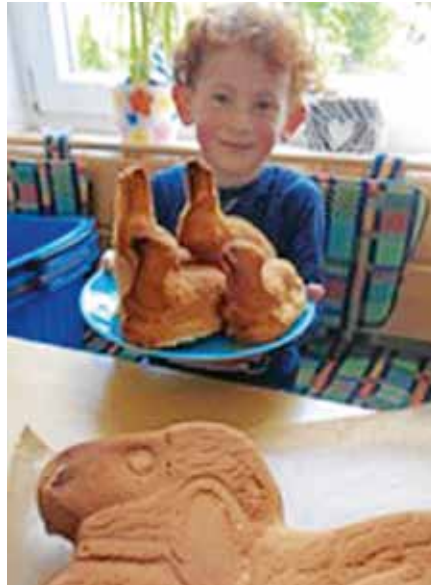
Viel Spaß hatten die Kids beim Backen der Osterlämmer.

Auch der herrliche Duft, der in den letzten Tagen aus der Küche kam und die daraus resultierenden Osterlämmer ließen die Kinder strahlen. Aber warum feiern wir denn eigentlich Ostern? Eine Frage, die sich die Kinder zu dieser Zeit häufig stellen und beantwortet werden will. Somit begleiten Geschichten aus dem Leben Jesu uns in dieser Zeit noch