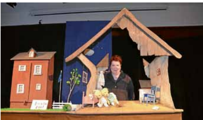
Lebendig und ganz nach Astrid-Lindgren-Art ging es in dem kunterbunten Stück „Lotta zieht um“, gespielt vom Theater Zitadelle aus Berlin, zu.