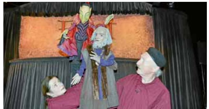
„Faust“, eines der ältesten Dramen rund um den Magier und Schwarzkünstler Johannes Georg Faust, wurde als fantasievolle Inszenierung des Hohenloher Figurentheaters für die Zuschauer lebendig.