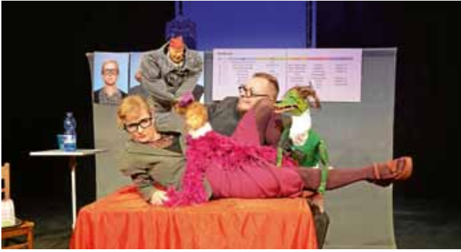
Mit Berufung auf den „Allerneusten Erziehungsplan“ von Heinrich von Kleist erlebten die Zuschauer mit dem Weiten Theater aus Berlin und dem Theater des Lachens eine geniale Er- und Beziehungsberatung, gefolgt von der Erkenntnis: „Hilft es nichts, so schadet es nichts“.