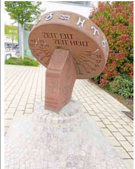
Die Sonnenuhr im Rathaushof wurde 1978 von E. Jüngert hergestellt und gestiftet.

Lernen Sie an diesem Vormittag acht der derzeit 25 Gernsbacher Sonnenuhren und die Vielfalt dieses Zeitmesser-Typs kennen. Die Tour endet etwa um 11.15 Uhr im Rathaushof. Die Teilnahme ist kostenlos, eine Anmeldung nicht erforderlich. ■