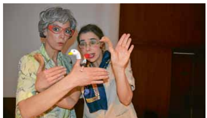
Ein Märchenvortrag mit Handschatten war das Stück „Nils Holgersson und die Wildgänse“, gespielt vom Theater die exen.