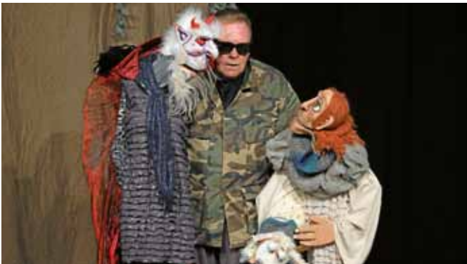
„Babylon“ vom Stuffed Puppet Theatre war tiefschwarz, bissig, furchterregend - eine absurde Geschichte über den Menschen und sein absurdes Schicksal.