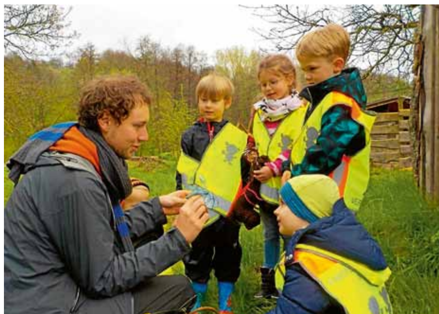
Die Kinder lernten auf dem Weidenhof einiges über Tiere und ihre Lebensweise.

Heimische Bauernhöfe - von Kindern neu entdeckt! ist ein Modellprojekt des Naturparks Schwarzwald Mitte/Nord. Darum freuen wir uns über alle, die