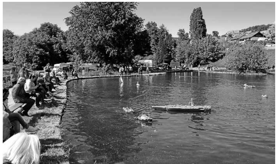
Am 1. Mai findet das 33. Modellbautreffen statt.

flug. Der Schiffsmodellbau-Club Murgtal lädt zu diesem Modellbautreffen auch zahlreiche befreundete Vereine mit ihren Trucks, Autos und Schiffsmodellen ein, unter anderem aus St. Peter, Brühl, Offenburg, Freudenstadt um nur ein paar zu nennen. Viele Vereine haben ihr Kommen fest zugesagt. Als besonderes Highlight werden in diesem Jahr unsere holländischen Modellbaufreunde ein zwei Meter großes Modell des weltweit bekannten Offshore Öl- Speichers „Brent Spar“ auf unserem Eisweiher vorführen. Außerdem werden auf dem Gelände auch Trucks und Geländefahrzeuge unterschiedlicher Bauart in Aktion zu sehen sein. Kinder können selbst kleine Schiffsmodelle auf dem See steuern und somit in das sehr schöne Hobby Modellbau reinschnuppern. Für das leibliche Wohl der Gäste und Modellbauer wird bestens gesorgt. Von warmen Speisen, Getränken bis hin zu Kaffee und Kuchen. Das Festgelände ist auch mit der Stadtbahn S81 sehr gut erreichbar; vom Haltepunkt „Obertsrot“ sind es ca. 10 Minuten zu Fuß. Weitere Informationen und Wissenswertes über den SMC Murgtal finden Sie auf unserer Webseite www.smc-murgtal.de .