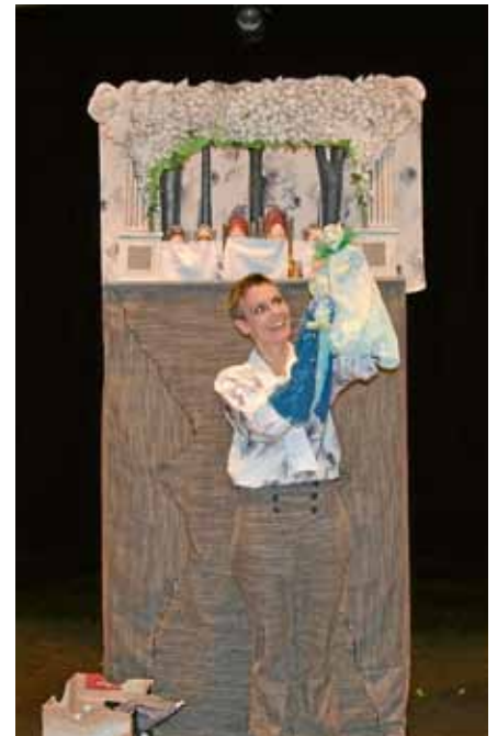
Mit 16 Figuren wurden im Stück „Sommernachtstraum oder Wer ist hier der Esel?“ Fragen der Liebe und der Treue verhandelt. Das Theater die exen zeigte Shakespeare komprimiert mit Humor und Tiefgang.