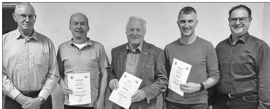
Mehrere Mitglieder wurden geehrt.