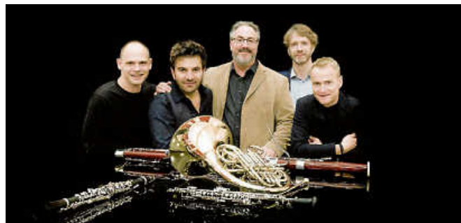
Ensemble 4.1 Piano-Windtet.