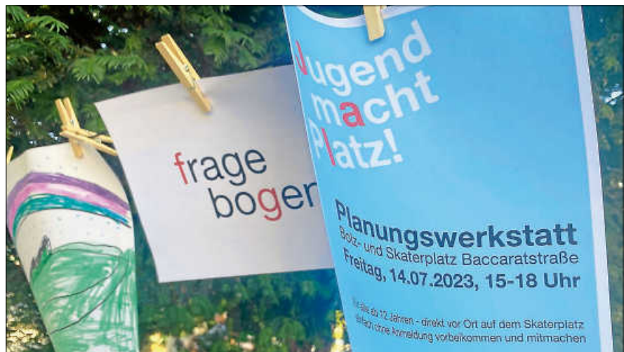
Große Beteiligung am Spielflächenkonzept.