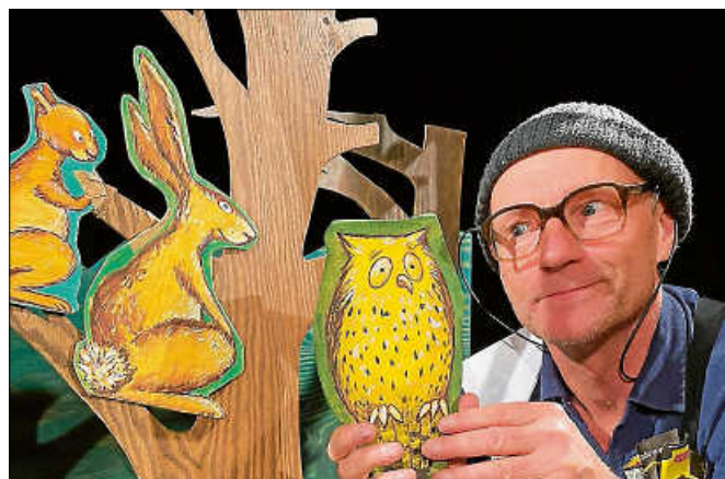
„Wie weihnachtet man“.

Die Veranstaltungsbesucherinnen und -besucher werden darum gebeten, die StVO-Regeln beim Parken einzuhalten. ■