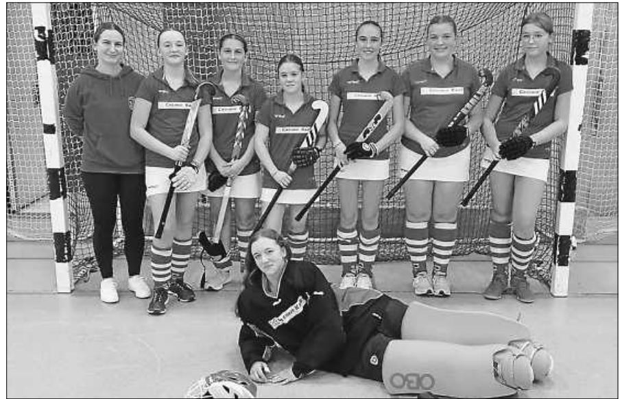
WU 16 des Hockey-Club Gernsbach.

Am vergangenen Samstag fuhr die WU 16 des Hockey-Clubs Gernsbach nach Weinheim zum ersten Spieltag der Hallenrunde. Trotz des geschwächten Kaders konnten die Mädels aus den drei Spielen vier Punkte mitnehmen. Der nächste Spieltag ist am 10.12.23 ab 10 Uhr in der Ebersteinhalle in Obertsrot. Die Mädels würden sich über rege Unterstützung von den Tribünen freuen.