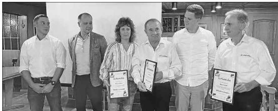
Ehrungen beim SV Staufenberg.

SVS/FCG empfängt am Sonntag zum letzten Heimspiel den VFR Bischweier (14:30/12:30 Auwiese). Danach ist Winterpause bis März.