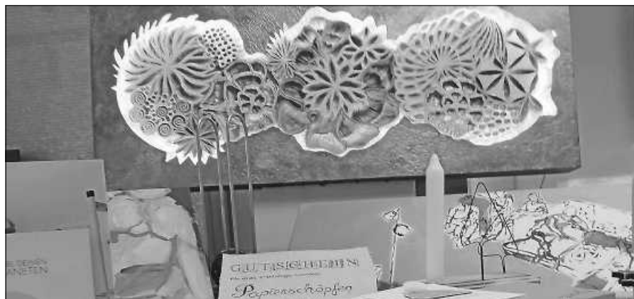
Lieblingsstücke für die Verlosung.

Die Öffnungszeiten des Adventsmarkts sind am Samstag von 15 bis 20 Uhr und am Sonntag von 11 bis 18 Uhr.