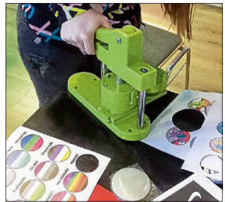
Kunst & Vielfalt - Kreativ-Workshop.

Rahmen ist sehr wichtig, damit sich Mädchen* offen und angstfrei austauschen, sowie informieren können. In der Gruppe können sie ihre Gefühle, Wünsche, Probleme und Bedürfnisse feststellen, besprechen und diskutieren. Außerdem erhalten sie Unterstützung und Beratung bei persönlichen Problemen und sie haben die Möglichkeit, sich einander und den Mitarbeiterinnen anzuvertrauen. Jedes neue Mitglied ist willkommen und kann einfach jeden Mittwoch im Gleis 3 unverbindlich vorbeischauen. ■