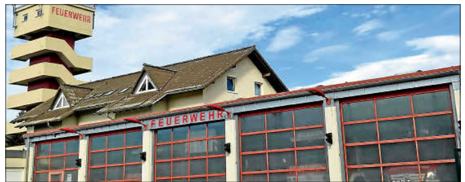
Die Feuerwehr wird mit digitalen Geräten ausgestattet.

Im Frühjahr 2024 steht die technische Aktualisierung des Tunnels an der B 462 an; in diesem Zusammenhang wird die Objektfunkanlage für die Kommunikation im Einsatzfall ebenfalls auf Digitalfunk umgestellt. In der Übergangszeit vom Umbau bis zur Beschaffung der erforderlichen Digitalfunkgeräte wäre eine Kommunikation unter den Rettungskräften bei einem Einsatz im Tunnel nicht mehr möglich. Die Zeit drängt