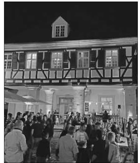
Erstes Adventsfestival in der Gernsbacher Altstadt.

Veranstaltungsort: Kornhaus Gernsbach, Hauptstraße 32, Veranstalter: Studio JØLG ■