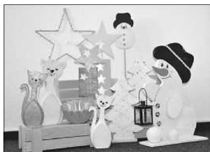
Auf dem Bazar gibt es weihnachtliche Holzarbeiten.

arbeiten, aber auch traditionelle und moderne Grüngestecke für die Adventszeit zum Verkauf an. Mit den Erlösen werden umfangreiche Maßnahmen in den Wohnheimen umgesetzt sowie die inklusive Theatergruppe „Grünschnäbel“ unterstützt. Beim Weihnachtsbazar am Sonntag in der Kulturhalle in Bad Rotenfels wird es ein Speisen- und Getränkeangebot sowie eine Kaffee- und Kuchentheke geben. Sitzmöglichkeiten sind umfangreich vorhanden. Das Veranstaltungsteam freut sich auf ein gemütliches Beisammensein von Menschen mit und ohne Behinderung. Nebenbei kann man sich über die aktuellen Projekte und Herausforderungen der Lebenshilfe, wie z. B. der Um- und Erweiterungsbau des Richard-Kunze-Hauses in Rastatt-Niederbühl oder die Gestaltung des Parkhotels in Gaggenau zu einem „Haus der Inklusion“ aus erster Hand informieren.