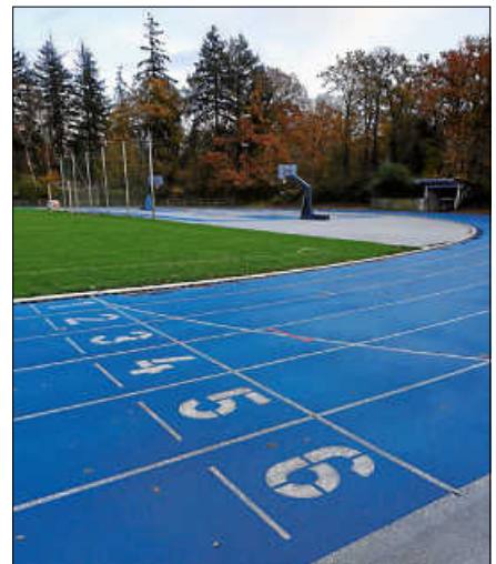
Studienorientierung im Unterricht – dieses Mal im Sport-Leistungsfach.

Mitgebrachte Smart-Watches animierten die Schülerinnen und Schüler zum Mitmachen und Mitdenken. Unter anderem wurde die Frage aufgeworfen, ob der Einsatz der Smart-Watch Trainingsvorteile mit sich bringt. Die Antwort lautet: Ja, aber nur mit Einschränkungen. Insbesondere bei intensiven Belastungen misst die Smart-Watch die Herzfrequenz zu ungenau. Bei gemütlichen Dauerläufen hingegen kann man sich auf den angezeigten Wert relativ gut verlassen. ■