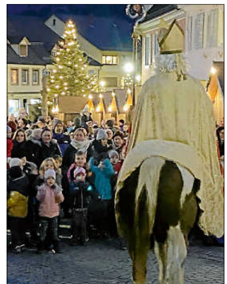
St. Nikolaus reitet am Nikolaustag durch die Altstadt.

Es wird empfohlen, die Stadtbahnlinien S8/S81/RE40/RB41 zu nutzen, um bequem und sicher zum Weihnachtsmarkt zu gelangen. Besucherinnen und Besucher aus der Region Karlsruhe und auch aus Baiersbronn und Freudenstadt haben bis in die späten Abendstunden Anschluss. ■