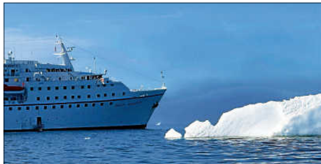
Eisberge beherrschen die Küste von Grönland.

gen mit den Auswirkungen des Klimawandels und der Veränderungen der kulturellen Identität der einheimischen Inuit. Der etwa 1,5-stündige Vortrag beleuchtet auch die Erlebnisse an Bord des Schiffes. Einlass 18.30 Uhr, Eintritt 7 Euro. Ticket Reservierungen gerne über die Homepage www.kultur-im-kirchl.de ■