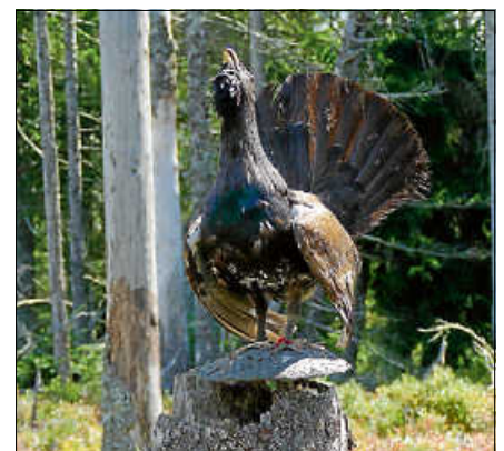
Das Auerhuhn - eines der schutzbedürftigen heimischen Wildtiere.

Wer den Wald liebt und die frische Luft genießt, wird sich im Sinne des Naturschutzes gerne an diese Regeln halten. ■