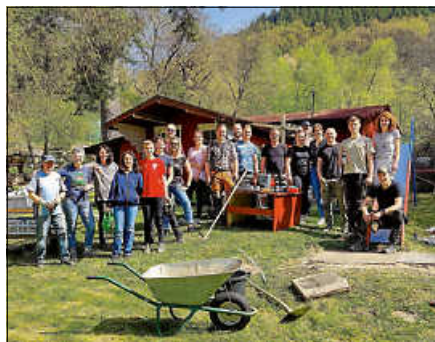
Freiwillige Helferinnen und Helfer beim Arbeitseinsatz im Schwimmbad.

Weitere kleinere Arbeitseinsätze können auch in Eigenverantwortung an anderen Terminen durchgeführt werden. Aktuelle Infos werden über die SIL-WhatsApp-Gruppe oder den Instagram- und Facebook-Account des „Schwellwogtreff Lautenbach“ bekannt gegeben. Der Förderverein freut sich auf die gemeinsame Zeit mit allen Helferinnen und Helfern sowie Badegästen im Schwimmbad Lautenbach.