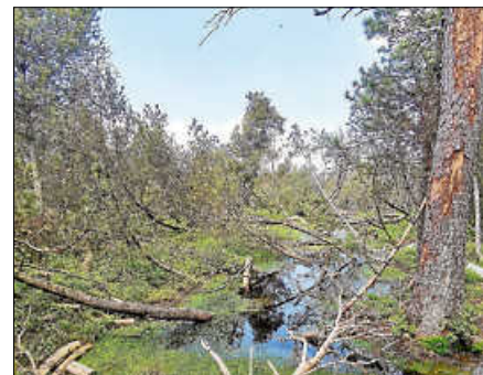
Hinter den Grabensperren staut sich das Wasser.