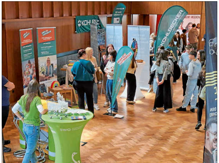
(Archivbild 2025) Interessierte Schülerinnen und Schüler am Stand der Stadt Gernsbach auf der Ausbildungsmesse.

Organisiert wird die Messe von der Fritz Automation GmbH und der Reichert GmbH. Die Stadt Gernsbach unterstützt die Veranstaltung umfassend – von der kostenlosen Bereitstellung der Stadthalle über Maßnahmen durch den Bauhof bis hin zur technischen Betreuung vor Ort. Darüber hinaus informiert die Personalverwaltung an einem eigenen