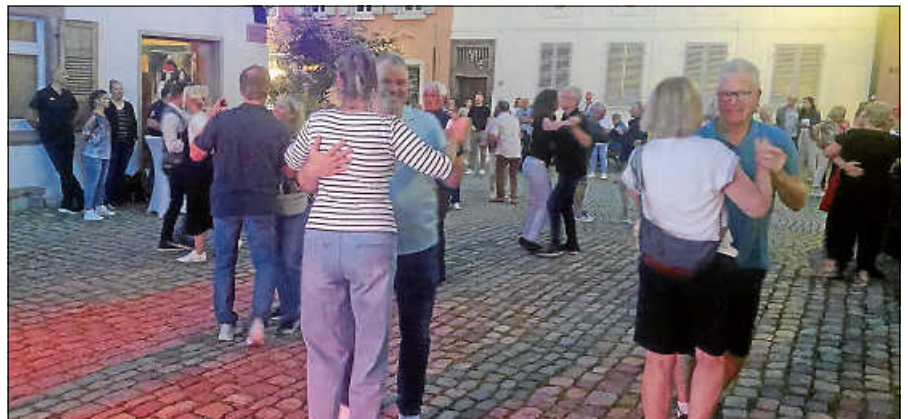
Gute Stimmung bei sommerlichen Abenden in der Altstadt.