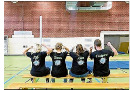
Das Team des Jugendhauses „Gleis 3“.

Der Terminkalender ist auch 2026 prall gefüllt. Neu ist das „Bewerbungstraining“, welches das Jugendhaus auf der