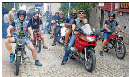
Zu 50 J. MCO gehört die Teilnahme am Dorfleben; hier beim Umzug zum 125. Jubiläum der Feuerwehr Obertsrot (2018).

Am Wochenende vom 25. - 26. April feiert der Motorradclub Obertsrot sein 50. Jubiläum mit dem legendären „Sägmühlfest“ in der alten Sägmühle in Obertsrot. Los geht es am Samstag mit der Murgtal- ausfahrt ab 14 Uhr. Gestartet wird ab der Sägmühle zu einer rund zweistündigen Fahrt durch den Schwarzwald. Hierzu sind alle Motorradfahrer und Motorradfahrerinnen herzlichst eingeladen. Am Samstagabend rockt ab 20.30 Uhr die Murgtäl Band „Bulletproof“ die Sägmühle. Die junge Cover-Band mit sechs Musikerinnen und Musikern aus dem Murgtal sorgt mit fetzigen Songs von Rock über Punk-Rock für gute Laune. Im Clubhaus wird ein Barbetrieb eingerichtet. Am Sonntag lädt der MCO ab 10 Uhr zum Frühschoppen ein, und nachmittags bietet die Kaffeebar eine große Kuchen- auswahl. Leckerer Grill und weitere Speiseangebote werden während der gesamten Festdauer angeboten. Zum Festausklang am Sonntagabend gibt es ab 18 Uhr noch einmal Live Musik mit den „Obertsroter Gammlern“, drei Jungs aus den Reihen des MCO-Nachwuchses, die mit Coversongs für beste Unterhaltung sorgen. Aufbauzeiten für MCO-Mitglieder: Freitag, 24.4., ab 14 Uhr sowie am Samstagvormittag ab 9 Uhr.