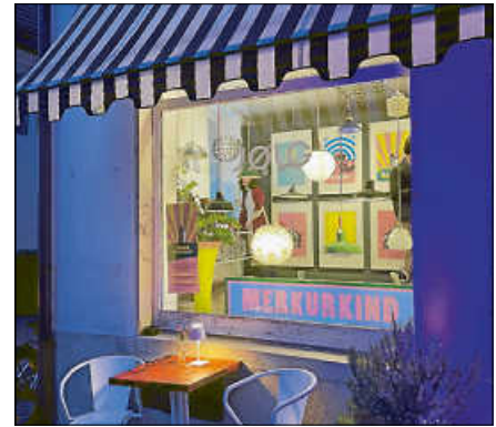
Studio JØLG während der abendlichen Öffnung einer vergangenen Ausstellung.

Im Anschluss ist die Ausstellung regelmäßig mittwochs und freitags jeweils von 10 bis 18 Uhr während der üblichen Öffnungszeiten des Studios zugänglich. ■