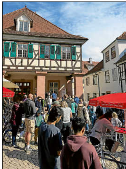
Bei schönstem Frühlingswetter fanden in den letzten Jahren bereits zahlreiche Fahrräder einen neuen Besitzer.

Alle Interessenten, die etwas verkaufen möchten, können dies um 10 Uhr auf Höhe des Kornhauses abgeben, mit dem gewünschten Kaufpreis. Pro verkauftem Fahrrad werden 10 % des Gewinns für einen guten Zweck einbehalten.