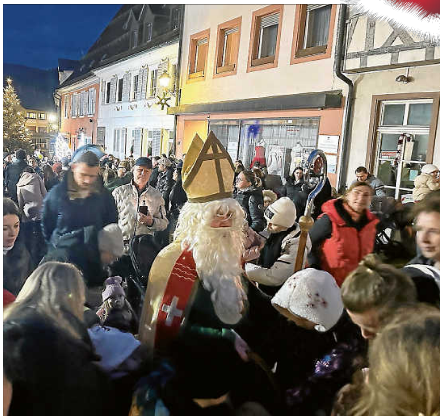
Ein besonderer Höhepunkt war der traditionelle Ritt des Heiligen Nikolaus durch die Altstadt.

Der Nikolaustag wurde so zu einem stimmungsvollen Erlebnis für die ganze Familie. ■