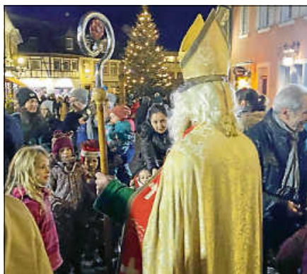
Auf dem Kornhausplatz verteilte der Nikolaus Äpfel und Nüsse.