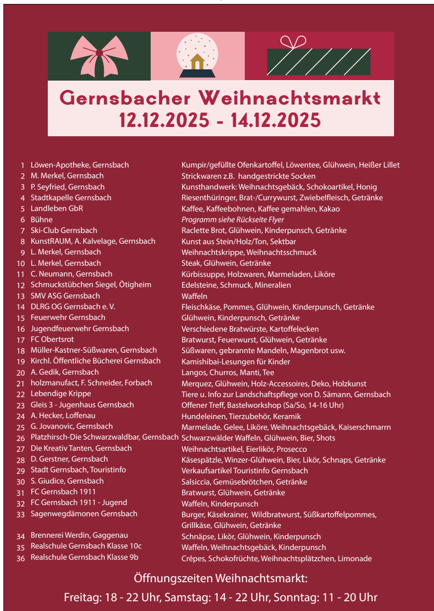
Die Teilnehmer am Weihnachtsmarkt.