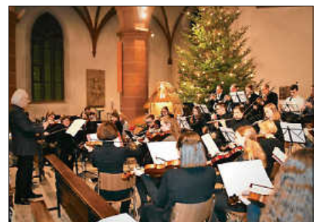
Das Orchester der Musikschule Murgtal lädt zum weihnachtlichen Konzert in die Liebfrauenkirche ein.

Bekannte Weihnachtslieder ergänzen das Programm. Die Musikerinnen und Musiker der Musikschule heißen Besucherinnen und Besucher herzlich willkommen. Der Eintritt ist frei. ■