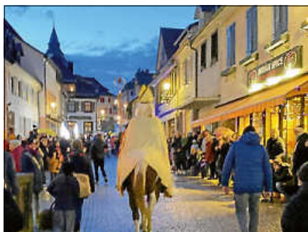
Der Nikolaus zog viele Besucherinnen und Besucher in die Altstadt.