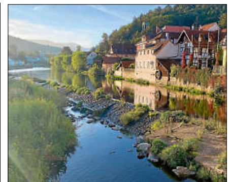
Verbesserung des Hochwasserschutzes an der Murg.

Nach Vorliegen der abgestimmten Genehmigungsplanung und der Erörterung