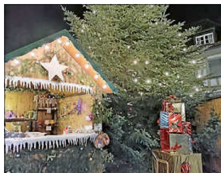
Weihnachtsmarkt in der Altstadt.

Öffnungszeiten: Freitag, 12. Dezember, von 18 bis 22 Uhr, Samstag, 13. Dezember, von 14 bis 22 Uhr, Sonntag, 14. Dezember, von 11 bis 20 Uhr. ■