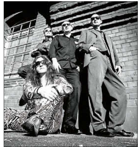
Die Band „On a fence“ tritt am Samstag im Kirchl auf.

hat die Band inzwischen auch viele neue deutschsprachige Titel im Programm. Die Texte erzählen von Alltag, Politik und großen wie kleinen Gefühlen – mal nachdenklich, mal augenzwinkernd. Dazwischen tauchen immer wieder eigenwillige Coverversionen bekannter Songs auf, die On a fence in ihrem ganz eigenen Stil interpretiert. Ein Konzert, das zum Zuhören, Mitwippen und Träumen einlädt – ideal für alle, die handgemachte Live-Musik und eine intime Konzertatmosphäre lieben. Im Kirchl passt diese Musik besonders gut: ganz nah an der Bühne, mitten im Klang. Der Eintritt kostet 12 Euro, Ticket-Reservierung gerne über die Homepage www.kultur-im-kirchl.de ■