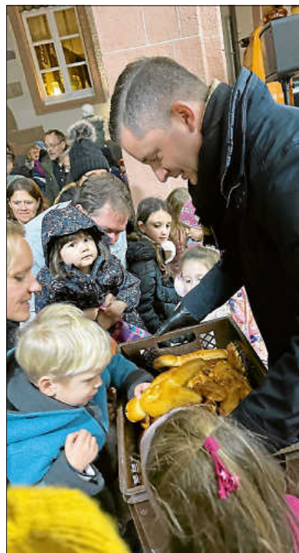
Der Bürgermeister überreichte die beliebten Dambedeis an die Kinder.