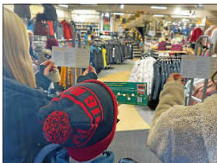
Sporthaus Fischer – Unter dem Motto „Zeig uns wie sportlich du bist!“ bewiesen die Kinder ihren Sportgeist.