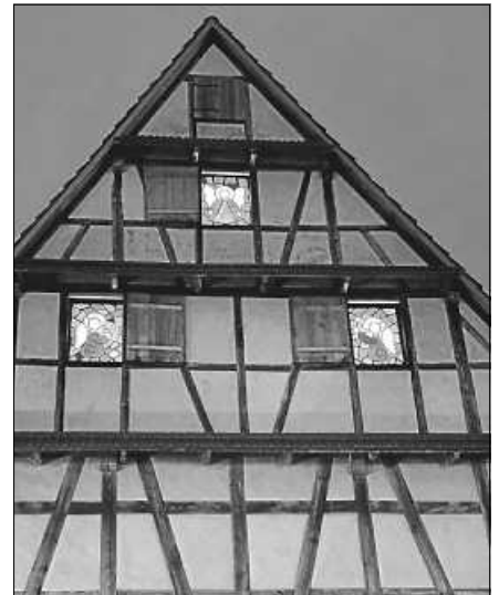
Westgabel der Zehntscheuern mit Fensterbildern von Bettina Scholzen.