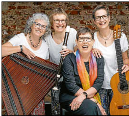
Märchen und Musik sind am kommenden Sonntag im Kirchl zu hören.