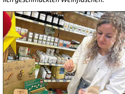
KräuterSchulte – „Riech mal! Erkennst du den Duft?“ Neugierig testen Kinder verschiedene Kräuter und Düfte im Laden.