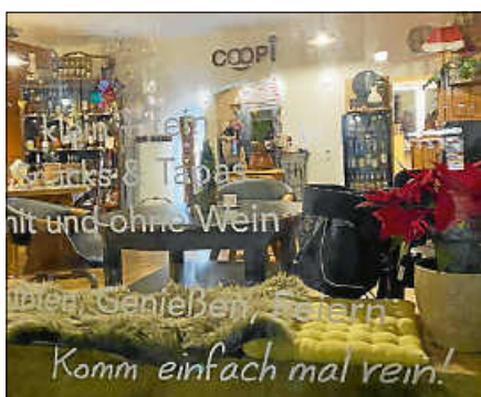
Coopi – Das Mitmach- und Kulinarik Angebot zog Groß und Klein ins Geschäft.