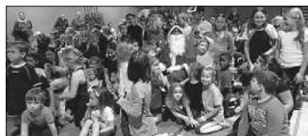
Der Nikolaus inmitten der Kinder.