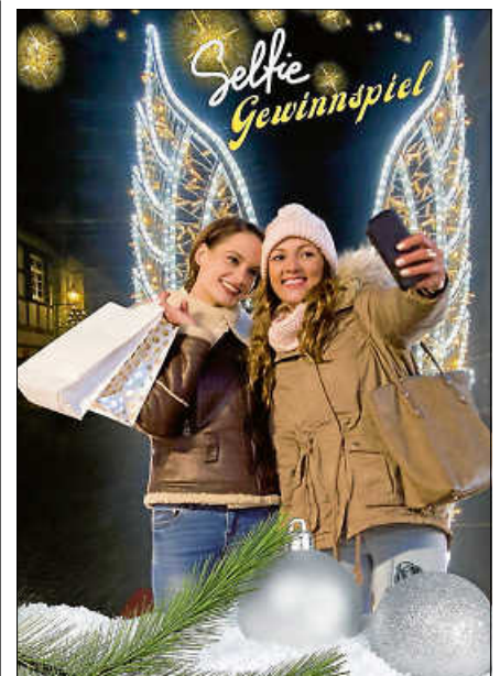
Strahlender Fotomoment am ‚Gernsbacher Engel‘-Selfie-Point – perfekt fürs Gewinnspiel.

Unter allen Teilnehmenden werden attraktive Preise vergeben: Der erste Preis ist ein Einkaufsgutschein des Gernsbacher Schaufensters im Wert von 200 Euro. Für die Plätze zwei bis fünf gibt es jeweils einen Einkaufsgutschein im Wert von 50 Euro zu gewinnen. Außerdem wird ein Sonderpreis für das kreativste oder witzigste Foto vergeben. Die Gewinnerinnen und Gewinner werden am 10. Januar 2026 bekannt gegeben. Teilnahmebedingungen und weitere Informationen unter: www.gernsbach.de/engel ■