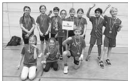
TVG Leichtathletik Team U12 mit Pokal für Platz 3 beim Kinderleichtathletik-Cup in Steinbach.