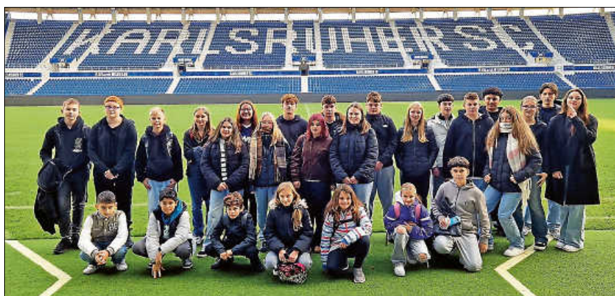
Die SMV im Fußballstadion - ein ganz besonderes Erlebnis.

Nach dem Frühstück gab es für alle eine Überraschung. Es stellte sich heraus, dass der Spaziergang, um frische Luft zu schnappen, zu einer Stadiontour des