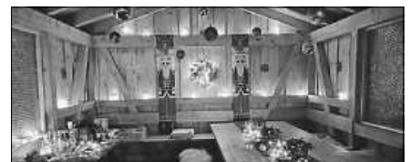
Für die Weihnachtsfeier wurde die Hardtberghütte traumhaft dekoriert.

Als kleines Dankeschön für die Mühen und das Geleistete in 2025 war die Vorstandschaft mit Anhang zu einer gemütlichen Weihnachtsfeier eingeladen. So trafen sich die Teilnehmenden um 17 Uhr am Nikolaustag zum gemeinsamen Abmarsch am Sternenplatz. Alle waren begeistert, was an der Hardtberghütte geboten wurde. Wunderschön illuminiert und dekoriert von den Dekoqueens wartete ein reichhaltiges Speise- und Getränkeangebot, welches mehr als nur entschädigte für den absolvierten Fußmarsch. Der Grill war schon angeheizt und diverse Vorspeiseplatten ließen die Augen immer größer werden. In geselliger Runde und bei netten Gesprächen konnten unterhaltsame Stunden in atemberaubender Atmosphäre genossen werden. Bis spät in den Abend hinein wurde auch immer wieder über erfolgreiche Projekte der Dorfgemeinschaft – aber auch über Ideen für die Zukunft – gefachsimpelt, bevor dann der Rückweg bei Taschenlampenlicht angetreten wurde.