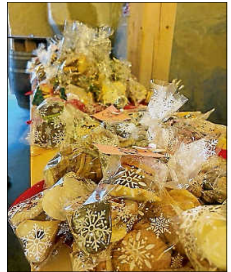
Selbstgebackene Plätzchen für die Adventszeit.

Mit ihrem Engagement, ihrer Kreativität und ihrem musikalischen Beitrag haben die Schülerinnen und Schüler den Adventsmarkt bereichert und ein warmes, stimmungsvolles Zeichen in der Vorweihnachtszeit gesetzt. ■