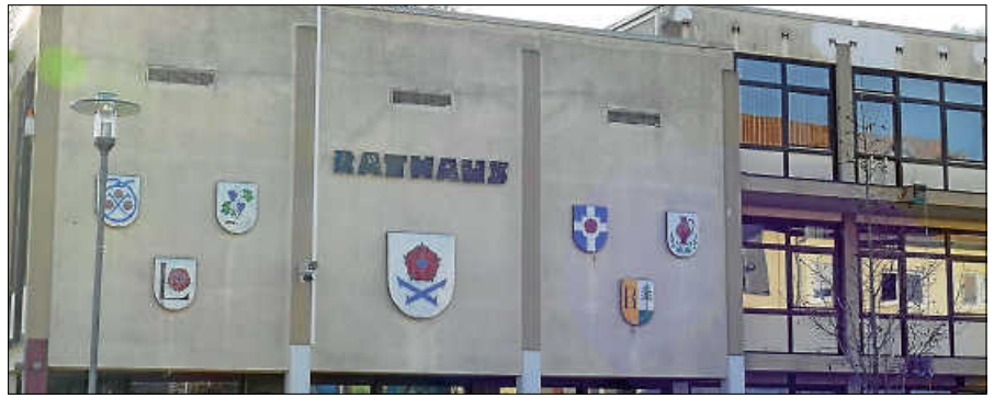
Gemeinderat beschließt: erst Reform, dann Einbringung des Haushaltes.

Die finanzielle Situation der Stadt Gernsbach wird in erster Linie durch die Kreis-, Landes- und Bundesebene bestimmt. Kämmerer Benedikt Lang hebt hervor: „In Baden-Württemberg waren Ende 2024 mehr als 90 Prozent der Städte und Gemeinden verschuldet. Nur noch