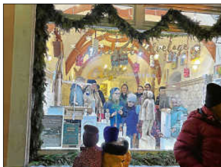
KUNSTRaum – „Suche das Kunstwerk mit einem Stern!“ Spannende Kunstsuche: Kinder entdecken das verborgene Sternkunstwerk.