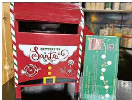
Am Gewinnspiel-Briefkasten an der Grillhütte warfen die Kinder stolz ihre ausgefüllten Sammelkarten ein.