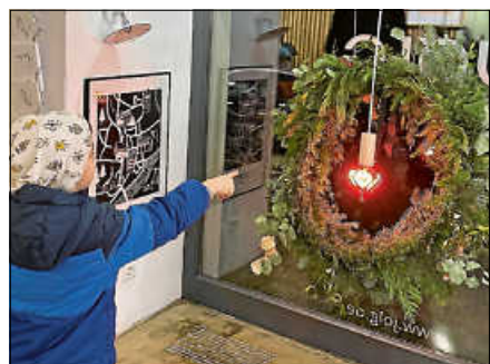
Jølg – „Wie viele Lampen leuchten im Fenster?“ Kleine Rätselfreunde zählen aufmerksam die Lichter im Schaufenster.