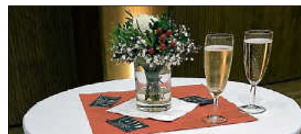
Neujahrsempfang in der Stadthalle.

In diesem feierlichen Rahmen findet die Würdigung ehrenamtlich engagierter Gernsbacherinnen und Gernsbacher statt, verbunden mit der Übergabe städtischer Verdienstmedaillen. Musikalisch umrahmt wird der Abend durch den