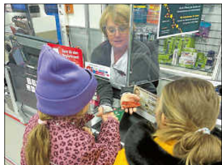
Rossmann – „Wie viele Nikoläuse hängen von der Decke?“ Freudiges Staunen beim Blick nach oben: Kinder zählten die schwebenden Nikoläuse, um sich im Anschluss ihre Belohnung abzuholen.