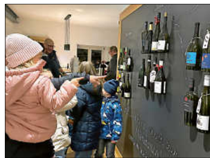
Weinschmecker – „Wie viele Flaschen mit roten Schleifen?“ Mit aufmerksamem Blick zählten Kinder die weihnachtlich geschmückten Weinflaschen.