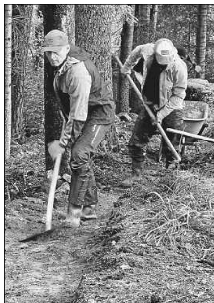
Trailbau am Steinedeck Trail.

Am Sonntag, 14. Dezember, findet um 11 Uhr die wöchentliche Sonntagsrunde statt. Teilnehmen kann jede/jeder mit einem funktionstüchtigen MTB oder E-MTB. Bei allen Touren des MTB-Murgtal besteht Helmpflicht. Anmeldung sowie weitere Informationen wie Tourdaten, Anforderungen an Kondition und Fahrkönnen finden sich unter www.mtb-murgtal.de/sonntagsrunde .