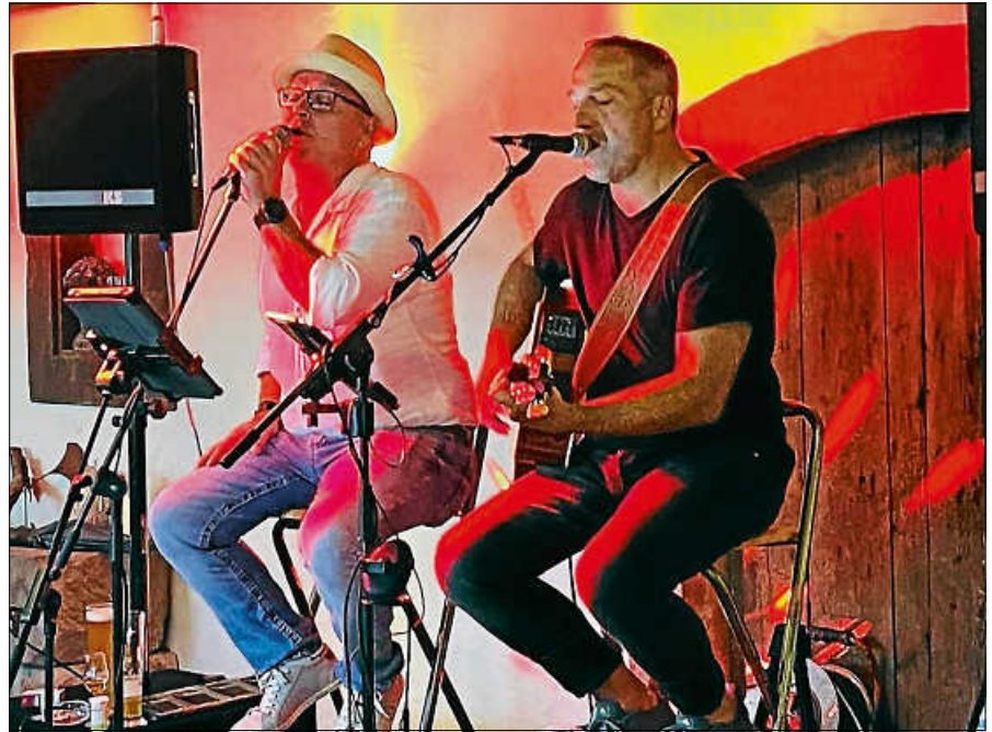
CRAC - Classic Rock Acoustic Cover.

Samstag, 11. November 2023, Beginn 20 Uhr, Einlass 19 Uhr, Eintritt 12 Euro. Ticket Reservierung gerne über die Homepage www.kultur-im-kirchl.de ■