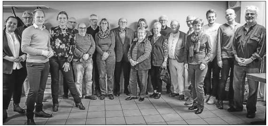
SPD Gernsbach bei der vergangenen Jahreshauptversammlung 2022