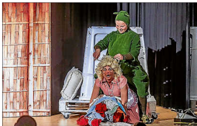
Urmel aus dem Eis.

Die Veranstaltungsbesucherinnen und -besucher werden darum gebeten, die StVO-Regeln beim Parken einzuhalten. ■