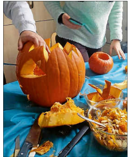
Kürbis schnitzen im Jugendhaus.

Ein Angebot für queere Jugendliche und alle, die sich für das Thema interessieren, das montags von 16:00 bis 18:00 Uhr stattfindet. Das Jugendhaus hat eine Mädchengruppe „Girl*Space“. Dieses Angebot richtet sich an Mädchen* ab 13 Jahren und findet immer mittwochs von 16 bis 19 Uhr statt. Ziel ist die Gleichstellung der Geschlechter und hilft, Ungleichheiten und Diskriminierungen zu überwinden. Mädchen* sollen ihr Selbstbewusstsein stärken und dazu ermutigt werden, ihr Potenzial auszuschöpfen. Außerdem findet am Samstag, den 18.11. zum diesjährigen Tag der offenen Kinder-