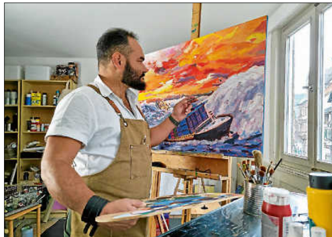
Der Künstler gibt Einblicke in seine Arbeit.