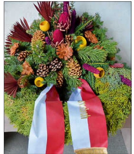
An den Gedenkstätten werden Kränze der Stadt Gernsbach niedergelegt.

In stillem Gedenken werden Kränze zu Ehren der Verstorbenen an den Denkmälern niedergelegt. ■