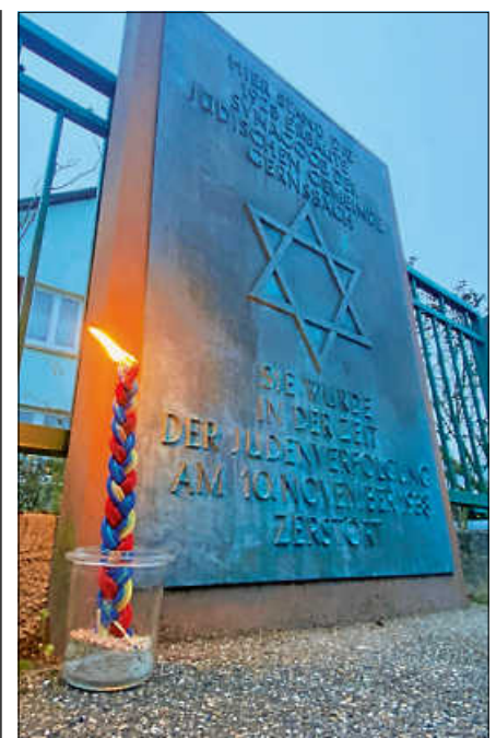
Gedenktafel für die ehemalige Synagoge in der Austraße.

Hinweis: Eine Broschüre zum Sabbatweg Gernsbach ist für 5 Euro bei der Touristinfo Gernsbach erhältlich. ■