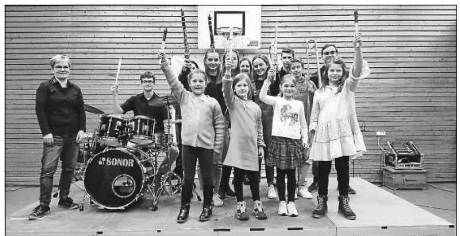
Der Jugend gefällt, dass sie sich präsentieren durften.