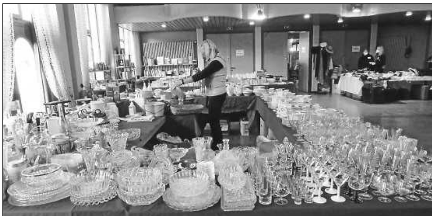
Auf dem Soroptimist Basar finden Sie ein reichhaltiges Angebot zu Schnäppchenpreisen.

Traditionsgemäß begleiten wir am Samstag, 11.11.2023 ab 17.30 Uhr den St. Martin Umzug des Kindergartens Fliegenpilz in Gernsbach.