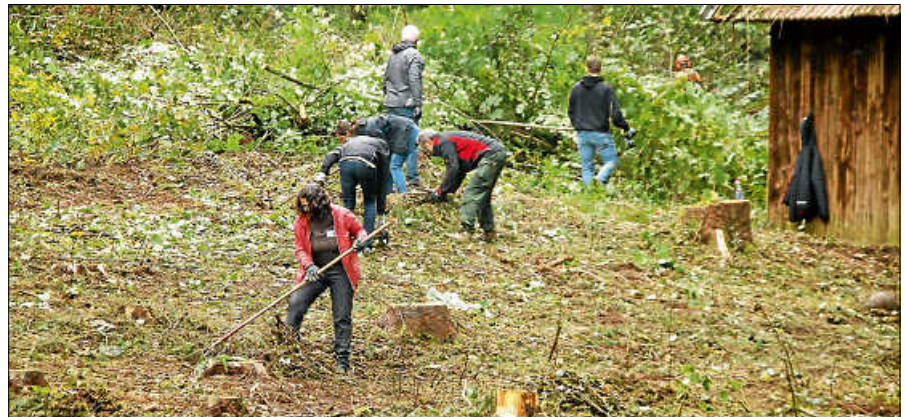
Beschäftigte von Daimler Truck helfen im Rahmen eines Aktionstags, Flächen in Hilpertsau freizulegen.

Das Forstrevier Gernsbach hat bereits vor dem Aktionstag gute Vorarbeit geleistet und mehrere standortfremde Fichtenriegel entfernt. Das Reisig, das auf den Flächen liegen geblieben war, musste von Hand entfernt und teilweise über den Bach getragen werden. Der Landschaftserhaltungsverband hat für den Aktionstag zusätzlich mehrere Dienstleister engagiert, die vor Ort wei-