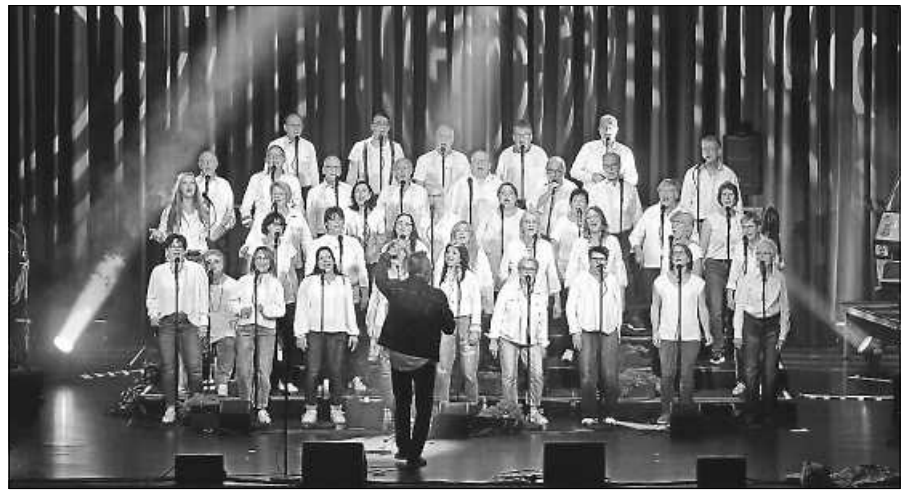
Salt o vocale begeisterte mit Streetparty.

Im zunehmenden Tageslicht geht es danach über den malerisch gelegenen Herrenwieser See zurück nach Herrenwies, wo sich alle bei einem schönen Frühstück in unserer Hütte stärken können. Der Treffpunkt ist entweder um 5.30 Uhr auf dem Parkplatz in Herrenwies oder um 5 Uhr am Bahnhof Forbach (Mitfahrgelegenheit). Die Strecke ist ca. 10 km (290 Hm) lang. Bitte warme und wetterfeste Kleidung und feste Schuhe anziehen, eine Stirnlampe oder Taschenlampe, sowie etwas (Warmes) zum Trinken mitnehmen. Unbedingt anmelden bei Dorothea Polle-Holl, 07228/9699518, doropolle@gmail.com