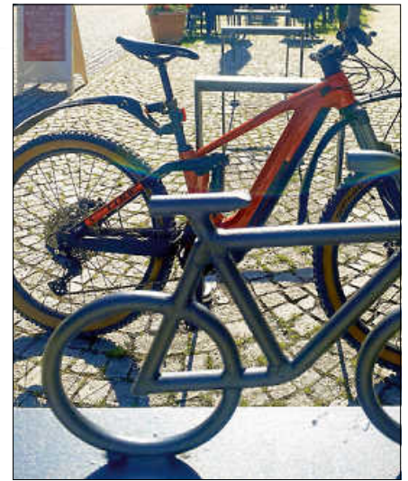
U. a. gibt es noch freie Plätze bei Themen rund ums Rad: Praktische Radausbildung für Kinder ab 8 J., MTB-Fahrtechnik für Anfänger ab 10 J. und mehr.