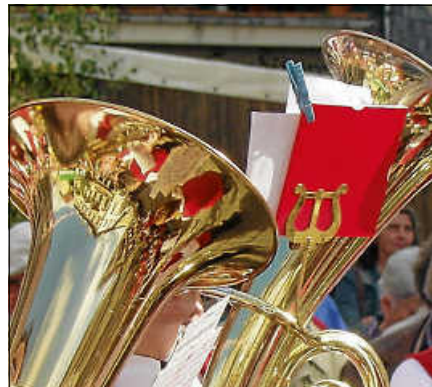
Freie Plätze gibt es noch bei Events rund um „Musik mit Spaß“: Nr. 7, 13, 23 und 40.

11.09.2026 Nr. 40 Spiel und Spaß beim Musikverein Lautenbach (ab 6 Jahren)