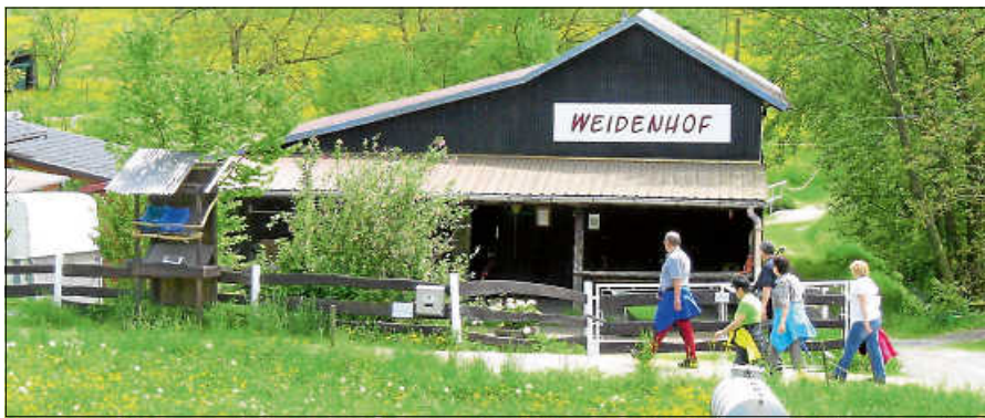
Der Netzwerk- und Erlebnistag auf dem Weidenhof lädt zu spannenden Einblicken und persönlichem Austausch ein.