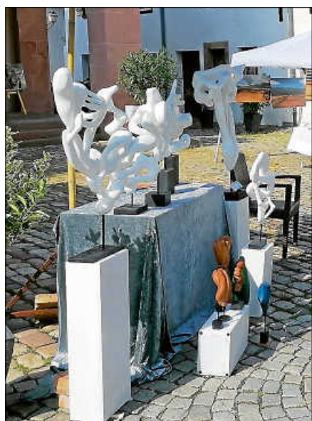
Montmartre in Gernsbach.

bei schlechter Witterung – veröffentlicht die Stadt Gernsbach auf ihrer Homepage und ihren Social-Media-Kanälen. ■