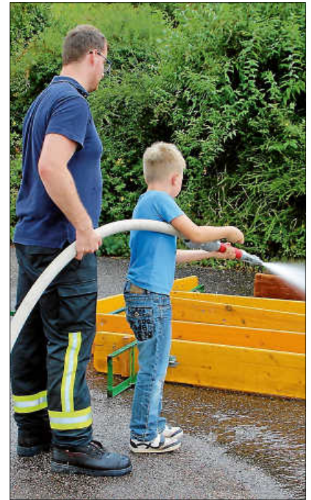
Verschiedene Feuerwehrabteilungen bieten Spiel- und Spaßaktionen.

11.09.2026 Nr. 41 Feuerwehr Staufenberg – ohne Anmeldung