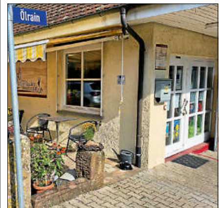
Platzkonzert am Dorfladen Reichental.

entfallen. Die Vereinsmitglieder freuen sich darauf, viele Gäste beim Platzkonzert begrüßen zu dürfen. www.musikverein-reichental.de