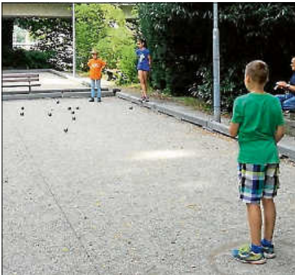
Neue Hobbys kennenlernen: Anmeldungen sind noch möglich bei Boule und Tennis.

12.08.2026 Nr. 17 Boulespiel kennenlernen (ab 7 Jahren)