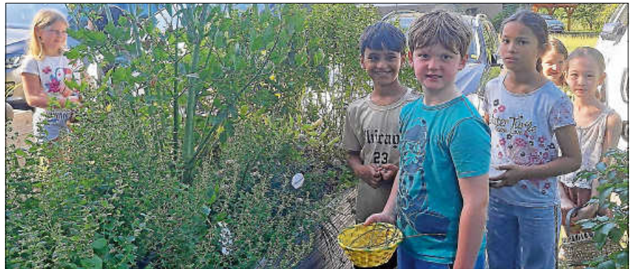
Die Kinder bei der Ernte der Kräuter.

Neben Geschmack, Geruch und Aussehen standen auch ihre Verwendungsmöglichkeiten als Heilmittel im Mittelpunkt der Veranstaltung. So