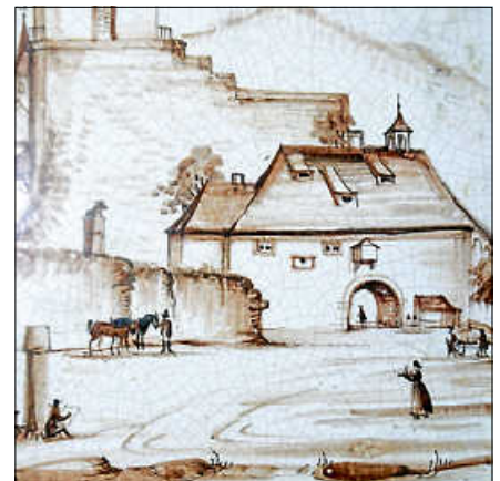
Ofenkachel mit Eingang zur Neueberstein.

Für die projektierte Dauerausstellung konnte ein weiteres schönes Stück gefunden werden. Herr Faber hatte eine im Bauhof sorgsam aufbewahrte Kachelsammlung in die Zehntscheuern verbracht. Von den Zimmerleuten der Heinrich-Hübsch-Schule in Karlsruhe wurden sie vom Erdgeschoss an den geplanten Aufstellungsort getragen. Eine erste Sortierung ergab, dass die Sammlung aus 119 historischen Ofenkacheln besteht, welche sich in 18 verschiedene Formteile aufgliedert. Verpackt waren sie in einer Ausgabe der Frankfurter Allgemeinen Zeitung vom 30. Januar 1987. Deren aufgedruckter Zustellvermerk lautet: „HOLTZMANN + CIE AG, POSTFACH 1301. Nun herrscht eine aufgeregte Suche nach dem ursprünglichen Herkunftsort der Kacheln. Möglicherweise stammen sie aus der abgängigen Böhmvilla. Ziel ist es, den Kachelofen trotz seiner fehlenden Teile aufzustellen, um die schönen Motive auf den Kacheln zeigen zu können.