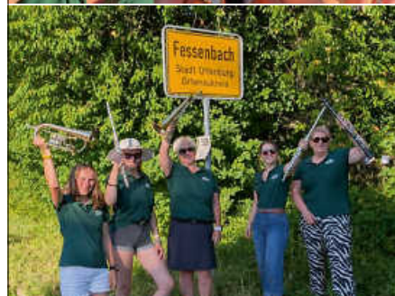
Musikerinnen vom MV Lautenbach in Fessenbach.

Förderverein Schwimmbadinitiative Lautenbach e.V.