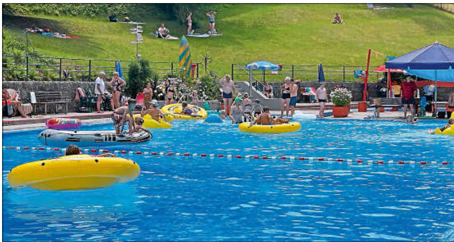
Wasserspaß beim Kinderfest