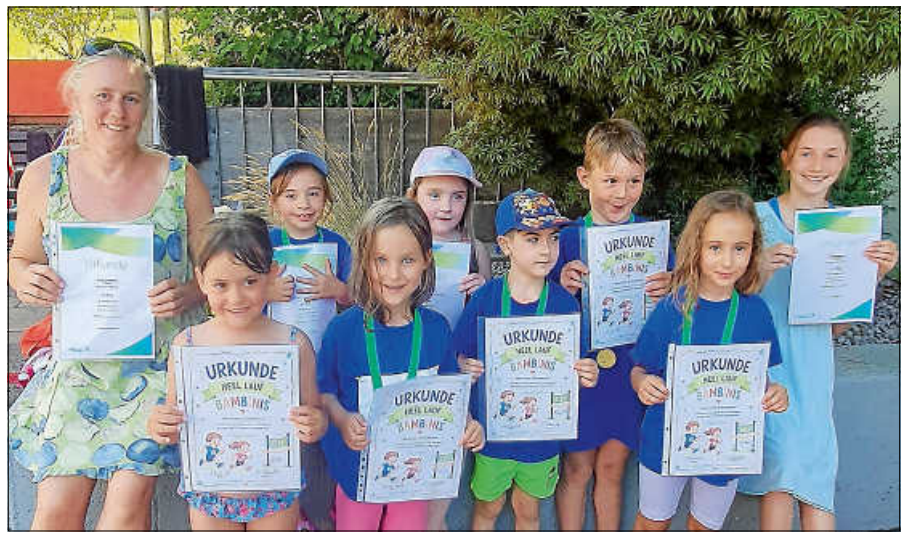
Einige Teilnehmer und Teilnehmerinnen bei der Urkundenübergabe.