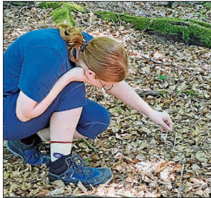
Achtsamkeit im Wald.

Gemeinsam mit Waldpädagogin Anke Scholz entdecken die Teilnehmenden den Wald als Ort der Ruhe, Entspannung und Achtsamkeit. Sie nehmen sich bewusst Zeit zum Innehalten, schärfen ihre Wahrnehmung und erleben die Natur mit allen Sinnen. Durch achtsame Übungen zur Entschleunigung und Selbstwahrnehmung bietet die Veranstaltung Gelegenheit, Abstand vom Alltag zu gewinnen, das Gedankenkarussell zur Ruhe kommen zu lassen und neue Energie zu tanken.