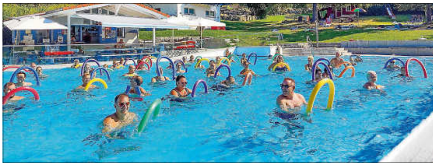
Aquagym im Schwimmbad Lautenbach.

Nach dem riesigen Erfolg in den letzten Jahren, bietet die Schwimmbadinitiative Lautenbach (SIL) auch diese Saison wieder Aquagym an.