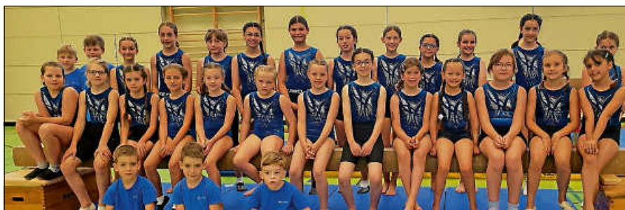
Die Teilnehmer des Frühjahrswettkampfes.

Der Förderverein Schwimmbad Obertsrot lädt Klein und auch Groß am Samstag, 11.7., wieder zum beliebten Kinderfest ein. Von 14 bis 18 Uhr wird den kleinen und auch den