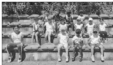
Spannung und Vorfreude vor dem Wettkampf

In den Sommerferien bietet der TV Obertsrot die Möglichkeit an, das Sportabzeichen zu absolvieren. Terminabsprachen sind unter der Nummer 07224/6577791 oder über die Übungsleiter möglich.