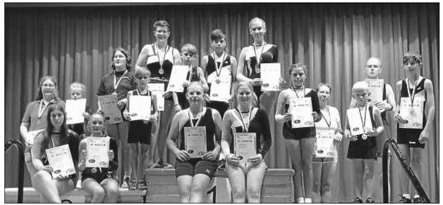
Stolze Teilnehmer am Gauturnfest.