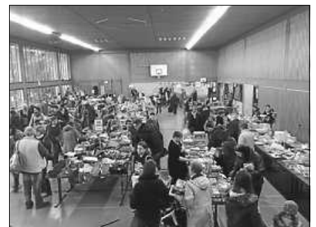
Schnäppchenjagd beim KidsBazar.

Am Freitag, 26. August, ist auf dem Dorfplatz ab 18 Uhr Feierabendgrillen. Das Cateringteam vom Treffpunkt wird die Besucher mit allerlei Köstlichkeiten kulinarisch verwöhnen. Bei Regen fällt das Grillen aus.