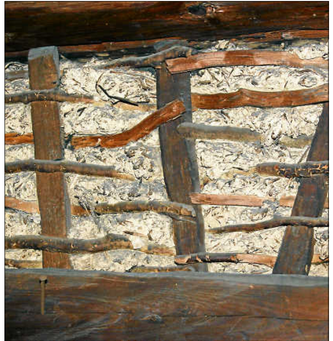
Bei den Führungen durch die Zehntscheuern werden die Techniken des alten Bauhandwerks sichtbar.

Im Jahr 2020 bewarb sich die Stadt Gernsbach erfolgreich um die Aufnahme in das Förderprogramm. ■