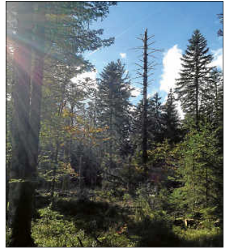
Sonne im Bannwald.

Anmeldung unter www.infozentrum-kaltenbronn.de oder 07224 655197. Bitte beachten Sie die Straßensperrung der L 76b zwischen Gernsbach-Reichental und Kaltenbronn. Bitte nutzen Sie die ausgeschilderte Umleitung über Besenfeld. ■