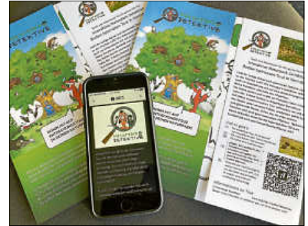
Die interaktive Smartphone-Rallye bietet viel Spaß.

Gernsbach erhältlich, beides wird für die Durchführung der Tour nicht zwingend benötigt. ■