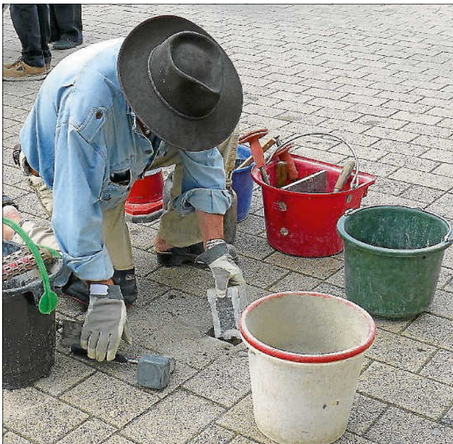
Der Kölner Künstler Gunter Demnig bei der Stolpersteinverlegung im September 2020.

Für die Veranstaltung gilt Abstandsgebot und die 3G-Regel (in der Warnstufe) bzw. die 2G-Regel (in der Alarmstufe). ■