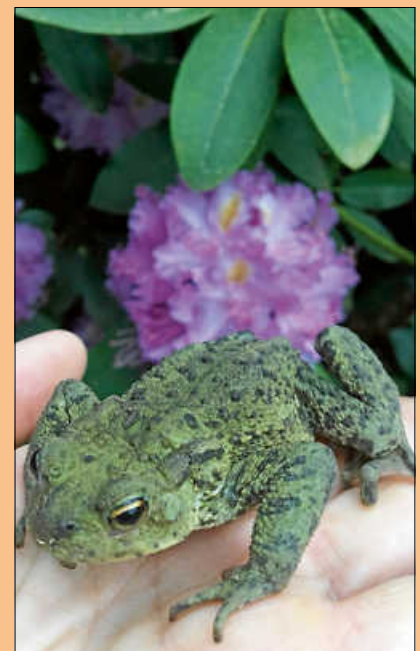
Kröte und Hortensie.