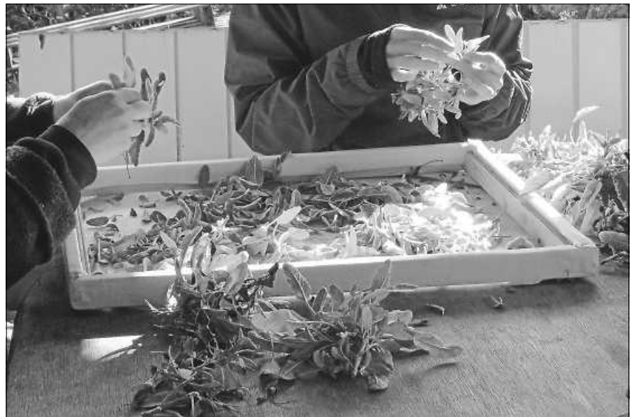
Helpende Hände bei der Kräuternernte.

Der Obst- und Gartenbauverein Gernsbach (OGV) bietet einen Winterschnittkurs für Obstbäume und Beerensträucher an. Hierbei lernen Neueinsteiger und auch erfahrene Interessenten, worauf beim Schnitt der verschiedenen Baum- oder Straucharten in deren jeweiligen Entwicklungsstadien zu achten ist, um langfristig robuste sowie gesunde und ertragsreiche Obstbäume und Beerensträucher zu haben.