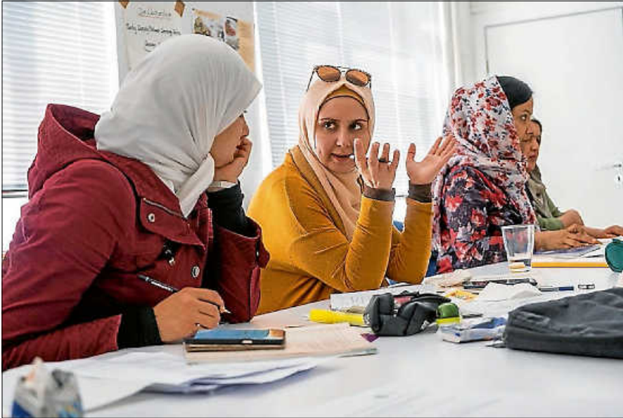
Die Sprachkurse werden gerne in Anspruch genommen.