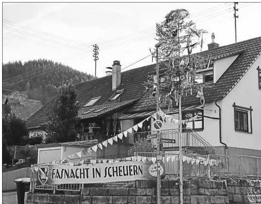
Narrenbaum in Scheuern.

Aufgrund der noch immer geltenden Corona-Regelungen besteht während