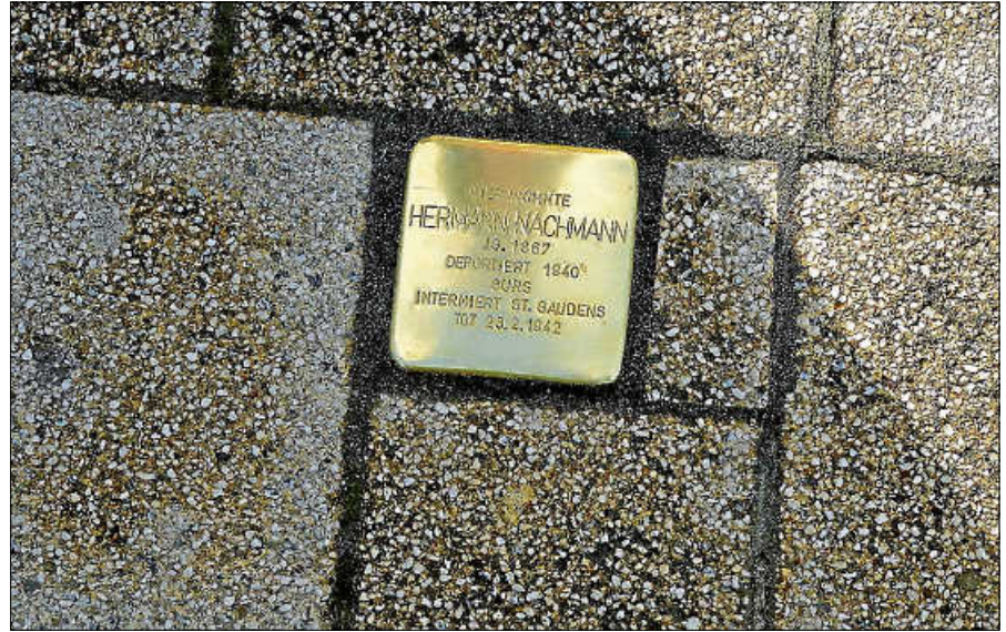
Einer der bereits verlegten Stolpersteine in der Bleichstraße.