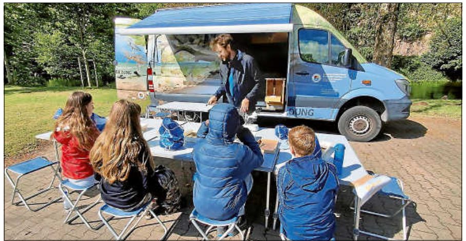
Am Fischmobil durften die Kinder den Lebensraum der Fische mikroskopisch untersuchen.

Mit Ihren Besatzaktionen tragen Sie in vorbildlicher Weise zum Natur- und Artenschutz sowie zur Umwelt- und Ernährungsbildung bei“, hob er das Engagement der Organisatoren hervor. ■