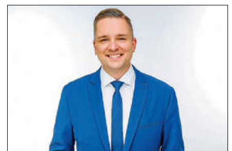
Bürgermeister Christ kandidiert in Offenburg.

Die Oberbürgermeisterwahl in Offenburg findet am 11. Oktober statt. ■