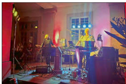
Musikalische Unterhaltung durch die Live Band HP Weiss.

sowie über die Social-Media-Kanäle veröffentlicht. Veranstalterin ist die Wirtschaftsförderung Gernsbach. ■