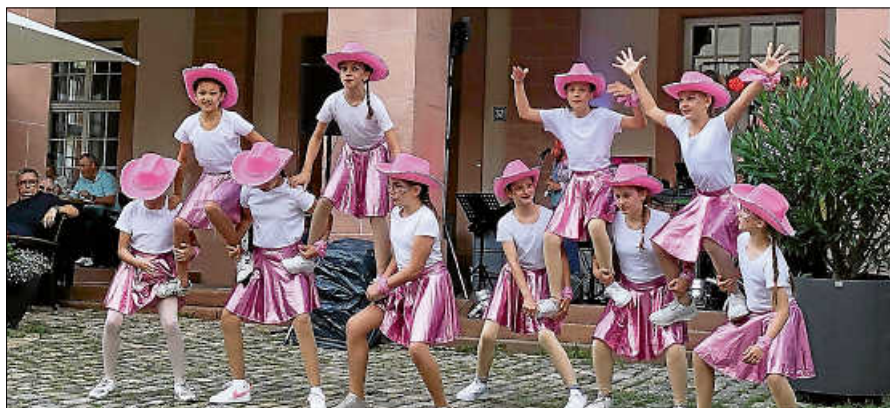
Show-Tanz-AG des ASG.

Die Veranstaltungen finden nur bei guter Witterung statt. Aktuelle Informationen zu Änderungen oder Absagen werden rechtzeitig auf der städtischen Website