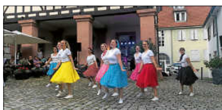
Die Illusions-Showtanzgruppe beim Tanzevent 2025.