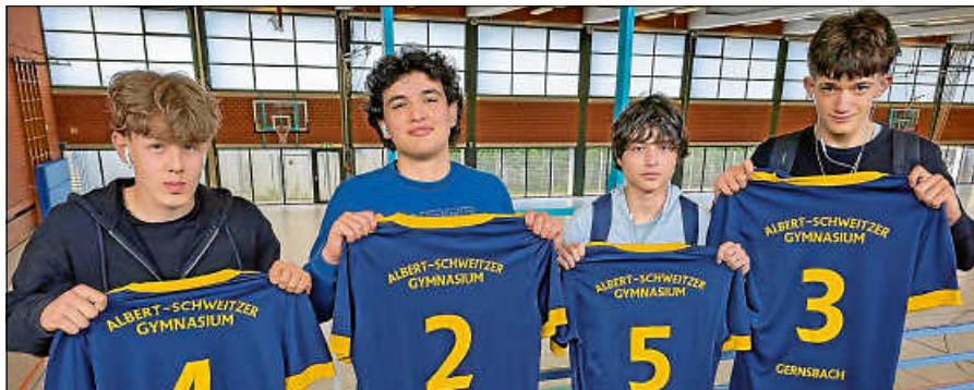
Selbstbewusst - das ASG-Team unter der Leitung von Sportlehrer Christoph Haas, der hinter der Kamera steht.

In der Vorrunde mussten sich die Spieler dann auch gegen die starken Teams aus Mannheim sowie Remchingen trotz vollem Einsatz in beiden Partien geschlagen geben. Doch die Jungs ließen den Kopf nicht hängen, denn in den anschließenden