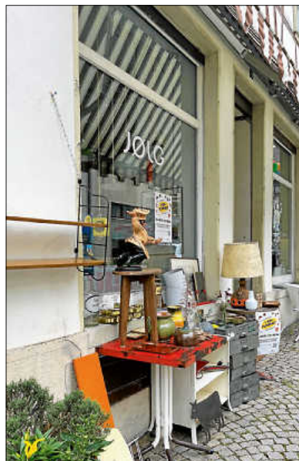
Bunte Stände bieten allerlei Raritäten und Schnäppchen.