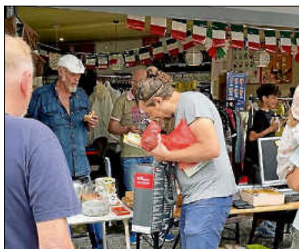
Großes Interesse beim 1. Hofflohmmarkt 2024.

Parallel dazu locken die traditionelle Schlossberg-Historic des AC Eberstein und der verkaufsoffene Sonntag viele Besucherinnen und Besucher in die Stadt, die dann sicherlich auch gerne bei den Flohmarktständen auf Entdeckungstour gehen. ■