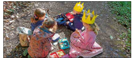
Die Könige des Waldes bei der Vesperpause.

So hatte dann jedes Kind beim Nachhausegehen eine individuelle Krone erstellt, auf die sie mit Recht stolz sein konnten. ■