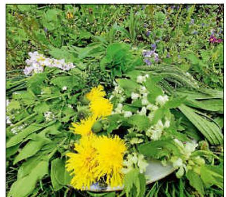
Wildkräuter im Frühling.

Mehr Infos unter www.kraeuterwerkstatt.de ■