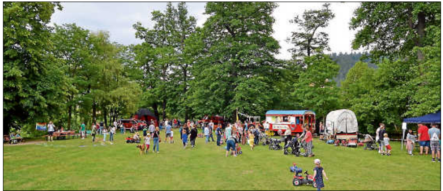
Kinderfest auf der Murginsel.