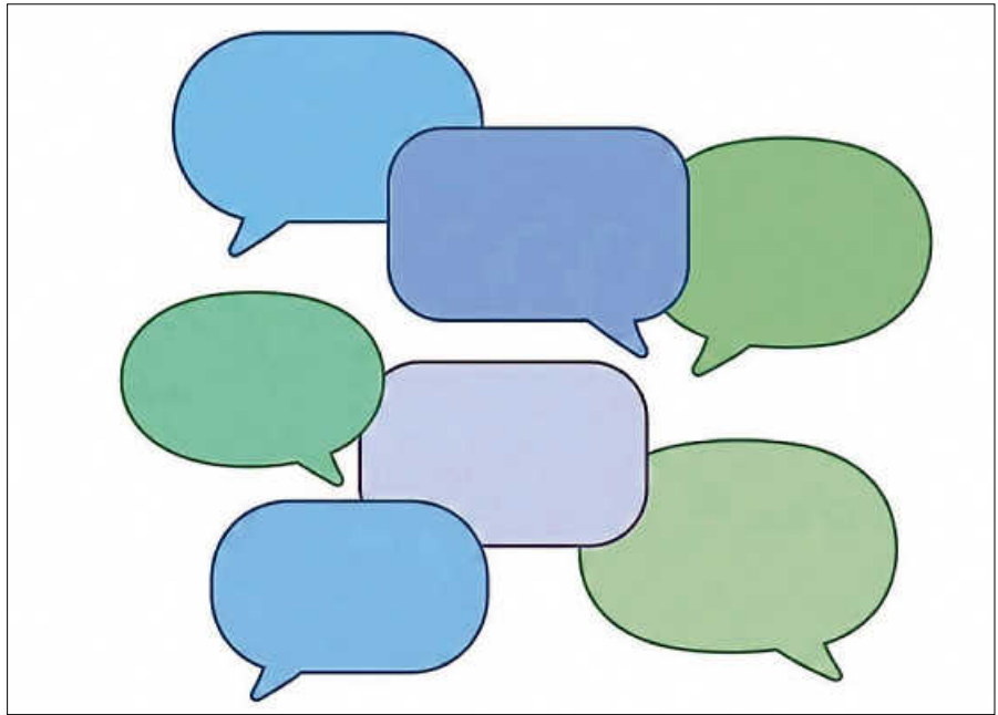
Gespräche mit Vereinen und Initiativen.

Ein Großteil der angeschriebenen Vereine und Initiativen hat sich bereits zurückgemeldet. Die zunächst kurze Rückmeldefrist hatte organisatorische Gründe, da möglichst schnell mit den Gesprächen begonnen werden sollte. Gleichzeitig kam es beim Versand der