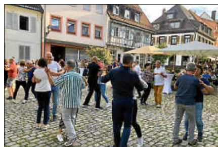
Gute Stimmung beim Tanzevent 2025.