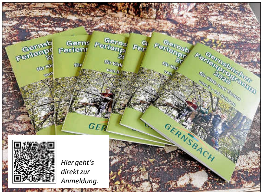
Die neue Broschüre ist da.

Wie in den vergangenen Jahren erhält die Stadt auch in diesem Jahr wieder Unterstützung von vielen Vereinen, Institutionen, Firmen und engagierten