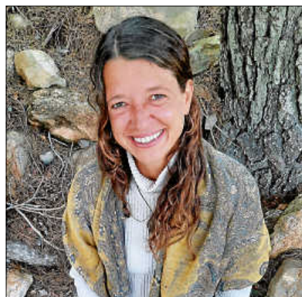
Einladung zum Erlebnisabend „Heilsames Singen“.

Der Eintritt ist frei. Anmeldungen sind nicht erforderlich. Kontakt: www.reha-zentrum-gernsbach.de ■