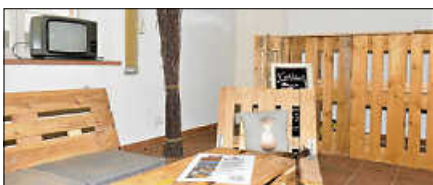
Das Erdgeschoss steht für den KORner Store zur Verfügung.

D ie Wirtschaftsförderung der Stadt Gernsbach startet mit dem „Pop-up KORner Store“ ein neues Gemeinschaftskonzept mitten in der Altstadt. Gesucht werden kreative Anbieterinnen und Anbieter, regionale Marken, Künstlerinnen und Künstler, Designerinnen und Designer und Manufakturen, die ihre Produkte gemeinsam auf einer Fläche präsentieren möchten.