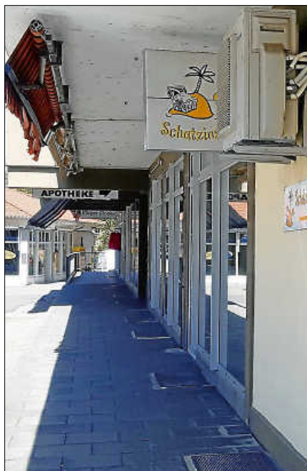
Archivbild: In Gernsbach stehen einige Gewerbeimmobilien leer.

den ersten Kontakt zwischen Interessierten und Eigentümern her. Für Angaben zu einzelnen Gebäuden und Grundstücken übernimmt die Stadt keine Haftung. ■