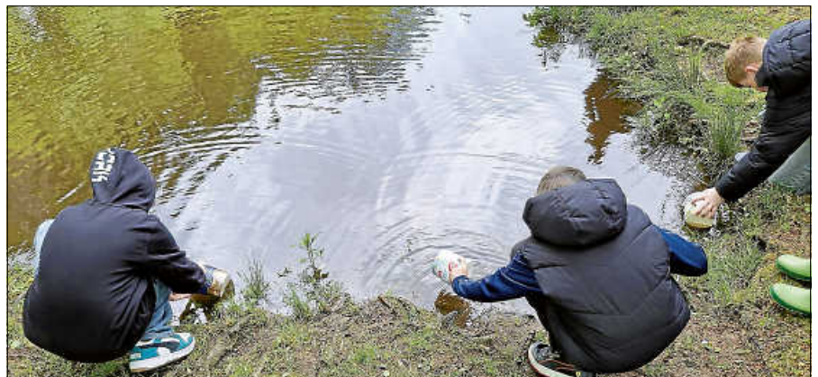
Begeistert entlassen die Kinder die kleinen Lachse aus Eimern in die Murg.