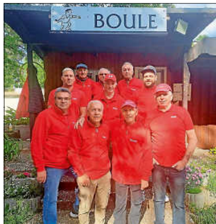
1. Mannschaft BFG

liga) antreten. Der Termin muss noch vereinbart werden.