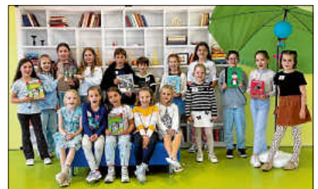
Die VorleseKinder beim Vorlesetag der Grundschule Gernsbach.

Dank der Unterstützung vieler Helferinnen und Helfer wurde der Nachmittag zu einer rundum gelungenen Veranstaltung. Für das leibliche Wohl sorgten die Eltern der Viertklässler, die die Bewirtung hervorragend organisierten. Die Grundschule Gernsbach bedankt