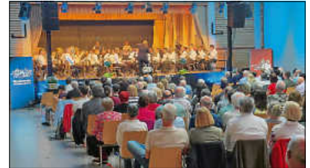
Gut besuchtes Freundschaftskonzert in der Ebersteinhalle.

Der lang anhaltende Applaus zeigte: Dieser Abend war mehr als ein Konzert. Er war gelebte Gemeinschaft. Ein herzliches Dankeschön gilt allen Mitwirkenden, Helferinnen und Helfern, der Tontechnik sowie den vielen stillen Unterstützern und den Sponsoren, die dieses Konzert möglich gemacht haben. Infos: www.musikverein-reichental.de