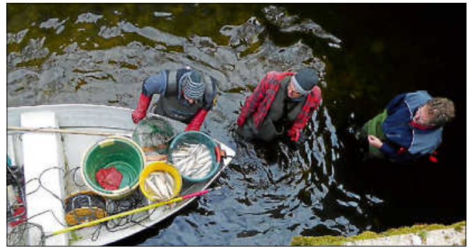
Gewässerökologe Frank Pätzold führte zusammen mit dem Sportfischerverein „Petri-Heil“ das Abfangen der Fische durch.

Im Jahre 2020 waren vom Regierungspräsidium gut 500 Stück ca. 3–4 cm große Quappen am Hahnbacheinfluss in die Murg