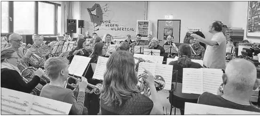
Probewochenende des Musikvereins Hilpertsau.