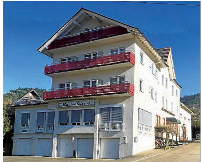
Das ehemalige ‚Hotel Lautenfelsen‘ wird zur Unterkunft für Geflüchtete.

Angesichts der sehr starken Flüchtlingsbewegung von bis zu 180 Flüchtlingen alleine in diesem Jahr reicht die bisherige Strategie, Geflüchtete in angemieteten Privatwohnungen unterzubringen, nicht aus. Daher setzt die Stadt auf die Schaffung weiteren Wohnraums: So sollen geeignete Bestandsimmobilien der Stadt, wie beispielsweise das alte Postgebäude in der Bleichstraße, umgenutzt werden, weitere geeignete Immobilien angekauft und mittelfristig auch Neubauten auf kommunalen Grundstücken errichtet werden. Mit dem Erwerb und Umbau des ehemaligen Gasthauses ‚Lautenfelsen‘ setzt der Gemeinderat den Gernsbacher Weg konsequent