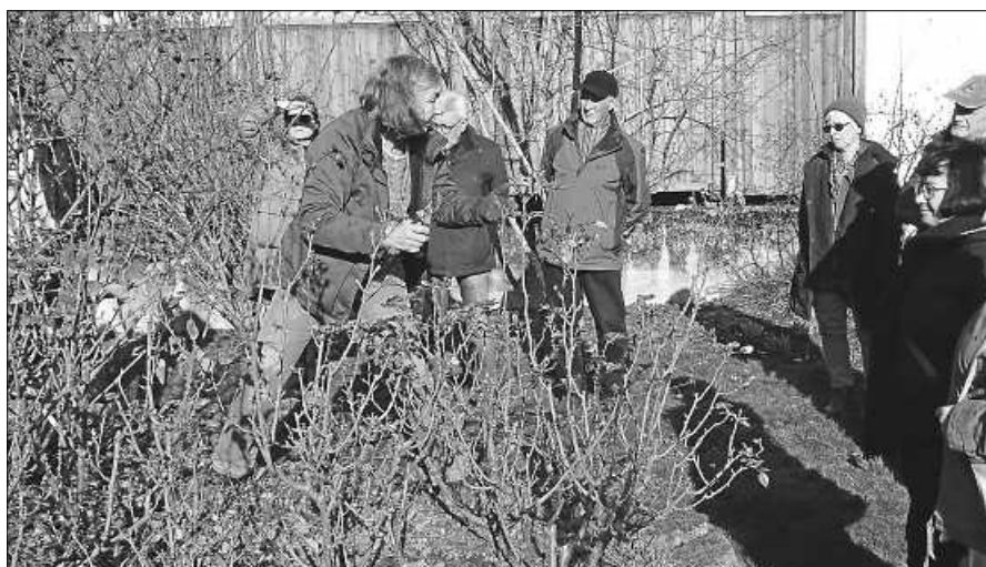
Rosenschnittkurs beim OGV Gernsbach.