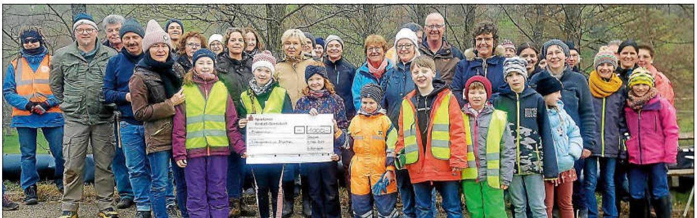
Spendenübergabe der Amphibiengruppe mit den vielen Teilnehmern der Aktion.

Zum Schluss waren alle durchgefroren, aber sehr zufrieden, etwas für den Naturschutz getan zu haben. ■