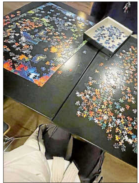
Puzzlespaß im Gleis 3.

Die neuesten Infos über Angebote und Events findet ihr auf Instagram @jugendhaus_gernsbach oder auf der Facebookseite vom Jugendhaus Gernsbach. ■