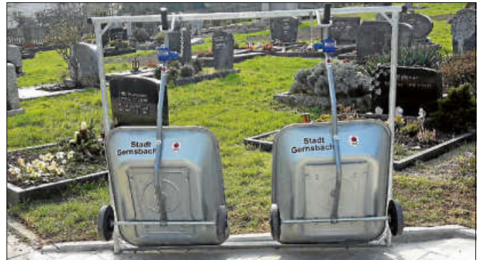
Die neuen Handwagen erleichtern den Transport von Grabschmuck.