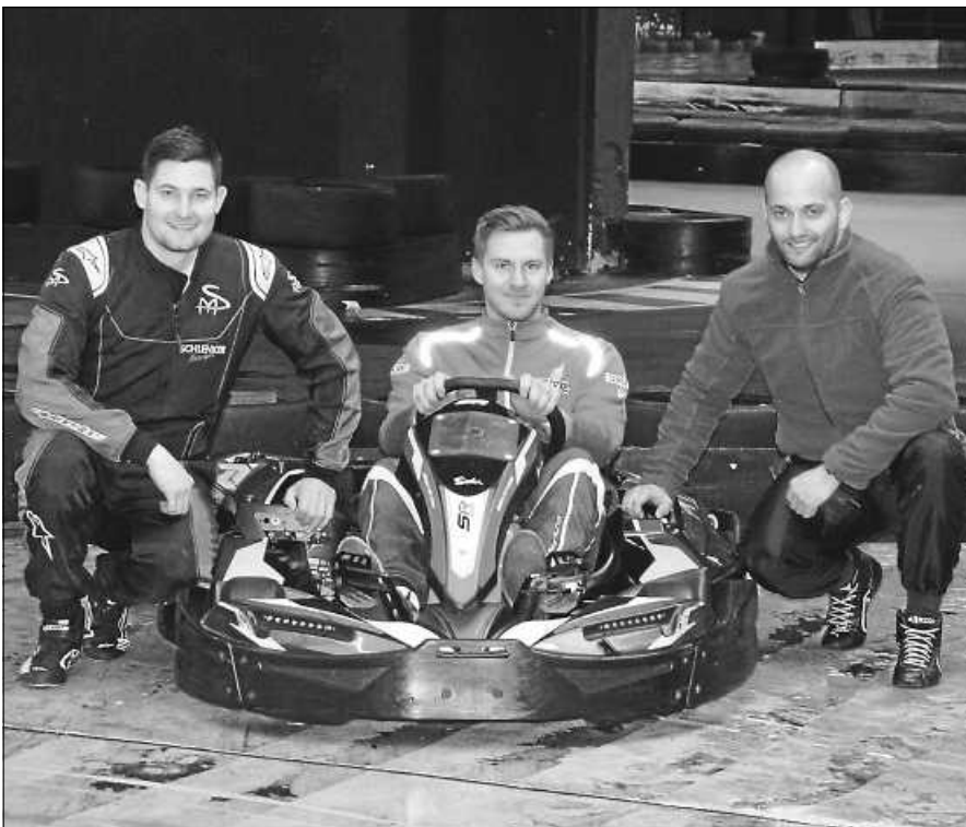
Gelungener Saisonauftakt für das Scharmüller/WnG A/D Racing Team in Limburg.