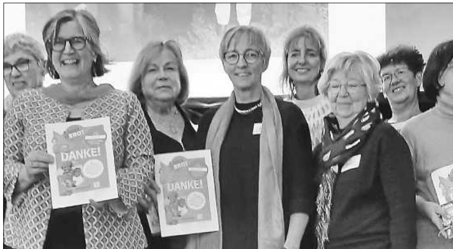
Die Delegation des Zweigvereins Gernsbach freut sich über die Ehrung.