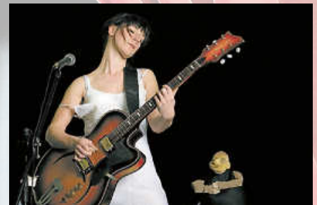
Paul und Paula.