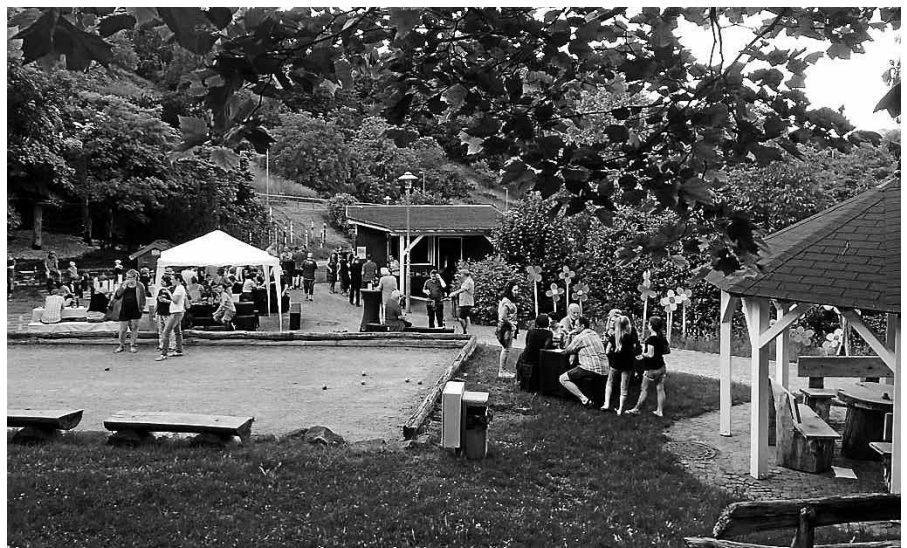
Grillgenuss zum Wochenschluss.

Grillgenuss zum Wochenschluss – der neue Slogan für das Feierabendgrillen