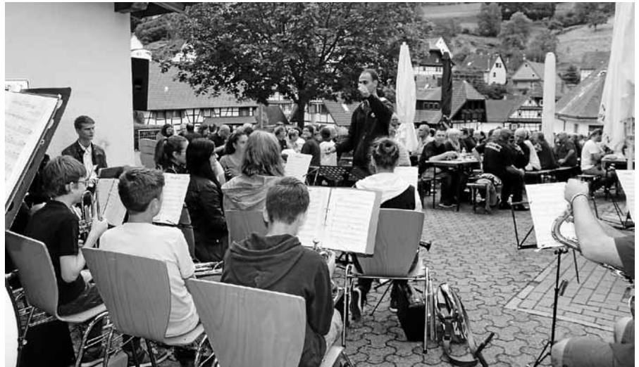
Der Musikverein Reichental lädt zum ersten Feierabendhock auf den Schulhof ein.