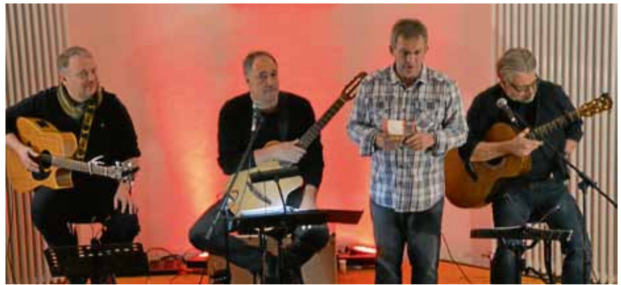
Trio interpretiert Lieder des Poeten Leonard Cohen.