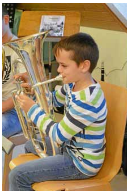
Verschiedene Instrumente stehen zum Ausprobieren zur Auswahl.

Die Lehrer der Musikschule werden anwesend sein und mit Rat und Tat zur Verfügung stehen. Diese Einladung richtet sich besonders an die Schüler der musikalischen Grundausbildung, die im kommenden Schuljahr mit dem Instrumentalunterricht beginnen wollen und sich noch nicht für ein bestimmtes Instrument entschieden haben. Kinder und Erwachsene sind herzlich eingeladen. ■