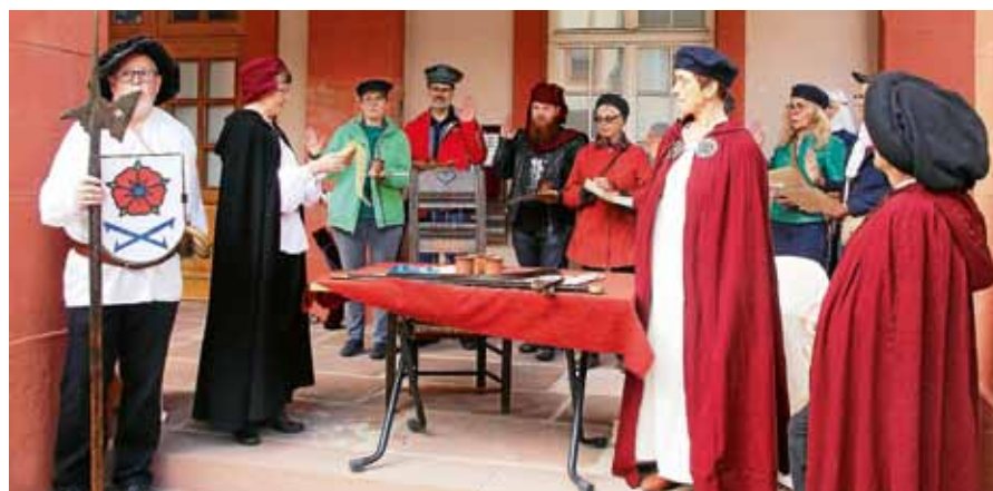
Szene aus der Erlebnisführung.

Ebersteiner und Wolkensteiner, Baumeister, Baderin, Torwächter, Henker, Bürgerinnen, Musikanten und fahrendes Volk geben sich ein Stelldichein. Für das Stadtjubiläum wurden eigens zwei neue historische Schlüsselszenen geschrieben. Das Publikum ist Zeuge, wie die Grafenbrüder Otto I. und Eberhard IV. von Eberstein im Jahr 1219 ihre Güter teilen. Diese Teilung legte den Grundstein für die Entwicklung des Dorfes Gernsbach zur Stadt. Spielfreudige Zuschauer haben die Gelegenheit, an diesem feierlichen Akt mitzuwirken. Die zweite neue Szene spielt im Jahr 1644 und entführt die Zuschauer in die düstere Welt des Drei-