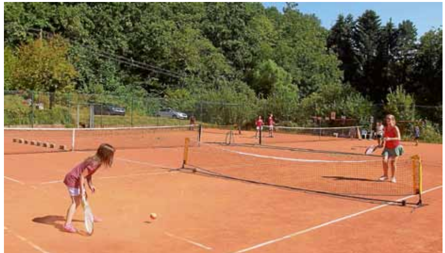
‘Spiel und Spaß rund um die gelbe Filzkugel‘ gibt’s beim TC Gernsbach 1922 e.V.

Anmeldungen sind ab Samstag, 20 Juli, 9 Uhr in der Tourist-Info möglich und erfolgen verbindlich durch die Abholung einer Anmeldekarte und die Abgabe der Einverständniserklärungen durch die Eltern. Um möglichst vielen Kindern eine Teilnahme am Ferienspaßprogramm zu ermöglichen, können am Erstaussgabetag pro Kind maximal vier anmel-