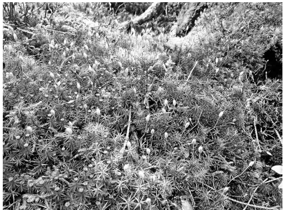
Unbekannte Schätze der Natur: Frauenhaarmoose.

Die Karten kosten 10 Euro und vorbestellen kann man entweder telefonisch unter 0172 5162826 oder per Mail unter info@alteturnhalle.de . ■