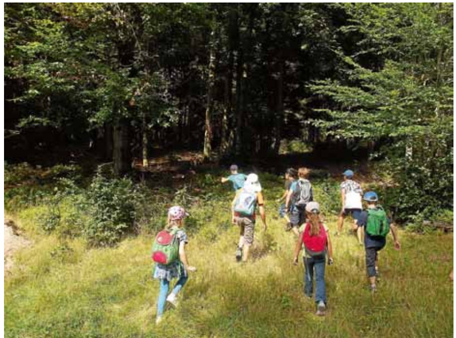
Spannendes zu entdecken gibt’s beim ‘Abenteuer Wald’, einer Veranstaltung der Stadt Gernsbach und dem Infozentrum Kaltenbronn.

depflichtige Veranstaltungen gebucht werden. Wir wünschen allen Kindern