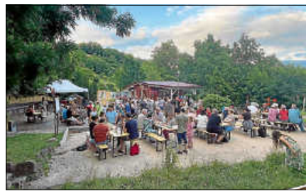
Feierabendgrillen auf dem Dorfplatz.

Atmosphäre verbringen möchten. Bei Regen fällt die Veranstaltung aus.