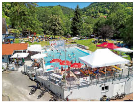
Zahlreiche Gäste beim 100-jährigen Schwimmbadjubiläum in Lautenbach.