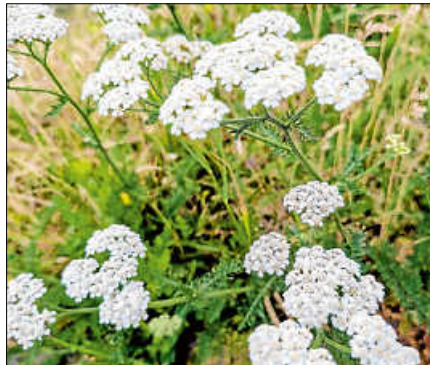
Die Schafgarbe kann zum Wohlbefinden beitragen.

Der OGV Gernsbach e.V. bietet am Samstag, 27. Juni, um 13 Uhr eine Sommer-Kräuterführung an. Mit der zertifizierten Wildkräuter- und Heilpflanzenpädagogin Frauke Grötz können die Sommer-Sonnen-Kräuter entdeckt und ihre Sonnenkraft gespürt werden. Die Mystik dieser besonderen Kräuter eröffnet spannende Einblicke in ihre Wirkung sowie ihre Verwendung in der Küche. Einige der Kräuter laden dabei auch zum Probieren ein. Darüber hinaus werden Methoden des Sammelns, Trocknens und der Verarbeitung zu Tee vermittelt – für ein Stück Sommer und Sonne, das das ganze Jahr über bewahrt werden kann.