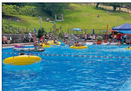
Wasserspaß beim Kinderfest

Der Förderverein Schwimmbad Obertsrot lädt Klein und auch Groß am Samstag, 11.7., wieder zum beliebten Kinderfest ein. Von 14 bis 18 Uhr wird den kleinen und auch den großen Schwimmbadbesucherinnen und Schwimmbadbesuchern bei freiem Eintritt einiges geboten: eine Hüpfburg, Wasserspiele, kreative Bastelangebote und viele weitere Überraschungen. Der Förderverein bietet Kuchen, Waffeln und Kaffee an und auch das Team von Gabi's Inn wird sich um das leibliche Wohl der Gäste kümmern. Die beliebte Wassergymnastik mit Katja findet jeden Dienstag von 18.30-19 Uhr statt. Sämtliche Informationen und Impressionen aus dem Schwimmbad gibt es auch auf dem WhatsApp-Kanal „Schwimmbad Obertsrot“ sowie auf Instagram. Bei unsicherer Wetterlage wird stets aktuell darüber informiert, ob die Wassergymnastik stattfindet.