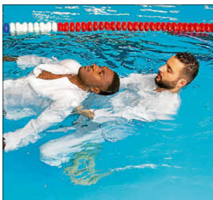
Ein Rettungsschwimmkurs ist im Igelbachbad möglich.

Auch in diesem Jahr wird wieder die Möglichkeit angeboten, ein Rettungsschwimmabzeichen zu erwerben. Der Kurs zum Erwerb bzw. zur Wiederholung des Rettungsschwimmabzeichens in Bronze oder Silber findet immer am Montagnachmittag von 15.15 - 19 Uhr an folgenden Terminen im Igelbachbad statt: 6.7., 13.7., 20.7. und 27.7. Die Anmeldung sowie alle notwendigen Informationen sind auf der Homepage unter https://gernsbach.dlrg.de/kurse-und-sicherheit/rettungsschwimmbildung/ zu finden. Für Rückfragen steht der Leiter Ausbildung unter der E-Mail-Adresse: ausbildung@gernsbach.dlrg.de gerne zur Verfügung.