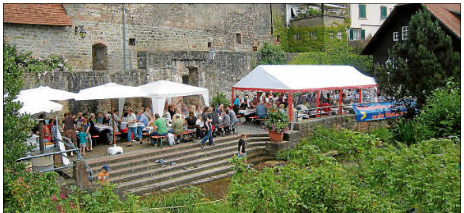
Entspannte Atmosphäre an der Stadtmauer.

Start und Ziel wird das Grundstück des OGV auf der Weinau sein. Die Kräuterführung dauert ca. 2 Stunden. Die Teilnehmerzahl ist auf 15 Personen begrenzt. Ein Unkostenbeitrag von 15 Euro wird zu Beginn der Veranstaltung erhoben. Der Verein übernimmt bei Mitgliedern 5 Euro. Um telefonische Voranmeldung unter 07224/9349572 abends zwischen 19 Uhr und 20 Uhr wird gebeten.