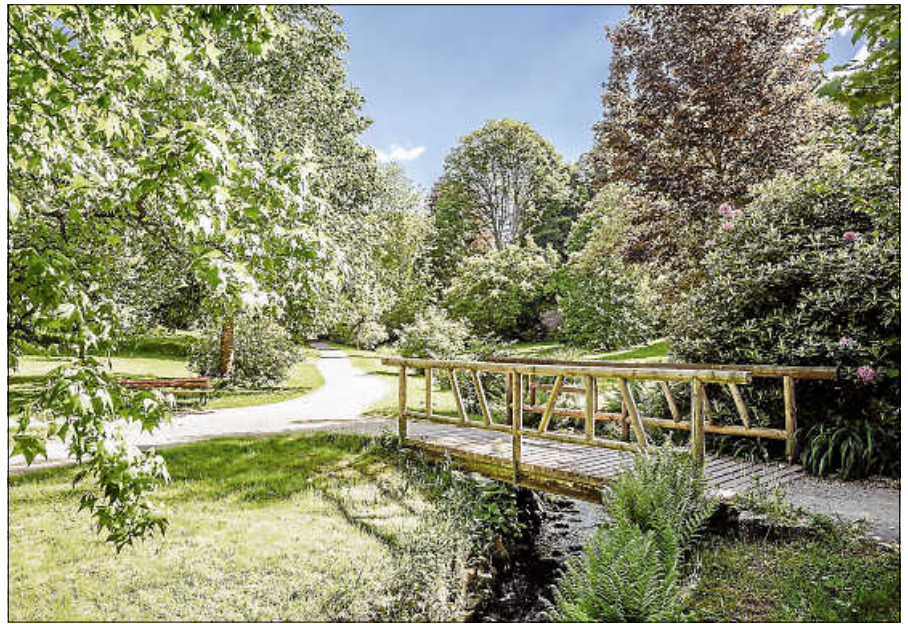
Die Tour führt auch durch den Kurpark.

Die Tour führt über den Felsenweg in den Kurpark und Clemm'schen Garten und weiter zum Igelbachbad. Nach einer kleinen Runde durch das Igelbachtal geht es durch den Kurpark zurück zum Ausgangspunkt. Unterwegs machen die Teilnehmenden Übungen zur Mobilisation, Stressabbau/Entspannung, Meditation, Kräftigung, Koordination und Dehnung. Nebenbei erfahren sie etwas zur Geschichte des Kurparks und des Clemm'schen Gartens. Bitte feste Schuhe, ausreichend Getränke und bequeme, dem Wetter angepasste Kleidung mitbringen. Die kostenlose Tour hat ca. 100 Hm und ist ca. 5 km lang und dauert etwa 2,5 Stunden. Der Treffpunkt ist um 10.10 Uhr an der Touristinfo Gernsbach. Um Anmeldung bei der Touristinfo