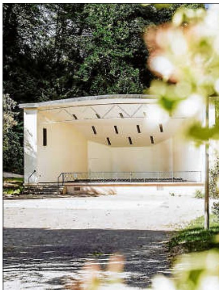
Konzertmuschel im Kurpark.

Am Sonntag, 05. Juli, begeistert ab 16 Uhr die Band Brennholz das Publikum. Der Eintritt ist frei.