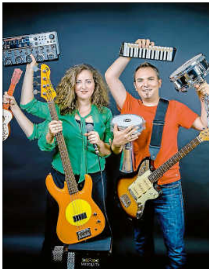
Am 1. August bringt „Loop Box“ stimmungsvolle Momente in die Altstadt.

Ob akustisch, gefühlvoll oder energiegeladen – „AltstadtLive“ steht für handgemachte Livemusik in unmittelbarer Nähe zum Publikum und für Sommerabende, die in Erinnerung bleiben. Ergänzt wird das Programm durch kulinarische Angebote und ein entspanntes Ambiente mitten in der historischen Altstadt. Der Auftakt am 11. Juli gehört dem Akustik-Duo „Down To Earth“ und wird erstmals vom Pop-up-Kunstatelier „Montmartre am Stadtbuckel“ begleitet. Besucherinnen und Besucher