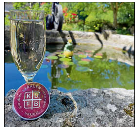
... im Katzschen Garten.

Die vielen wertvollen Begegnungen und Gespräche zwischen den Frauen der unterschiedlichen Zweigvereine wirken sicherlich noch lange nach und haben das Gemeinschaftsgefühl des KDFB deutlich spürbar gemacht. Die Gernsbacher Frauen bedanken sich von ganzem Herzen bei allen Teilnehmerinnen für ihr Kommen.