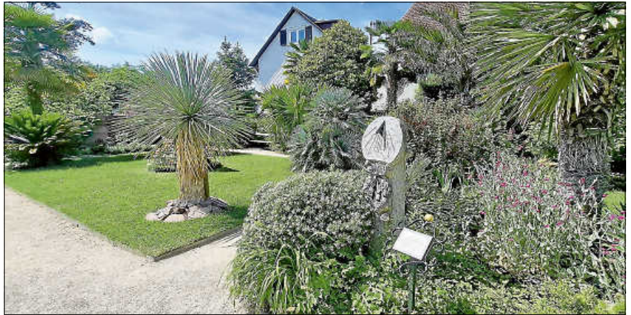
30 Jahre Arbeitskreis werden im Katz'schen Garten gefeiert.

Verschiedene Bildstationen informieren über die Entwicklung des Katz'schen Gartens von den Anfängen um 1800 bis in die heutige Zeit. Besonders dargestellt wird dabei der Zustand des Gartens bei der Übernahme durch den Arbeitskreis im Jahr 1996 sowie seine Entwicklung durch das langjährige Engagement