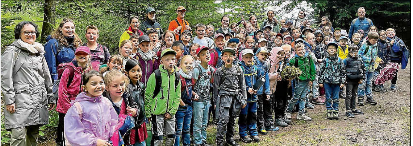
Walderlebnis mit der ganzen Schule.

Mit viel Freude, Neugier und Begeisterung konnten die Kinder ihr Wissen rund um den Wald erweitern und die wichtige Rolle von Pflanzen und Tieren für Natur und Umwelt besser verstehen. ■