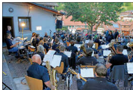
Sommer, Musik und Geselligkeit beim Feierabendhock.

Am Freitag, den 26. Juni, lädt der Musikverein Orgelfels Reichental herzlich zum Feierabendhock auf den Schulhof in Reichental (Langenackerstraße 4) ein. Unter dem Motto „Mit Blasmusik ins Wochenende“ erwartet die Besucherinnen und Besucher ab 18 Uhr ein geselliger Sommerabend mit stimmungsvoller Blasmusik, guter Unterhaltung und kulinarischen Köstlichkeiten. Für die musikalische Umrahmung sorgen der Musikverein Ottenau sowie die BadenBrassBand. Mit ihrem abwechslungsreichen Programm garantieren sie beste Unterhaltung und einen schwungvollen Start ins Wochenende. Auch für das leibliche Wohl ist bestens gesorgt: Neben Leckerem vom Grill werden vegetarische Speisen angeboten. Frisch gezapftes Bier, erfrischende Sommergetränke und eine Cocktailbar laden zum Genießen und Verweilen ein. Bei schlechter Witterung findet die Veranstaltung in der Festhalle Reichental statt. Der Musikverein Orgelfels Reichental freut sich auf zahlreiche Gäste und einen stimmungsvollen Sommerabend in geselliger Atmosphäre. Weitere Informationen zum Verein und zu kommenden Veranstaltungen unter www.musikverein-reichental.de .