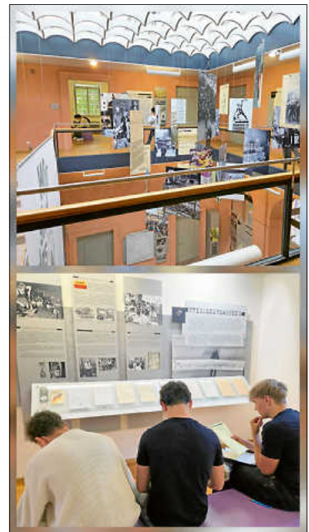
Jugendliche vor einer Infotafel im Schloss Rastatt.