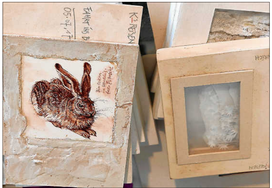
Außergewöhnlichen Papyrografien sind in den Zehntscheuern zu sehen.