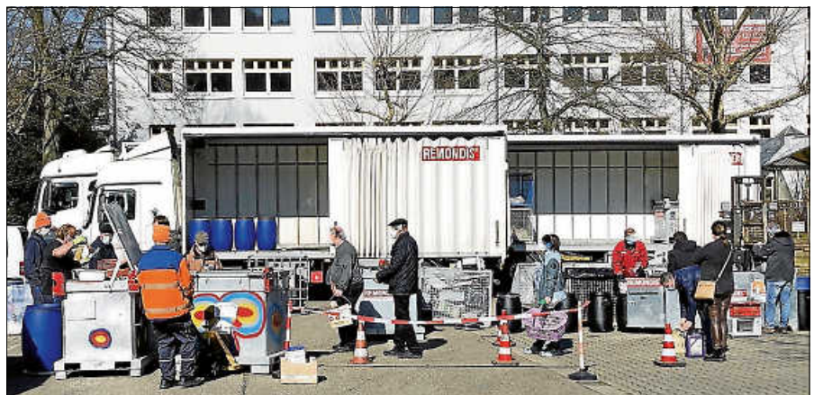
Archivbild: Schadstoffmobil am Färbertorplatz.

Angenommen werden ausschließlich Problemstoffe aus privaten Haushalten