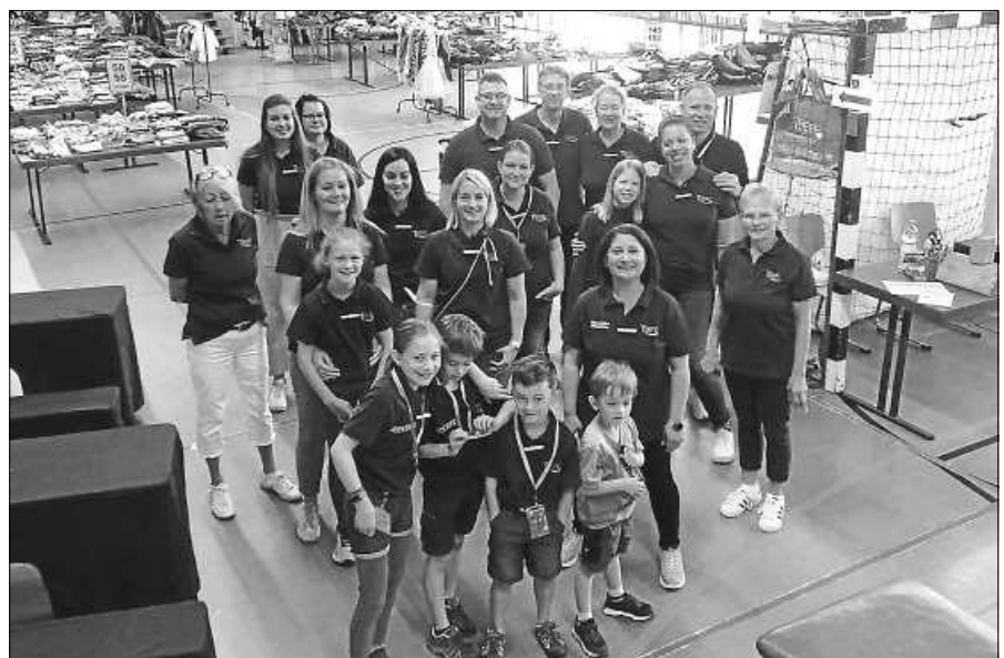
Das KidsBazarteam des Treffpunkts Staufenberg.

Am Samstag, 02. März, findet wieder der KidsBazar in der Staufenberghalle statt. In der Zeit von 10.30 bis 13 Uhr gibt es die Möglichkeit, in dem umfangreichen Angebot an Bekleidung und Spielzeug für Kinder zu stöbern. Schwangere und Mitglieder vom Treffpunkt Staufenberg haben bereits ab 10 Uhr Einlass. Im Angebot finden sich Schnäppchen für die kommende Frühjahrs- und Sommersaison. Im Treffpunkt-Café kann man sich nach der Shopping-Tour bei einer Tasse Kaffee und hausgemachten Kuchen entspannen und die Einkäufe begutachten. Weitere Informationen finden sich auch unter: www.treffpunkt-staufenberg.de . Fragen per E-Mail an: kids-bazar.staufenberg@web.de