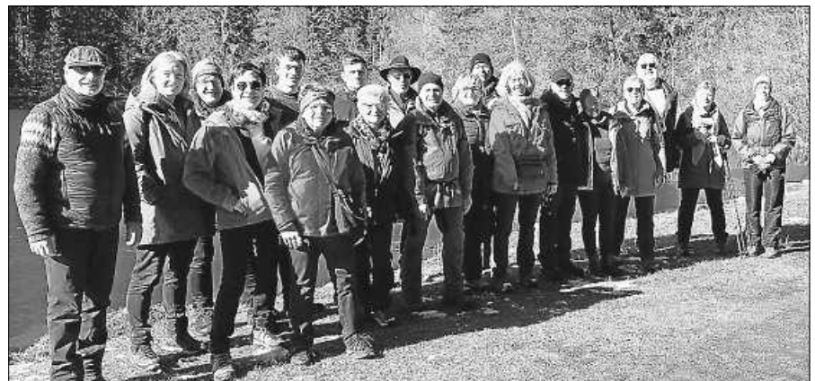
Vor der Heimfahrt erwanderten die Naturfreunde in Hinterzarten den Mathisleweiher.

Zu Ostern Zeit nehmen für sich, für die Gemeinschaft und für Gott. Im Gebet werden Emotionen, Gedanken und Probleme Gott anvertraut. „Schöpfe neue Kraft durch die Osterbotschaft“ lautet das Thema der Besinnungstage am Freitag, den 22. März, und Samstag, den 23. März 2024, im Haus La Verna in Gengenbach. „Loslassen – Annehmen“ ist eine Art von Gebet und zugleich eine Kraftquelle. Ostern ist nicht nur die Freude der Auferstehung, es bedeutet auch, mit Jesus den Weg nach Golgota zu gehen. Gemeinsam überlegen,