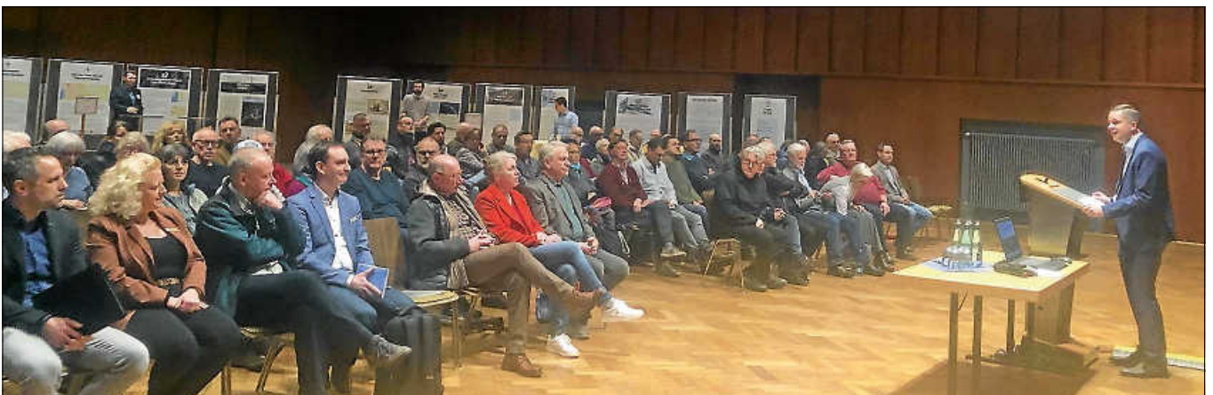
Bürgerinnen und Bürger erhalten ausführliche Informationen zu den Vorhaben an Thementischen während der Bürgerinfoveranstaltung.