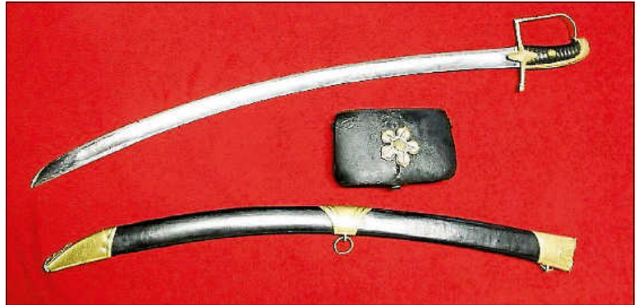
2024: Jubiläumsjahr 175 Jahre Badische Revolution.

Die Besucher sehen die Stadt mit den Augen der aufständischen Demokraten. Wer waren sie? Wo und wie agierten sie? Wer waren ihre Gegenspieler? Wie gerieten sie in den Strudel der Ereignisse? Welche Rolle spielte die Bürgerwehr und ihr Kommandant, dessen Säbel heute noch erhalten ist? Wie verlief das Gefecht von Gernsbach, das sich heute noch am besten vom evangelischen Friedhof aus verfolgen lässt? Welche dramatischen Folgen hatte die Niederla-