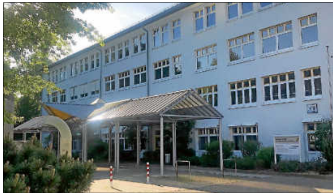
Das ehemalige HLA-Gebäude.

In seiner jetzigen Februar-Sitzung stimmte der Gemeinderat einstimmig dafür, die HLA vom Landkreis Rastatt zum Preis von 3,65 Mio. Euro zzgl. Nebenkosten zu kaufen. Damit nutzt Gernsbach die Chance, die Grundschule in der Kernstadt aus ihrem räumlich kleinen und sanierungsbedürftigen Altstandort herauszuholen. Dies gilt umso mehr mit Blick auf den Rechtsanspruch auf Ganztagsbetreuung im Grundschulbereich, welcher mit dem Schuljahr 2026/27 in Kraft tritt. Mit dem Verkauf der HLA an die Stadt wird auch der Rechtsstreit um die Stellplätze für die Schülerinnen und Schüler der jetzigen Kreisschule einvernehmlich beendet. Durch die Nutzung als Grundschule wird sich die Parksituation auf dem Färbtorplatz