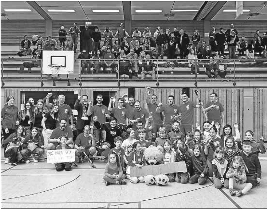
Ausverkaufte Ebersteinhalle bei HCG- Erfolg.