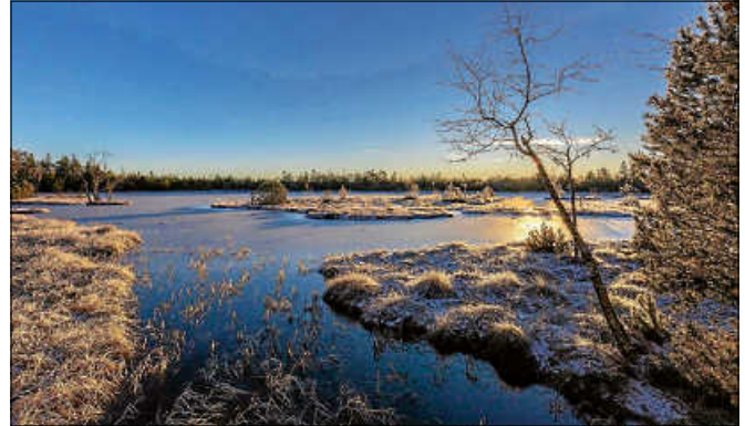
Der Wildsee in der Morgensonne.

Interessierte ab 10 Jahren können Tickets für 7 Euro pro Person unter www.infozentrum-kaltenbronn.de/kalender buchen. ■