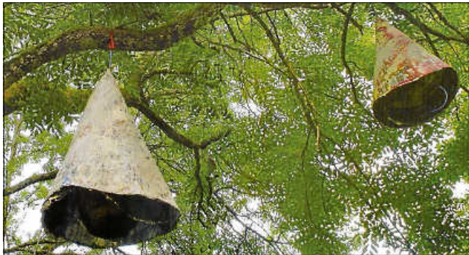
Josef Bücheler: Glockenbaum 2007.

Die Tour dauert rund zwei Stunden und findet bei jedem Wetter statt. Treffpunkt ist am Beginn des Kunstweges an der Infotafel auf dem Parkplatz im Reichenbachtal hinter dem Gewerbegebiet. Info unter www.kunstweg-am-reichenbach.de .