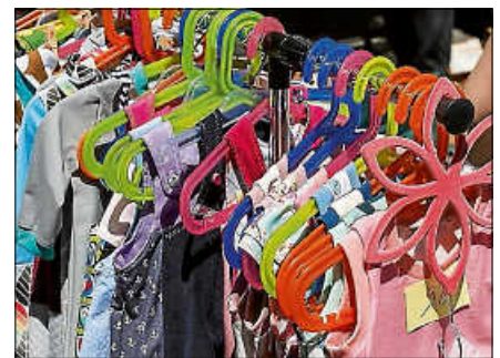
Verkauf von Kinderartikeln jeglicher Art in der Stadthalle.

Ab sofort können Tische unter der Telefonnummer 07224/6996400 oder per Mail an kita.fliegenpilz@gersnbach.info in der Kita Fliegenpilz bis zum 20.2.26 zu den üblichen Kitazeiten reserviert werden. Der Unkostenbeitrag pro Tisch beträgt 10 €. Der erwirtschaftete Geldbetrag wird im vollen Umfang für die Kinder eingesetzt. ■