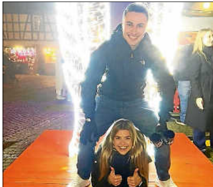
Kreativität lohnt sich: Auch die nominierten Beiträge zum kreativsten Selfie wurden mit einem Einkaufsgutschein des Gernsbacher Schaufensters ausgezeichnet.