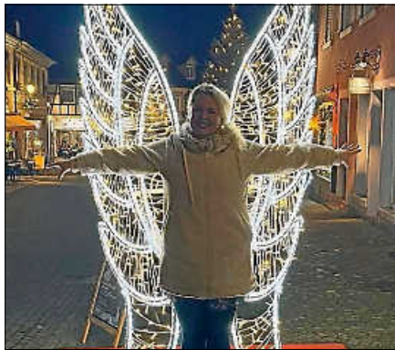
2. Preis (50 € Einkaufsgutschein).