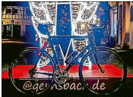
Nominiert für das kreativste Selfie: Als Anerkennung erhielt der Teilnehmer einen Einkaufsgutschein des Gernsbacher Schaufensters.