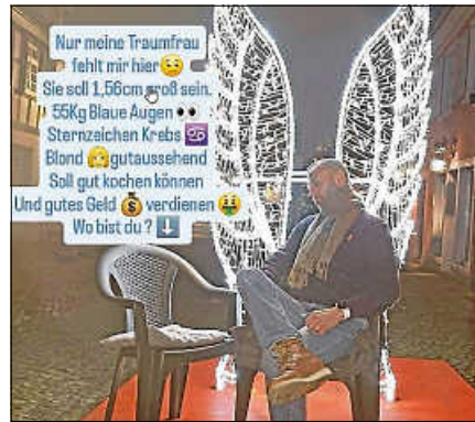
3. Preis (50 € Einkaufsgutschein).