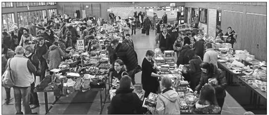
Wie immer ein großer Andrang beim KidsBazar.

Am Programm sind die Guggis, die Brunnberghexen, die Tänzerinnen des Turnvereins und weitere Akteure beteiligt. Auch die MVO-Kids haben wieder ein tolles Programm vorbereitet.