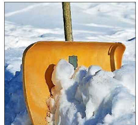
Bei frostigen Temperaturen und Schneefall besteht Räum- und Streupflicht für Grundstückseigentümer und Mieter.