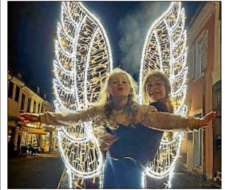
1. Preis (200 € Einkaufsgutschein des Gernsbacher Schaufensters).

nachtszeit in Gernsbach auf ganz besondere Weise bereichert und gezeigt, wie viel Kreativität und Verbundenheit in unserer Stadt steckt“, freut sich Wirtschaftsförderin Nicoletta Arand. ■