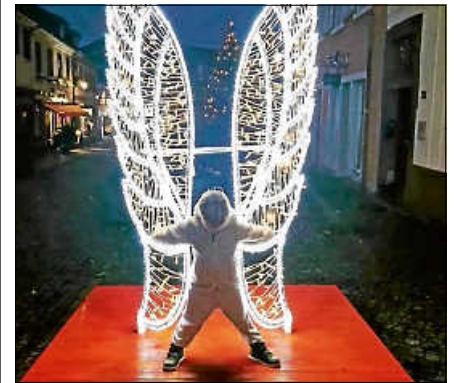
4. Preis (50 € Einkaufsgutschein).