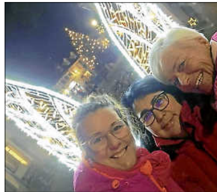
5. Preis (50 € Einkaufsgutschein)