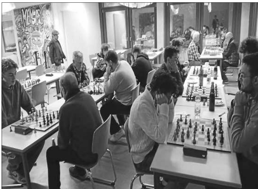
Konzentrierte Stille beim Dreikönigsturnier.