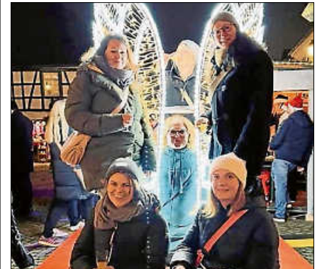
Nominiert & belohnt: Einkaufsgutschein für einen kreativen Beitrag beim Selfie-Point „Gernsbacher Engel“.