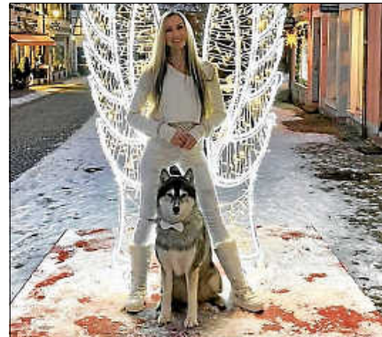
Das durch Abstimmung gewählte kreativste Selfie erhielt den Sonderpreis: Mini-Shooting bei Stephan Schmidt Fotografie.