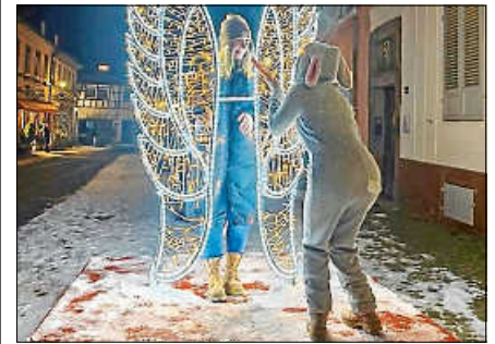
Nominiert für das kreativste Selfie: Als Anerkennung erhielt die Teilnehmerin einen Einkaufsgutschein des Gernsbacher Schaufensters.