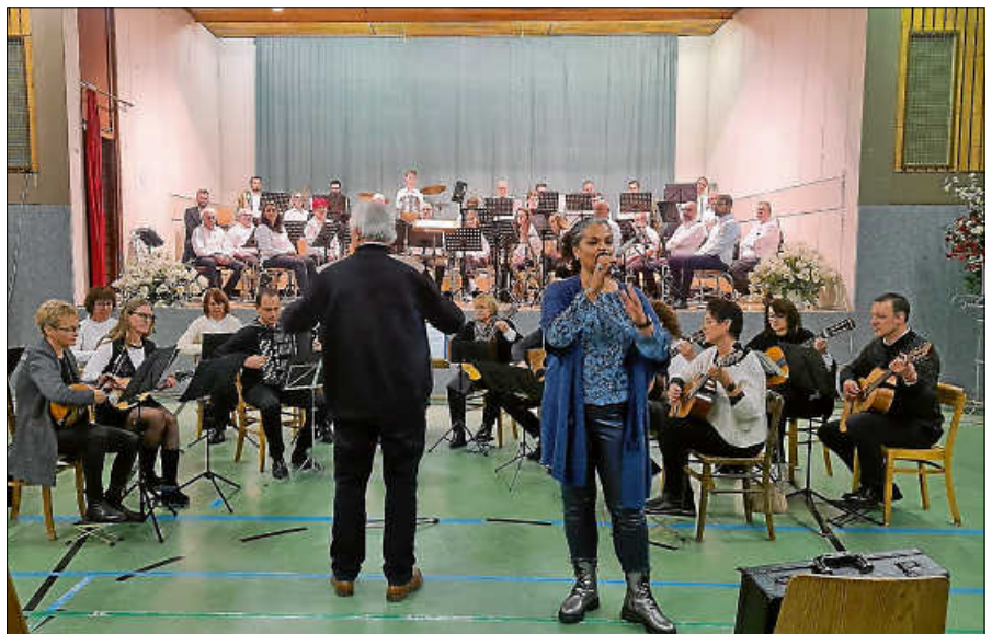
Die örtlichen Musikvereine gestalteten das Programm.

In seinem Grußwort hob er das ehrenamtliche Engagement der örtlichen Vereine und Institutionen hervor. Was Staufenberg angeht, konnte er im Ausblick auf 2026 berichten, dass im Hinblick auf das geplante Neubaugebiet Hubengarten Ost mit aktuell 22 geplanten Bauplätzen die Beauftragung eines Erschließungsträgers in einer der nächsten Gemeinderatssitzungen ansteht und