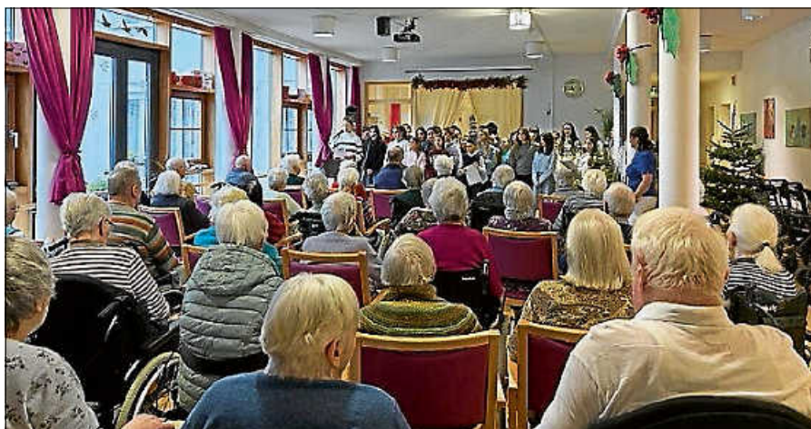
Weihnachtliche Stimmung im Seniorenzentrum.