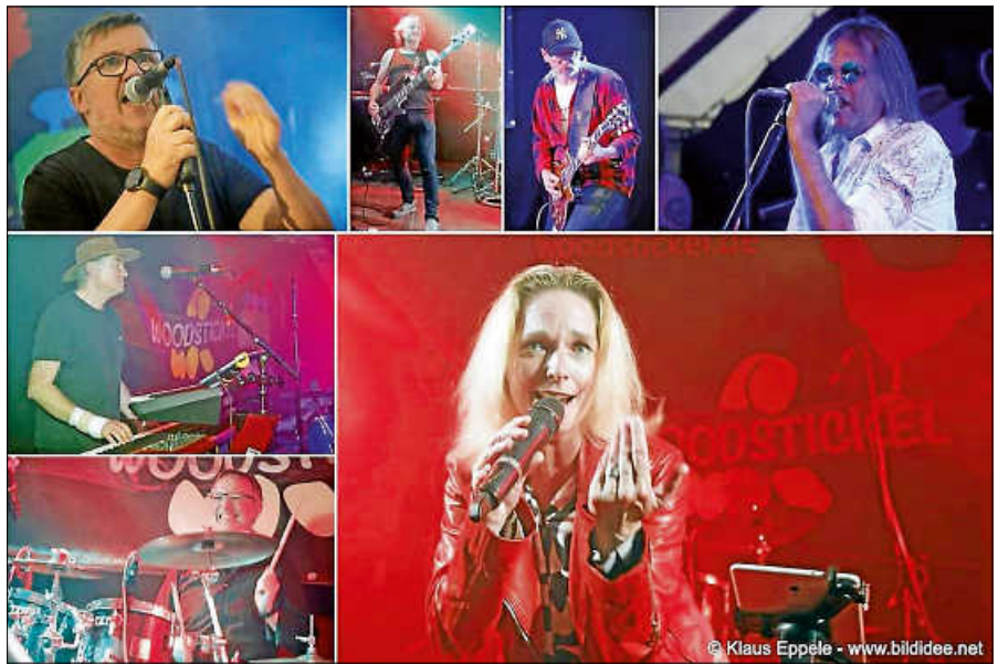
Mit der Band Hardcover startet die Kultur im Kirchl ins neue Jahr.

Mit viel Spielfreude, Druck und Leidenschaft lassen die Musiker ihre persönlichen Lieblingssongs wiederaufleben. Handgemacht, energiegeladen und mit großer Begeisterung für ihre musikalischen Vorbilder laden sie das Kirchl-Publikum ein mitzuwippen, mitzusingen und einen echten Rock-Abend zu erleben. Hohe spielerische Qualität, eine möglichst authentische Umsetzung der ursprünglichen Arrangements und ein abwechslungsreicher, stimmungsvoller Konzertabend stehen dabei im