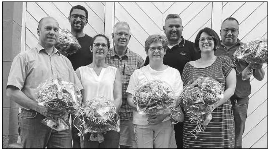
Das neue Vorstandsteam nach der Wahl im Juni