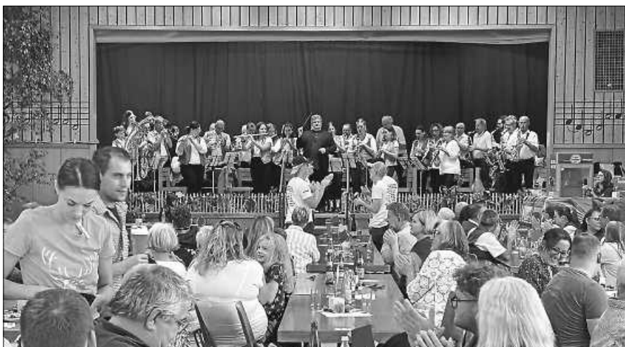
Auch am Nachmittag war das Knödelfest 'rappelvoll'. Auf der Bühne ist der Musikverein Jockgrim in Aktion.