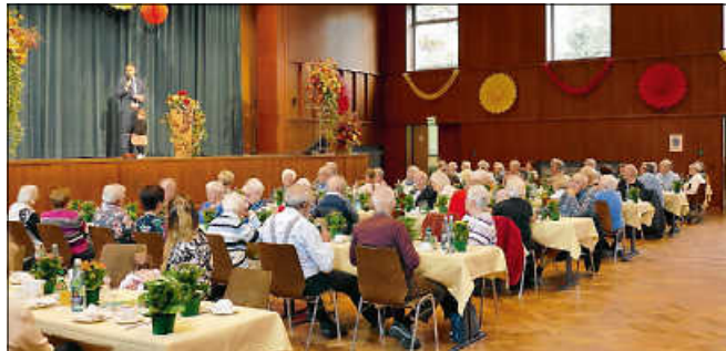
Einladung zum fröhlichen Nachmittag für Seniorinnen und Senioren.

Eine Anmeldung ist nicht erforderlich. Wir freuen uns auf Sie! ■