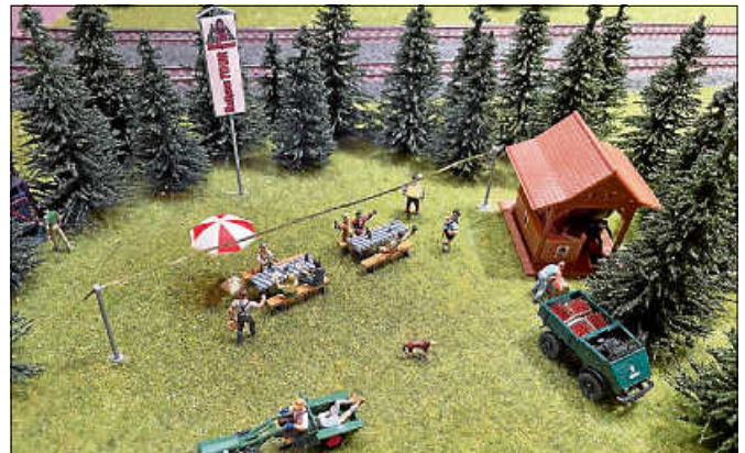
Detailgetreue Darstellungen im Kleinformat gibt es bei der Modelleisenbahn-Börse Obertsrot.