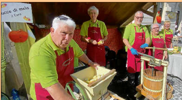
Gernsbacher Süßmostgruppe auf dem Trüffel fest