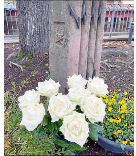
Gedenksteine am Nepomukplatz.

Deportation der Juden ein Stamm in der Gemeinschaft Gernsbachs fehlt. ■