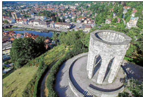
Das Denkmal am Rumpelstein.

Eine Anmeldung über die Touristinfo Gernsbach unter 07224 644446 oder touristinfo@gernsbach.de ist erforderlich. ■