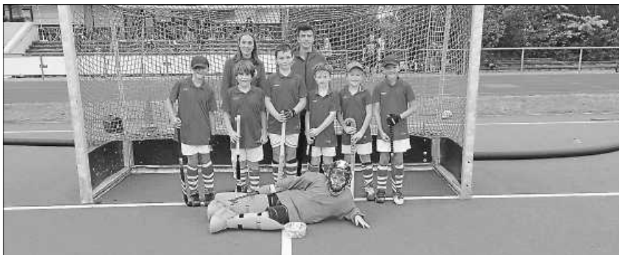
MU10 des Hockey-Club Gernsbach

An ihrem letzten Spieltag machten sich die MU10-Jungs auf den Weg nach Offenburg. Ohne Auswechselspieler haben sie das erste Spiel sehr gut gespielt und somit auch 2:0 gewonnen. Im zweiten Spiel ließ die Kraft nach und das Spiel ging 0:4 aus. Beim letzten Spiel gaben sie noch mal alles, aber es hat leider nicht gereicht und wurde zu einem 0:2. Alles in allem haben sie trotzdem sehr gut gekämpft. Sie beenden die Feldsaison mit sieben Siegen und fünf Niederlagen.