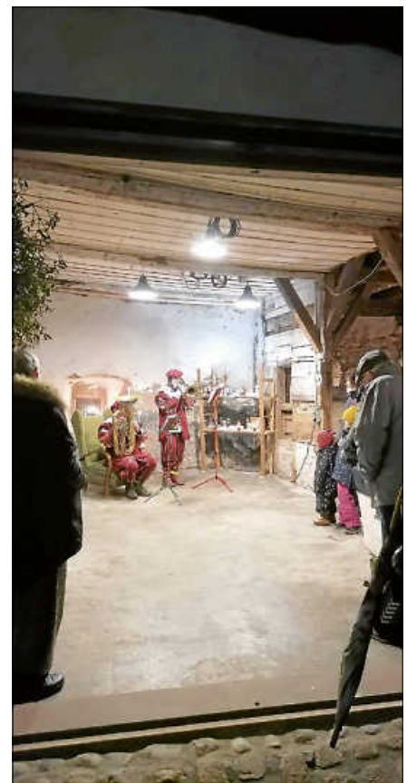
Musikalische Umrahmung der Adventskalenderaktion.