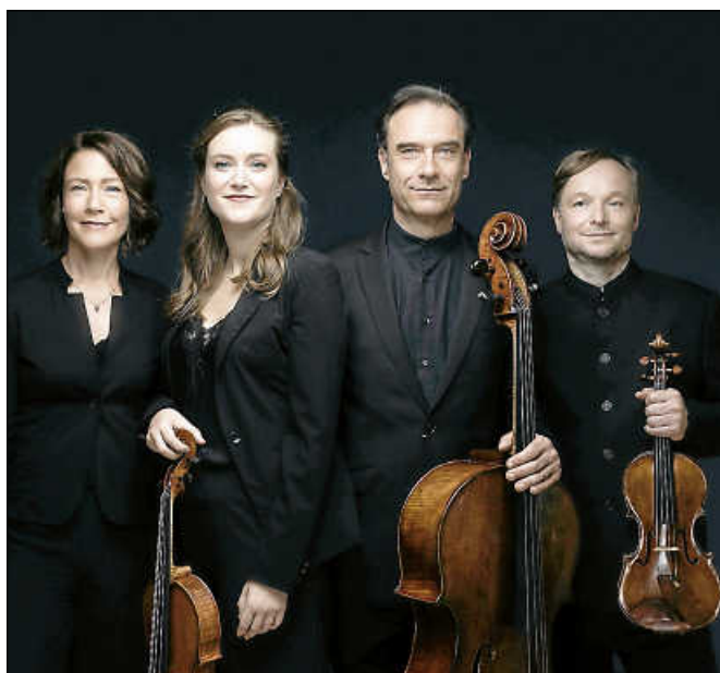
Das Diogenes Quartett

Eintrittskarten sind im Vorverkauf zu 18 € (Mitglieder 14 €) im Kulturamt/Touristinfo der Stadt (Tel. 07224 644-446) erhältlich, außerdem bei eventim.de und den Eventim-Vorverkaufsstellen. An der Abendkasse beträgt der Eintrittspreis 20 € (Mitglieder 16 €). Schülerinnen, Schüler und Studierende haben freien Eintritt. ■