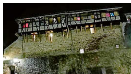
Zehntscheuern mit Adventskalendertürchen.

Wer Interesse hat, sich an diesem Projekt zu beteiligen oder Fragen dazu hat, kann sich unter der E-Mail-Adresse des Vereins info@zehnt.info oder der Telefonnummer 0179 6974686 melden. Der Anmeldeschluss für die Mitgestaltung und die Aktionen ist der 10. November 2023. ■