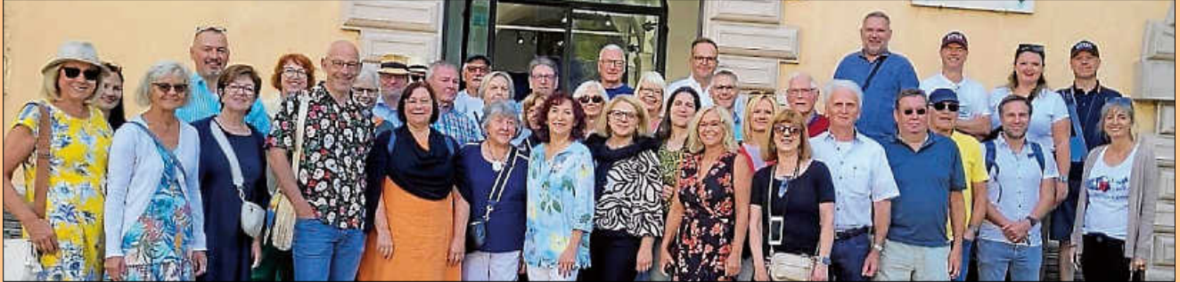
Die Gernsbacher Delegation