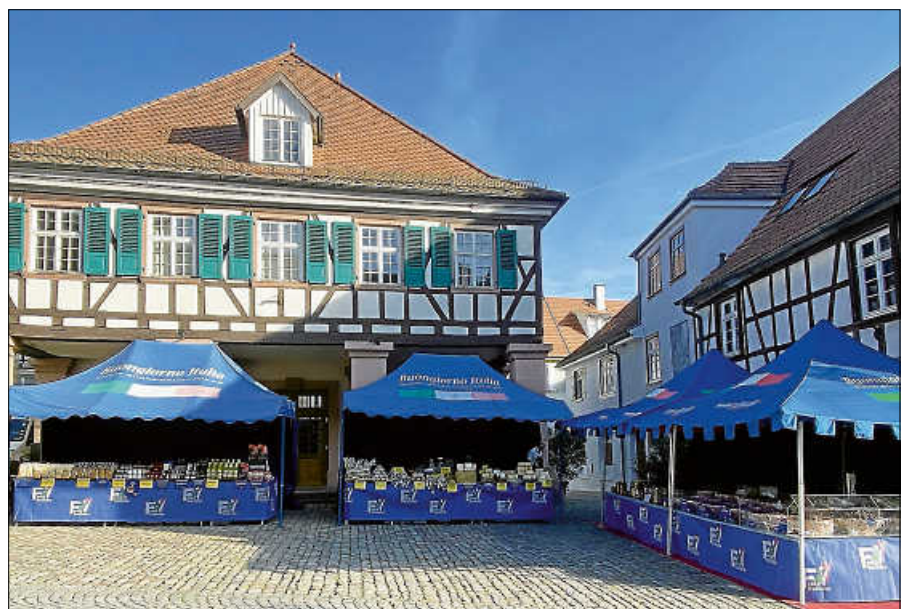
Italienisches Flair in der historischen Altstadt.

Händler und Erzeuger aus dem sonnigen Italien bringen die Essenz des Landes in die Region und laden alle Feinschmeckerinnen und Feinschmecker dazu ein, an dieser kulinarischen Reise teilzunehmen. Die Besucherinnen und Besucher dürfen sich auf eine große Auswahl an authentischen italienischen Produkten freuen. Ob köstlicher Käse, verschiedene Oliven, eine breite Palette von Wurstwaren und Soßen, handgefertigte Pasta sowie Kaffee: Die Händlerinnen und Händler haben mit Liebe zum Detail die besten Produkte aus ganz Italien für ihre sechs großartigen Stände ausgewählt. ■