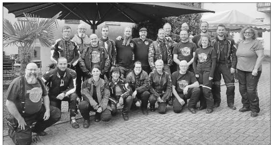
Zwischenstopp in Münchweier.