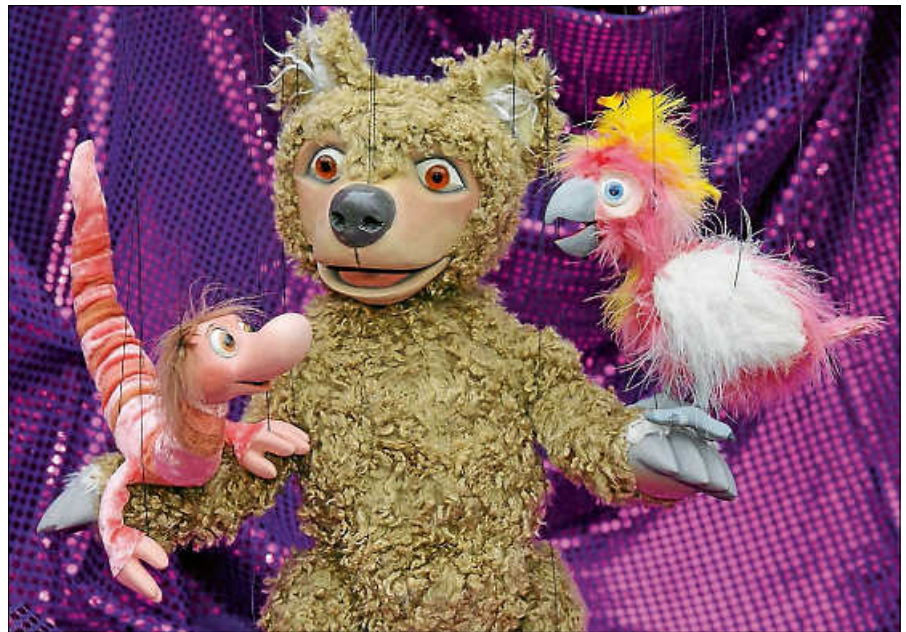
„Hokusdipokus – Zauberei an Fäden“.

Weitere Veranstaltungen der Reihe sind: Sonntag, 26. November 2023, 15 Uhr: Wie weihnachtet man (marotte Figurentheater, Karlsruhe)