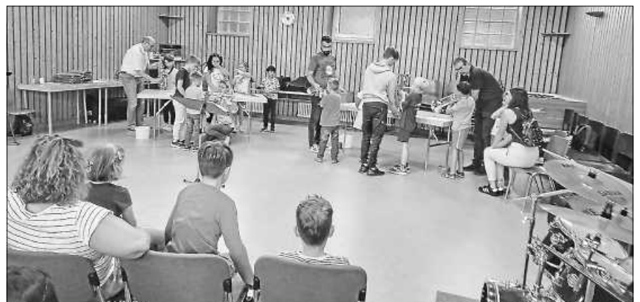
Kinder beim Ausprobieren von Blasinstrumenten im Probelokal.

Die Wünsche der Kinder werden bei der Instrumentenzuteilung, in Abstimmung mit den Betreuer/innen, berücksichtigt. Fazit: Eine gelungene Veranstaltung zur Jugendwerbung und Freude auf allen Seiten über den neuen Musikernachwuchs.