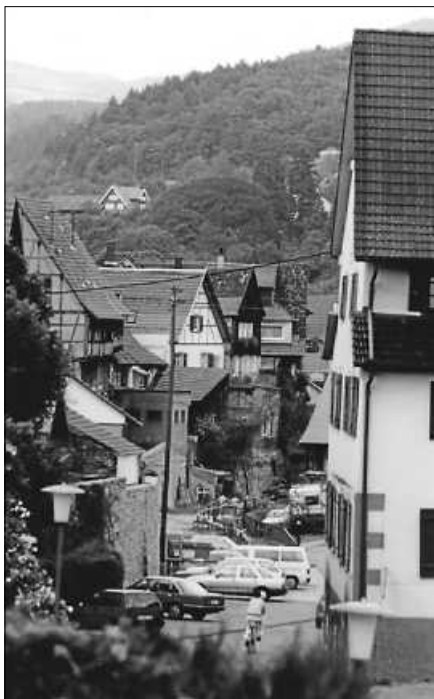
In Gernsbach war 1989 der Umbau der Waldbachstraße im vollem Gange. Hier eine Aufnahme vom Oktober 1989 mit vielen parkenden Autos, einer Telefonzelle und dem noch teils geschlossenen Verlauf des Waldbaches.

Senden Sie uns bis spätestens Montag, 30. Oktober, kurze Texte, Dokumente, Briefe oder eigene Fotos. Schildern Sie Ihre Erinnerungen, entweder per E-Mail an kontakt@stadtgeschichte-gernsbach.de oder – da vor über 20 Jahren die meisten Erinnerungen wohl nicht digital vorliegen – bringen Sie diese direkt vorbei im Rathaus Gernsbach, Igelbachstraße 12. Im Foyer des Eingangs wird ein Korb bereitstehen, in welchem Sie Ihre Objekte ablegen können.