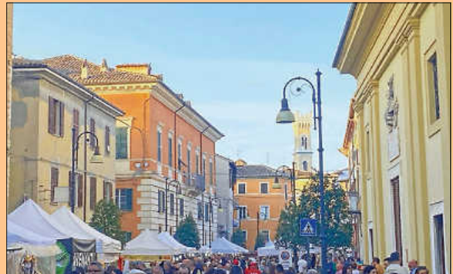
Trüffel fest in Pergola