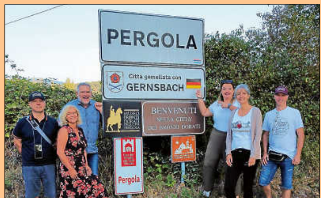
Ortseingangsschild in Pergola