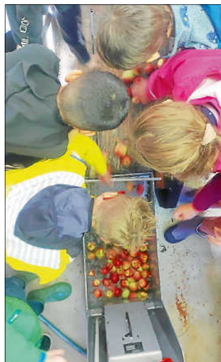
Die Kinder der 3a in der Kelter Reichental.

felsaft mit nach Hause, so dass auch die Daheimgebliebenen etwas von diesem Tag hatten. ■