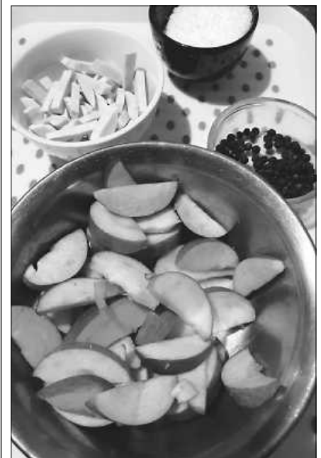
Vorbereitung fürs Einmachen von Sauerkraut.