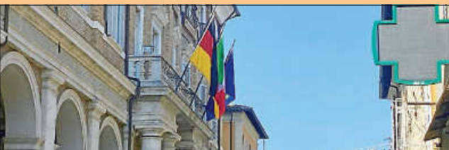
Das Rathaus von Pergola