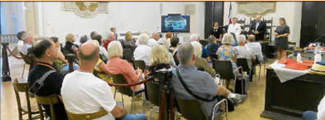
Empfang im Rathaus von Pergola