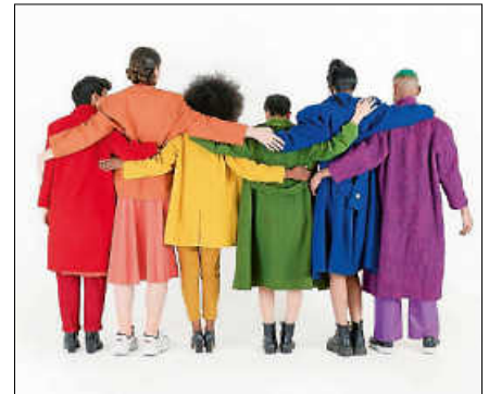
„We are part of culture“ ist eine Kunstaussstellung des gemeinnützigen Projekts 100 % Mensch.

Weitere Informationen über Angebote und Events findet man bei Instagram unter @jugendhaus_gernsbach und auf der Facebook-Seite. ■