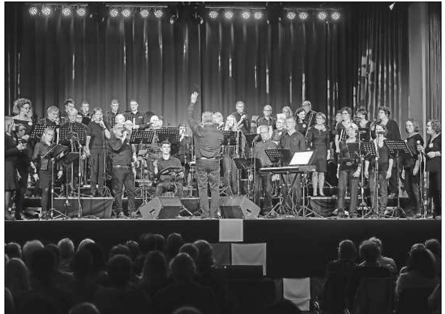
Salto Vocale in Aktion - ein Erlebnis.

„Street Party“ werden am Samstag, den 4. November um 20 Uhr in der Jahnhalle Gaggenau die schwungvollsten und schönsten Songs präsentiert. Es erwarten Sie heiße Rhythmen, vielseitige Melodien und Stimmen, die unter die Haut gehen – Chormusik in ihrer ganzen Vielfalt. Erleben Sie einen musikalischen Abend der Extraklasse mit einem gemischten Chor und einer Band, bestehend aus professionellen Musikern