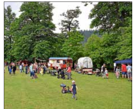
Kinderfest auf der Murginsel.

trum Kaltenbronn und das Jugendhaus Gernsbach haben spannende Aktivangebote dabei. Bastelangebote gibt es bei den Ständen von der Kath. Kinderkirche und von Ariane Wieland. Die öffentliche Bücherei Gernsbach beteiligt sich mit einem Bücherflohmarkt sowie mit Brettspielen und Mal-Angeboten und die Murgflößer bieten eine Floßbauschule an. Das Team vom Hort der Grundschule Gernsbach bietet Kinderschminken und Dosenwerden an. Am Stand der Vereinigung der Tagesmütter gibt es Kamishibai Erzählgeschichten. Mit dabei ist außerdem das Spielmobil aus Rastatt mit spannenden Spielmöglichkeiten.