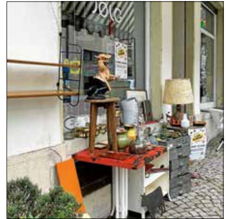
Bunte Stände bieten allerlei Raritäten und Schnäppchen.

Der Hofflohmart ist eine tolle Gelegenheit, besondere Fundstücke, Vintage-Stücke, Haushaltswaren oder handgefertigte Unikate anzubieten – alles ist