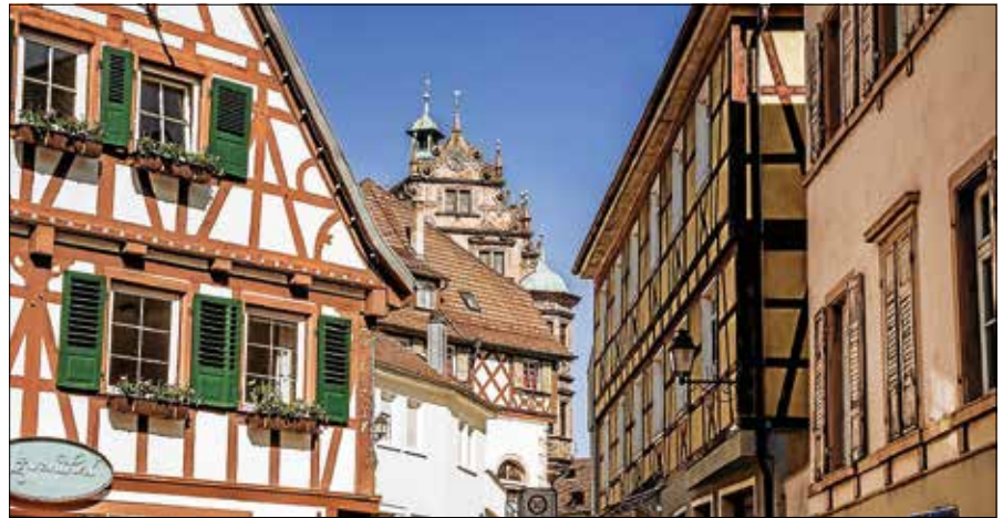
Die sehenswerte Gernsbacher Altstadt.

Treffpunkt für die kostenfreie, ca. zweistündige Tour ist um 10.30 Uhr am Alten Rathaus, wo es im Weinkeller des Weingutes Iselin zunächst ein Gläschen Gernsbacher Wein und viele Informationen über Gernsbach und das Murgtal gibt. Danach führt eine Stadtführerin oder ein Stadtführer durch die historische Altstadt Gernsbachs. Bei der Stadtführung erfahren die Teilnehmenden viel Wissenswertes rund um die