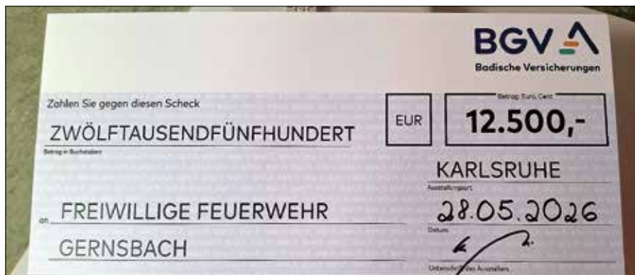
Der symbolische Spendenscheck.