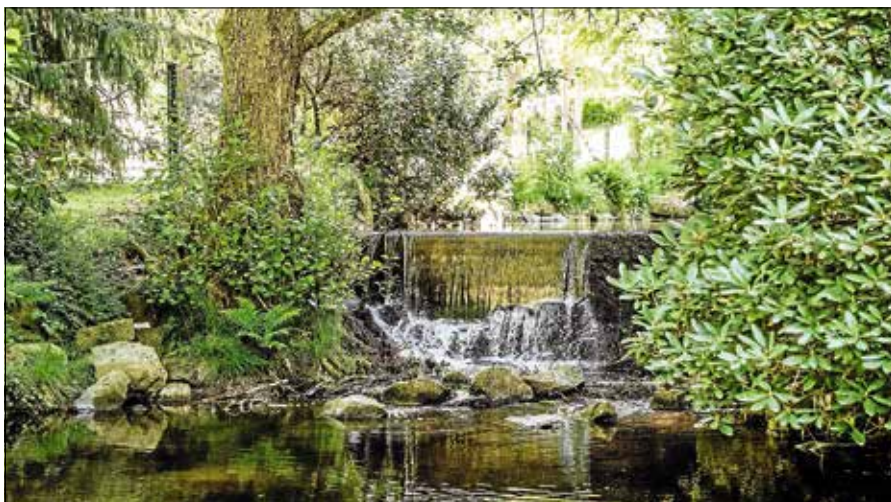
Der Gernsbacher Kurpark.

Weiterer Termin: Samstag, 17. Oktober 2026, um 15 Uhr. ■