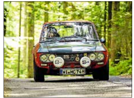
Oldtimer kommen durch Gernsbach.

traditionsreiche Rallye führt auf ihrer zweiten Tagesetappe durch einige der schönsten Landschaften Süddeutschlands und macht dabei auch Station im Murgtal. Für die Stadt ist die Paul Pietsch Classic ein besonderes Erlebnis und eine schöne Gelegenheit, Gernsbach als Teil dieser besonderen Oldtimer-Veranstaltung zu präsentieren. Die Fahrzeuge sind dabei nicht auf Geschwindigkeit ausgerichtet: In der sogenannten Sanduhrklasse zählen Präzision, Gleichmäßigkeit und echtes Fahrgefühl.