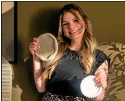
Yvonne Bender.

H andgemachtes, individuelle Geschenkeideen und besondere Lifestyle-Produkte gibt es an zwei Tagen im ‚Pop-up KORner Store‘ in der Gernsbacher Altstadt zu entdecken.