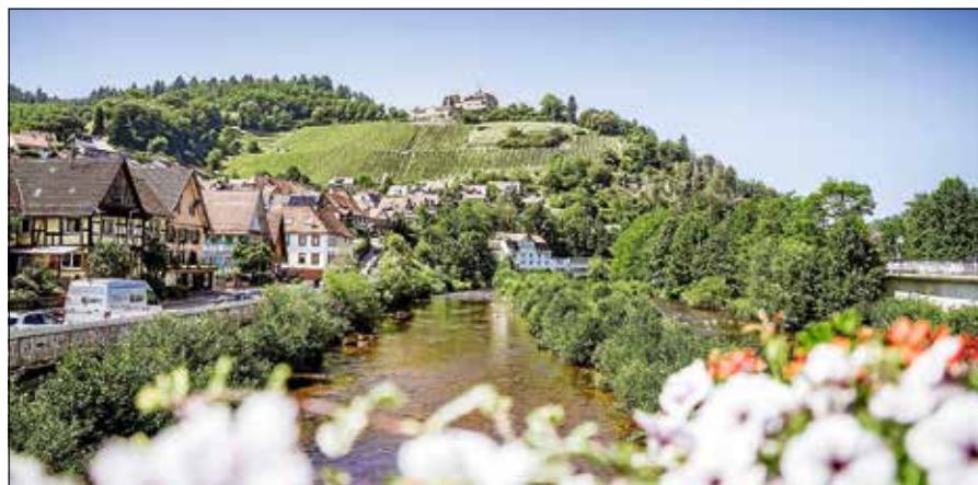
Blick auf Schloss Eberstein von der neuen Gernsbacher Runde.

Nach dem Kunstweg führt die Strecke nun durch das Neubaugebiet von Hilpertsau und weiter über die reizvollen Streuobstwiesen in Richtung Obertsrot. Dabei bieten sich beeindruckende Ausblicke auf die Ortsteile Hilpertsau und Obertsrot sowie auf Schloss Eberstein. Entlang historischer Trockenmauern verläuft der Weg zeitweise parallel zum Premiumwanderweg Murgleiter, bevor er schließlich die S-Bahn-Haltestelle Obertsrot erreicht. Zurück an der Murg besteht hier in Obertsrot die Möglichkeit, nach etwa 22 Kilometern eine Halbzeit zu machen und vom S-Bahnhof in Obertsrot mit der Stadtbahn weiter-