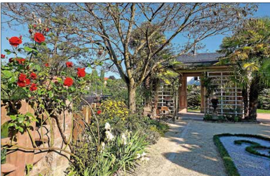
Eine Führung bietet spannende Einblicke in den Katz'schen Garten.

Treffpunkt ist am Pavillon im Katz'schen Garten, Bleichstraße 9. Um Anmeldung bei der Touristinfo Gernsbach unter 07224 644 446 oder touristinfo@gernsbach.de wird gebeten. ■