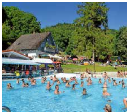
Schwimmbadfest Lautenbach

Die Teilnahme ist ab 8 Jahren und setzt eine gute Schwimmfähigkeit voraus. Wer hat, bitte eigene Flossen mitbringen. Die Schwimmbadinitiative Lautenbach freut sich auf ein tolles Jubiläumsfest, viele Gäste und geselliges Beisammensein.