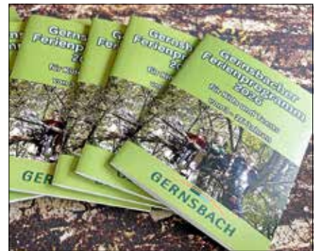
Die Programmbroschüre im Hosentaschenformat.

Hier geht's zu den Infos und zur Online-Anmeldung.