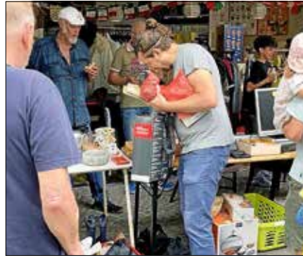
Großes Interesse beim 1. Hofflohmart 2024.

Anmeldung bis spätestens 5. Juni per E-Mail oder telefonisch mit folgenden Angaben: Name, Adresse, Telefonnummer und E-Mail. Kontakt: hallo@jolg.de, Tel.: 07224 9349907.