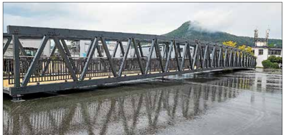
Der Steg verbindet die beiden Murgseiten.

Besonders hervorzuheben ist die konsequente Aluminium-Bauweise. Der Steg wurde vollständig aus der hochfesten Legierung gefertigt, was eine sehr gute