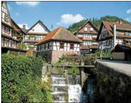
Der OGV Reichental lädt in die Kelter zum Feierabendhock ein.

Der OGV Reichental e.V. lädt zum Feierabendhock in die Kelter nach Reichental. Eingeladen sind alle, die am Freitag, den 19. Juni, auf eine kleine Stärkung vorbeikommen möchten. Die Hockete findet ab 18 Uhr in der Kelter in Reichental statt. Neben Wurstsalat gibt es Fleischkäse im Weck und Tomate-Mozzarella-Baguette. Neben den üblichen Getränken gibt es Süßmost aus eigener Produktion. Für die jüngeren Gäste gibt es zusätzlich eine Kreativ-Ecke. Der Verein freut sich auf viele Gäste.