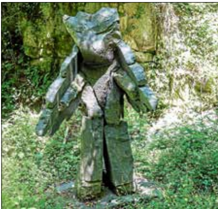
Henning Schwarz, THE KEEPER , 2018, Gabbro, Epoxidharz, Blei, 270 x 175 x 230 cm

Das rund drei Meter hohe, flügelartige Wesen aus Gabbro – einer Granitart, dem vorherrschenden Gestein im oberen Talbereich des Nordschwarzwald – entfaltet eine monumentale Präsenz,