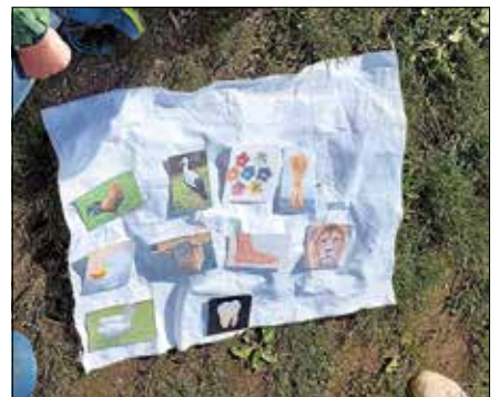
Wer kann aus den Bildern die Wiesenpflanzen zusammensetzen?

Höhepunkt war sicher eine Spinne mit einem Eierkochen oder ein glänzender Rosenkäfer. ■