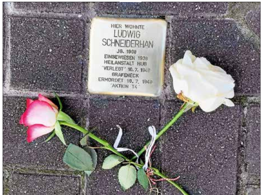
Stolperstein Ludwig Schneiderhan.

Der Treffpunkt für die kostenfreie Stadtführung ist um 14.30 Uhr am Salmenplatz/Touristinfo. Eine Anmeldung bei der Touristinfo Gernsbach unter 07224 644 446 oder touristinfo@gernsbach.de ist erforderlich. ■