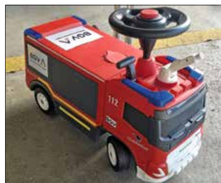
Neben dem Geldbetrag spendete die BGV auch ein Spielzeugfeuerwehrauto für die Jugendwehr.