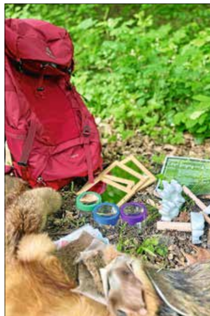
Der Entdeckerrucksack enthält spannende Materialien.

Reservierung: Interessierte können den Entdeckerrucksack mit Angabe des gewünschten Leihzeitraums per E-Mail an waldpaedagogik@landkreis-rastatt.de oder Telefon 07222 381-4440 reservieren. ■