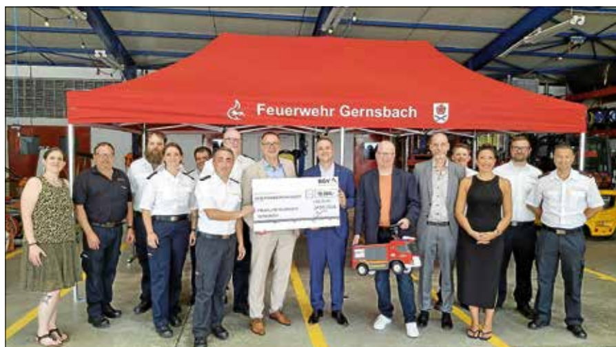
Spendenübergabe im Feuerwehrhaus mit Vertretenden der BGV, der Feuerwehrabteilungen und der Stadt Gernsbach unter dem neu angeschafften Faltpavillon.

Aktive Schadenverhütung beim BGV Im Rahmen der aktiven Schadenverhütung unterstützt der BGV verschiedene Projekte mit jährlich bis zu 750.000 Euro. Mit rund 400.000 Euro kommt ein Großteil davon den Freiwilligen Feuerwehren in Baden zugute. Wichtiger Teil der aktiven Schadenverhütung ist darüber hinaus die intensive Informations- und Aufklärungsarbeit. ■