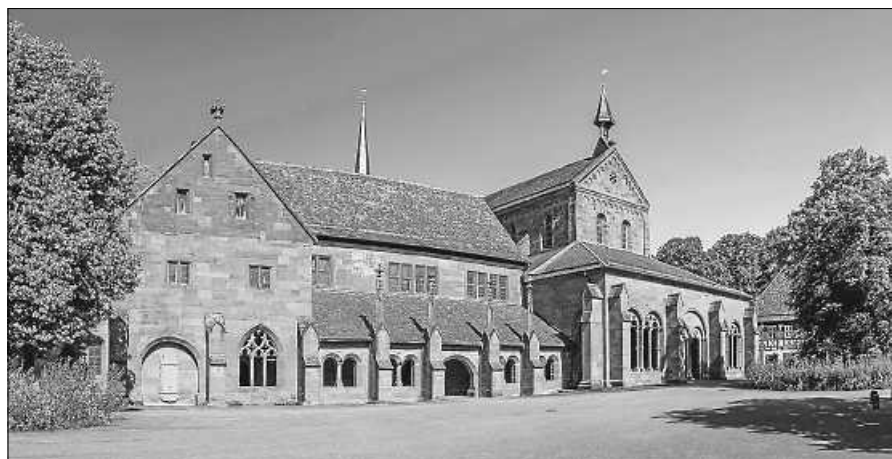
Das Kloster Maulbronn gehort zum Ausflugsprogramm des Handwerkervereins.

Nach langer coronabedingter Pause geht der Handwerkerverein Staufenberg wieder auf Tour. Am Dienstag, dem 3. Oktober 2023 (Tag der Deutschen Einheit), treffen wir uns um 8.00 Uhr beim ehemaligen Markthallenparkplatz. Die Fahrt fuhrt uns an diesem Tag mit dem Bus zum Kloster Maulbronn. Dort erwartet uns eine einstundige Fuhrung durch das Kloster. Danach werden wir unsere Weiterfahrt nach Marbach (Schillerstadt) fortsetzen. Hier haben wir ca. 2 Stunden Zeit zur freien Verfugung, um uns die sehenswerte