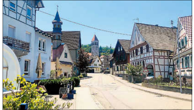
Tag des offenen Denkmals auch in Obertsrot.

Insgesamt sind in Deutschland über 5.000 historische Stätten jedes Jahr kostenfrei beim Tag des offenen Denkmals geöffnet. Der Arbeitskreis Stadtgeschichte beteiligt sich seit vielen Jahren an dieser bundesweiten Aktion. ■