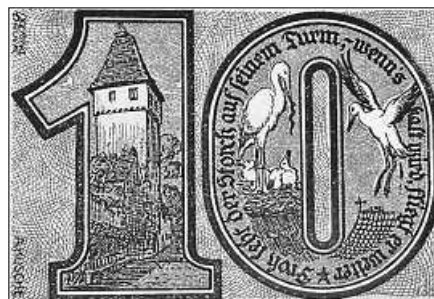
Der Storchenturm stand Pate für einen Geldschein im Jahr 1923.

In diesem Jahr beteiligt sich der Arbeitskreis Stadtgeschichte Gernsbach wieder beim Tag des offenen Denkmals. Am Sonntag, 10. September 2023, öffnet der Storchenturm Gernsbach wieder seine Tore nach der Sommerpause. Dabei lockt die Turmstube hoch über den Dächern der Stadt nicht nur mit einem herrlichem Rundblick auf die Schwarzwaldberge von Teufelsmühle bis Merkur. Darüber hinaus gibt's eine besondere Aktion zum Denkmaltag. In der Turmstube werden Geldscheine aus dem Jahr 1923 präsentiert. Vor genau 100 Jahren wurde während der Inflation ein 100-Milliarden-Mark-Schein von der Stadt Gernsbach gedruckt. Dabei diente der Storchenturm als Motiv für die Geldnote. Darauf findet sich der sinnige Spruch: „Froh steht der Storch auf seinem Turm, wenn's kalt wird, fliegt er weiter. Oh Mensch vertrau! Nach jedem Sturm wird's Wetter wieder heiter.“ Diese humorvollen Zeilen war Ausdruck der hoffnungslosen Aussichten in der Hyperinflation in den 1920er Jahren, die die Menschen damals in schwierige Situationen brachte. Weitere Geldscheine aus der Zeit zeigen ebenso kunstfertige wie phantasievolle Gestaltungen auf. Die Besucher können direkt im Storchenturm von 15 bis 17 Uhr einen exklusiven Blick auf die historische Raritäten werfen. Die Leihgabe aus dem Stadtarchiv Gernsbach macht dies möglich.