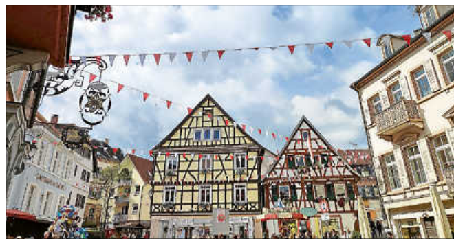
Im September lockt das Altstadtfest Gernsbach mit tollen Angeboten.

Die bequemste Fahrt zum Gernsbacher Altstadtfest haben Sie mit der Stadtbahn. Damit die Gäste frei von Parkplatz- oder Promillesorgen anreisen können, nehmen Sie die S8, RE 40 oder RB 41 zum Fest. Der Eilzug RE 40 wird am Festwochenende während der Festzeiten auch in Gernsbach Mitte halten. Außerdem werden die Stadtbahnen S8 mit zusätzlichen Wa-