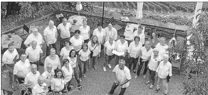
Chor mit Volldampf auf dem Weg zum Konzert „Street Party“.