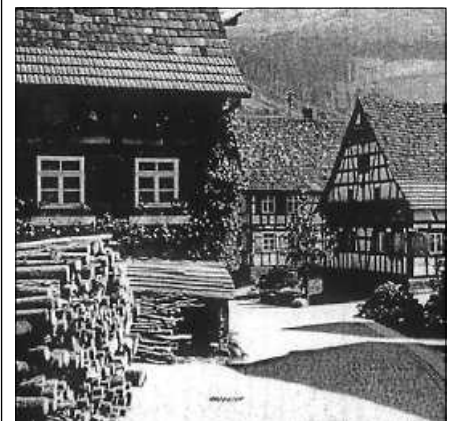
Kann man dieses Haus noch erkennen?

von 13.30 bis ca. 18.00 Uhr das Kirchl (St. Erhard-Kapelle) bewirten. Neben einer reichhaltigen Kuchenauswahl wird auch eine Kleinigkeit zum Vespere angeboten. Das Motto des Tages „Talent Monument“ wird inhaltlich bei einer Ortsbegehung von Hubert Götz aufgenommen, der in diesem Jahr eine vollkommen neue Strecke gewählt hat. Erster Hauptanlaufpunkt wird die katholische Kirche Obertsrot sein. Von dort führt der Weg auf den Friedhof, der auch einige Besonderheiten aufweisen kann. Weitere Stationen befinden sich im Oberdorf auf der Strecke Schwimmbad - Kirchl. Wer schon einmal bei einer der Führungen dabei war, kann ahnen, dass Götz wieder viele spannende Informationen zusammengetragen hat. Bei der Runde werden Originalschauplätze besucht und Gebäude sowie Menschen in den Mittelpunkt gerückt. Wann immer möglich werden alte Fotografien das Erzählte veranschaulichen. Hubert Götz hat den Nachmittag sorgfältig vorbereitet und wird in seiner lebendigen Vortragsweise einen kurzweiligen, ca. 2-stündigen Rundgang gestalten. Beginn ist um 14.00 Uhr am Kirchl. Der Turnverein Obertsrot freut sich über zahlreiche Besucher.