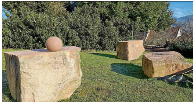
Sonnenuhren bei der Liebfrauenkirche.

Friedhof. Eine Anmeldung zur kostenfreien Tour ist unter touristinfo@gernsbach.de oder 07224 644 446 erforderlich. ■