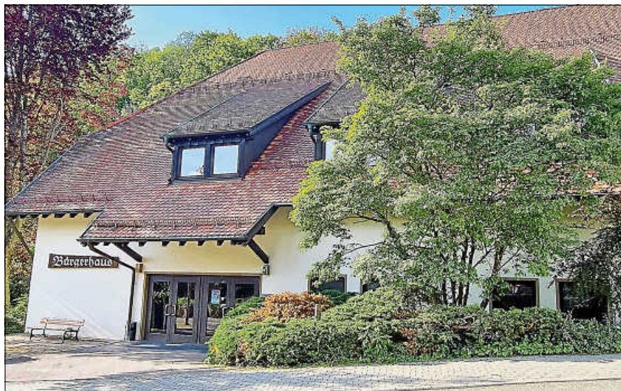
Das Bürgergespräch in Lautenbach findet im Bürgerhaus statt.

Der Auftakt fand in der Kernstadt im Gasthaus Brüderlin statt, die letzte Veranstaltung in dieser Reihe steht in der Gernsbacher Nordstadt an. Sie findet am Dienstag, 26. September, um 18 Uhr im Restaurant Michelangelo statt. ■