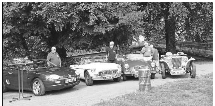
Fahrzeuge und Fahrer von eFUELS.

kurze und lange Strecken über kleine, versteckte Straßen. Trockenem Wetter, im Schlosspark wurde geparkt, ein Picknick war aufgebaut. Wer wollte, konnte das Kleinod hoch über der Enz mit einer kompetenten Führerin erkunden. Zwei Übungen waren auf dem Weg zum und vom Schloss zu absolvieren. Zehn Gegenstände aus dem Schwarzwald mussten sich die Teams merken und nach einer Ablenkung wiedergeben. Die besten Teams haben acht geschafft. Damit auch der Fahrer ein wenig gefordert war, sollte er einfach 50 Zoll vorwärtsfahren. Engländer wissen: 50 Zoll sind 127 cm, einer traf die genau. Auf dem Rückweg machten einige noch einen Zwischenstopp im Fahrzeugmuseum Marxzell. Abends beim Galabuffet im Festzelt wurde über