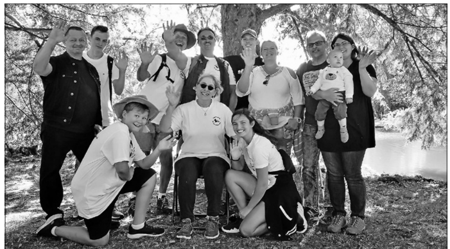
TKD SC Gernsbach.

Die letzten sportlichen Veranstaltungen der Freiluftsaison lockten am vergangenen Wochenende zahlreiche TCG-Mitglieder auf die Anlage. Der strahlende