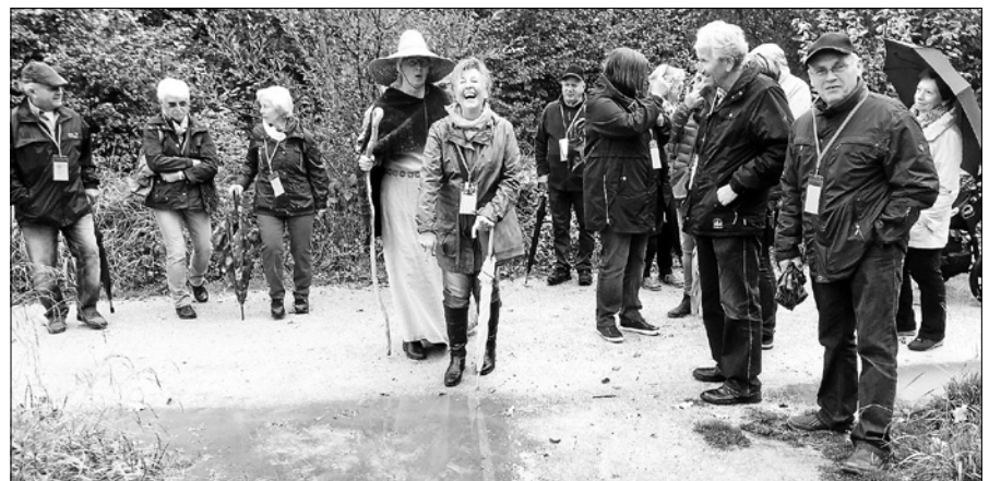
Stimmungsvoll wie hier im Campus Galli ist es meist beim Ausflug des Handwerkervereins.

Am 23. November findet der Reichentaler Adventsmarkt in der Turnhalle