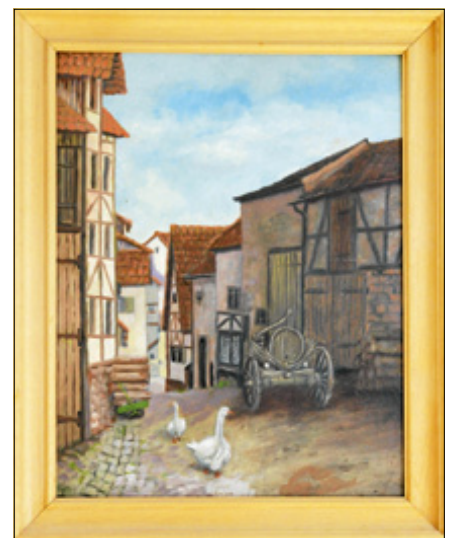
Die Ebersteingasse in einem Gemälde von Franz Siegwart um 1947.

Gänsen festhält, schmückt nun den Benutzerraum des Stadtarchivs. ■