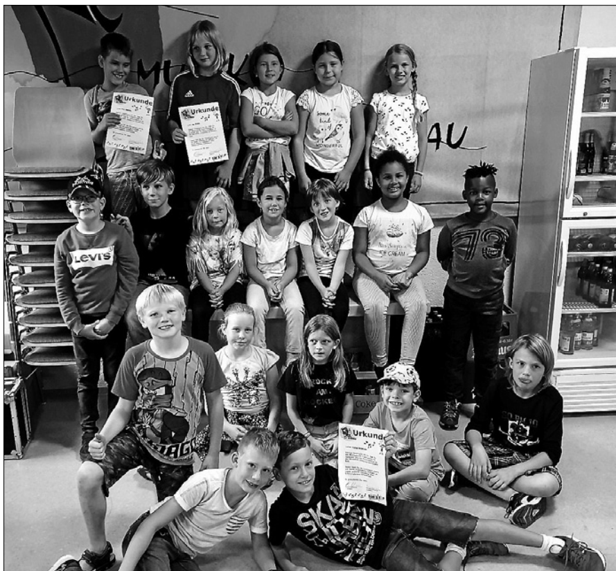
Spielenachmittag der Blockflötenkinder.

Schon seit einigen Jahren hat es sich bewährt das neue Ausbildungsjahr für die Blockflötenkinder des Musikvereins Hilpertsau mit einem Spielenachmittag zu beginnen. So fand auch in diesem Jahr für die Blockflötenkinder ein unterhaltsamer Nachmittag mit Gesellschaftsspielen, Getränken, Keksen und Obst statt. Die Organisatoren haben dafür wieder eine Vielzahl von Spielen herbeigeschafft, so dass sich schnell kleine Gruppen zusammen fanden, die sich aufgeregt um einen Tisch versammelten um sich in ein Spiel zu vertiefen. Das war dann eine gelungene Abwechslung zum Schulalltag, der die Kinder ja wieder eingeholt hat. Auch