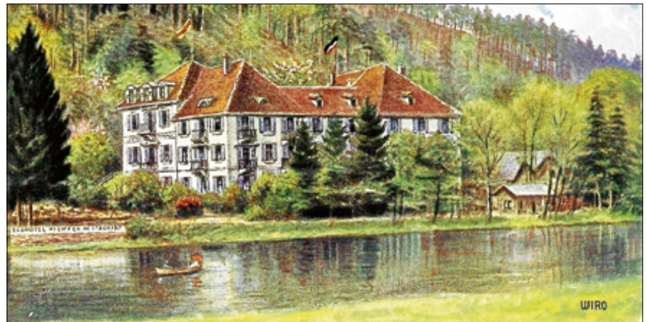
Das Badhotel Pfeiffer versprach, „selbst dem verwöhntesten Geschmack gerecht zu werden“.

Der Eintritt zu dem mit Bildern unterlegten Vortrag kostet 10 €, Tickets gibt es bei der Touristinfo Gernsbach und an der Abendkasse. ■