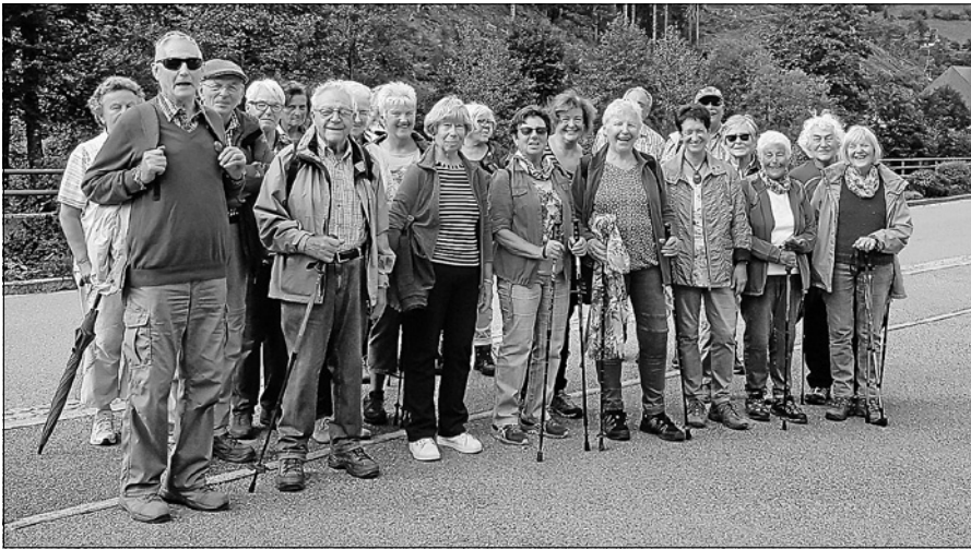
Die Dienstagswanderer auf dem Weg nach Schönmünzach.