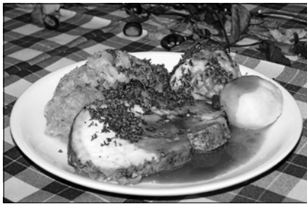
Gaumenfreuden und mehr ...

und Oktoberfesten ab. Festeröffnung ist am Sonntag, 6. Oktober, um 11.30 Uhr. Diverse Knödelvariationen, vegetarisch nur mit Sauerkraut oder traditionell mit Schweinerollbraten, mit leckerem Wildschweingulasch aus heimischen Wäldern oder als süße Variante, erwarten die Gäste zum Frühschoppen und Mittagstisch. Die Brat- und Currywurst (ab 16 Uhr) sowie weitere leckere Gaumenfreuden dürfen nicht fehlen. Ab 11.30 Uhr wird das Fest musikalisch begleitet vom Musikverein Freiolsheim. Ab 13.30 Uhr stehen die Musiker aus Kuppenheim bei uns auf dem Programm. Natürlich lädt ein reichhaltiges Torten- und Kuchenangebot ein, diese süßen Verführer bei einer Tasse Kaffee zu genießen. Für das leibliche Wohl ist also reichlich gesorgt. Musikalisch geht es dann um 15.30 Uhr mit unseren Musiker-Freunden aus Blankenloch weiter, die schon in den vergangenen Jahren mit ihrem Auftritt begeistern konnten. Dem berühmten Werbeslogan nachempfunden, laden wir ein unter dem Motto: „Heute bleibt die Küche aus, wir geh'n zum Knödelfest in 's Bürgerhaus“. Bringen Sie Ihre Familie und Freunde mit und feiern Sie mit uns dieses kleine, aber feine kulinarische Fest.