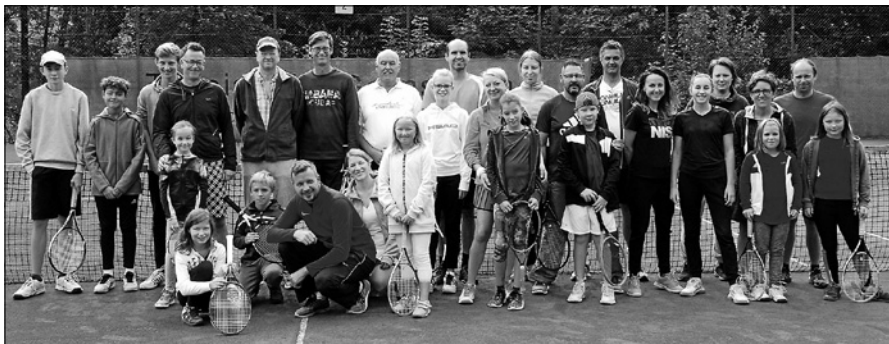
Teilnehmer des ersten TCG-Eltern-Kind-Turniers.