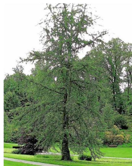
Im Kurpark gibt es über 80 besondere Bäume, die Gisela Plätzer vorstellt.

Treffpunkt ist der Parkplatz am vorderen Kurparkeingang. ■