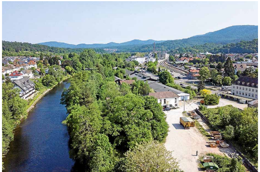
Das Pfeleiderer-Areal entlang der Murg.