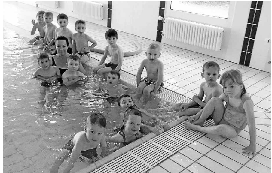
Viel Spaß haben die Kinder beim Schwimmkurs des Sportvereins Staufenberg.

Am Freitag, 8. Juni, um 18 Uhr findet die Jugendversammlung des SVS im Gasthaus "Sonne" Staufenberg statt.