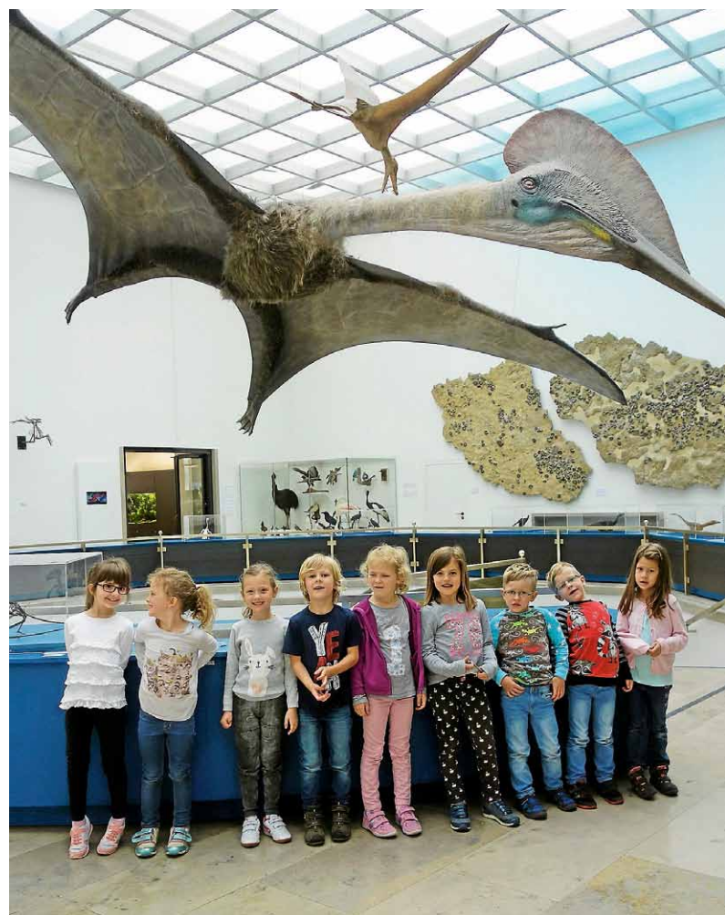
Der 6er Club im Naturkundemuseum.

Anschließend lud die Dauerausstellung zum Staunen und Entdecken ein: nachgebildete Dinosaurier, ausgestopfte Tiere, viele Schubladen mit Schmetterlingen und Käfern, aber auch der neu gestaltete Bereich mit schönen Terrarien und Aquarien. „Ein toller Ausflug“ war das einstimmige Urteil des 6er Clubs. ■