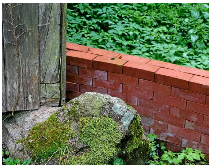
Manfred Emmenegger-Kanzler, Grundmauer 2017, mörtellos verlegte Ziegelsteine.

Die Tour dauert rund zwei Stunden und findet bei jedem Wetter statt. Der Treffpunkt um 11.30 Uhr ist am Beginn des Kunstweges an der Infotafel auf dem Parkplatz im Reichenbachtal hinter dem Gewerbegebiet. Anfahrt und Info unter www.kunstweg-am-reichenbach.de ■