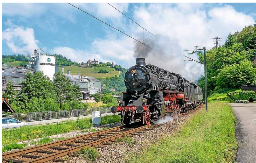
Der Dampfzug mit der badischen Personenzuglokomotive 751118.

Über Gernsbach Bahnhof (10.23 Uhr) erreicht der Zug Baiersbronn um 12.10 Uhr, rechtzeitig zu einem eventuellen Mittagessen oder für eine Weiterfahrt nach Freudenstadt mit der Stadtbahn. Die Rückfahrt von Baiersbronn nach Karlsruhe beginnt um 16.47 Uhr und erreicht Gernsbach um 18.12 Uhr. Es gelten die UEF-Dampfzugfahrkarten