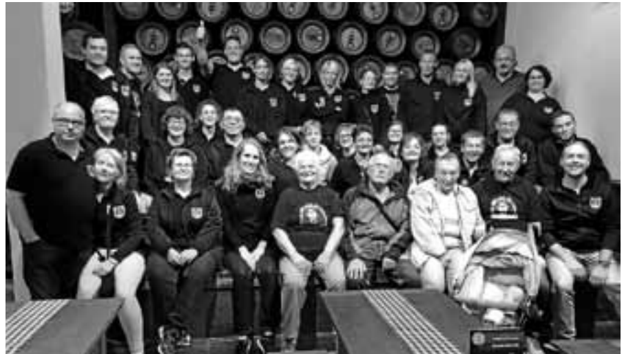
Die Obertsroter Schlossbergteufel zu Besuch in der Brauerei Alpirsbacher.