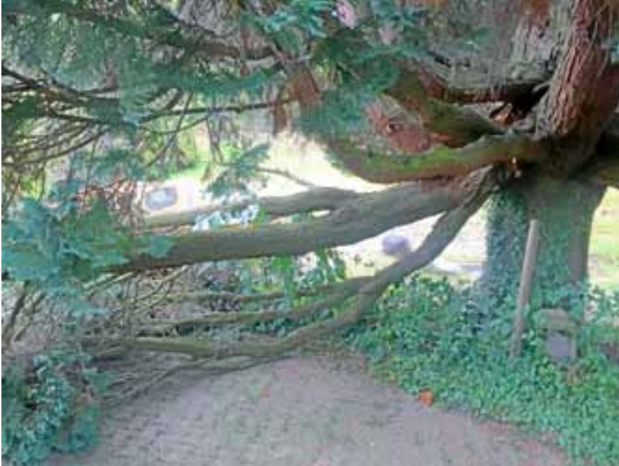
Um weitere Schäden abzuwenden, musste die aufgrund eines Sturmschadens umgeknickte Scheinzypresse auf dem Friedhof Hilpertsau gefällt werden.

ausgeprägte Zwiesel aufwies, die sich gegenseitig am Stamm abdrückten und der Ausbruch aus der Krone bei neuen Sturmböen zusätzliche Angriffspunkte bot, wurde der Baum in Absprache mit der Naturschutzbehörde des Landratsamtes Rastatt gefällt. Eine artenschutzrechtliche Prüfung wurde vor der Fällung vorgenommen.