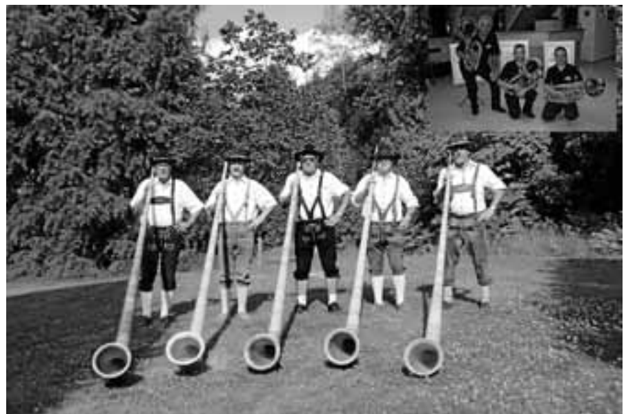
Die Alphornbläser und das Eichbaum-Trio freuen sich auf regen Besuch.