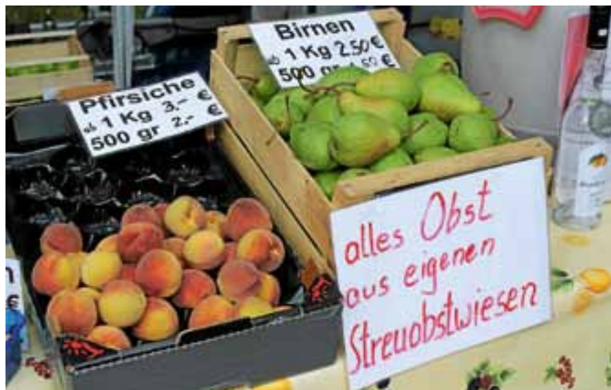
Eine große Vielfalt an regionalen Produkten erwartet die Besucher beim Naturpark-Markt am Sonntag auf dem Kaltenbronn.

Begleitet wird der Naturpark-Markt von attraktiven Programmpunkten. In der Dauerausstellung des Infozentrums mit seinen vielfältigen Exponaten rund um