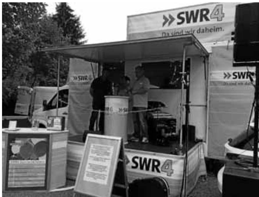
Das Projekt Dorfleben wurde beim SWR4-Sommererlebnis live vorgestellt.

Am vergangenen Freitag präsentierten sich die Staufenberger Vereine im Rahmen der Sommererlebnistour des