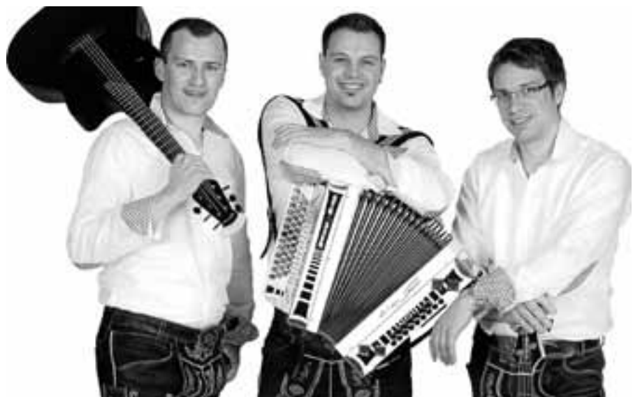
"Stadlsound" sorgen beim bayrischen Abend des FCA für zünftige Stimmung.

Am Wochenende von Freitag, 31. August bis Sonntag, 2. September, findet das Sportfest des FC Auerhahn Reichental statt. Der Verein bietet seinen Besuchern anlässlich seines 40-jährigen Jubiläums an allen Festtagen ein besonders abwechslungsreiches und buntes Unterhaltungsprogramm. Am Freitag werden beim Rockabend ab 20.30 Uhr