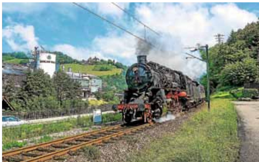
Der Dampfzug mit der badischen Personenzuglokomotive 751118 fährt am 2. September zum vorletzten Mal in diesem Jahr nach Baiersbronn.

Wegen der nötigen Aufarbeitung des Gepäckwagens ist eine Fahrradbeförderung 2018 leider nicht möglich. Ausführliche Informationen unter www.murgtal-dampfzug.de .