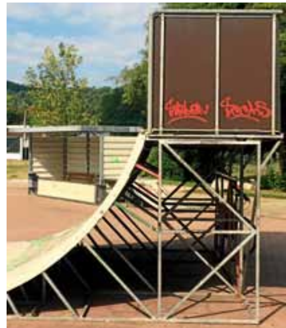
Der neue Unterstand mit den Sitzbänken am Skaterplatz in der Baccarat-Straße.