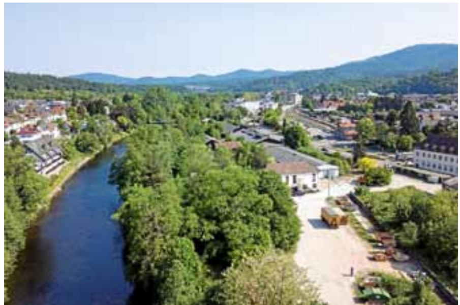
In die Sanierung und städtebauliche Nutzung des Pfeiderer-Areals ist wieder Bewegung gekommen.

„Dabei müssen wir ergebnisoffen bleiben und die Interessen der Gernsbacher Bürgerinnen und Bürger stets im Auge behalten,“ betont der Gernsbacher Bürgermeister und macht weiter deutlich, dass die Stadt eigene Forderungen an die Entwicklung des Geländes stellen wird: „Wir stimmen nicht um jeden Preis zu. Es muss eine belastbare Lösung