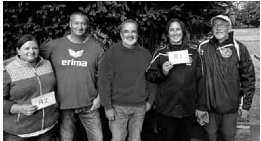
Die glücklichen Gewinner des 5. Boule-Turniers auf der Murginsel.

Die Gernsbacher Alphornbläser laden zusammen mit dem Eichbaum-Trio am