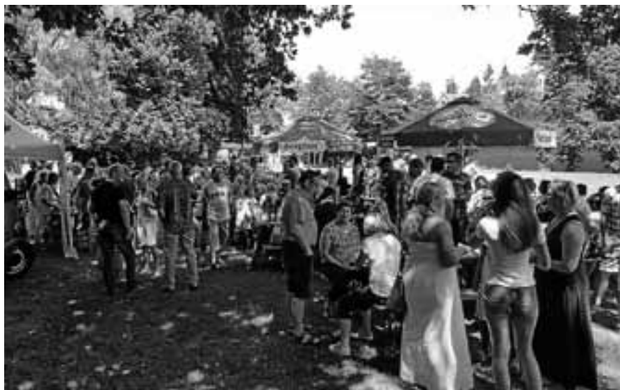
Die Freien Bürger veranstalten am Sonntag ein Grillfest auf der Murginsel.

Stadtgebiet ein paar schöne Stunden zu verbringen. Sie haben hier auch die Chance, mit ihren Gemeinderäten der Freien Bürger ins Gespräch zu kommen und kommunalpolitische Themen zu diskutieren. Umrahmt wird die Veranstaltung durch die Jazzcombo „2 plus 1“, die die Gäste musikalisch unterhält. Der Erlös der Veranstaltung wird für einen guten Zweck gespendet. Nachdem bei der Veranstaltung im vergangenen Jahr ein stolzer Betrag an die Sozialstation übergeben werden konnte, hoffen die Freien Bürger auf eine gleichfalls große Resonanz bei der Bevölkerung.