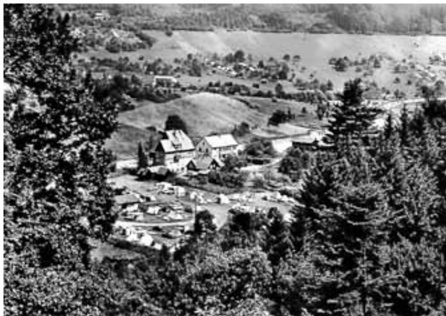
Bei genauem Hinsehen kann man erahnen, wo das Bild aufgenommen wurde. Was darauf zu sehen ist, erfahren die Teilnehmer der Ortsbegehung.

Überraschenderweise ließen sich bei intensiver Recherche interessante Bezüge finden. So dürfen die Besucher gespannt sein, was Obertsrot zum Beispiel mit Frankreich, Italien und sogar dem Orient zu tun hat. Es werden Originalschauplätze besucht, Gebäude, Menschen und Pflanzen in den Mittelpunkt gerückt.