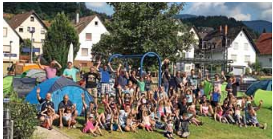
32 Väter mit ihren Kindern und den Erzieherinnen beim Väterzelten.

Nach dem Aufbau der Zelte wurde der Grill angeworfen, doch gerade als die ersten Kinder ihre Würstchen verspeist hatten, wurde Alarm bei der Feuerwehr ausgelöst. Ein angenommener Küchenbrand war Grund der Alarmübung, die bei den Kindern große Begeisterung, aber auch Angst auslöste. Einige große Kinder und Erwachsene wurden über das Dach gerettet und am Ende versammelten sich alle wohlbehalten am Sammelplatz. Die Rettungsübung zeigte für die Erzieherinnen und die Feuerwehr die eine oder an-