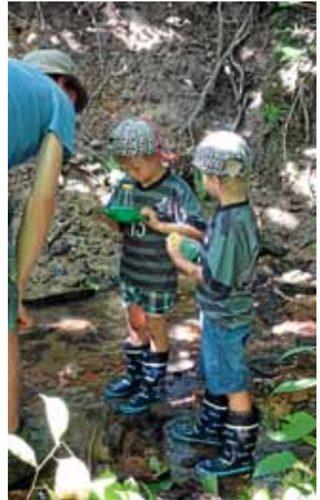
Die Kinder bei einer spannenden Exkursion am Hahnbach.