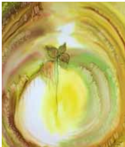
Die Malerin Andrea Weber stellt ihre Werke aus und lädt zur Vernissage ein.

Farbe und Textur auf Leinwand“ ist der Titel der Ausstellung, die seit dem 30. Juni in den Räumlichkeiten des MediClin Reha-Zentrums zu sehen ist. Andrea Weber stellt dort bis zum 7. Januar 2019 ihre Bilder aus. Die Vernissage findet am Samstag, 7. Juli, um 19 Uhr statt.