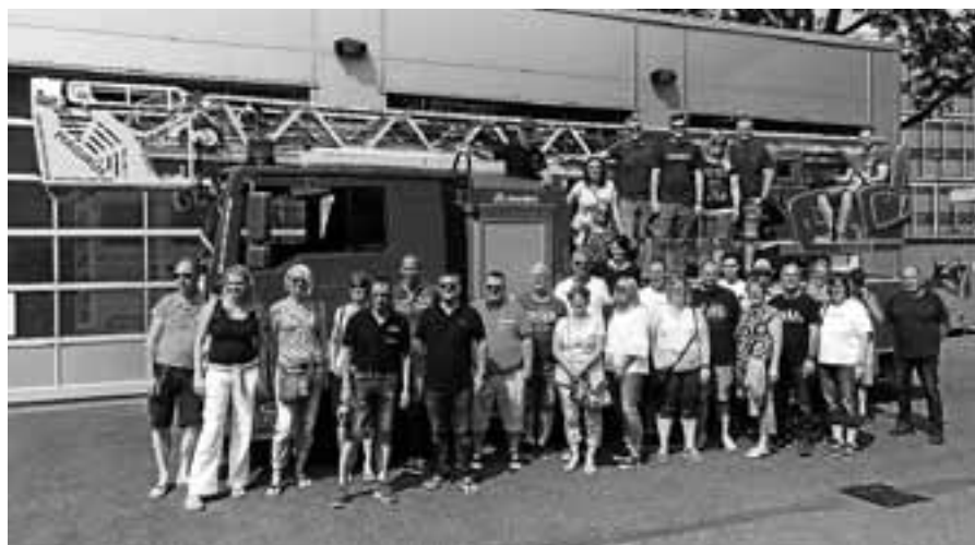
Freiwillige Feuerwehr Gernsbach Abt. Reichental bei der Berufsfeuerwehr Köln.

Am Freitag, 13. Juli, lädt der Musikverein Orgelfels Reichental um 19 Uhr zum Kurkonzert in den Kurpark in Gernsbach ein.