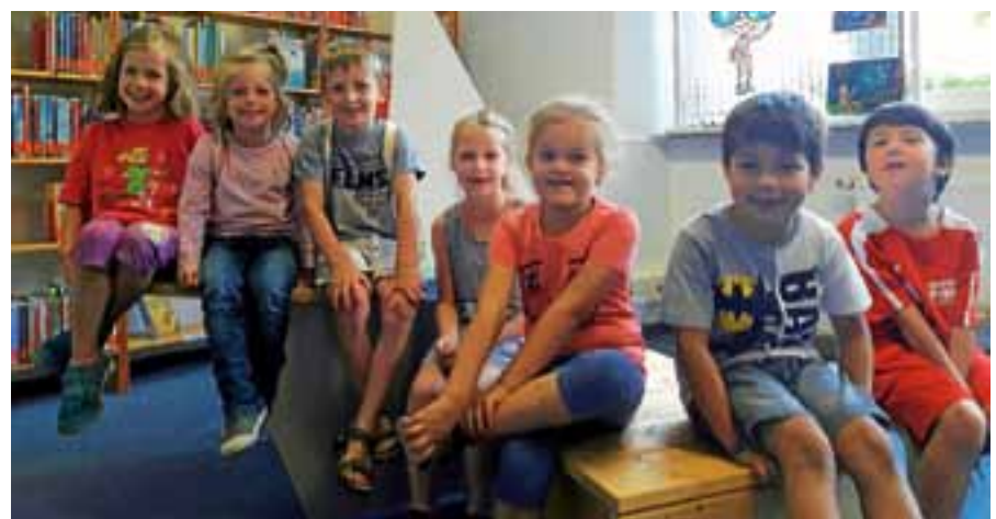
Die Scheuerner "bibfit"-Kinder erhielten zum Abschluss eine Urkunde.

„Was liest du uns heute vor?“, fragten die Kinder gleich zu Beginn des dritten Termins. Schließlich war das Vorlesen und Zuhören auch wichtiger Bestandteil der Treffen. Die Kinder erfuhren von Erdmännchen, die eine Wohnung suchten, von einem verschluckten Hund, der aus dem Buch herausgeschüttelt werden