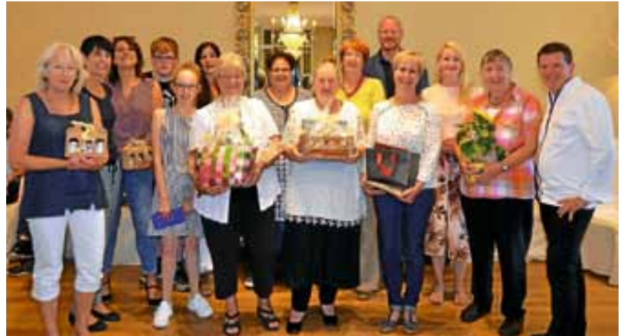
Strahlende Gesichter gab es bei der Preisverleihung des 7. Schleckselwettbewerbs. Gefragt waren diesmal Marmeladenkreationen mit Rhabarber.

Den ersten Preis und damit einen Kochkurs in der Kochschule von Bernd Werner, ein Fünf-Gänge-Menü im Restaurant auf Schloss Eberstein und ein handsigniertes Kochbuch gewan-