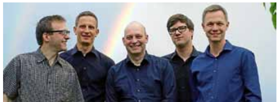
Jazz aus Zürich gibt es am 14. Juli im Obertsroter Kirchl mit dem Quintett Longline.

Gespielt werden vor allem Jazz-Standards, die mit Funk- und Latin-Elementen versehen werden. Nicht nur das vielseitige Repertoire, sondern auch die nicht alltägliche Kombination von Klavier und Vibraphon, die sich mal ergänzen und auch mal kontern, sorgt für ein