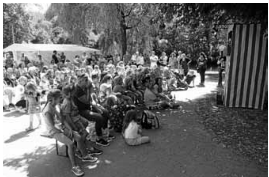
Beim Fest der Naturfreunde spielte das Puppentheater Gugelhupf ein Kasperstück.

Einen gelungenen Einstand konnte die neu benannte Ortsgruppe der Naturfreunde Gaggenau-Gernsbach für sich verbuchen. Bei schönstem Sommerwetter fand am 23. Juni ein Familienfest mit zahlreichen, gelungenen Aktionen für Kinder und Erwachsene statt. So wurden zum Beispiel fleißig Blumen gebastelt, Steine bemalt, das Murgwasser untersucht, die Tiere des Waldes vorgestellt und Insektenhotels gebaut. Das Kanufahren auf der Murg war besonders gefragt und es bildeten sich lange Warteschlangen. Die Kinder-Volkstanz-