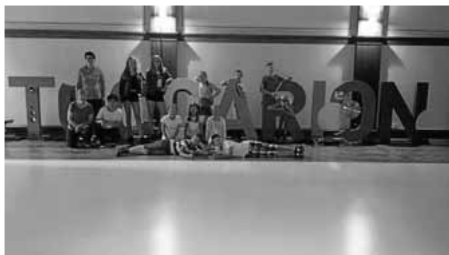
Ausflug ins Toccarion der Jungmusiker des MV Orgelfels Reichental.

Am Sonntag ab 11 Uhr steht der Family-Day unter dem Motto „Spaß, Sport und