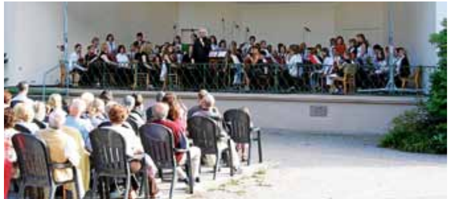
Das Ensemble hat wieder ein ansprechendes Programm einstudiert.

Der schwungvolle Walzer „España“, Tangos und die temperamentvollen la-