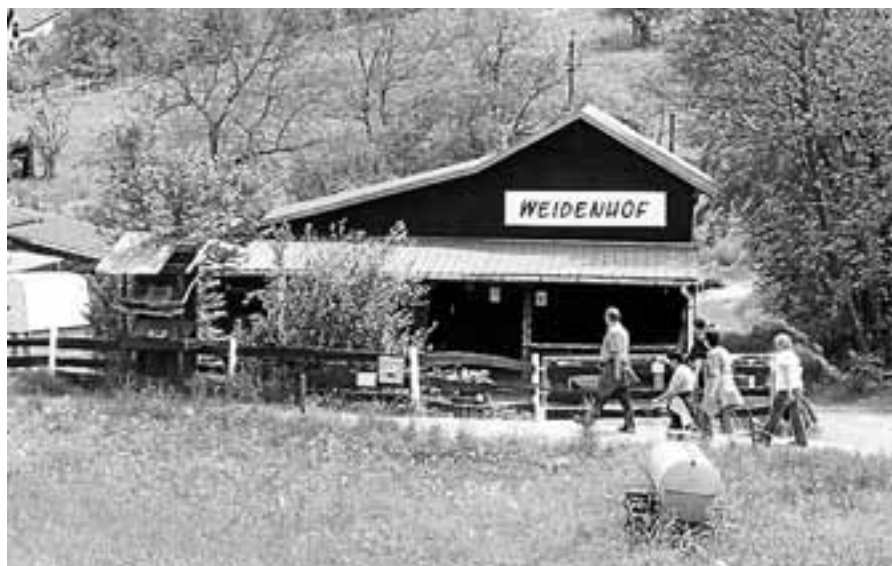
Der Weidenhof öffnet die Türen für alle interessierten Besucher.

Der Verein "Pferde bewegen Menschen" veranstaltet am Samstag, 14. Juli, von 12 bis 18 Uhr wieder einen Tag der offenen