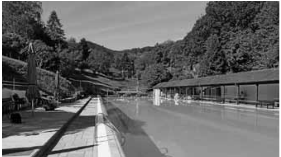
Das Schwimmbad Obertsrot lädt wieder zum Baden ein.