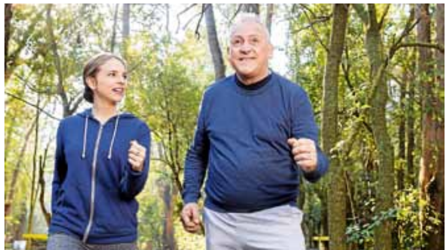
Bei der Initiative „Die bewegte Stadt“ sind alle eingeladen, mitzumachen.

Weitere Veranstaltungsorte werden im September Gaggenau und Rheinstetten sein. Die Gemeinde mit der höchsten Teilnehmerzahl im Verhältnis zur Einwohnerzahl wird am Ende zur bewegtesten Gemeinde Mittelbadens gekürt und ausgezeichnet. Weitere Informationen unter www.die-bewegte-stadt.de