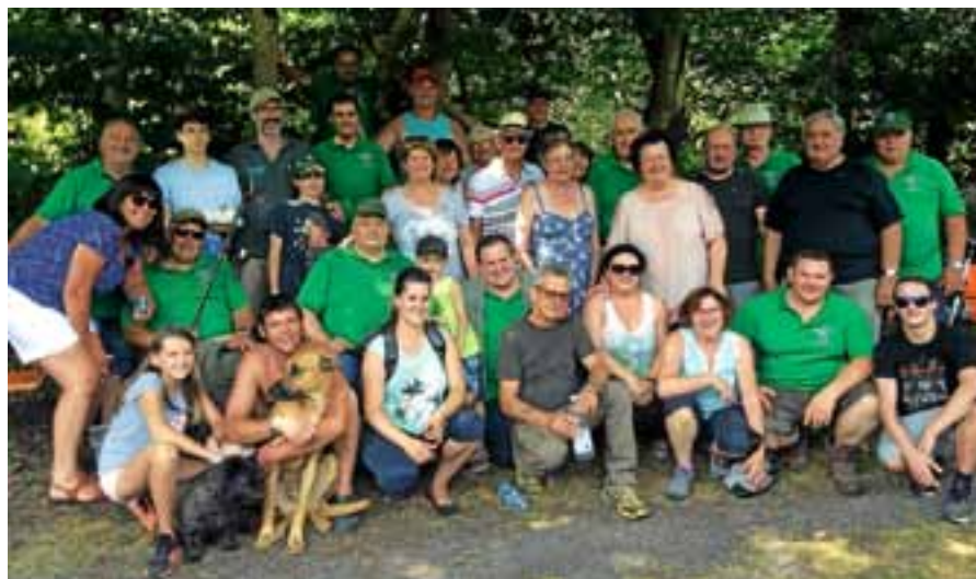
Die Angelfreunde beim bereits 45. Treffen im Rahmen der Städtepartnerschaft.

Nach dem Mittagessen, das wie jedes Jahr von der Frau des Präsidenten, Maja Mar-