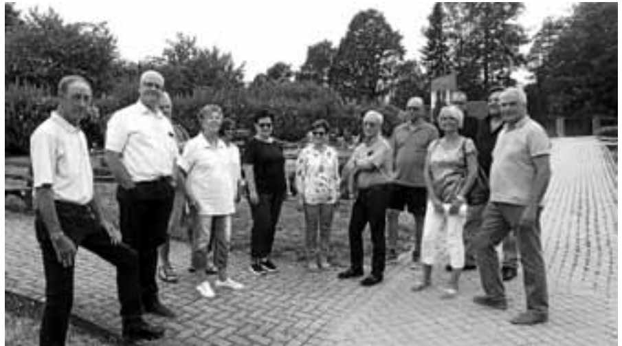
Die Freien Bürger diskutierten mit Bürgern über die Friedhofsgestaltung.