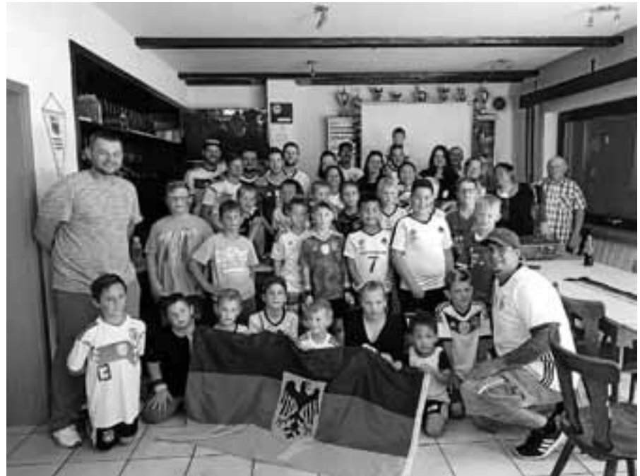
Der FCG-Nachwuchs schaute das dritte Gruppenspiel der DFB-Elf im Clubhaus an.