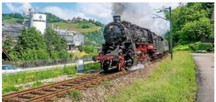
Der historische Dampfzug während der Fahrt durch Hilpertsau.

Wegen der nötigen Aufarbeitung des Gepäckwagens ist eine Fahrradbeförderung 2018 leider nicht möglich. Ausführliche Informationen unter www.murgtal-dampfzug.de