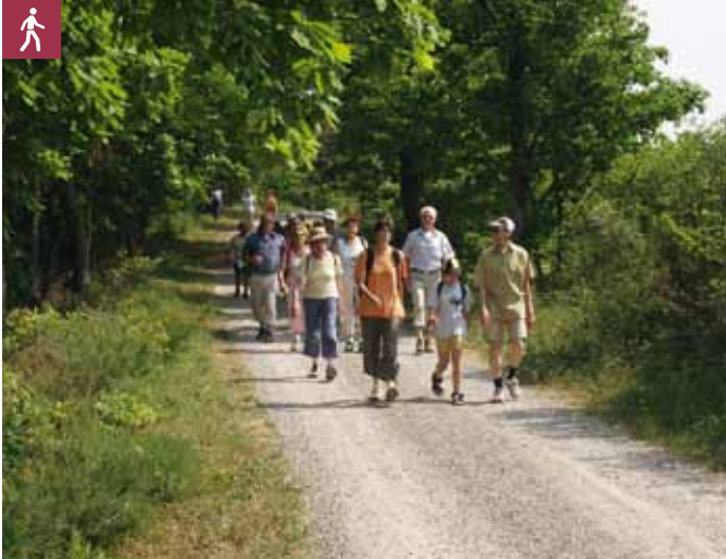
Wanderer Gernsbacher Runde

Rundtour zum Merkur, auch Großer Staufenberg genannt. Mit atemberaubender Aussicht auf die umgebenden Täler und Schwarzwaldhöhen, die für die Anstrengungen des Aufstiegs belohnt.