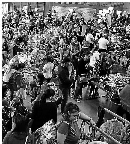
Großer Andrang beim KidsBazar.

Am Samstag, 2. Februar, öffnet der KidsBazar des Treffpunkt Staufenberg zwischen 10.30 und 13 Uhr wieder seine Pforten. Schwangere und Mitglieder des Vereins dürfen bereits ab 10 Uhr durch das reichhaltige Angebot stöbern. Bei diesem KidsBazar finden Sie alles, was für die kommende Frühlings- und Sommersaison gebraucht wird. Alle Sachen sind nach Größen und Geschlecht sortiert, so dass Sie zielgerichtet einen