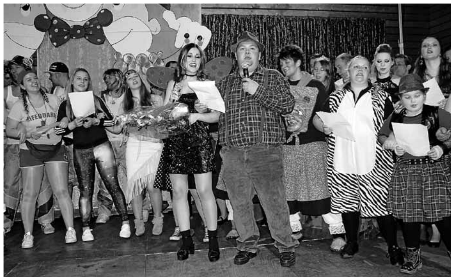
Die Sitzungen in Reichental sind in diesem Jahr am Freitag und Samstag.