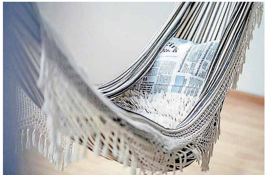
Entspannungstechniken zeigen Wege zur Ruhefindung.

Inhaltlich befasst sich das Seminar mit Fragen und Hilfestellungen rund um das Thema "Sucht" und zeigt Entspannungstechniken und Möglichkeiten zur Stressbewältigung auf. ■