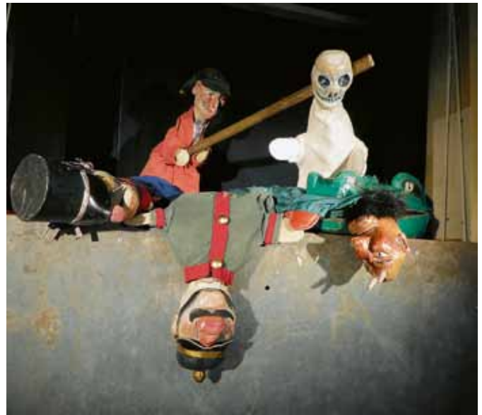
„Kasperblues“ - Puppentheater für Erwachsene.

In vielen Kasper-Inszenierungen des Gernsbacher Puppentheaters Gugelhupf mischt sich der ruppige Sound der Blues-Harp (Mundharmonika) mit dem treibenden Beat des Handpuppenspiels. Es liegt nun nahe, diese zwei Elemente noch dichter nebeneinanderzustellen.