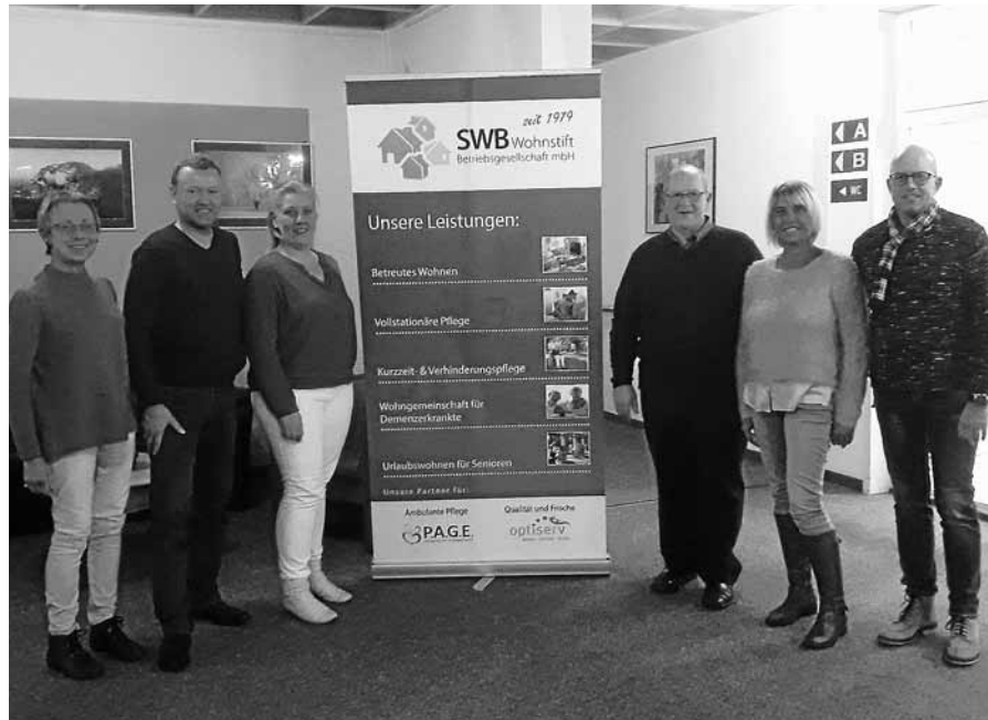
Die Freien Bürger unterstützen die Pflegeeinrichtung.