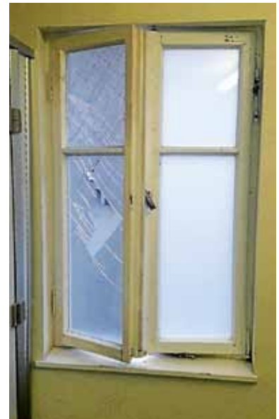
Die Fensterscheibe in der WC-Anlage am Färbertorplatz wurde gewaltsam beschädigt.

Vandalismus ist kein Kavaliersdelikt. Die Schadensbehebung löst hohe Kosten für die Allgemeinheit aus. Die Stadtverwaltung wird Strafanzeige erheben. Alle Bürgerinnen und Bürger werden ebenfalls gebeten, ein Augenmerk auf die Erhaltung öffentlicher Einrichtungen zu haben und gegebenenfalls Beobachtungen polizeilich zu melden. ■