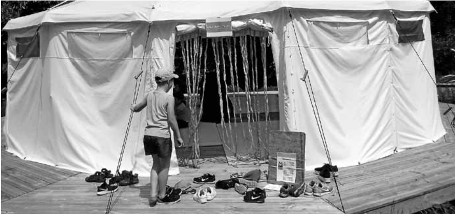
Gemeinsam spielen in unserer Jurte auf dem Weidenhof.