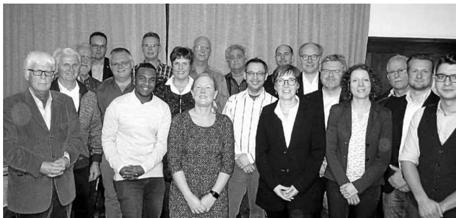
Amtierende Gemeinderäte, Vorstandsmitglieder des CDU-Stadtverbandes und Kandidatinnen und Kandidaten für die Kommunalwahl trafen sich zur Aufstellung der Liste.

Nachdem in den vergangenen Jahren alle Bäder in den Wohnungen saniert worden seien, sei für 2019 die Umwandlung des ehemaligen Schwimmbades in einen Therapiebereich sowie ein öffentlich zugängliches Café geplant. Gemeinderätin Gabi Kienzle bedankte sich bei Herrn Seidler und Frau Grosch: „Nach-