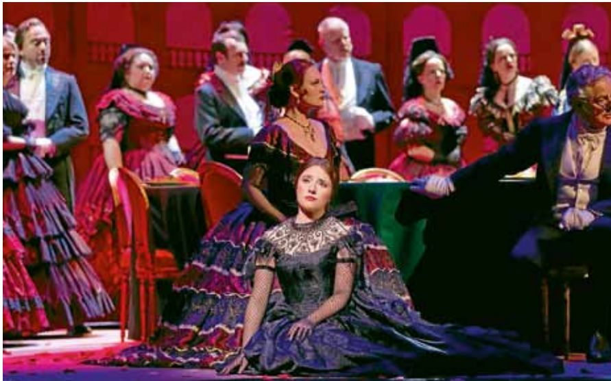
Ausschnitt aus der Oper „La Traviata“ von Giuseppe Verdi.