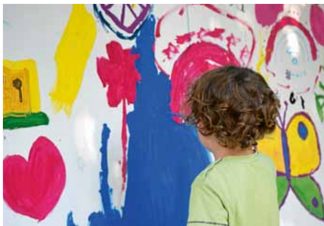
Die Förderung von Kindern kommt auch bei der Kindertagespflege nicht zu kurz.

Der Schwerpunkt liegt dabei hauptsächlich auf der Betreuung von Kindern unter drei Jahren. Gerade in diesem Bereich